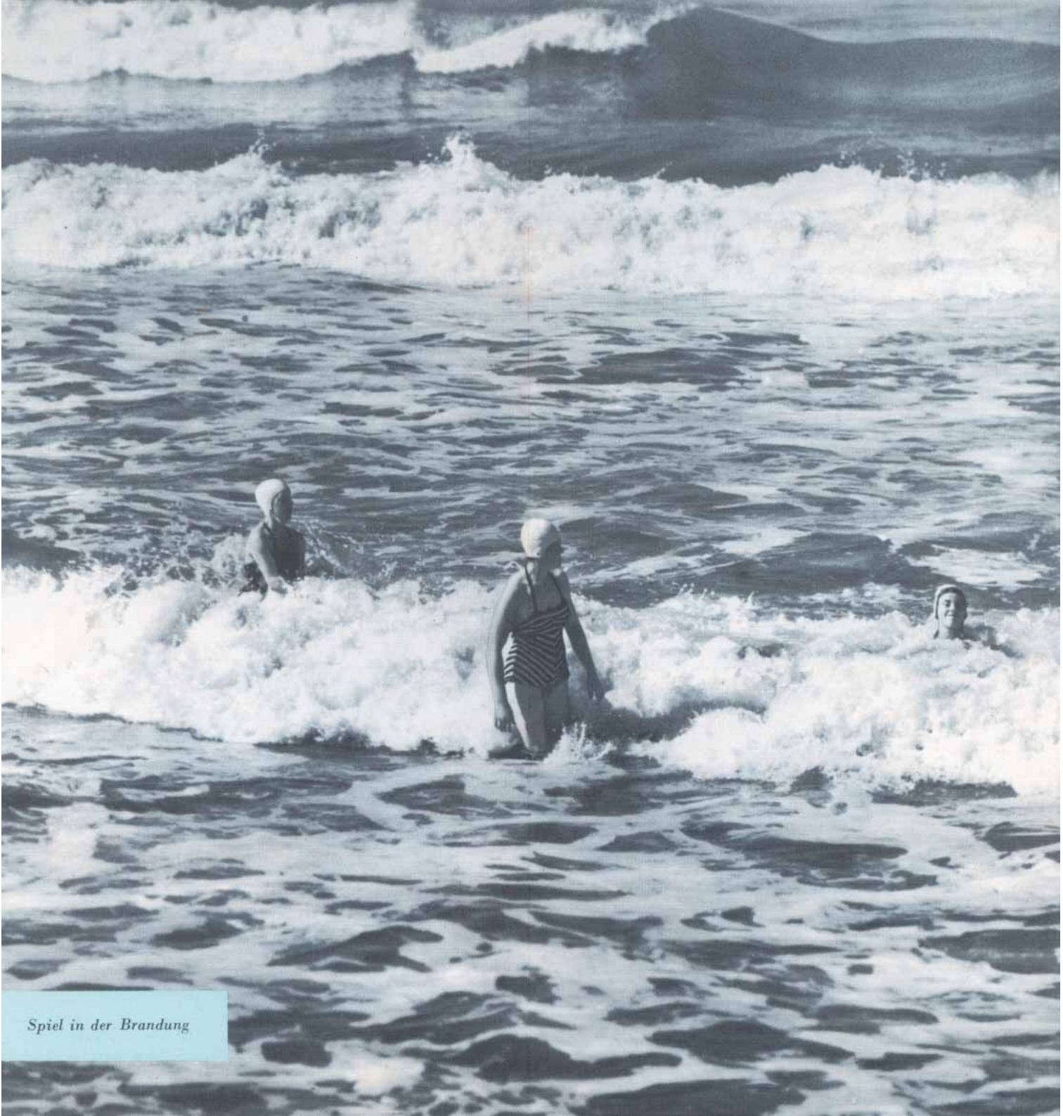
Spiel in der Brandung