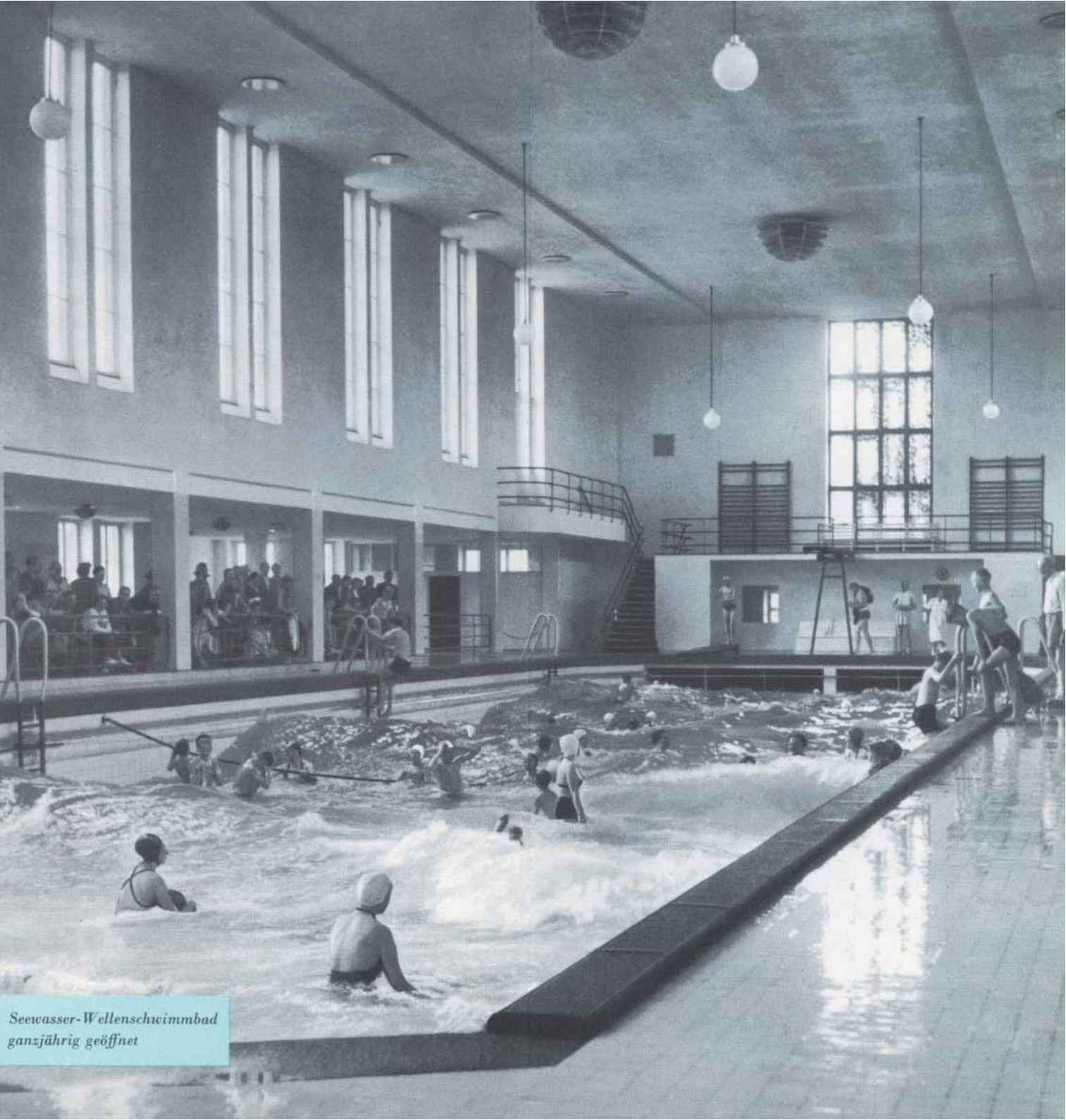
Seewasser-Wellenschwimmbad ganzjährig geöffnet