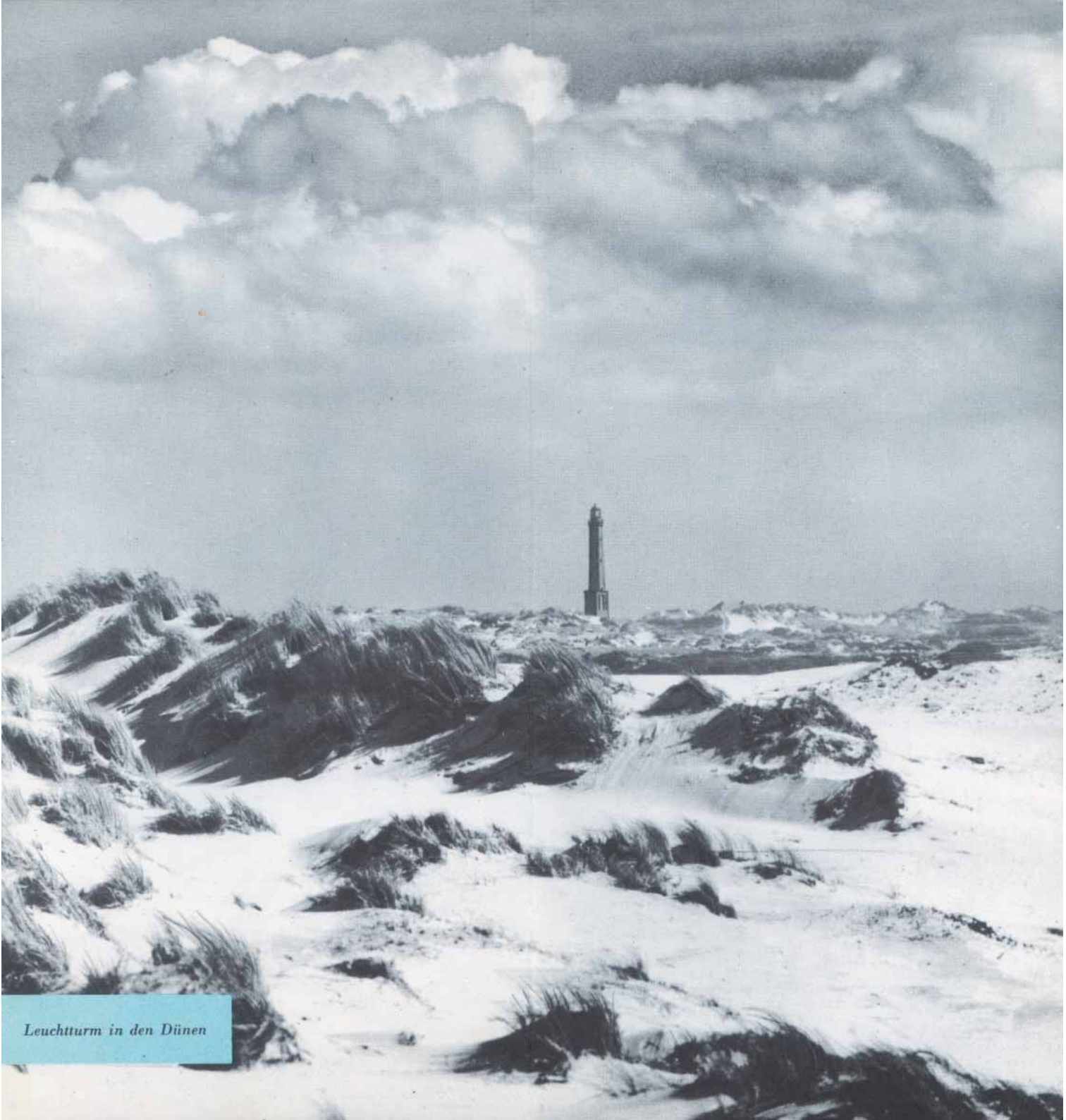
Leuchtturm in den Dünen