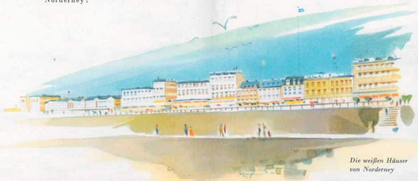
Die weißen Häuser von Norderney