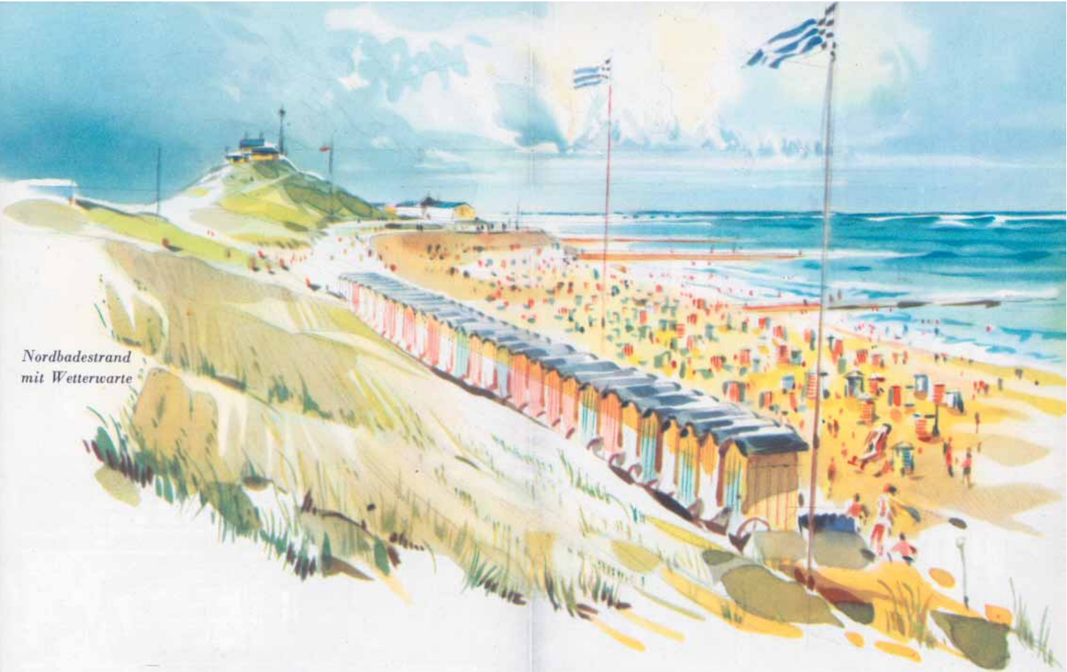
Nordbadestrand mit Wetterwarte