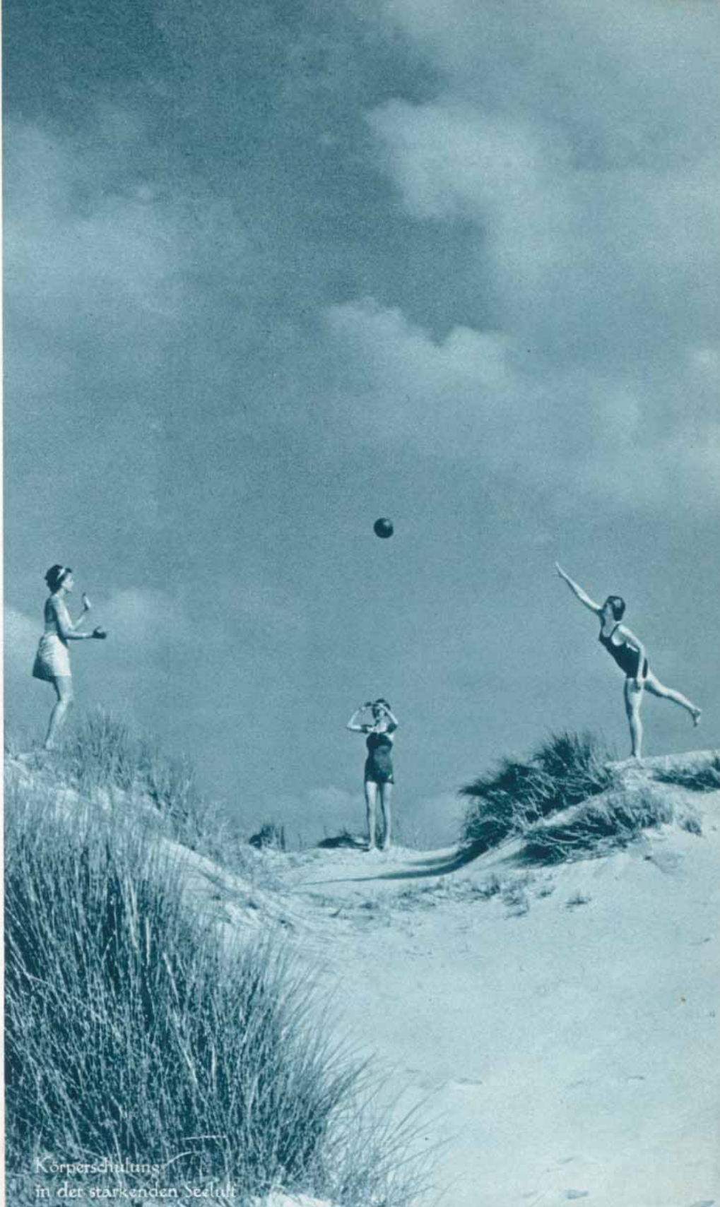
Körperschulung in der stärkenden Seeluft

Zu einem herrlichen Riesenspielplatz werden Meer, Strand und Dünen; ein Paradies für Kinder. Unerschöpflich sind die Möglichkeiten des Spiels mit Sand und Wasser. Mit Eimer, Spaten und anderen Hilfsmitteln wird gebaut und gebuddelt. Burgen, Kanäle, Staudämme, Häfen, Teiche und Wehren gegen die Flut entstehen. In kindlichem Betätigungsdrang beteiligen sich die Erwachsenen am Burgenbau oder am fröhlichen Ballspiel.