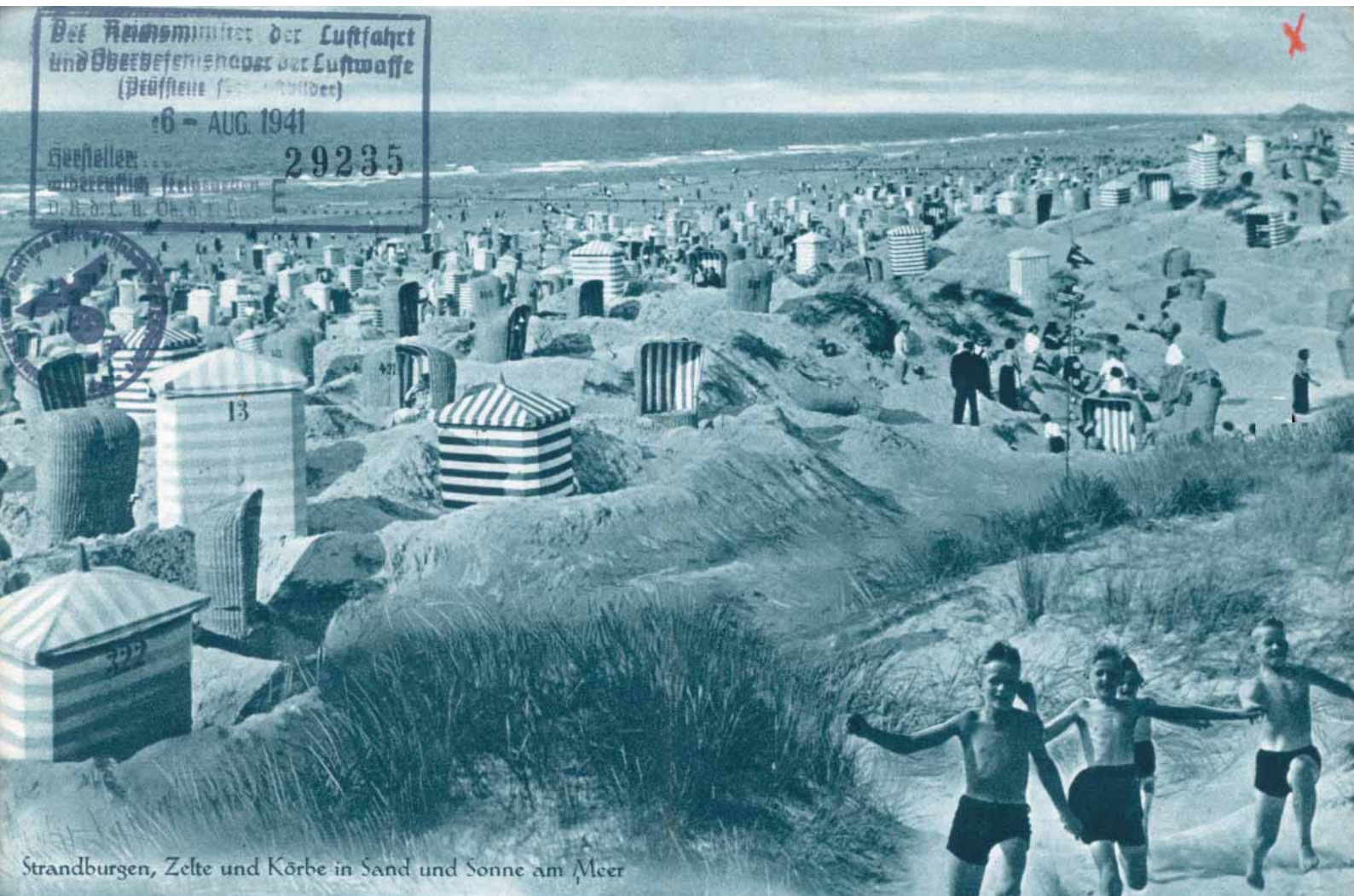
Strandburgen, Zelte und Körbe in Sand und Sonne am Meer