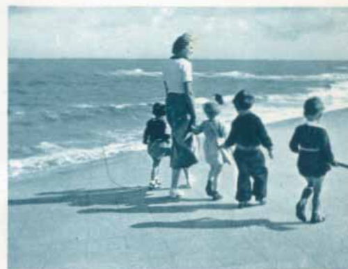
Spaziergang auf der Promenade am Meer