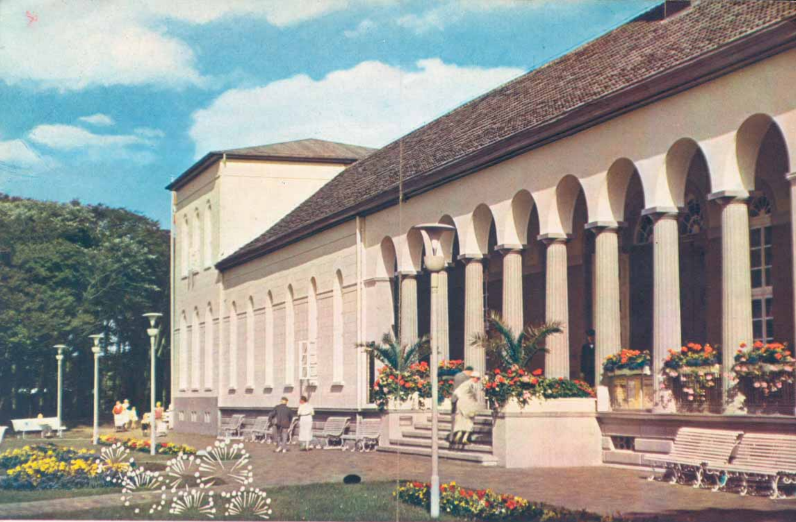
Haupteingang zum Staatlichen Kurhaus