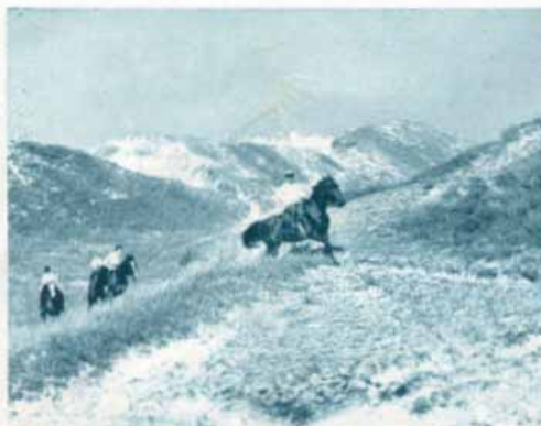
Ritt durch die Dünenlandschaft