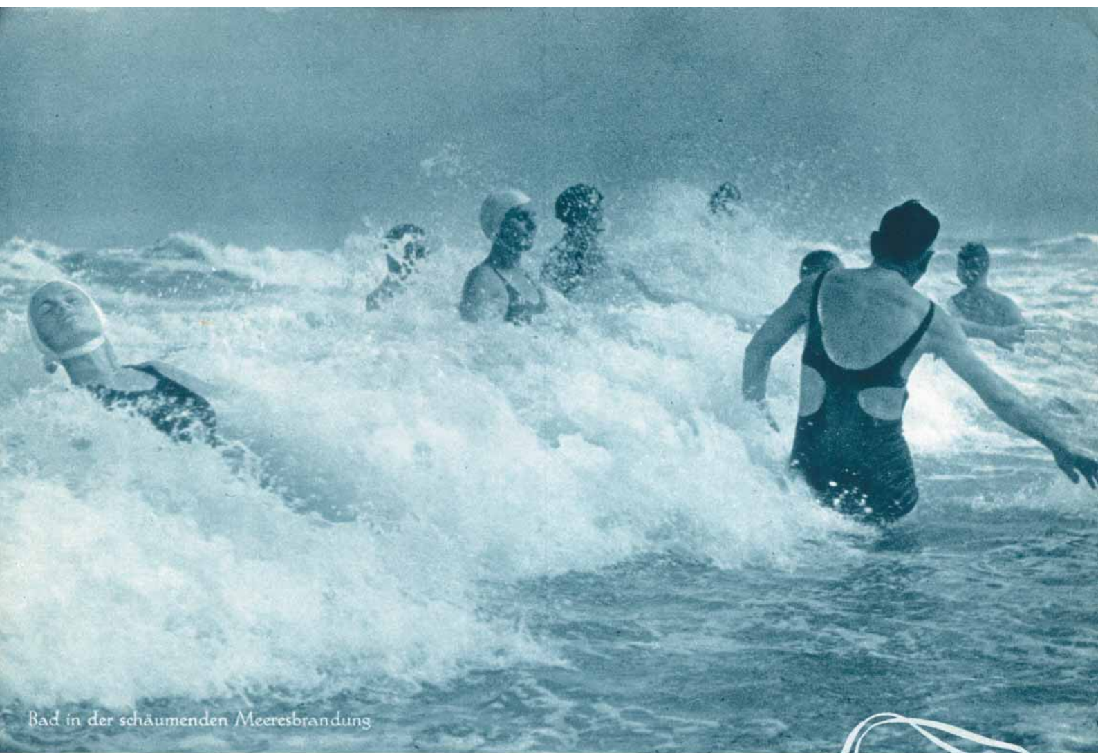
Bad in der schäumenden Meeresbrandung

Neben der Mannigfaltigkeit der landschaftlich herrlichen Spazierwege tritt Nordseebad Norderney durch die Großzügigkeit seiner Kurbetriebsanlagen hervor. Das Staatliche Kurhaus am Adolf-Hitler-Platz, vornehm und ruhig in seiner architektonischen Gestaltung und prachtvoll durch seine Innenräume liegt mit den Staatlichen Kurhotels, dem Warmbadehaus und dem Seewasser-Wellenschwimmbad, einem einzigartigen Hallenbad, inmitten der grünen Kurparkanlagen.