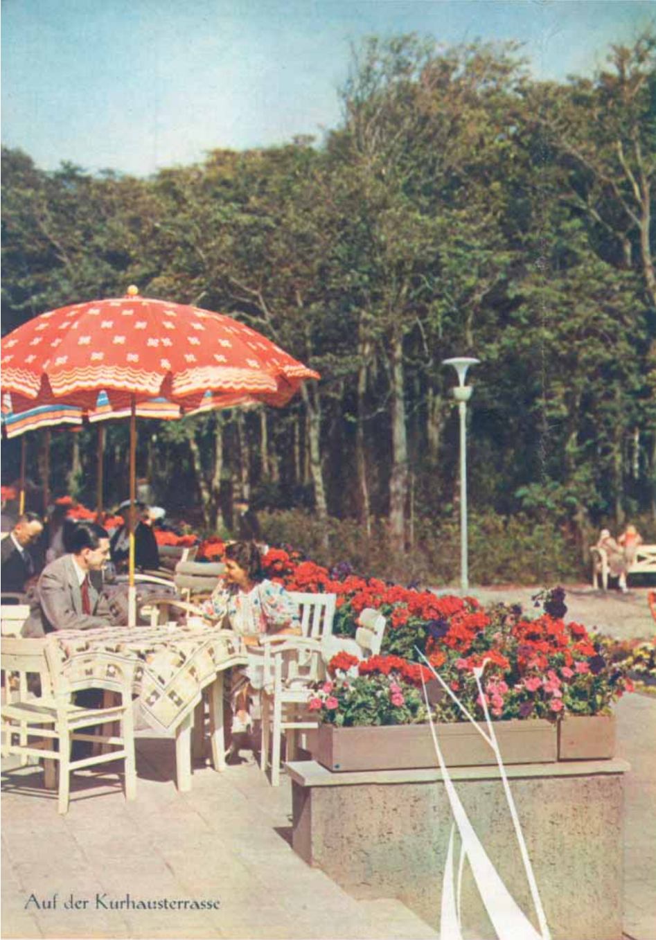
Auf der Kurhausterrasse

in wechselvoller Fülle in einem Seebad so, wie auf Norderney. Es bietet alle Freuden des Sports, Tennisplätze liegen unmittelbar an der Strandpromenade. Im Juli und August werden hier große Turniere veranstaltet. Ein in herrlicher Landschaft gelegener Dünen Golfplatz erinnert mit seinen natürlichen Hindernissen an die klassischen englischen Vorbilder. Ein Ereignis der Saison sind hier die großen Golfwettspiele. Beliebt sind die täglichen Stunden der Körperschulung am Vormittag unter Leitung eines Sportlehrers der Kurverwaltung. Ein Erlebnis ist immer wieder ein Ritt durch die Einsamkeit des Strandes und der Dünenlandschaft.