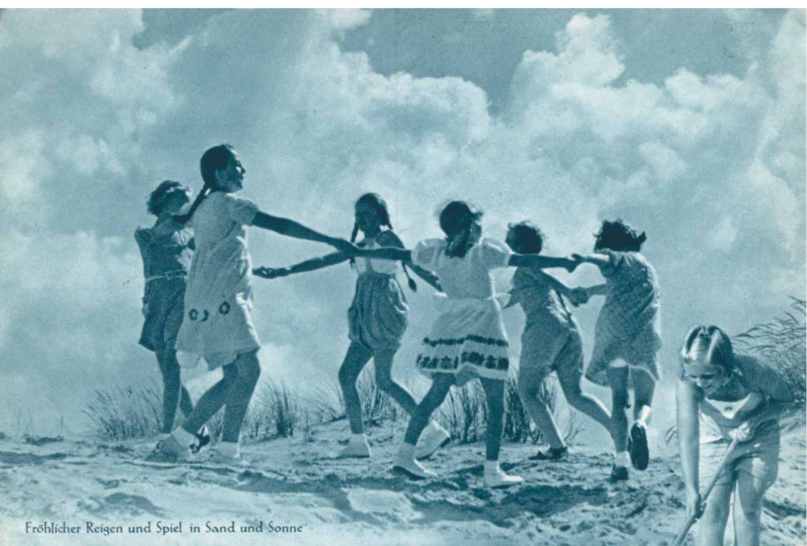
Fröhlicher Reigen und Spiel in Sand und Sonne

Die herbe Meeresschönheit macht Nordseebad Norderney zu einem glückhaften Eiland der Ferienrast. Seltsame Unberührtheit, herbe Kargheit und beseligende Einsamkeit umgeben den Gast bei seinen Wanderungen durch die Dünenwelt, fernab vom Getriebe des Badeortes. See – Wind – Sonne – Sand formen die Landschaft. Ewig klingt die Melodie des rauschenden Meeres,