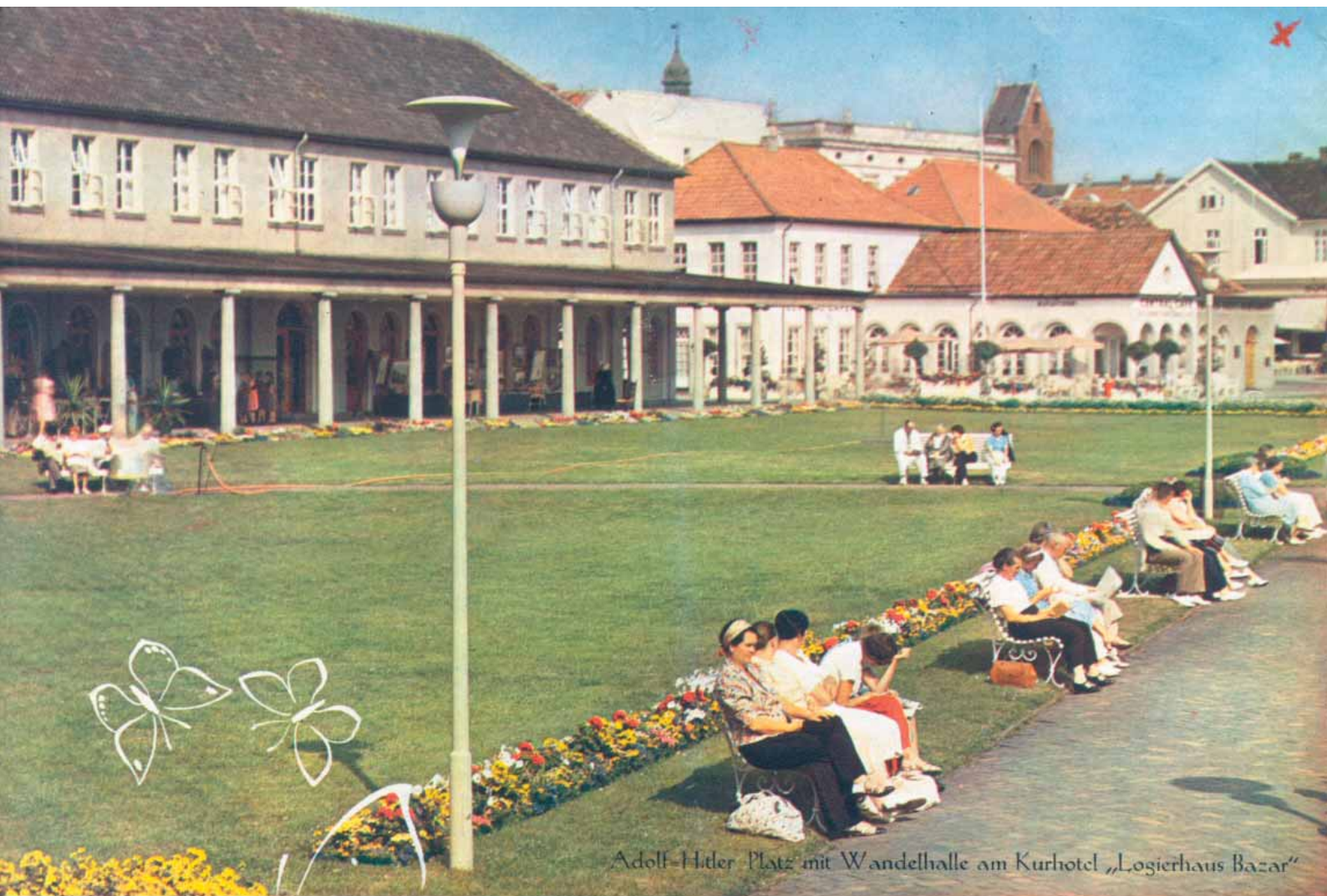
Adolf-Hitler-Platz mit Wandelhalle am Kurhotel „Logierhaus Bazar“