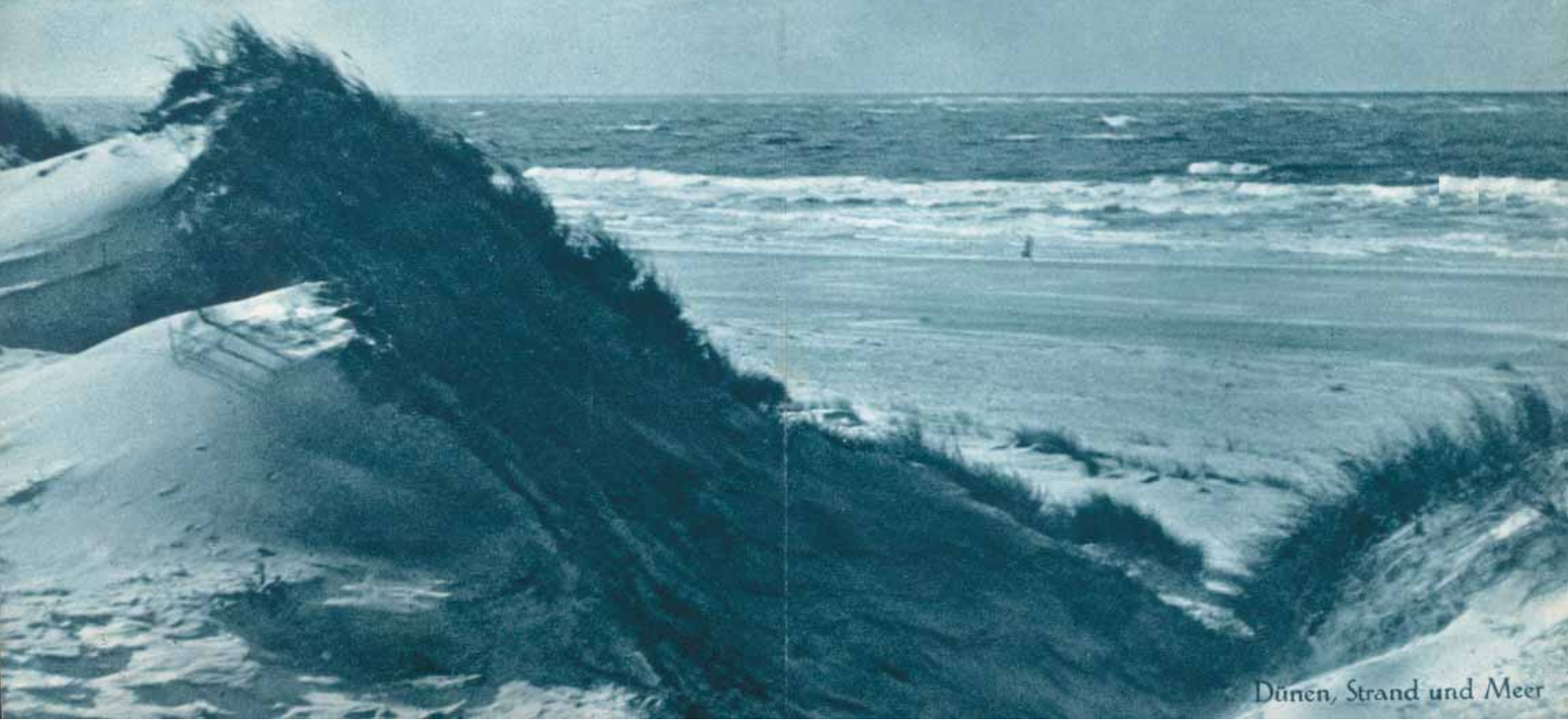
Dünen, Strand und Meer