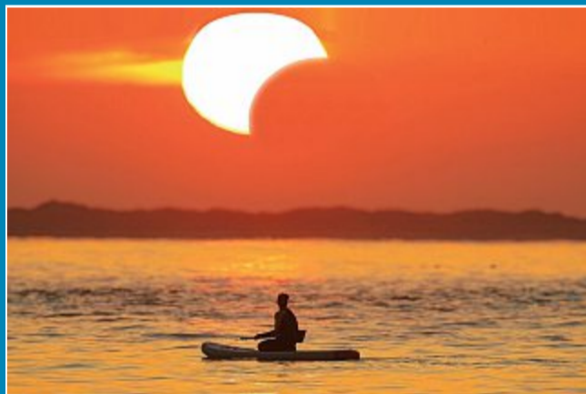
Sonnenfinsternis: Ein Drittel der Sonne wurde vom Mond bedeckt.