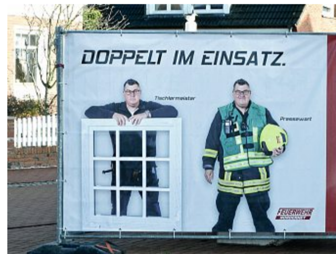
Vor einem Jahr waren diese Plakate überall auf der Insel präsent.

6. Oktober: Diskutiert wird heute die Frage, wer eigentlich für die Kosten eines Feuerwehreinsatzes aufkommt. Vieles regelt dabei das Brandschutzgesetz, aber ein Spielraum für die Kommunen bleibt. Als Privatmensch zahlt man meist nur,