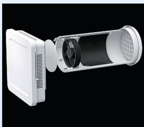
Smarter Lüfter für den nachträglichen Einbau.

peratur- und Feuchtigkeitsfühler die bedarfsgerechte Lüftung im Badezimmer und sorgt so dafür, dass Feuchtigkeit und Schimmel keine Chance haben.