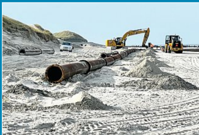
Ende der Aufspülung. Jetzt wird aufgeräumt.