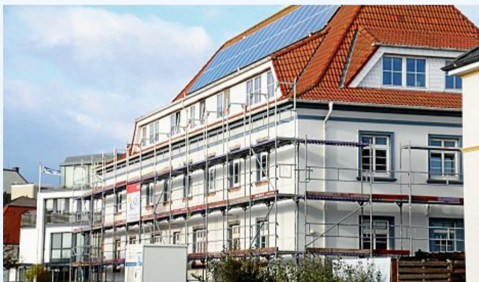
In der Tannenstraße wird inzwischen das dritte Wohnhaus der Norderneyer Wohnungsgesellschaft saniert.

an der Ecke zur Wiederschstraße auf der Agenda der WGN. So sind hier neben einer energetischen Wärmedämmung, neue Fenster und moderne Außentüren geplant. Zusätzlich wird an dem Gebäude eine Wärmepumpe installiert, die über eine neue Fotovoltaikanlage versorgt wird. Fotovoltaik ist das Stichwort. So wollen sich einige Insulaner mit der Anbringung solcher Anlagen unabhängiger bei der Stromversorgung machen. Zur Planung einer solchen Anlage sollte aber als Erstes immer eine Wirtschaftlichkeitsberechnung durchgeführt werden. Eine Fotovoltaikanlage kann dabei zu einem wichtigen Schritt in Richtung einer umweltfreundlichen Zukunft sein.