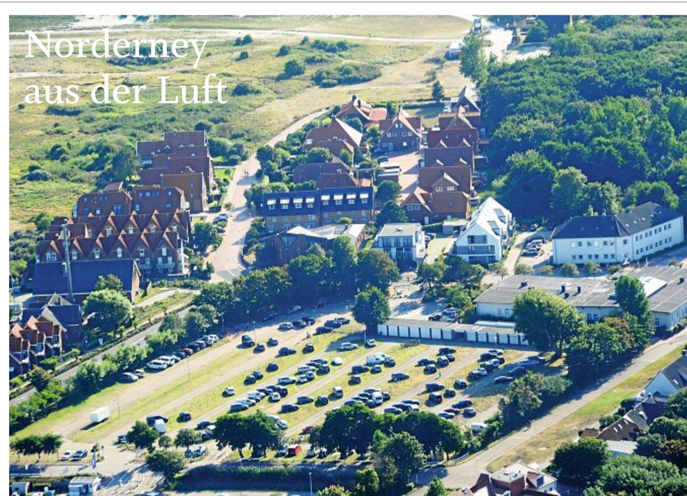
Das Bild stammt aus August 2022, die Bestellnummer lautet 2243.