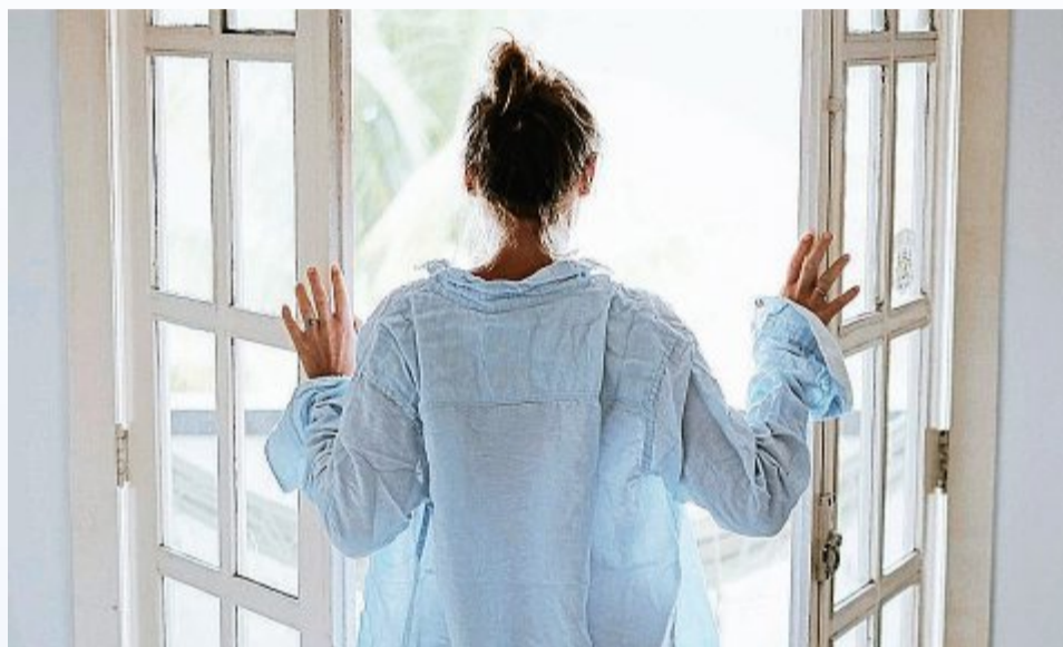
Wer richtig lüftet, spart Energie und Geld.

Wandlüfter nutzen die Wärme der verbrauchten Abluft, um die einströmende Luft bei kalten Außentemperaturen vorzuwärmen. So bleibt der Sauerstoffgehalt hoch und es wird keine Energie verschwendet. Moderne Wandlüfter mit ihrer Mischung aus sparsamer Betriebsweise und hoher Wärmerückgewinnung sind sehr energieeffizient – und eignen sich auch für den nachträglichen Einbau. Über kompakte Abmessungen und eine Blende mit zeitlosem Design verfügt etwa der dezente Aerotube WRG smart von Siegenia. Die Montage ist ohne großen Aufwand möglich, denn auf die Verlegung von Kabeln zwischen den einzelnen Lüftern kann verzichtet werden. Mit einer integrierten Wärmerück-