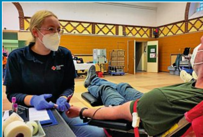
28 Novizen kamen zum Blutspendetermin in die Grundschule.