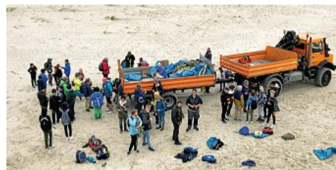
Gemeinsam macht Müll einsammeln mehr Spaß.

Er ist eine große Gefahr für die dort lebenden Tiere und Pflanzen