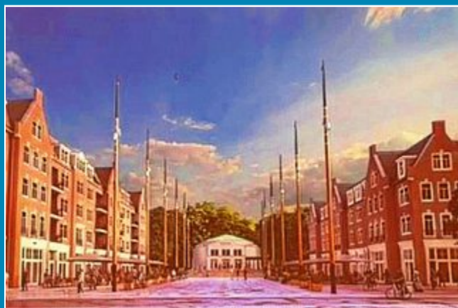
Konzepte für die Neugestaltung des Theaterplatzes.