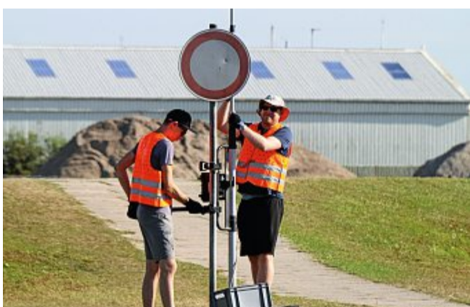
Mitarbeiter installieren die Hardware.

Die Daten helfen auch beim Verkehrskonzept