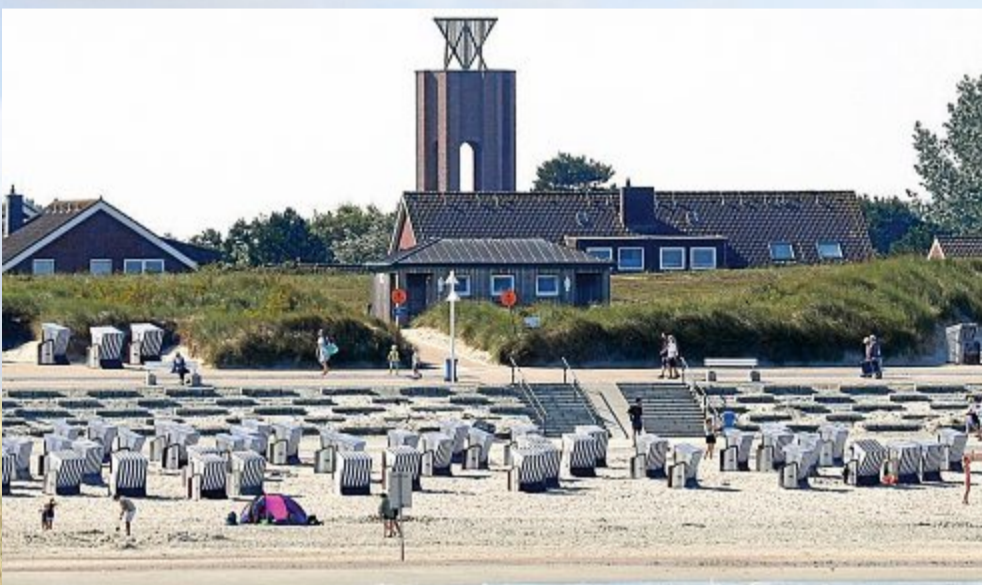
Das Kap: mehr Wahr- als Seezeichen.