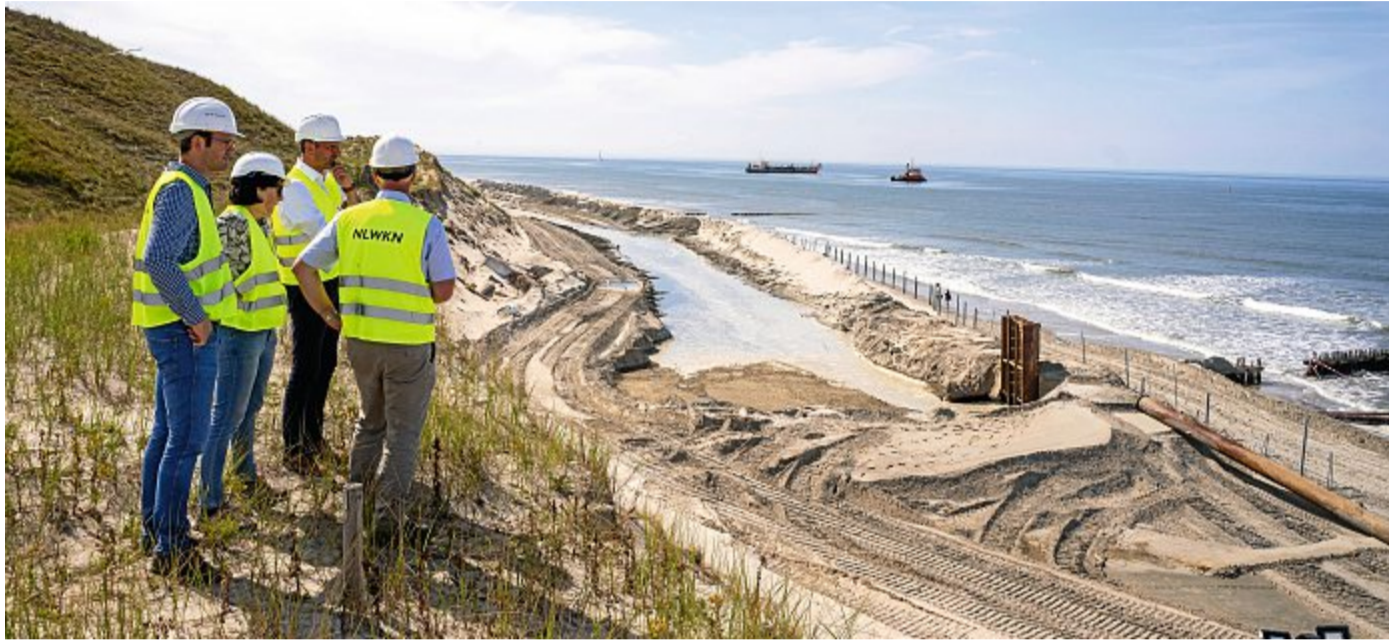
Vom Dünenkamm aus begutachtete die Gruppe das Vorankommen im 400 Meter langen Spülfeld.

Der per Hopperbagger gewonnene Sand wurde zunächst für die aus Sondermitteln des Landes geförderte Stranderhöhung an der Weißen Düne verwendet, die der NLWKN für das Staatsbad Norderney betreut hat. „Diese Arbeiten sind inzwischen planmäßig abge-