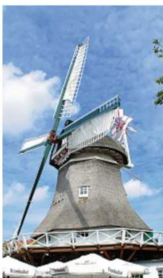
Gehört ab 1. Oktober der Stadt.

auch eine Nutzung im sozialen oder kulturellen Bereich sei denkbar. Auch könne man in Erwägung ziehen, auch wenn dies relativ unwahrscheinlich sei, die Mühle ihrer ursprünglichen Bestimmung zurückzugeben, um Getreide zu mahlen.