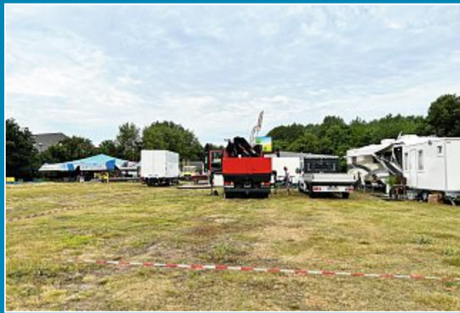
Die Aufbauarbeiten für den Jahrmarkt sind im vollen Gange.