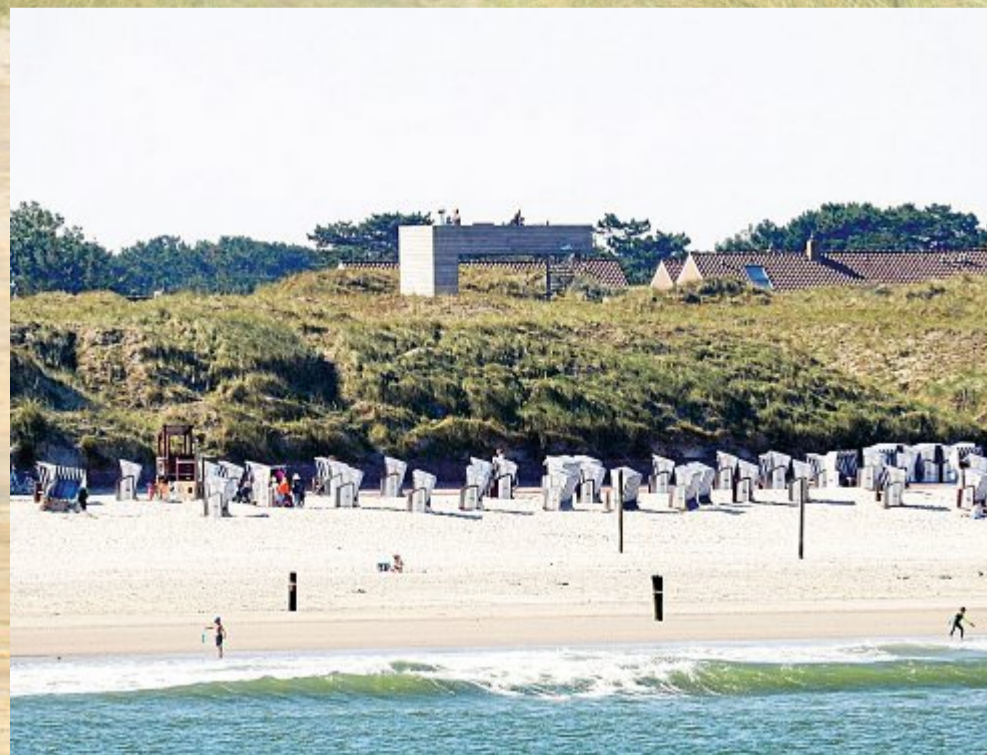
„Den Galgen“ nennen die Einheimischen liebevoll diese Thalasso-Plattform.