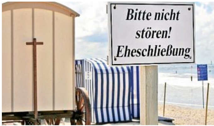
Auch Trau-Termine sind jetzt online buchbar.

NORDERNEY Nach dem Bürgeramt ist jetzt auch eine Online-Terminvereinbarung für den Fachbereich Finanzen & Steuern und das Standesamt möglich. Bürger, die sich bei Fragen und Angelegenheiten persönlich im Rathaus beraten lassen möchten, können jetzt unkompliziert und flexibel mit einem Mitarbeiter aus dem jeweiligen Fachbereich einen Termin über das neue Buchungsportal vereinbaren. Termine werden je nach Verfügbarkeit im Voraus angezeigt, sodass Wartezeiten im Rathaus minimiert werden und Angelegenheiten schnellstmöglich bearbeitet werden können. Auch der Traukalender des Standesamts Norderney ist hier unter „Eheschließungen“ einsehbar, sodass die freien Termine für Trauungen auf Norderney mit genauer Uhrzeit eingesehen