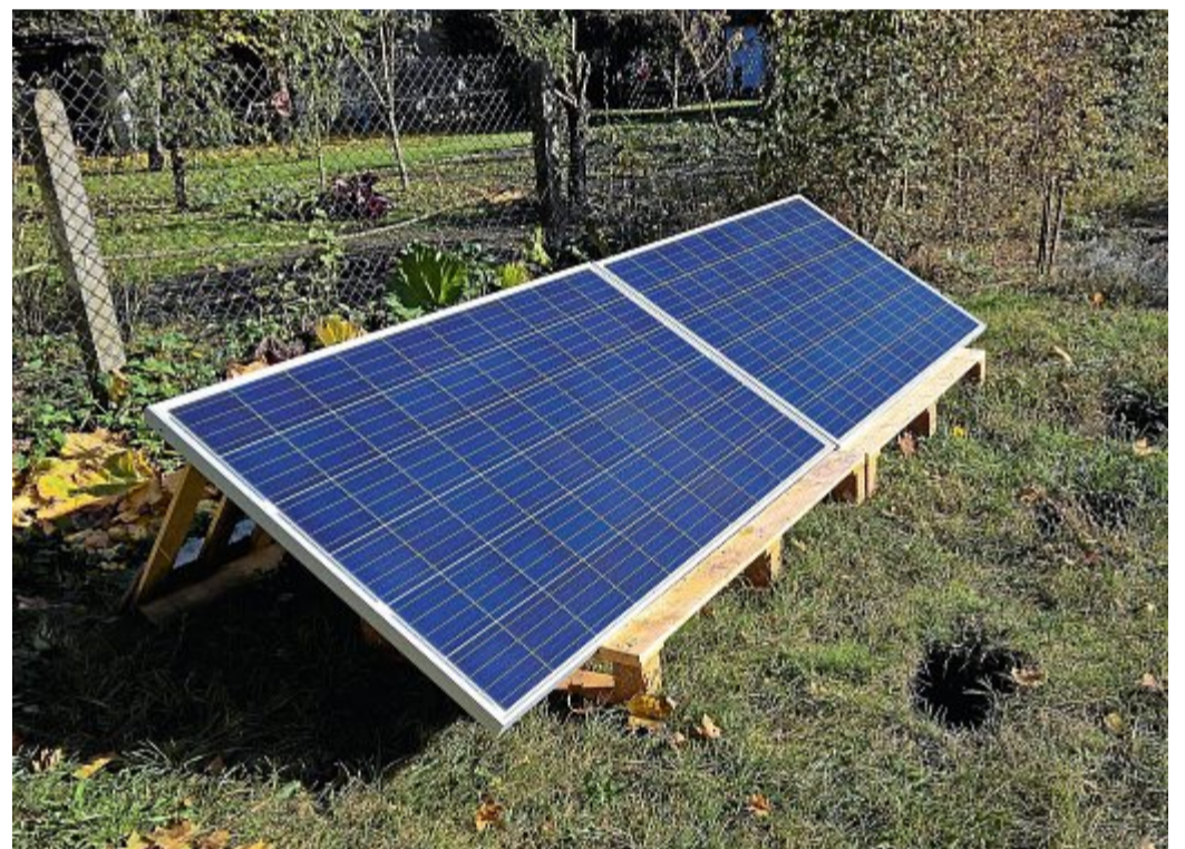
Die kleinen Anlagen bis 600 Wp Leistung passen locker in den kleinsten Garten und sogar auf den Balkon.

Ganz wichtig sei die Anmeldung der PV-Anlage bei den örtlichen Stadtwerken (Netzbetreiber). Hierfür