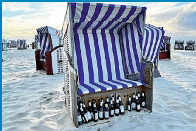
Manchmal lohnt sich das Sammeln von Leergut.