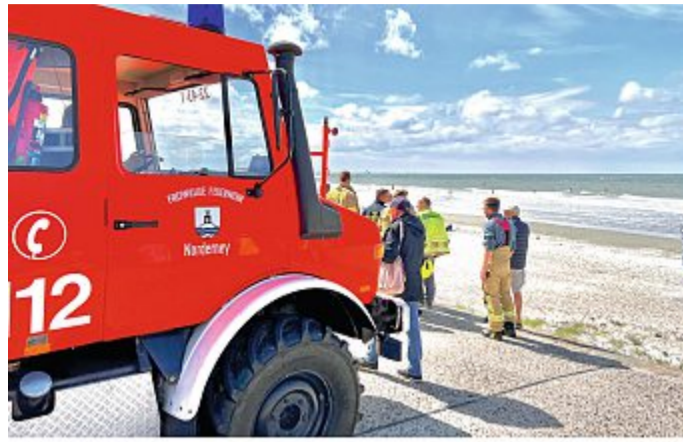
Wenigstens kam der neue Unimog einmal zum Einsatz.

So wurde der ADAC-Hubschrauber Christoph 26, das Rettungsboot „Eugen“ der DGZRS (Deutsche Ge-