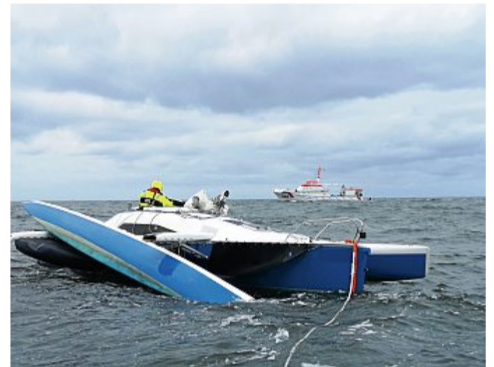
Trimaran zerbricht auf der Nordsee auf dem Weg von Spiekeroog nach Helgoland.

Vor Ort brachte die „Seefalke“ ein Beiboot aus, holte eine Seglerin von Bord des Havaristen und setzte ein ei-