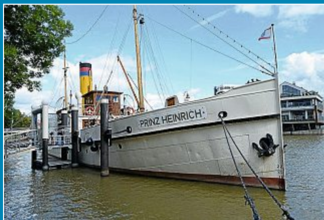
„Prinz Heinrich“ kündigt Besuch für nächsten Monat an.