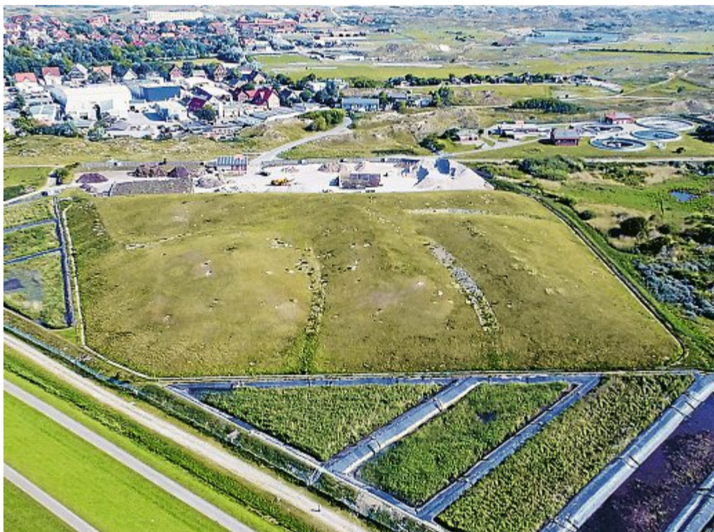
Die Klärschlammvererdungsfelder im südlichen Bereich der Norderneyer Kläranlage.

Norderney ist schon damals der Entwicklung ein gutes Stück voraus gewesen. Man hat sich von dem Konzept der Pauly-Group überzeugen lassen und ist heute