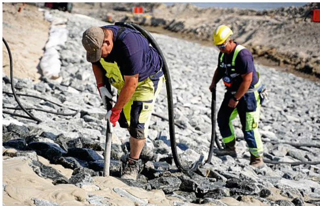
Die Schüttsteine unterhalb und oberhalb der Asphaltberme werden mit Spezialmörtel vergossen und so zusätzlich gegen die starke Beanspruchung durch Wellen gesichert.

Eine Besonderheit der laufenden Baumaßnahme stieß bei den Besuchern aus Hannover und Norden auf besonderes Interesse: Das Rauheckwerk aus Na-