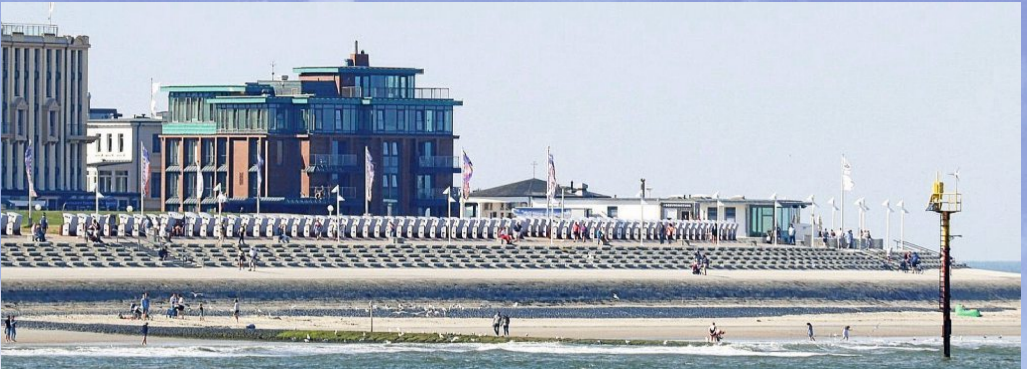
Akurat aufgereiht stehen die Strandkörbe an der Kaiserwiese am Nordstrand.