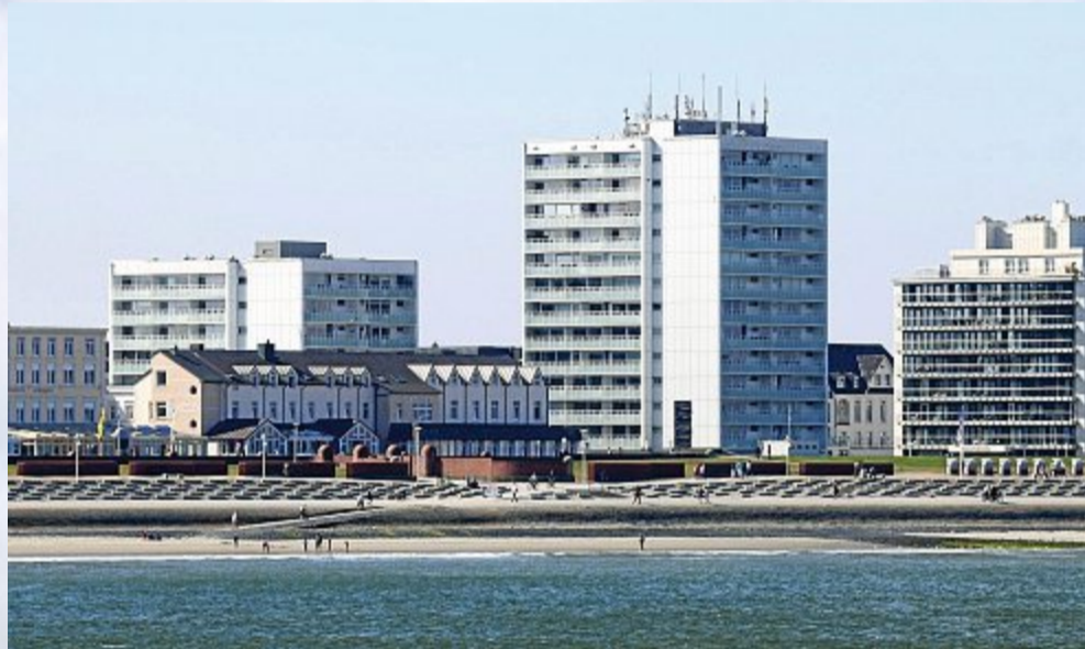
Auch von See nicht schön. Die Bausünden vergangener Tage.