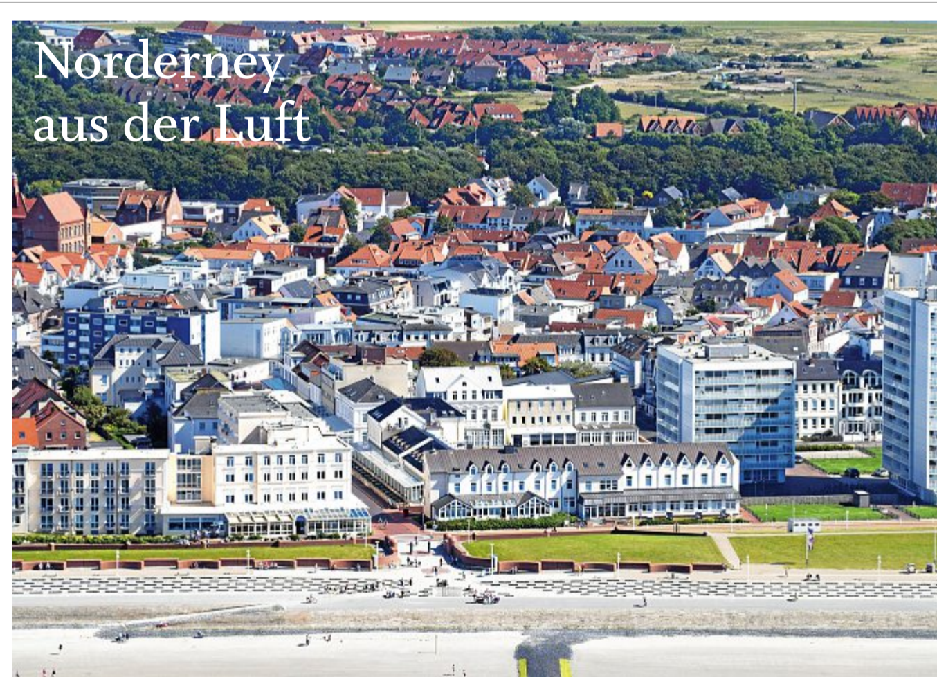
Das Bild stammt aus Juni 2018, die Bestellnummer lautet 2230.

Liebe Leserinnen und Leser! Dieses Foto und weitere Luftbilder können Sie unter Telefon 04932/991968-0 bestellen. In unserer Geschäftsstelle, Bülowallee 2, auf Norderney nehmen unsere Mitarbeiter Ihre Bestellung auch gern persönlich entgegen. Ein Fotoposter im Format 13 x 18 cm ist für 5,80 Euro, im Format 20 x 30 cm für 14,80 Euro, im Format 30 x 45 cm für 25,80 Euro zu haben. Auch größere Formate bis zu Sondergrößen auf Leinwand sind möglich. Weitere Luftbilder finden Sie auch online unter www.skn.info/fotoweb/archives/5006-Bildergalerie_Luftbilder/ .