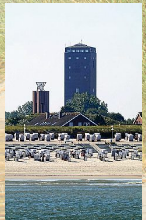
Wasserturm und Kap.