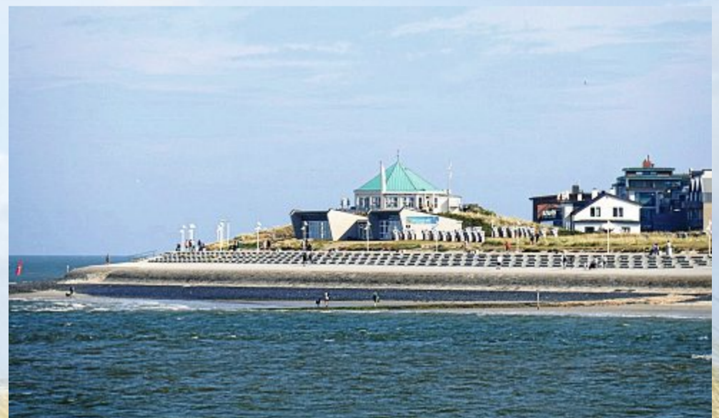
Die Marienhöhe über der Salzoase.