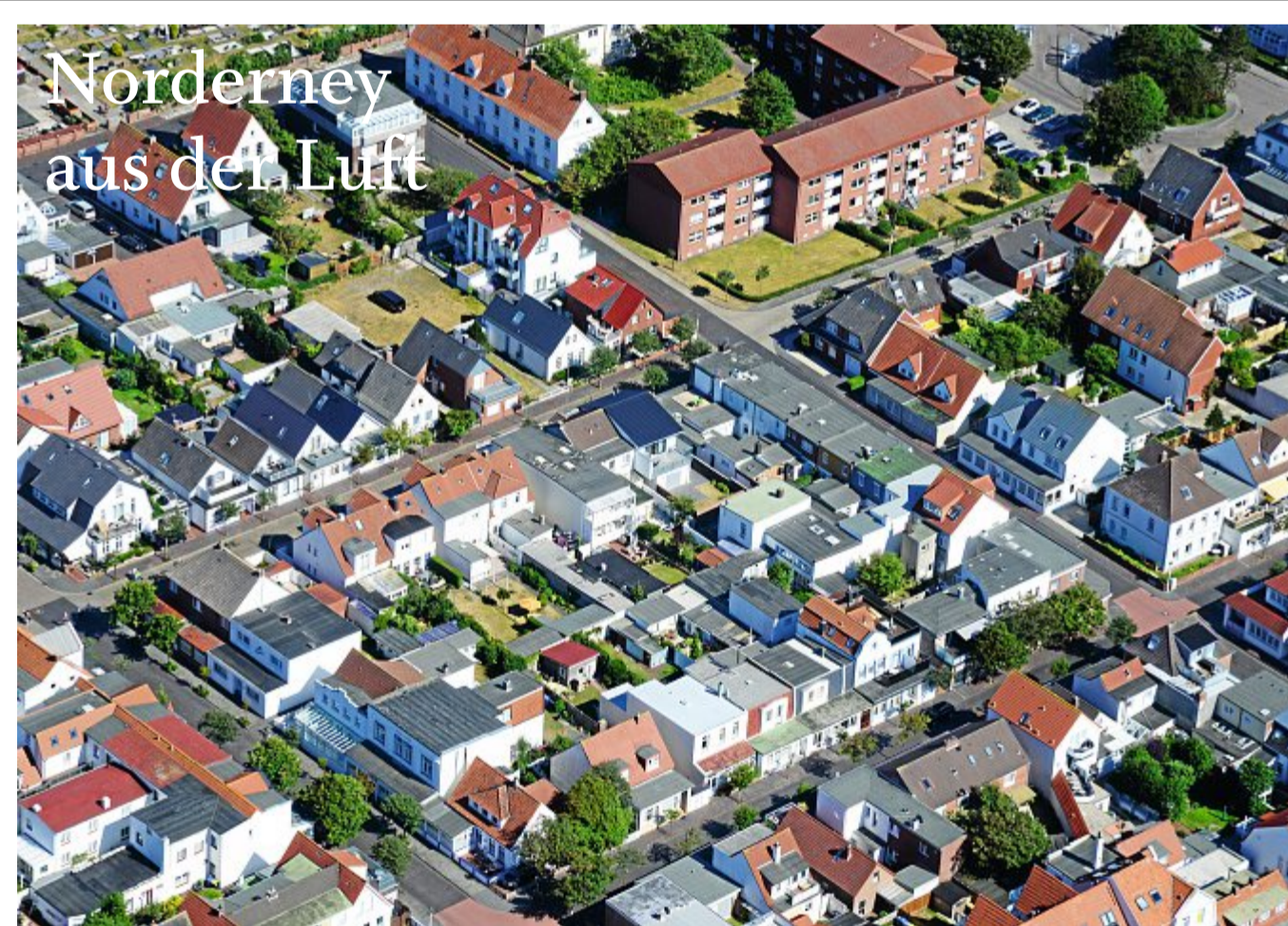
Das Bild stammt aus Juni 2018, die Bestellnummer lautet 2214.

Ganz schön beeindruckend diese Tiere, findet ihr nicht auch? Jetzt wisst ihr, woher diese Schulpen kommen, die manchmal am Strand liegen. Vielleicht habt ihr ja schon eine gefunden. Ich mach mich jetzt mal wieder auf. Bis nächste Woche, euer Kornrad