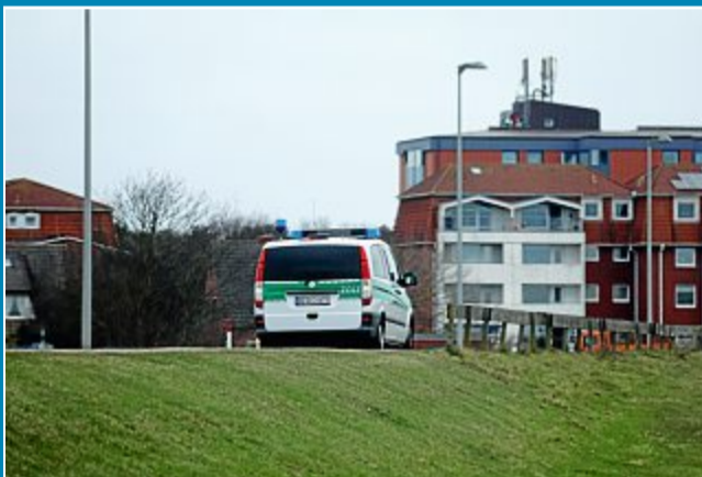
Auch auf Norderney kontrolliert der Zoll die Betriebe auf illegal Beschäftigte und Schwarzarbeit.