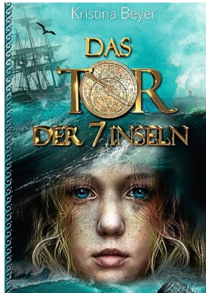
„Das Tor der 7 Inseln“ bildet den Auftakt zu einer neuen Buchreihe mit Schauplätzen in Ostfriesland.

„Das Tor der 7 Inseln – Das Mädchen in Gelb“ umfasst 170 Seiten und ist in kurze Kapitel mit kleinen Illustrationen aufgeteilt, sodass es sich gut für Kinder ab zehn Jahren zum Lesen eignet. Trotz der zwei weiblichen Protagonistinnen „versteht es sich keineswegs als Mädchenbuch, sondern spricht genauso Jungen an“, versichert die Autorin. Entstanden ist ihr Debütroman eher