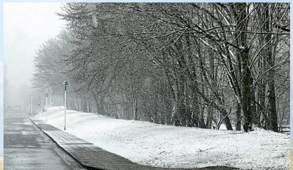
Mittags dann Schnee...