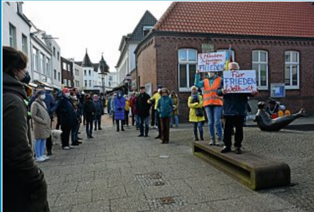
Man trifft sich in der Poststraße zum „Schweigen für den Frieden“.