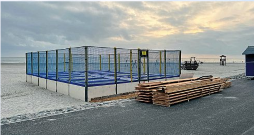
Am Nachmittag war es noch bewölkt.