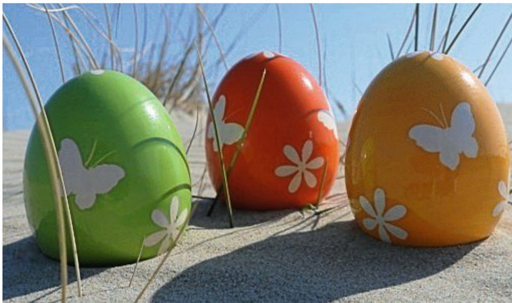
Ein abwechslungsreiches Veranstaltungsprogramm an den Ostertagen.

Ein Mitmach-Programm für Kinder gibt es dann am 12. April um 15.30 Uhr in der Konzertmuschel am Kurplatz. Heiner Rusche präsentiert dann Bewegungslieder. Das ist Kindermusik für gute Laune und nicht nur für Kinderohren. Sein Programm soll Spaß bereiten. Live werden alle