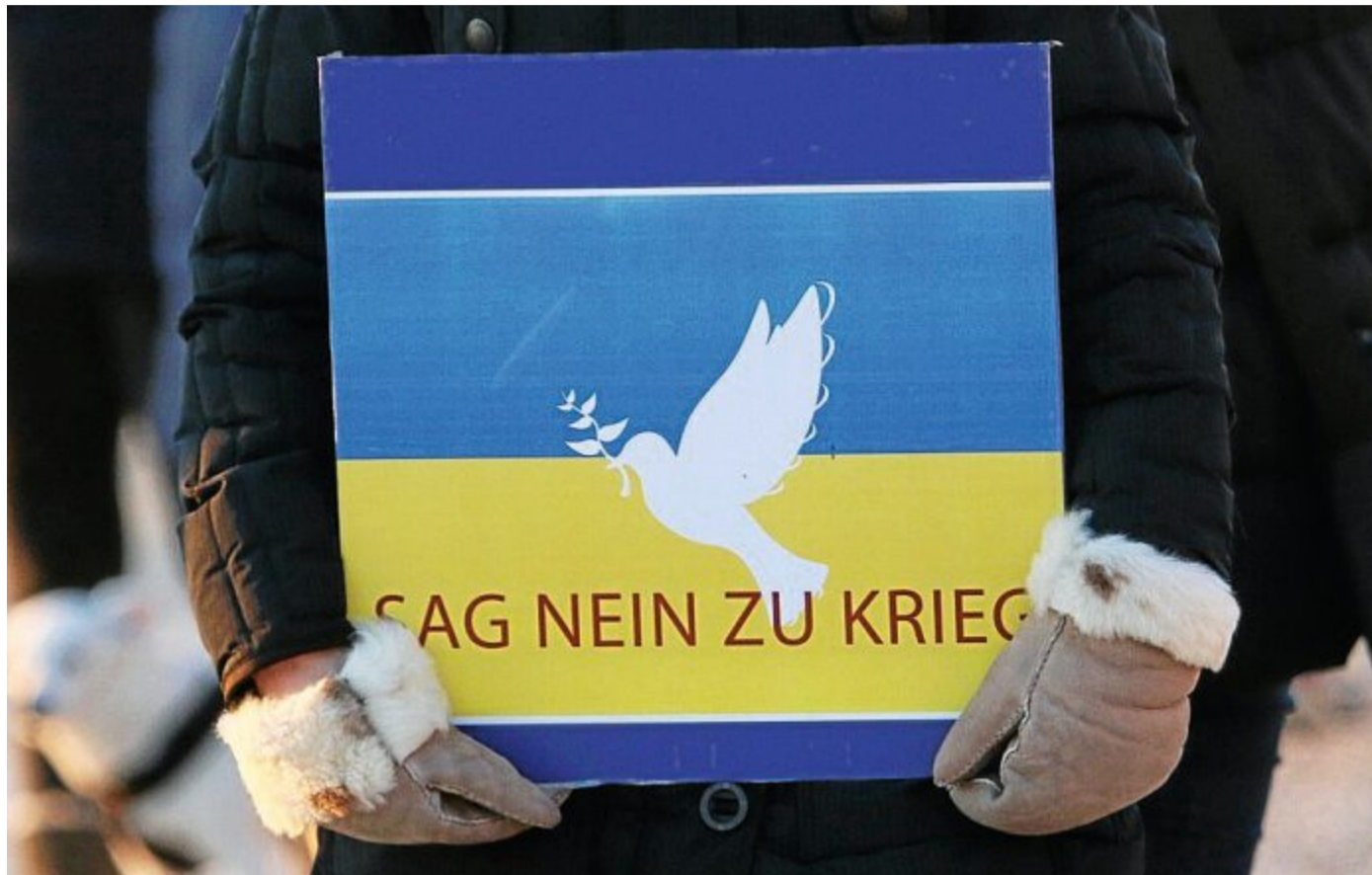
Ulrichs bedankte sich bei allen, die den in Not geratenen Menschen helfen.

Die Termine könnten direkt über das Internet auf den Seiten des Landkreises