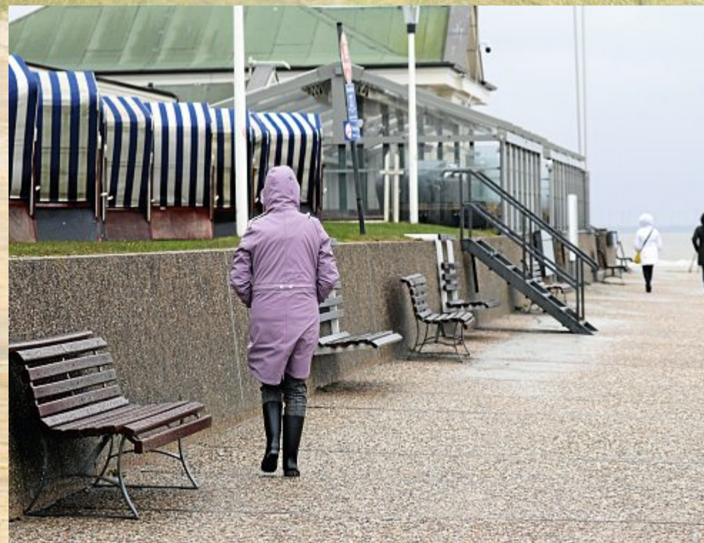
Schließlich frischte es auf, aber lediglich für eine Stunde.