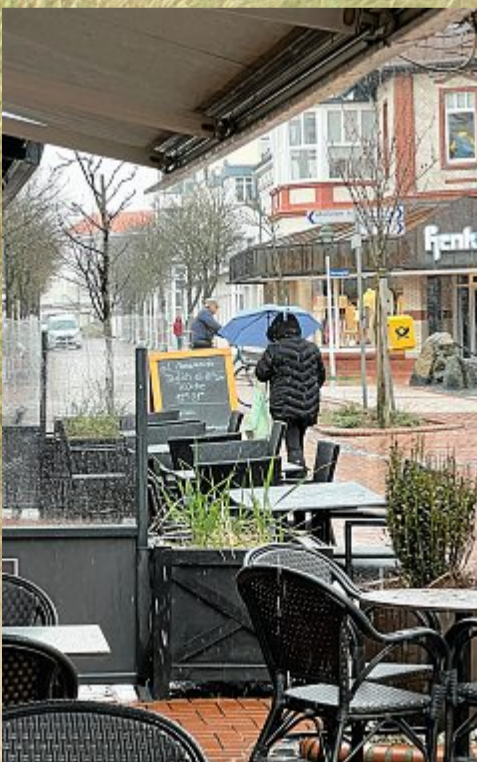
...und Regen ohne Ende.