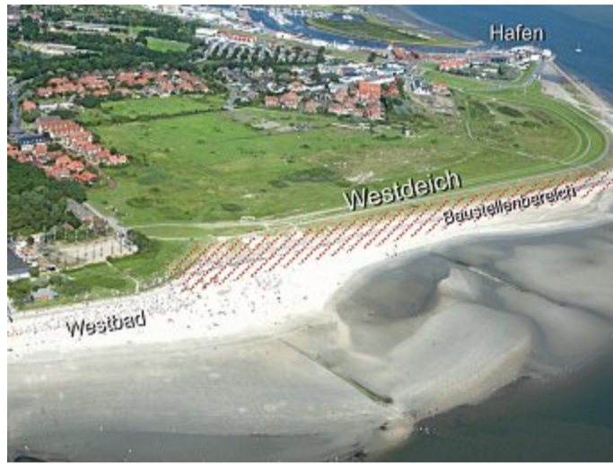
Ab Mitte April 2021 begannen hier die Arbeiten im Bereich Westbad/Bühne G.

13. März: 100 Corona-Pflegekräfte, die bei der Rotary-Aktion gewannen, bekamen nun ihr Quartier. Nachdem die gespendeten Ur-