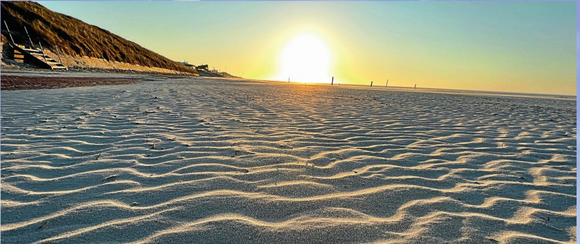
Stahlblauer Himmel am Abend eines Apriltages, der alle Facetten zeigt, die das Wetter in diesem Monat so zu bieten hat.