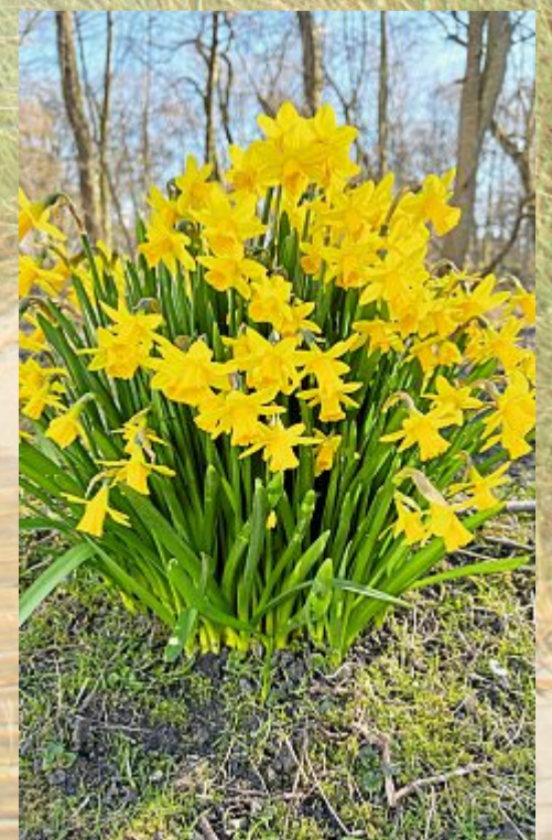
Und die Osterglocken läuten bereits.