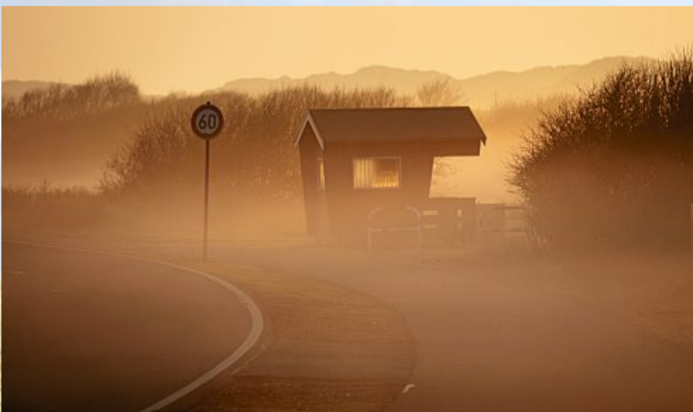
Der Morgen startete mit Sonne und Frühnebel.