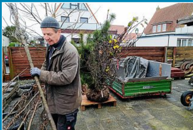
Keine Winterruhe bei Friedhofsprojekten.