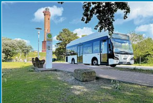
Dreifache Kosten für Elektrobusse.