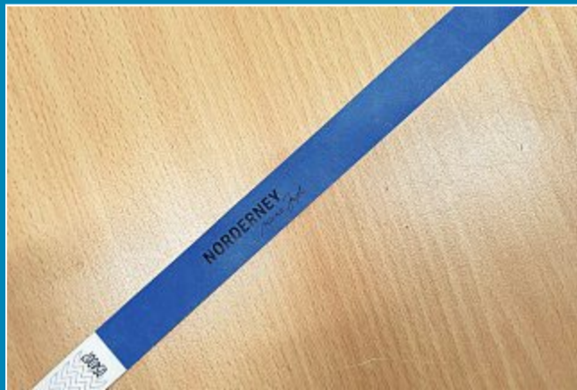
Bändchen in weiß und blau.