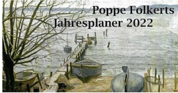
Die „Kieler Förde“. Poppe Folkerts hat das Bild 1907 gemalt.

Der neue Poppe Folkerts Jahresplaner mit zwölf Motiven des berühmten Malers