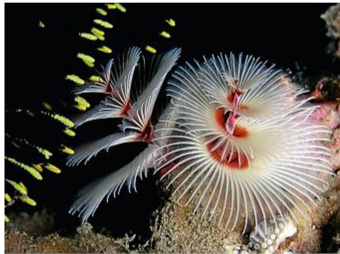
Den Spiralaröhrenwurm gibt es in vielen Farben.

Der bunte Spiralaröhrenwurm lebt auch in der Nordsee