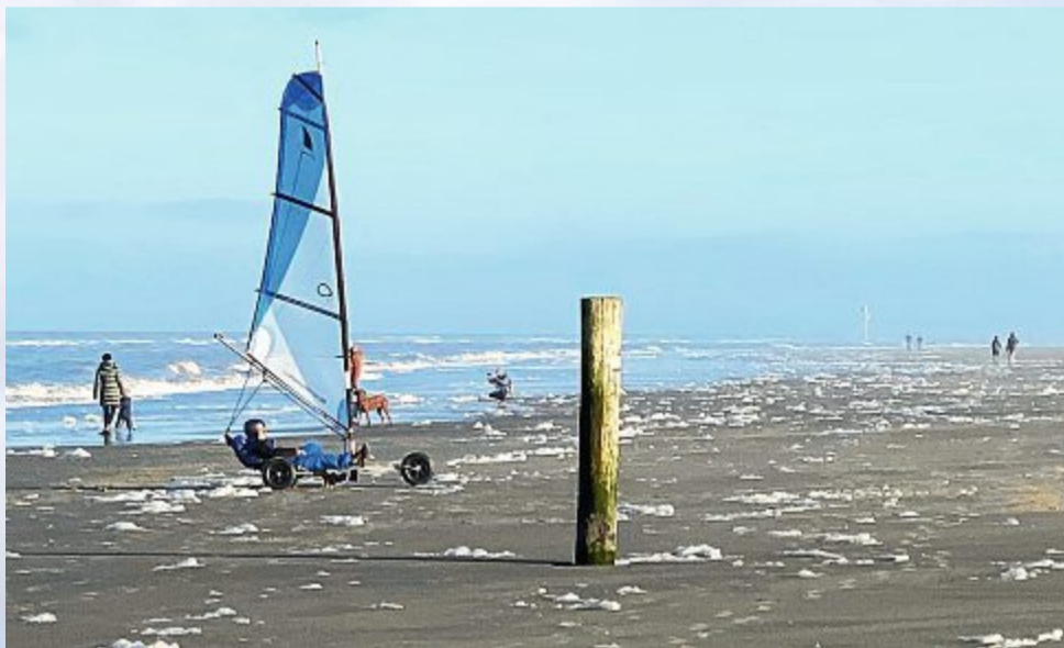
Strandsegler scheinen nicht empfindlich zu sein.