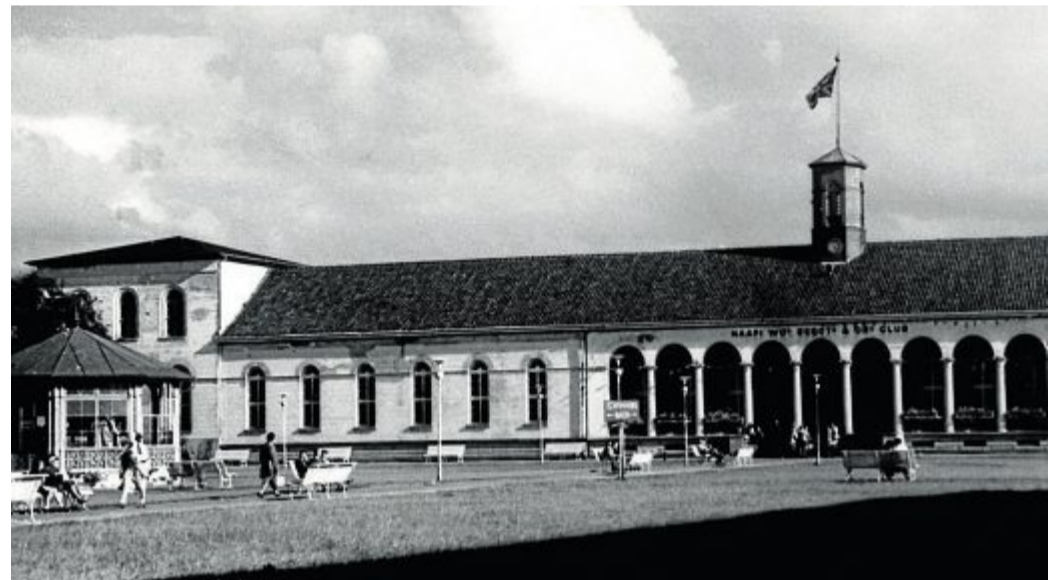
Norderneyer, die nicht im „Leave Center“ arbeiteten, durften das Conversationshaus nicht betreten.