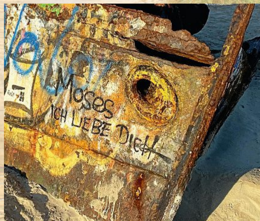
Schwer verliebt am Wrack.