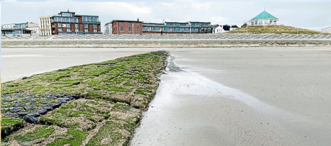
Deutlich weniger Sand als im letzten Jahr ist geblieben.