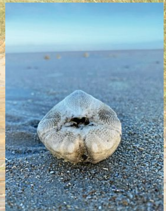
Ein Skelett eines Seeigels.