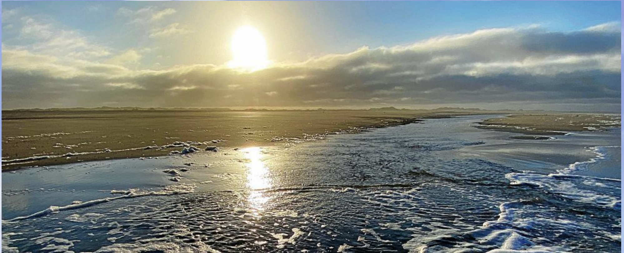
Wer sich bei diesem Wetter vor die Tür traut, kann auch sonnige Augenblicke erleben. Kalt bleibt es trotzdem.