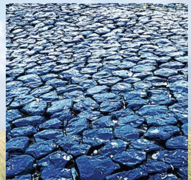
Neue Muster am Weststrand.