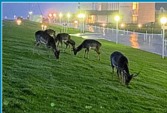
Damwild an der Kaiserstraße.