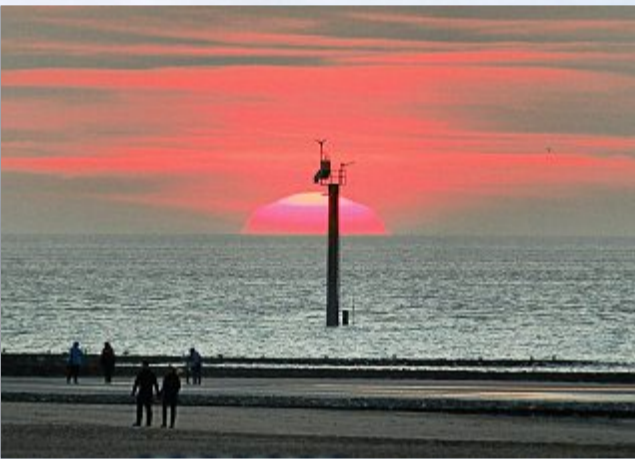
Pretty in pink. Noch ein paar Minuten Licht.