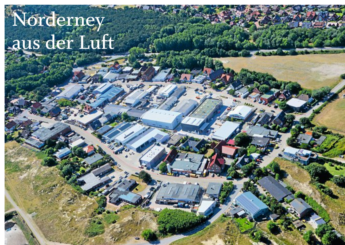
Die Bestellnummer lautet 2142. Das Bild entstand im Juni 2018.

Liebe Leserinnen und Leser! Dieses Foto und weitere Luftbilder können Sie unter Telefon 04932/991968-0 bestellen. In unserer Geschäftsstelle, Wilhelmstraße 2, auf Norderney nehmen unsere Mitarbeiter Ihre Bestellung auch gern persönlich entgegen. Ein Fotoposter im Format 13 x 18 cm ist für 5,80 Euro, im Format 20 x 30 cm für 14,80 Euro, im Format 30 x 45 cm für 25,80 Euro zu haben. Auch größere Formate bis zu Sondergrößen auf Leinwand sind möglich. Weitere Luftbilder finden Sie auch online unter www.skn.info/fotoweb/archives/5006-Bildergalerie_Luftbilder/ .