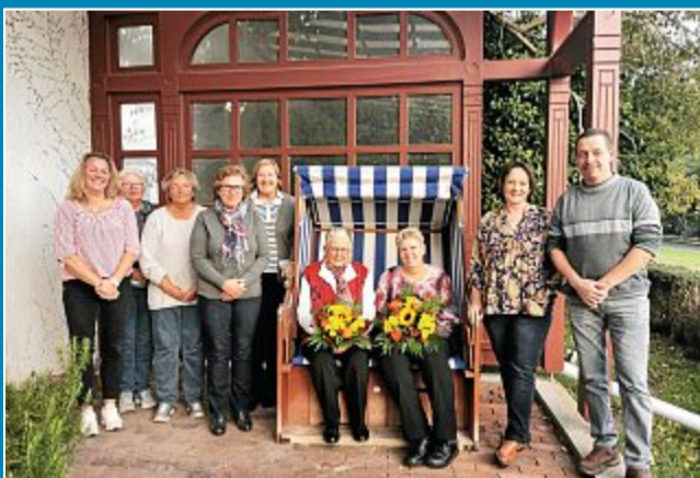
Awo ehrt Jubiläumsmitglieder.