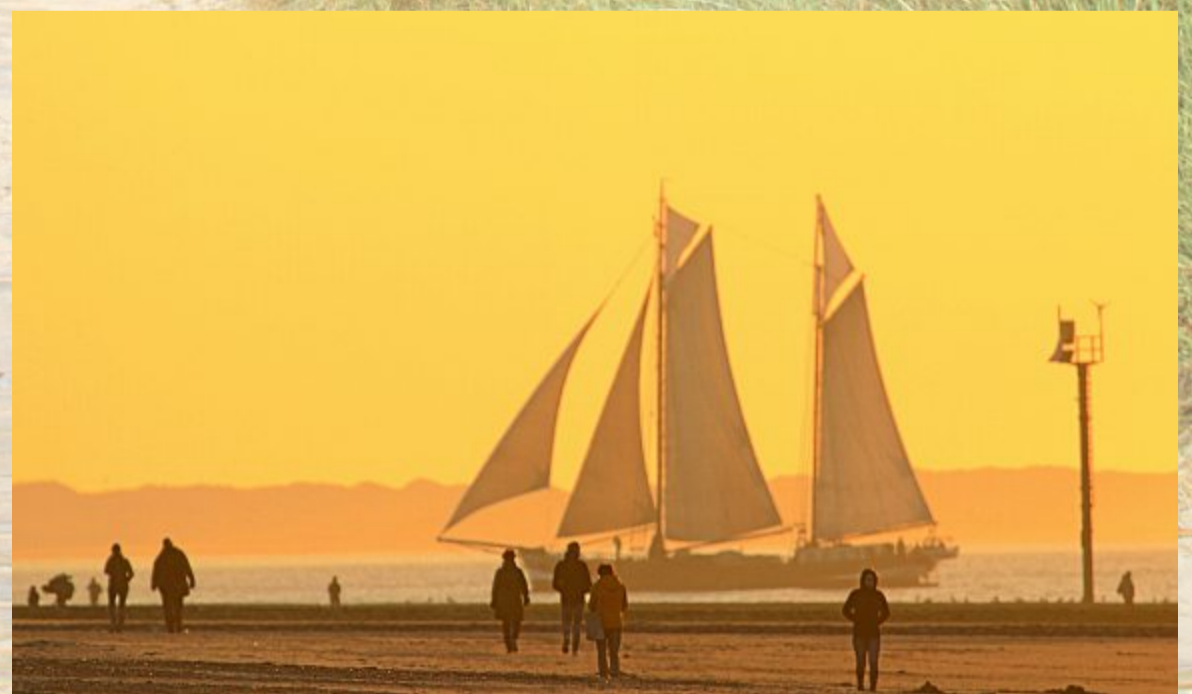
Die „Pegasus“ passiert gemütlich den Nordstrand.