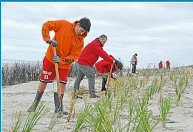
Gruppe der Bethel-Stiftung pflanzt Strandhafer.