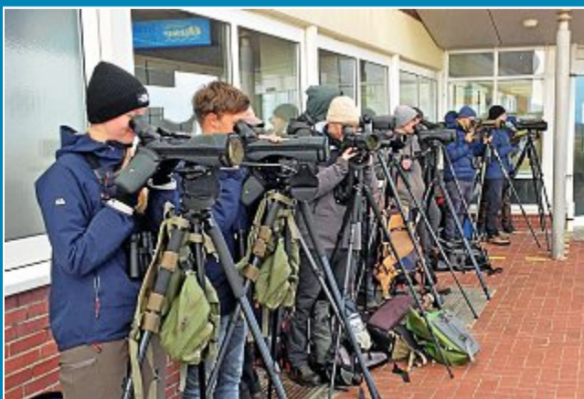
Resümee der Zugvogeltage.