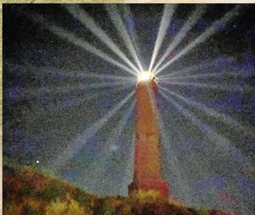
Bei klarem Wetter strahlt der Leuchtturm besonders.