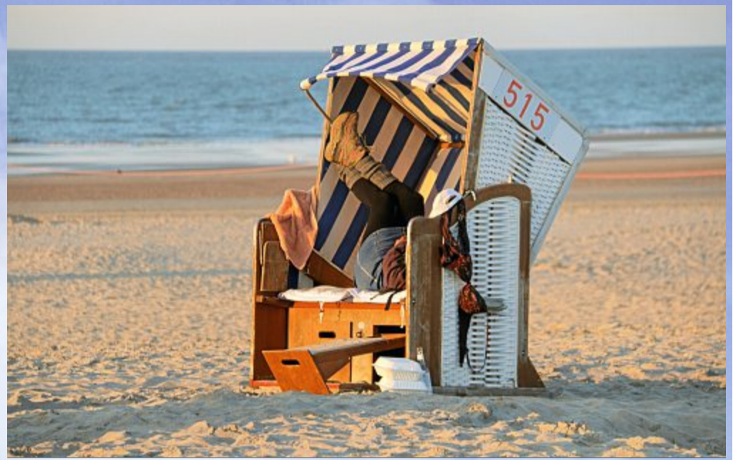
Gaaaanz relaxed in einem der letzten Strandkörbe.