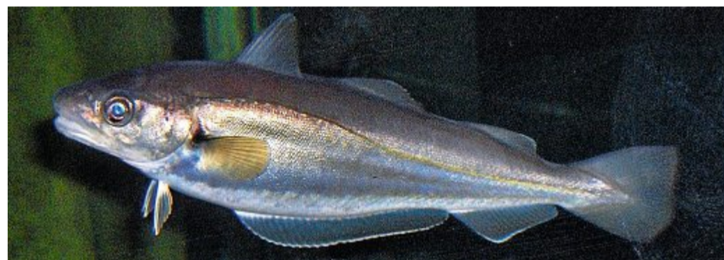
Der Wittling ist mit dem Dorsch verwandt.

Wittlinge erreichen eine Körpergröße von bis zu 70 Zentimeter nund ein Gewicht von drei Kilo. Bei den größeren handelt es sich meistens um Weibchen (Rogner), wobei die Standardgröße eher zwischen 30 und 40 Zentimetern liegt. Wittlinge leben im Nordost-Atlantik, der Nordsee, dem Kattegat und der westlichen