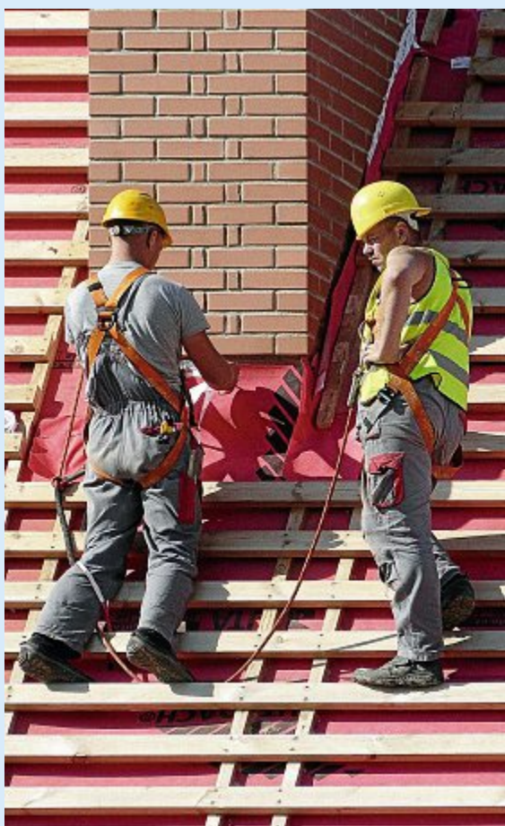
Auch das Betriebsklima muss stimmen.