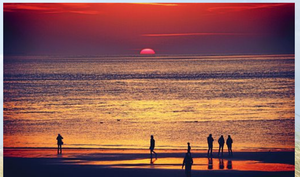
Das Gleiche immer anders: Norderneys Sonnenuntergänge.