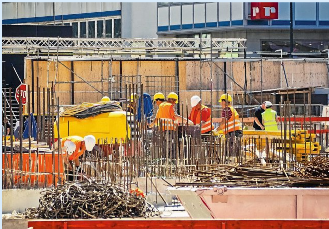
Arbeit gibt es reichlich, aber qualifizierte Manpower wird gesucht.