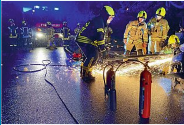
22-Jähriger verliert alkoholisiert die Kontrolle über seinen Audi und rast in eine Absperrung.