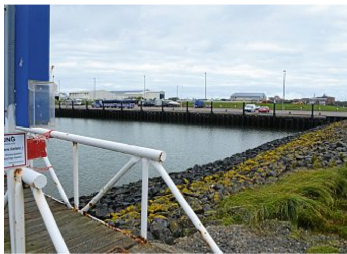
Der gewünschte künftige Liegeplatz.

Während Janssen für die Gäste an Bord den 830 PS starken Motor anwirft und für den richtigen Sound sorgt, berichten Born-