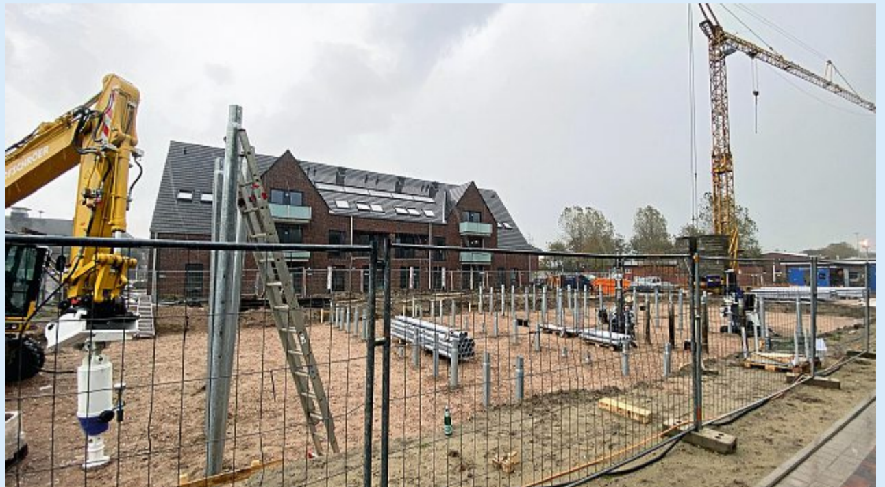
Noch werden die Restarbeiten erledigt. Mitte Dezember sollen dann die ersten Mieter einziehen.