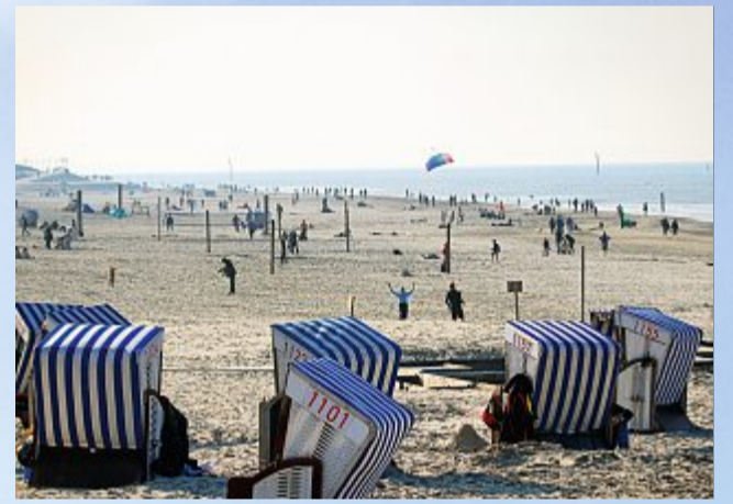
Strandleben fast wie im Sommer.