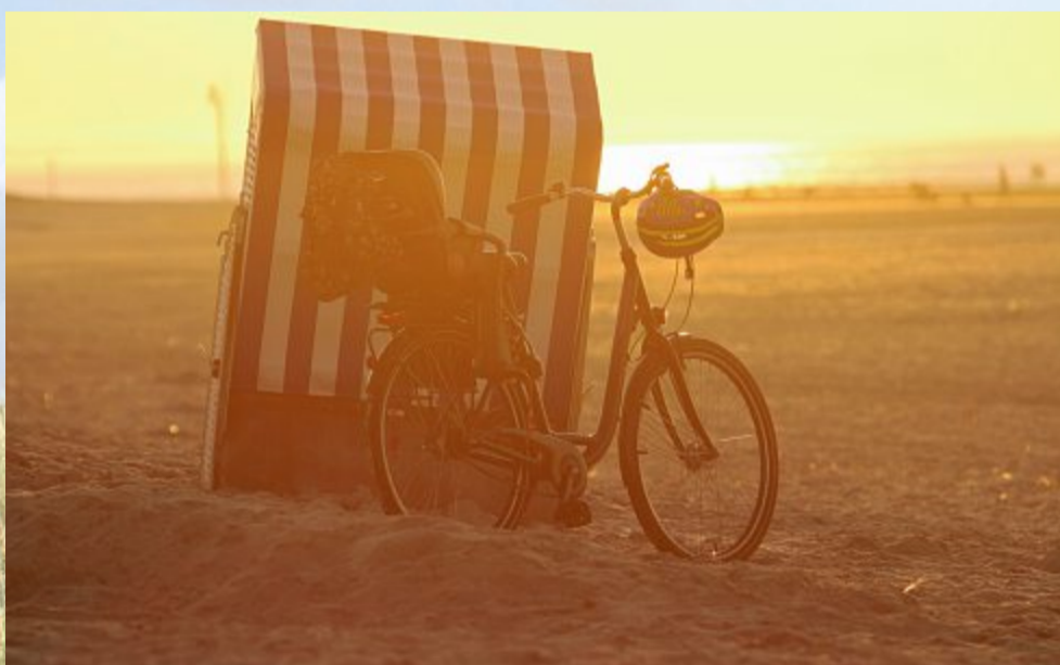
Kleine Pause auf der Radtour.