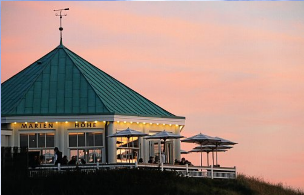
Die blaue Stunde lädt zum Sun-Downer in die Marienhöhe.