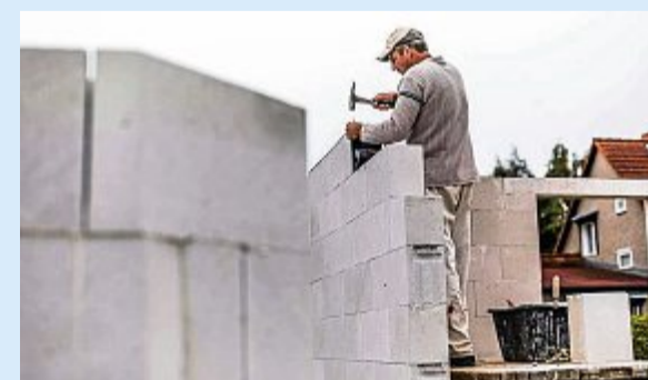
Gesucht werden im Handwerk vor allem Gesellen.

Experten empfehlen, durch eine verbesserte Berufsorientierung an Schulen sowie eine breitere Aufklärung von Eltern und Lehrern stärker für die duale Berufsausbildung zu werben. Weil in Corona-Zeiten kaum Praktika oder Ausbildungsmessen stattfinden konnten, müssten hier auch neue digitale Wege erprobt werden.