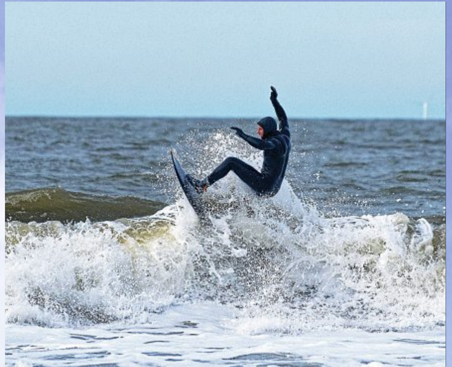
Wellenreiter kennen kein schlechtes Wetter.