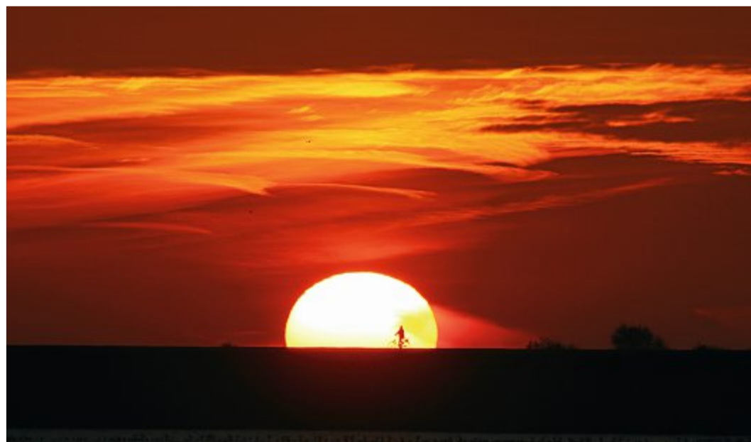
Sonnenuntergänge wurden durch den Staub aus der Sahara besonders farbenfroh.