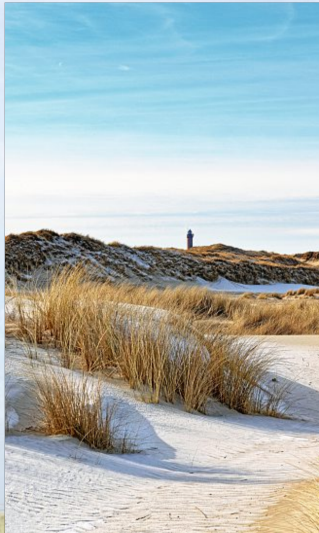
Die Dünen im Morgenfrost.