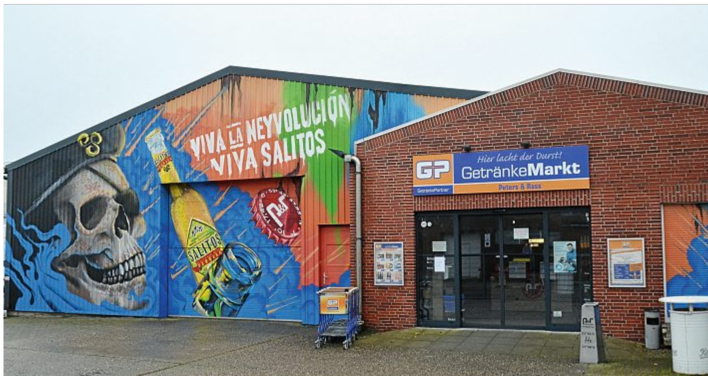
Jetzt steht es fest: Getränke Peters & Rass ist verkauft.

„Mobilität und Logistik gehören seit 150 Jahren zum Unternehmenskern der Aktiengesellschaft Norden-Frisia“, so Meyer. Den sicheren Transport der mit Getränken beladenen Lkw auf der Fährfahrt von Norddeich nach Norderney stelle das Unternehmen täglich sicher. Seit 10. März stärkt die Reederei ihre Logistik-Kompetenz und übernimmt den renommierten Händler Getränke Peters & Rass auf Norderney. Seit 59 Jahren stehen die Fa-