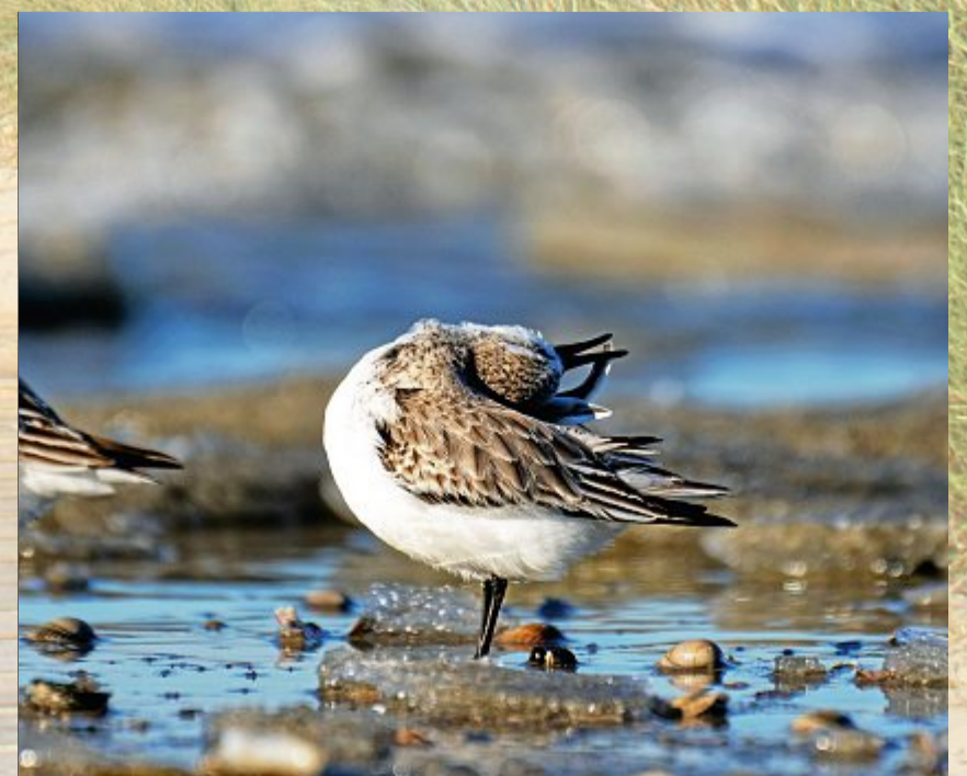
„Keen Tied“ (Sanderling) beim Putzen.