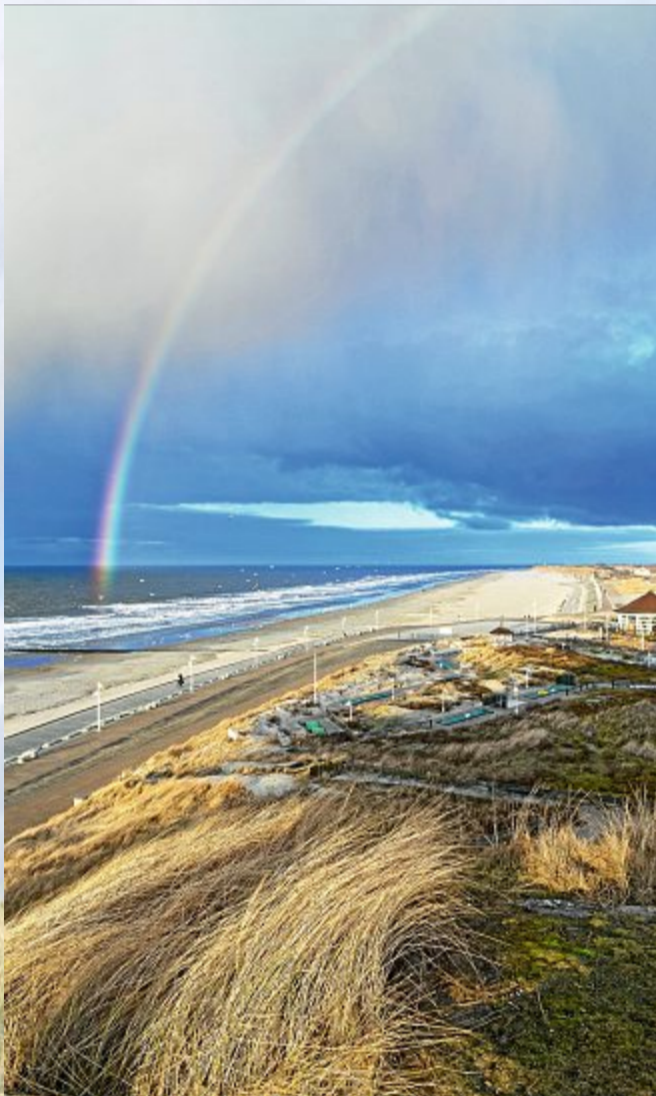
Der Schatz liegt im Meer.