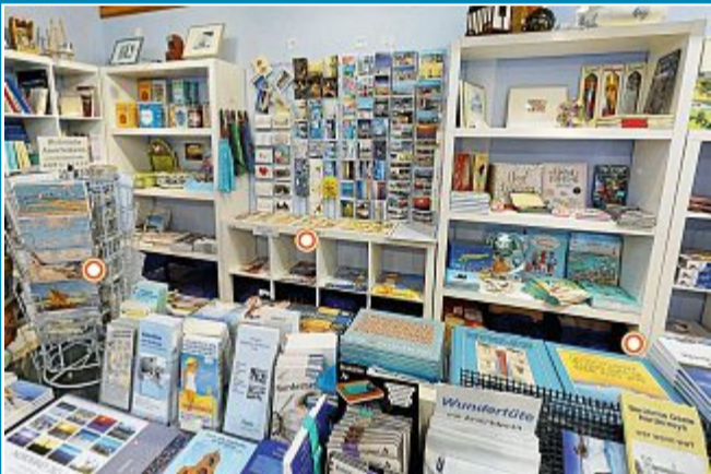
Jetzt kann man auch im Bademuseum die digitale Ausstellung besuchen und sogar shoppen gehen.