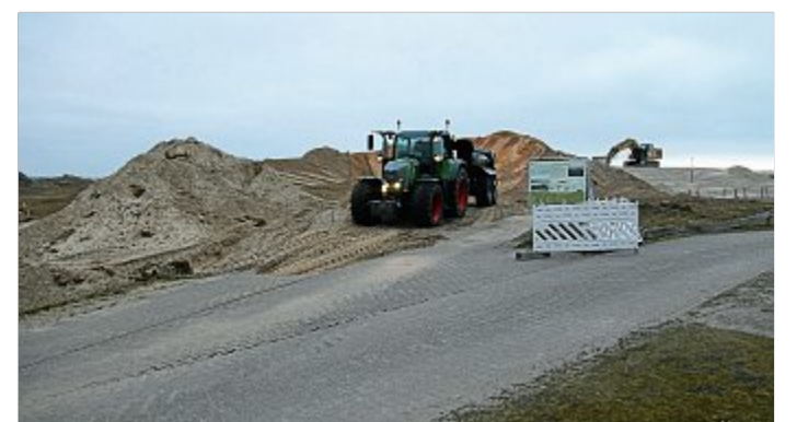
Am Osthellerparkplatz wird dann abgeladen.

„Der Dünenamm wurde einst im Nachgang zur Eindeichung des Grohdolders er-