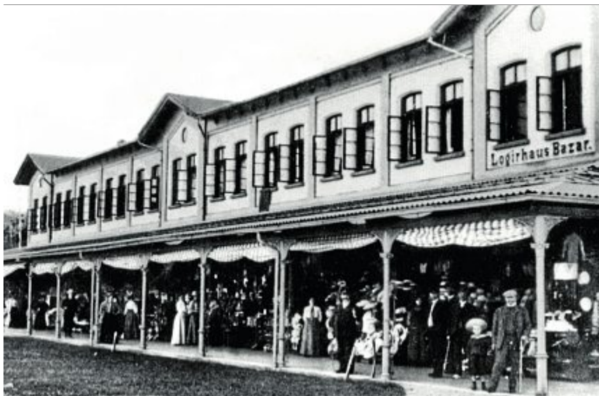
So sah das „Logierhaus Bazar“ vor 1914 aus.