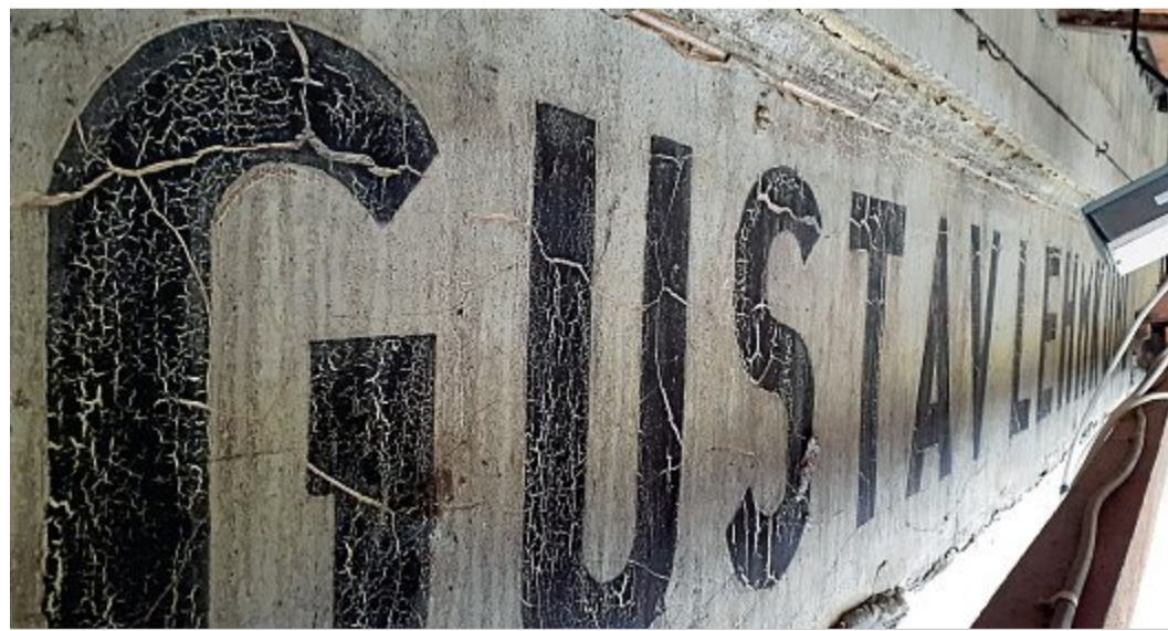
Einer der alten Schriftzüge von einem der Geschäfte nach 1930.

NORDERNEY/BD – Laut einer Mitteilung des Landkreises verstarb am Montag ein 54-jähriger Mann im Klinikum Oldenburg im Zusammenhang mit Corona. Damit erhöht sich die Zahl der Todesfälle für die Insel auf insgesamt neun.