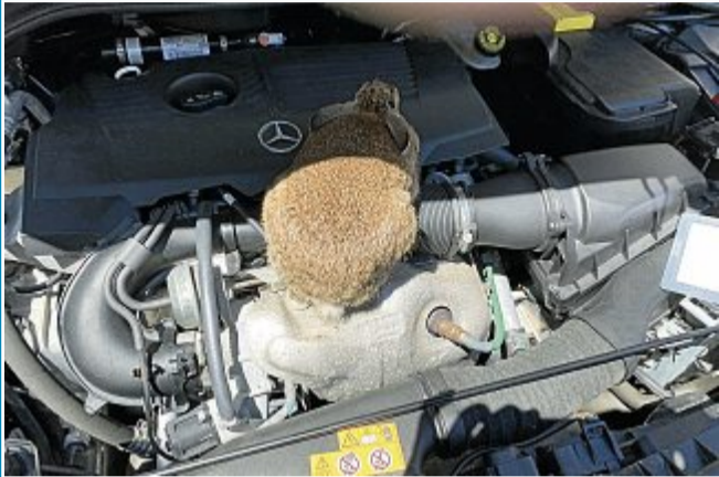
Norderneyer Kaninchen mit Vorliebe für Autokabel.