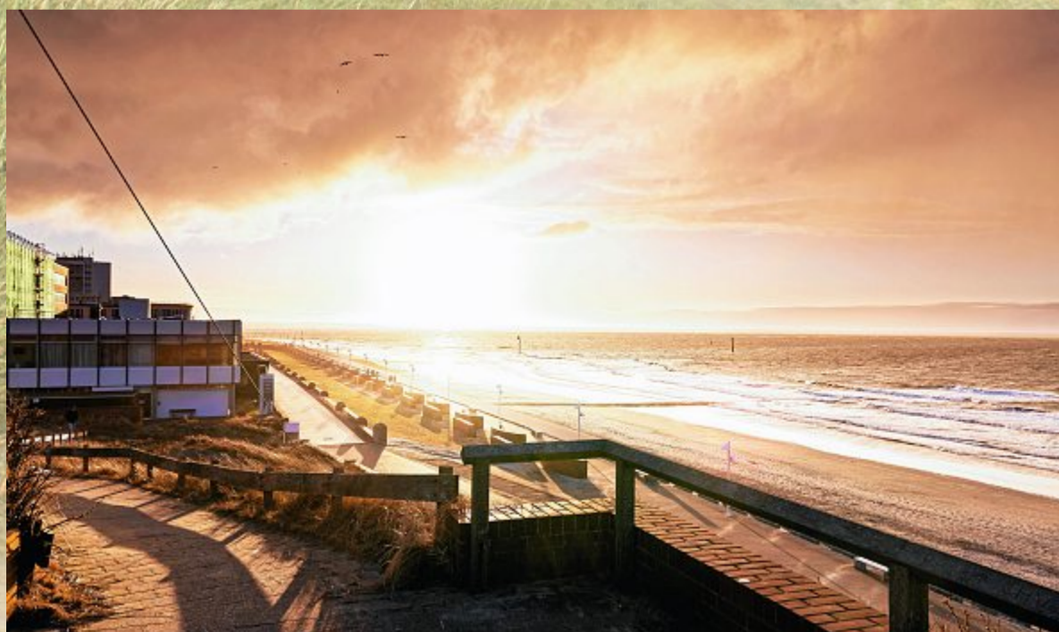
Der Blick von der Königsdüne bei speziellen Lichtverhältnissen am Wochenende.