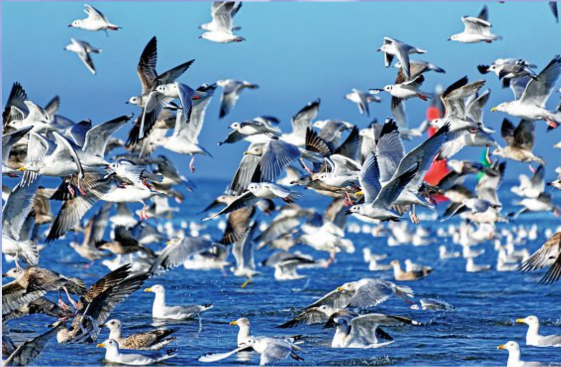
Tausende von Möwen bevölkerten in den vergangenen Wochen die Nord-Westseite.