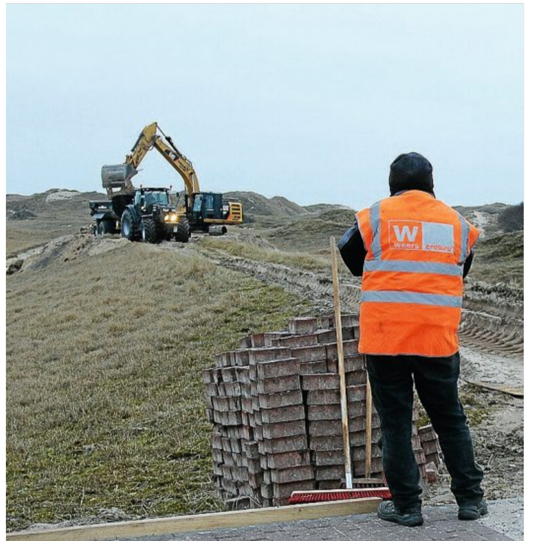
Nordöstlich des Campingplatzes Spillak schrumpft der nutzlose Sanddamm.

„Der Rückbau eines alten Dünendamms, der keine Küsten-