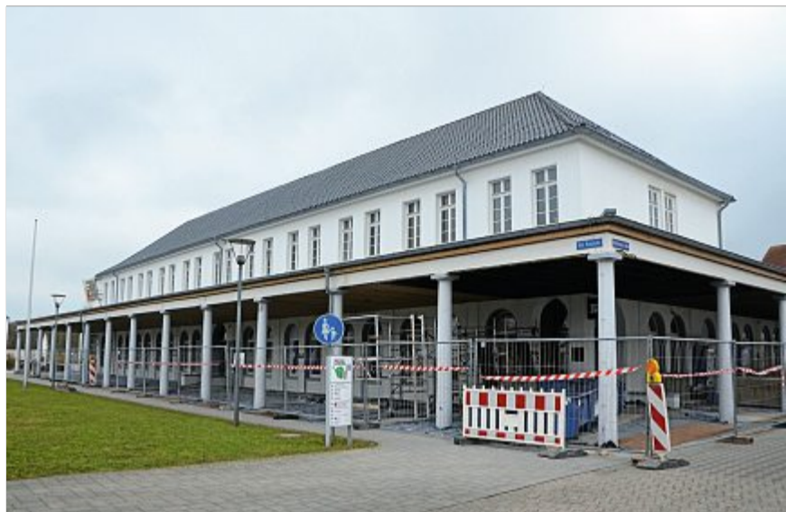
Rathaus mit Baustelle.