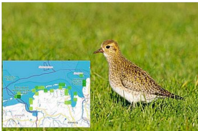
Goldregenpfeifer und die Karte seiner Verbreitung.

Die drei Organisationen haben jetzt ein Angebot geschaffen, das solche Informationen allen Interessierten zugänglich macht. Die Daten stammen aus der Online-Plattform ornitho.de, die vom DDA betrieben wird. Über 35000 Vogelkundler melden dort deutschlandweit ihre Vogelbeobachtungen, insgesamt sind