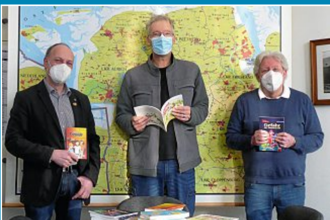
Rotary Club übergibt Lesestoff für Grundschüler.