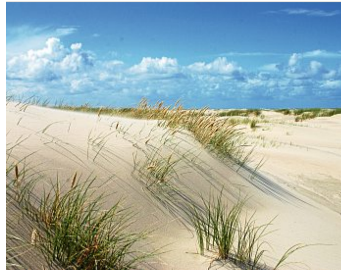
Die Besiedlung durch Pflanzen hielt den Sand zusammen.

Früher bedeckten riesige Gletscher das Land. Durch das Gewicht des Eises und seine Schubkraft sind Fels und Stein zermahlen worden und wurden dann wie durch Wasserströmungen bis nach Ostfriesland verlagert. Als die Gletscher dann, ungefähr vor 100.000 Jahren, schmolzen, blieb an der norddeutschen Küste, die damals natürlich