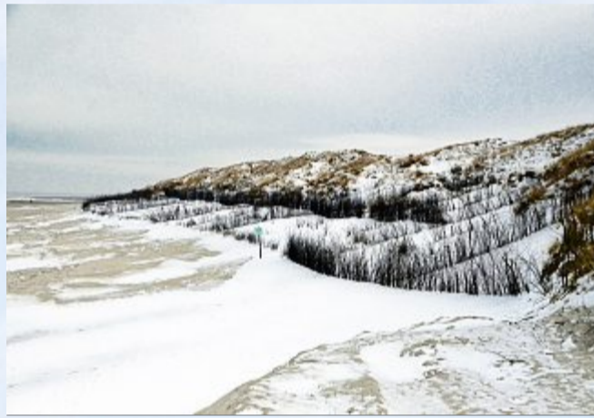
Schnee- anstelle Sandfang.