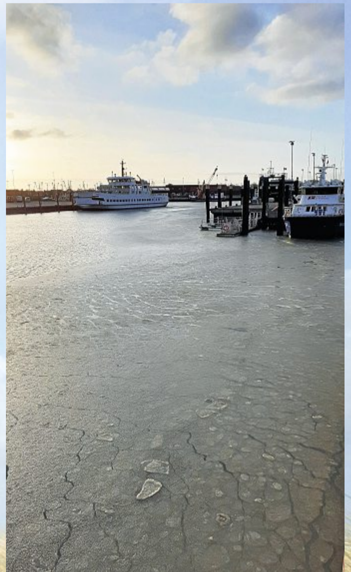
Eisgang im Hafen von Norddeich.