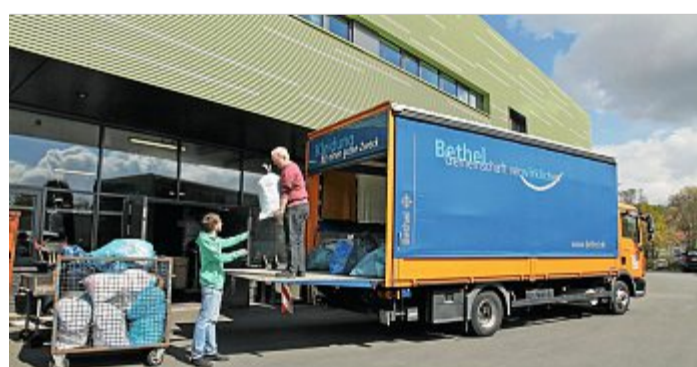
Der Abtransport nach Bethel erfolgt dann mit dem Lastwagen.

NORDERNEY – Wie die evangelisch-lutherische Kirchengemeinde Norderney mitteilt, findet am Montag, 15. Februar, und Dienstag, 16. Februar, wieder die Kleidersammlung für Bethel statt. Leere Säcke zum Befüllen liegen im Martin-Luther-Haus, Kirchstraße 11, im Eingang aus. Nur hier kann gebrauchte Kleidung in der Zeit von 8 bis 17 Uhr abgegeben werden. Sie sollte noch gut erhalten sein. Kleiderspenden können nur in die-