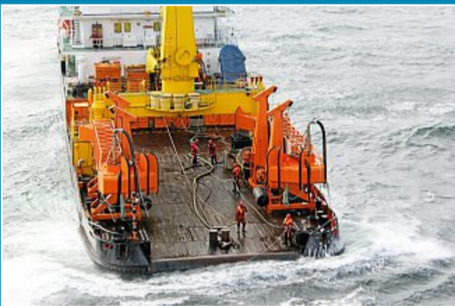
Mehrzweckfrachter vor Borkum in Seenot