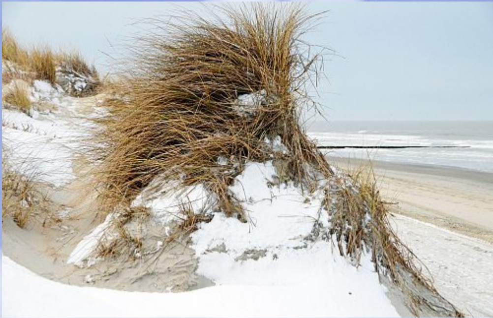
Wie eine Sturmhaarfrisur steht dieser Strandhafer im Wind.