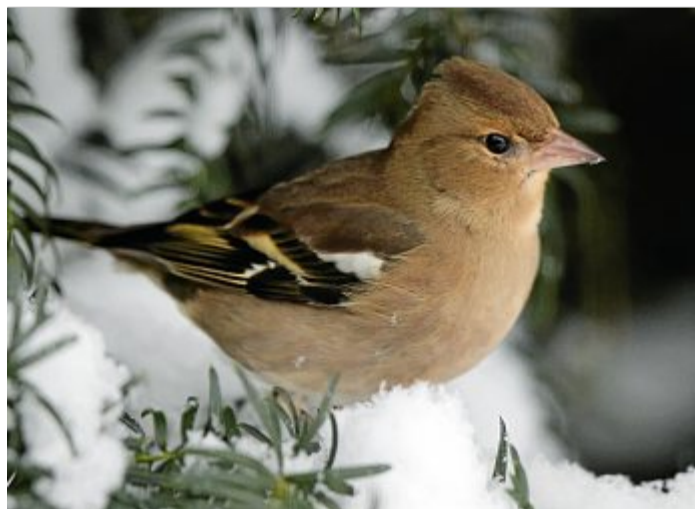
Der Buchfink. Immer auf der Suche nach Futter.

Dabei wirbt der Naturschützer jedoch dafür, Winterfütterung mit Sachverstand durchzuführen – und Hygiene zu