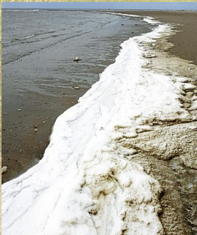
Schnee- statt Algenschäum am Flutsaum.