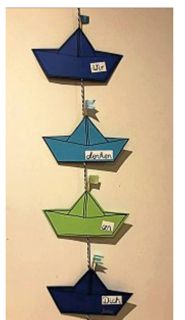
Sollen den Bewohnern des „To Huus“ in dieser Zeit ein bisschen Freude bereiten: kleine Girlanden mit Papierschiffchen.