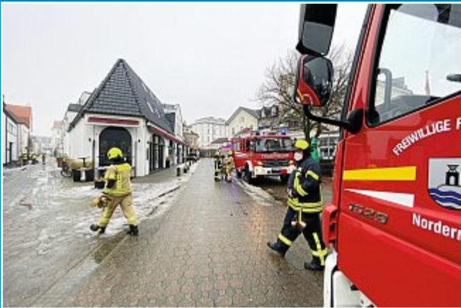
Rauchentwicklung in Spiel-O-thek.