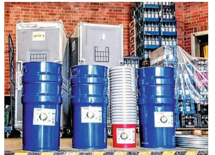
Behälter für eine halbe Million Kippen sind auf Norderney.

Ausführliche Informationen über das Wertstoffsystem TobaCycle findet man auf den Internetseiten der Firma: www.tobacycle.de .