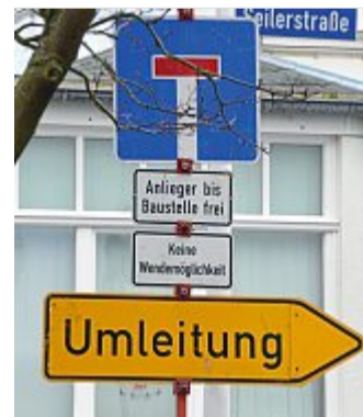
Umleitungen sind ausgeschildert.

mit mehr als 19.000 Mitarbeitern das größte Sozialunternehmen in Europa und der größte Arbeitgeber in der Stadt Bielefeld. Bethel ist eine diakonische Einrichtung, in der Menschen mit Behinderung, psychischen Beeinträchtigungen, Epilepsie, alte und pflegebedürftige Menschen, kranke Menschen, Jugendliche mit sozialen Problemen und wohnungslose Menschen betreut werden.