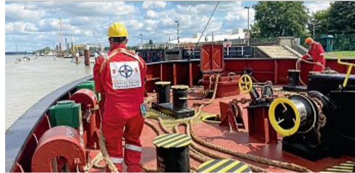
Auch für Seeleute ist die Corona-Situation problematisch.