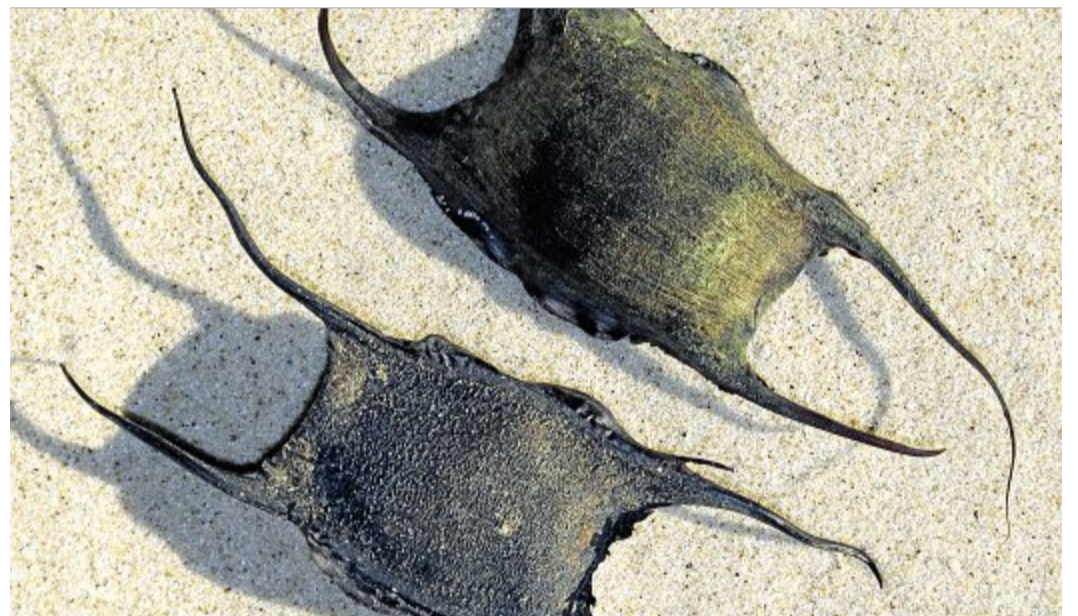
Wegen ihres Aussehens wird diese Rochenart auch als „Nixentaschen“ bezeichnet.

Die leere Hülle wird dann irgendwann an Land gespült und vielleicht von euch gefunden. Echte Rochen sind mit 17 Gattungen und über 160 Arten die größte Rochenfamilie. Anhand der Form der Eikapseln und der Länge ihrer Fäden lässt sich