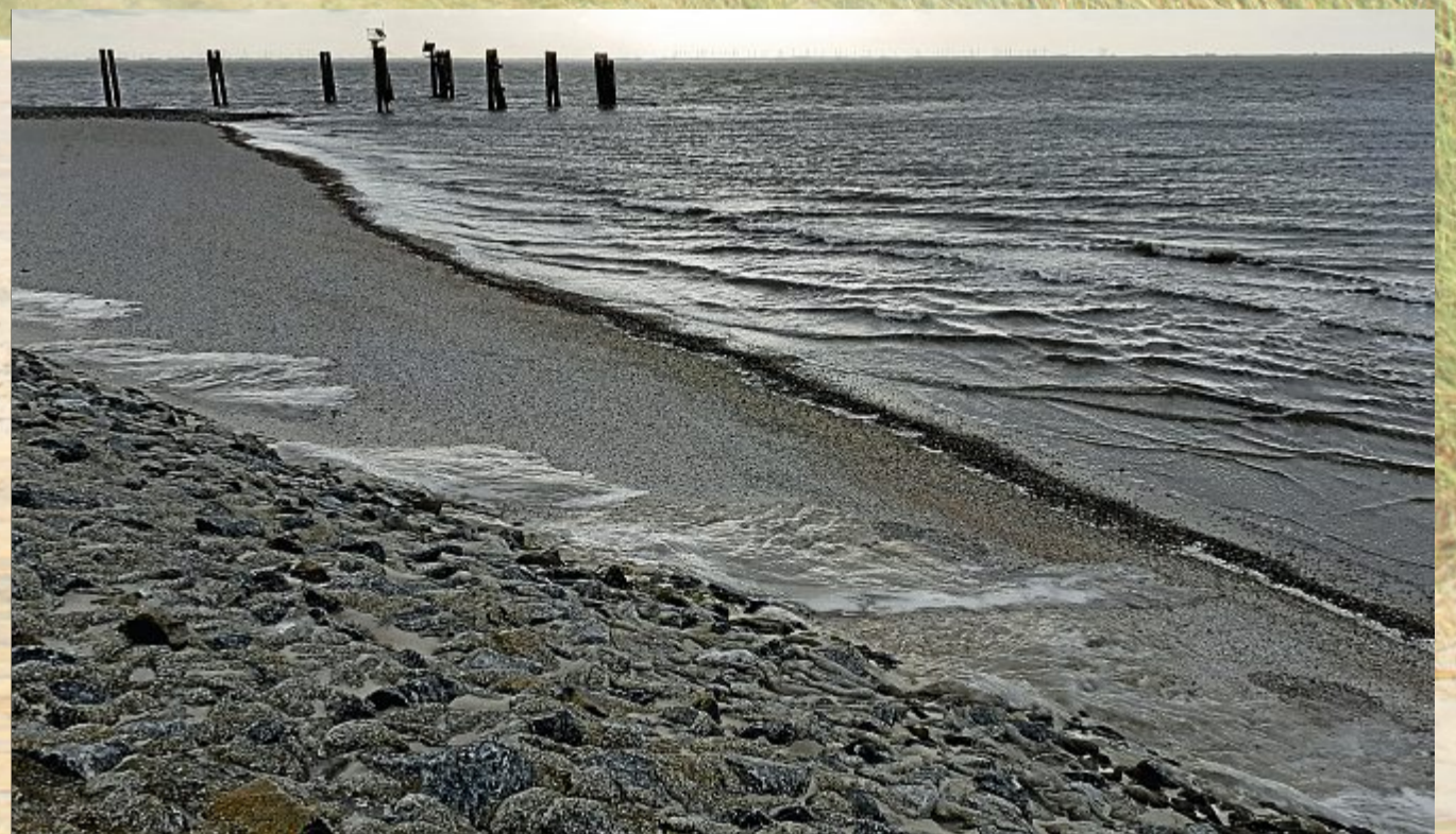
Eis- statt Goldkante gab es an den Stränden zu sehen.