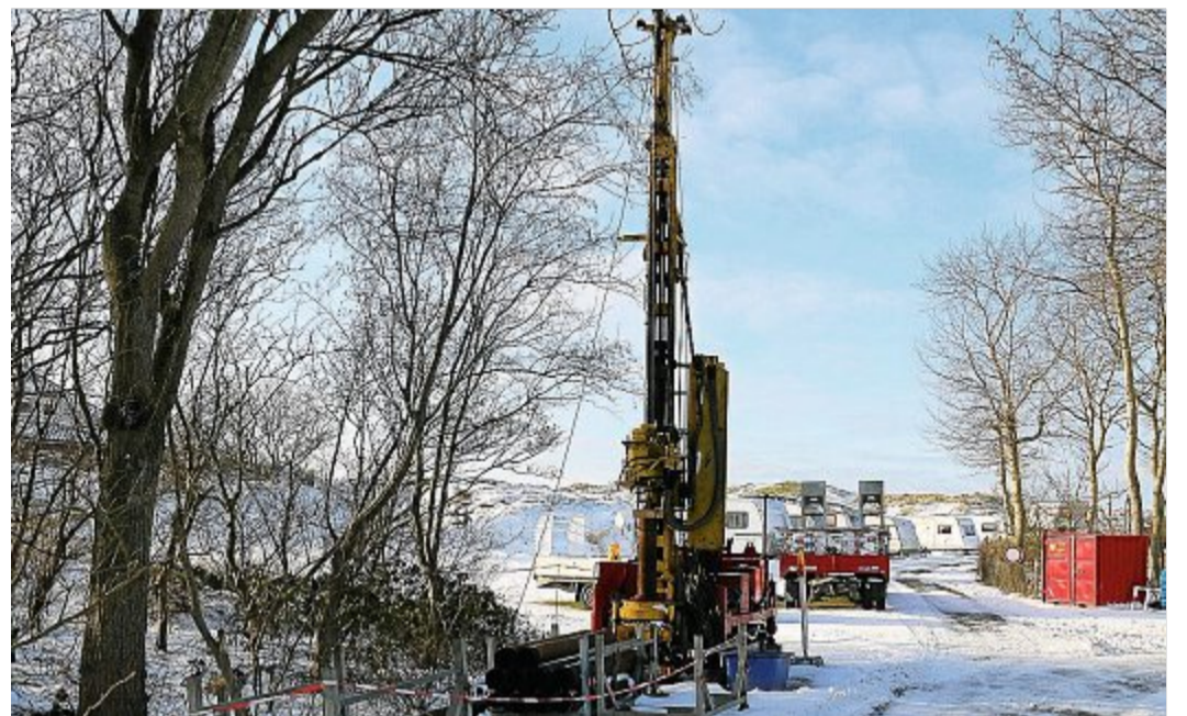
An drei Stellen werden im Insel-Osten Löschwasserbrunnen installiert.

NORDERNEY/BOS – Ein Löschwasserbrunnen ist eine künstlich angelegte Entnahmestelle für Löschwasser aus dem Grundwasser. Das Löschwasser kann durch Saugbetrieb oder mittels einer Tiefpumpe über einen Löschwassersauganschluss entnommen werden. An drei Stellen wird derzeit im Norderneyer Insel-Osten ein solcher Löschwasserbrunnen eingerichtet. An der Domäne Grohde, der Domäne Eiland und der Domäne Tünnbak, also an den Campingplätzen. Zwar gibt es dort jeweils auch Löschteiche, aber die notwendigen Wassermengen können nicht in jedem Fall gewährleistet werden, erklärt Jürgen Vißer vom zuständigen Ordnungsamt. „Wir haben uns für das Anlegen der Brunnen entschieden, da die Instandhaltung der Löschteiche langfristig sehr aufwendig ist und damit auch in der Zukunft mit hohen Kosten verbunden sein wird“, erklärt Vißer. Die ständigen Arbeiten wie Absaugungen, Rei-