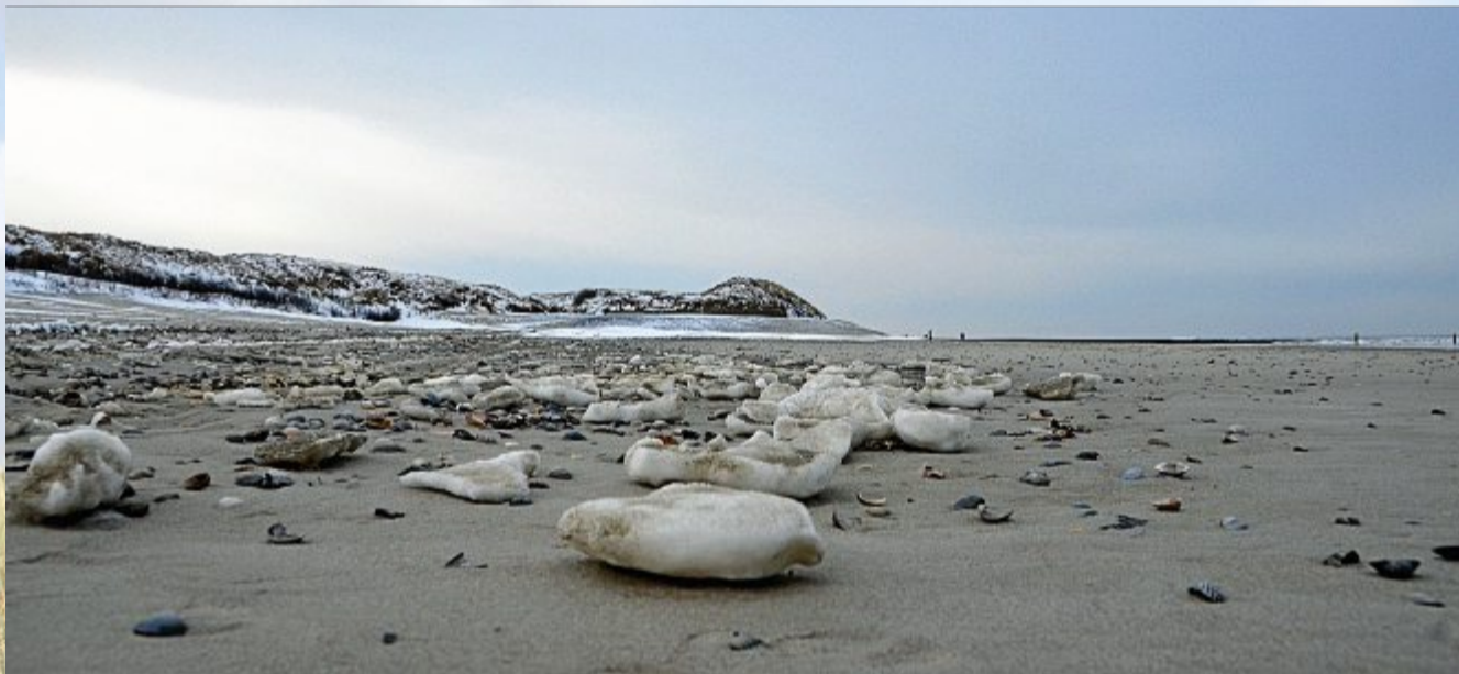
Der eisige Wind formt Gebilde aus Schnee und Eis.