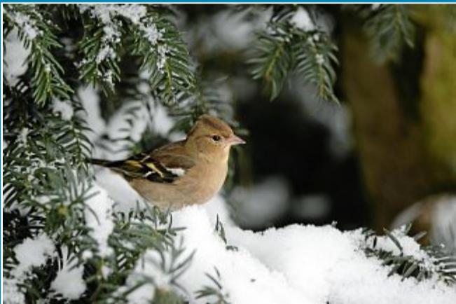
Winterfutter bei Schnee und Eis