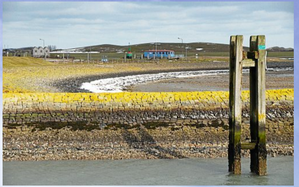
Farbspiel vor dem Spülfeld.