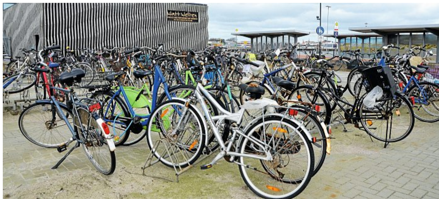
Dieser Anblick gehört ab Montag der Vergangenheit an.

Der Neubau wird 20 mal 20 Meter groß und erhält ein Dach, getragen von vier Stahlträgern. Das Gebäude erhält eine Holzlamellenkonstruktion als Außenhaut und ein begrüntes Holzdach. Das ist so konstruiert, dass es erweitert werden kann. 380 Fahrräder sollen dort künftig Platz finden. Angeschafft werden moderne Vorderradhalter, wie sie schon an der Kooperativen Gesamtschule und am Sportplatz zu bewundern sind. Sie sollen schonender für die Fel-