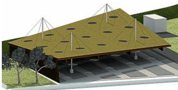
So sieht der Neubau der Fahrradabstellanlage aus.

Mit der Nationalen Klimaschutzinitiative initiiert und fördert das Bundesumweltministerium seit 2008 zahlreiche Projekte, die einen Beitrag zur Senkung der Treibhausgasemission leisten. Ihre Programme und Projekte decken ein breites Spektrum an Klimaschutzaktivitäten ab: Von der Entwicklung langfristiger Strategien bis hin zu konkreten Hilfestellungen und investiven Fördermaßnahmen.