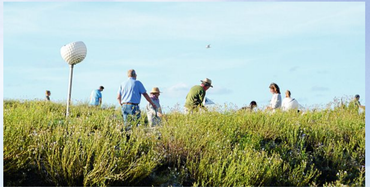
Im Herbst gilt: Jeden sonnigen Moment nutzen.