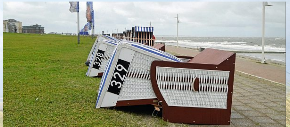
Liegend ist in Bezug auf Strandkörbe normalerweise anders gemeint.