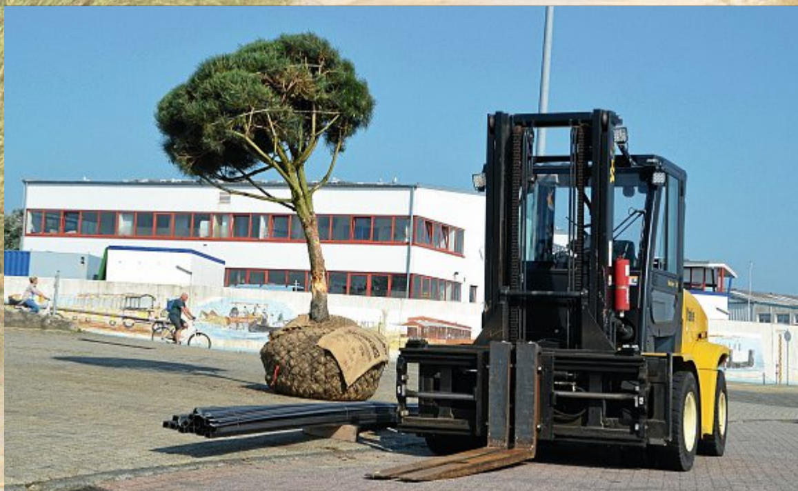
Einzelbaumlage im Hafen.