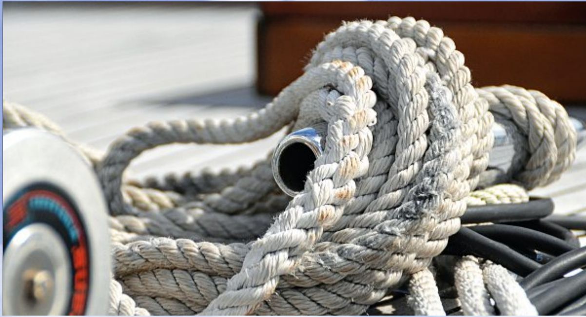
Ein maritimes Umfeld bietet immer Fotomotive.