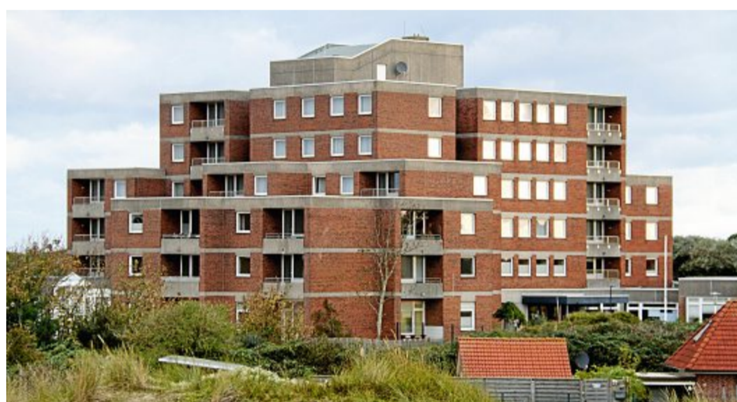
Das Kurzentrums Norderney liegt in der Benekestraße 26.