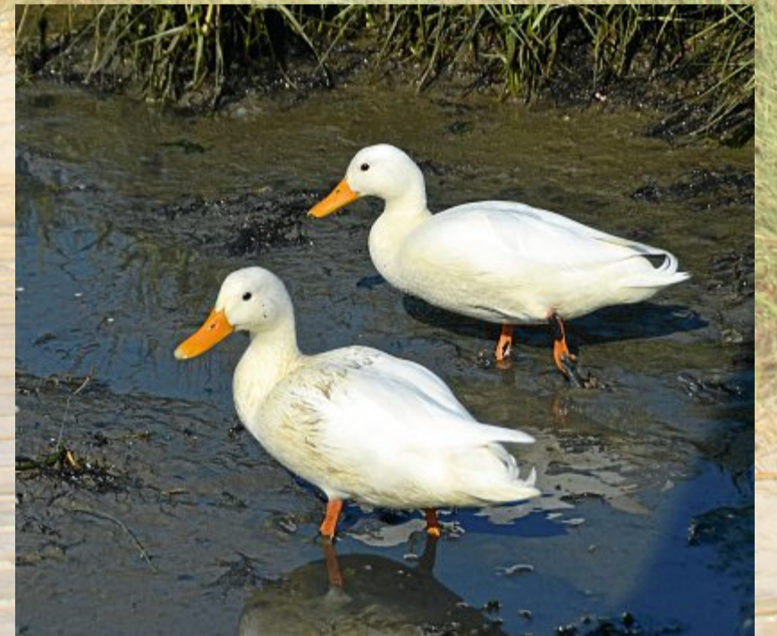
Gleich und gleich gesellt sich gern.