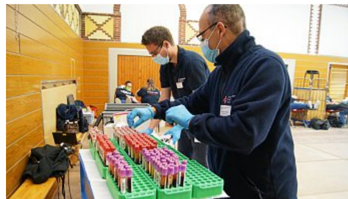
Besonders sorgfältig ist der Umgang mit den Proben.

Der nächste Blutspendetermin ist am Mittwoch, 7. April 2021.