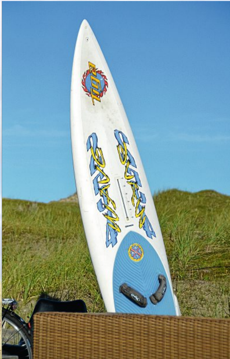
Ein Surfbrett auf Abwegen.