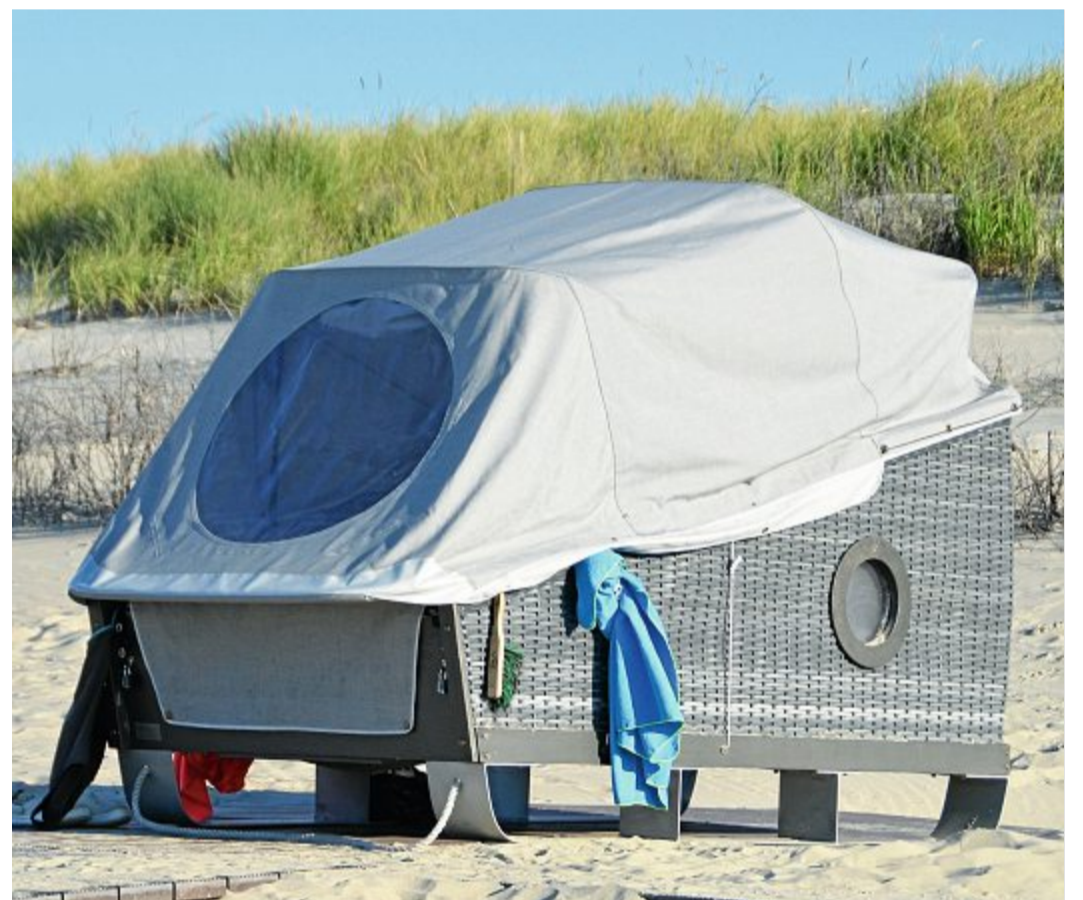
Zwölf von diesen Schlafstrandkörben würde das Staatsbad gern aufstellen.

Weiter führte der grüne Ratschherr die Müllentsorgung auf. Er kritisierte, dass geplant sei, den