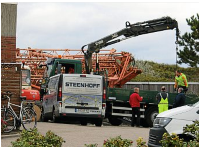
Als erstes musste ein Kran aufgestellt werden.