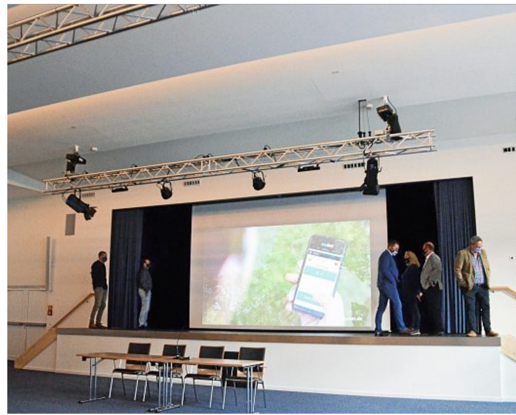
Modernste Technik und Module finden sich in der sanierten Aula wieder.

Jetzt lässt der Innenausbau staunen: Von hell bis dunkel ist alles drin. Die erweiterte Glasfassade optimiert den Lichteinfall von außen. Ist er nicht erwünscht, werden die lichtundurchlässigen Vorhänge einfach zugezogen. Blau ist der Stoff, aus dem die Träume