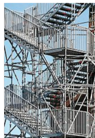
Die Notfalltreppe sorgte für Diskussionen.

NORDERNEY/BD – Der dritte Teil der Sanierung der Benekestraße hat begonnen. Bis zum 26. März 2021 bleibt der Abschnitt zwischen Schulzenstraße und Wiedaschstraße voll gesperrt. Eine Umleitung ist ausgeschildert. Die Stadt bittet die Anwohner dieses Straßenabschnittes, ihre Müllbehälter an die nächste befahrbare Straße zur Abfuhr bereitzustellen.