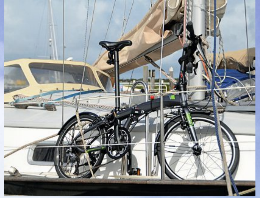
Ideales Fortbewegungsmittel für den Landgang.