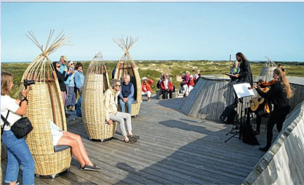
Beim „SeaSounds Festival“ begeisterten ungewöhnliche Konzertformate und -orte.