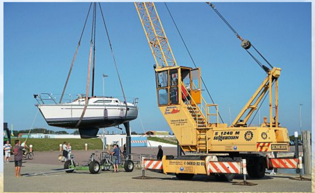
Die ersten Segelyachten verlassen das Hafenbecken.