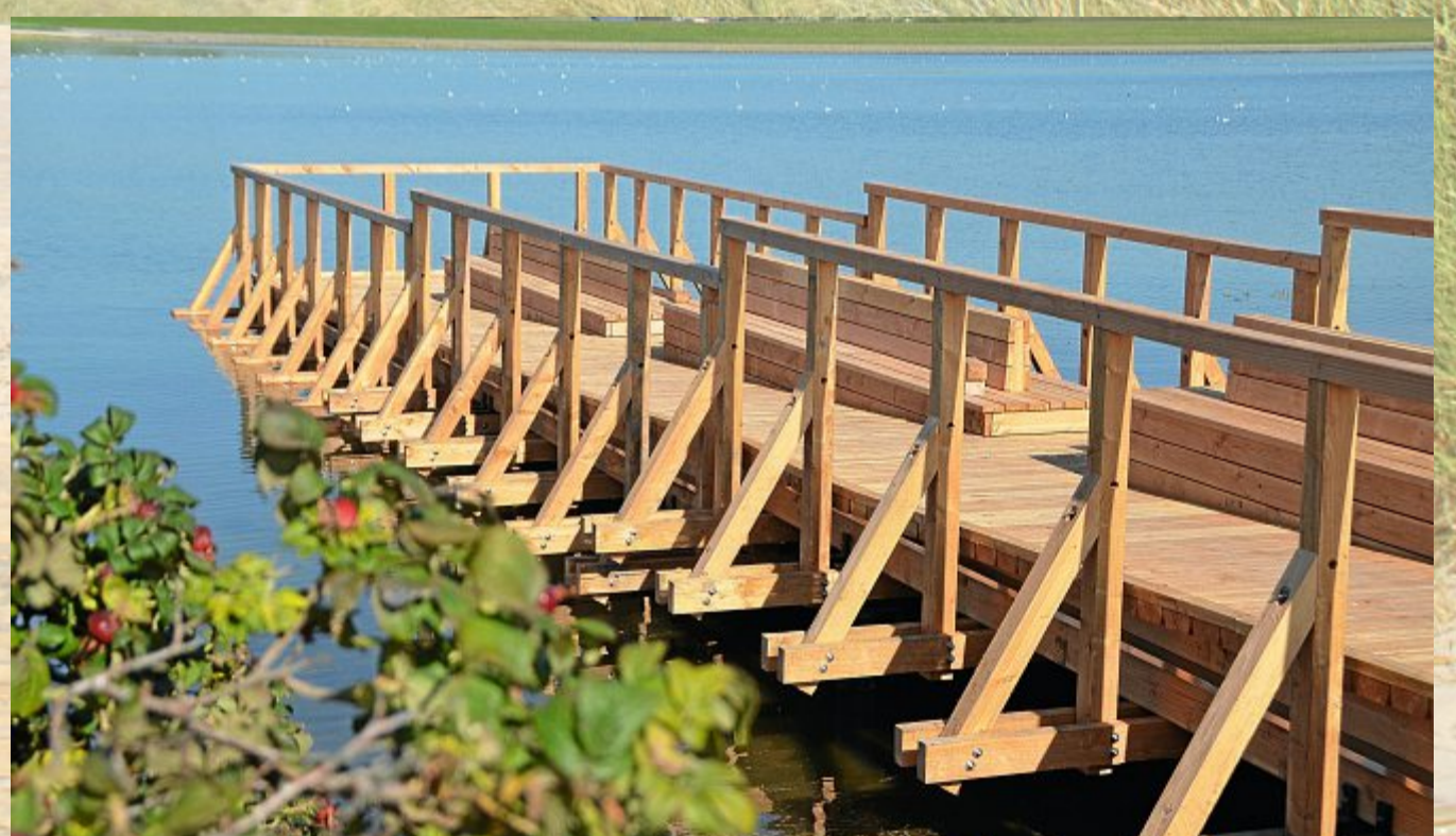
Der „Steg ins Watt“ in der Suferbucht ist fertiggestellt und darf betreten werden.