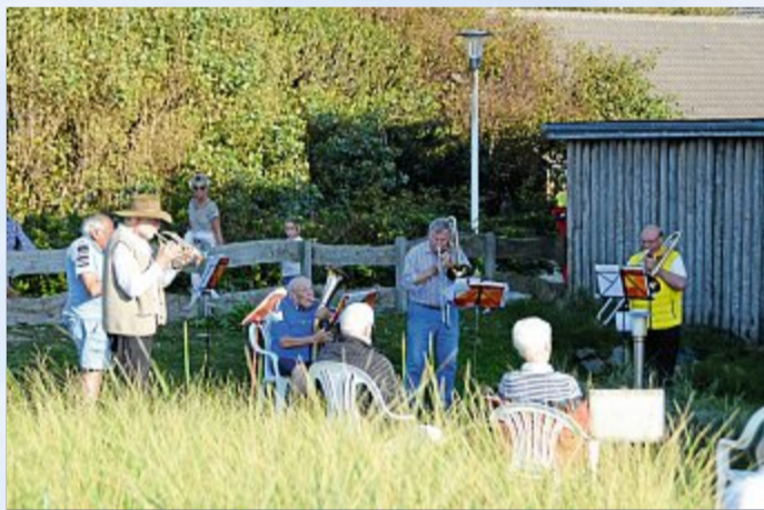
Ein Platzkonzert am „Haus am Weststrand“.