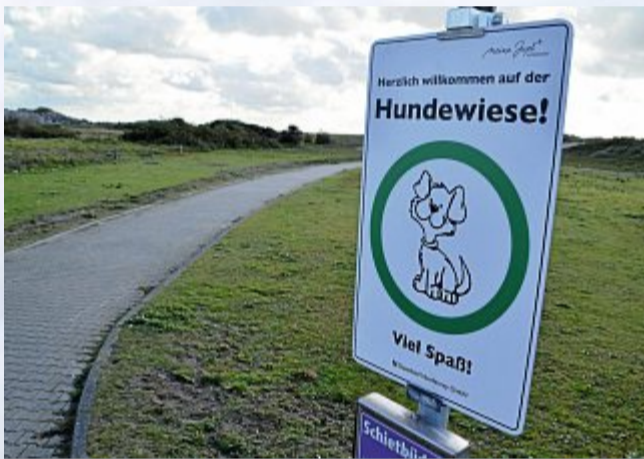
Ein neues Schild heißt Vierbeiner willkommen.