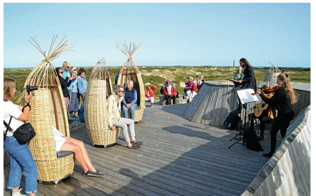
Konzertsaal besonderer Klasse: die Aussichtsplattform Dünensender.

Posth zum Auftakt der musikalischen Radtour an der Inselwindmühle „Selden Rüst“: „Ich bin heute in Doppelfunktion: Fahrradtourführer und Geschichtenerzähler.“ Mit Box im Fahrradkorb und Klemm-