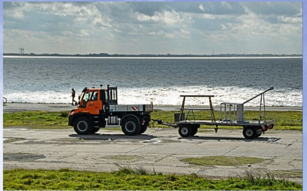
Die Beobachtungstürme der Rettungsschwimmer beziehen ihr Winterquartier.