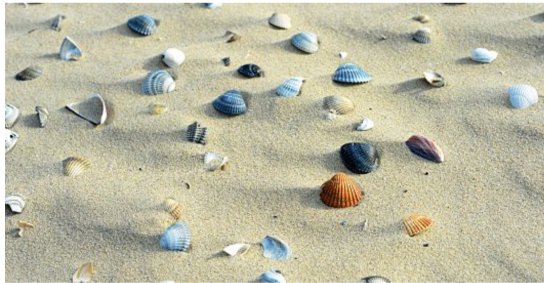
Es gibt viele Muscheln im Wattenmeer zu entdecken.

Das wirklich Außergewöhnliche an der mattweißen Muschel wird schon bei der Betrachtung des Namens deutlich. Sie ist nämlich in der Lage, sich in Materialien hineinzubohren, bei denen andere Muscheln der Nordsee und des Wattenmeers schon lange aufgegeben hätten. Dazu gehören zum Beispiel Holz oder Torf. Für eine circa fünf bis sieben Zentimeter lange Muschel ist das schon eine ganz schöne Leistung. So ist die Amerikanische Bohrmuschel vielleicht