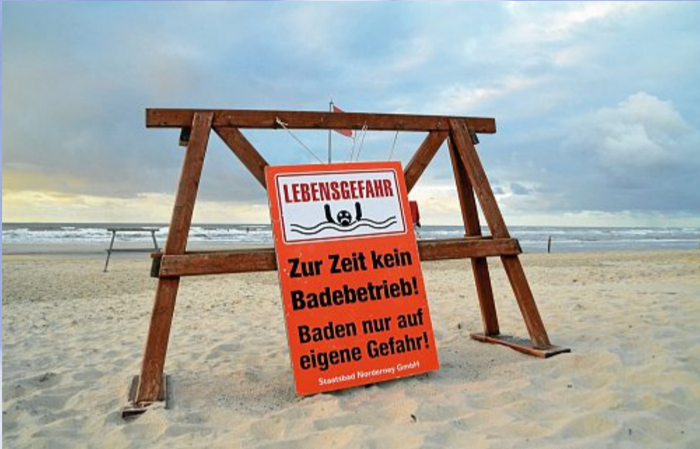
Ein Schild, das nicht zum Spaß aufgehängt wird.