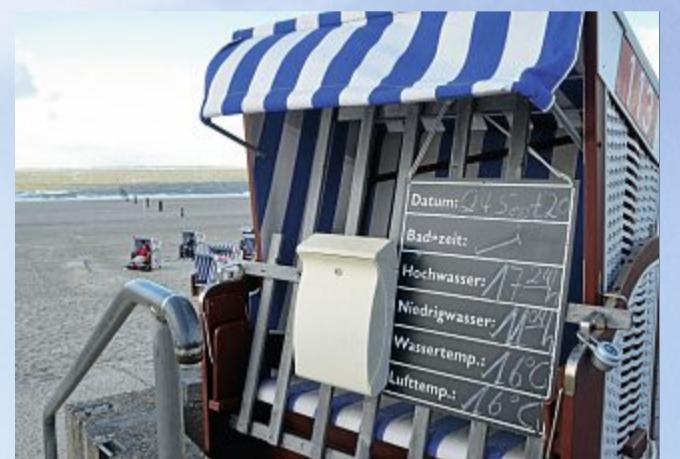
Die idealen Badewettertemperaturen sinken.