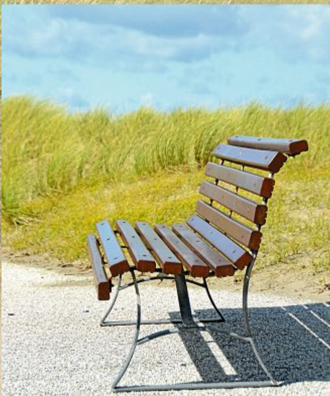
Jetzt heißt es, jede sonnige Minute zu nutzen.