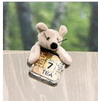
Manchmal müssen die Kinder ganz genau hinschauen, um „Tippi“ in der Ausstellung zu entdecken.