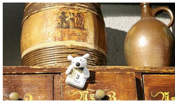
An verschiedenen Orten im Teemuseum hat sich die Museumsmaus „Tippi“ versteckt.