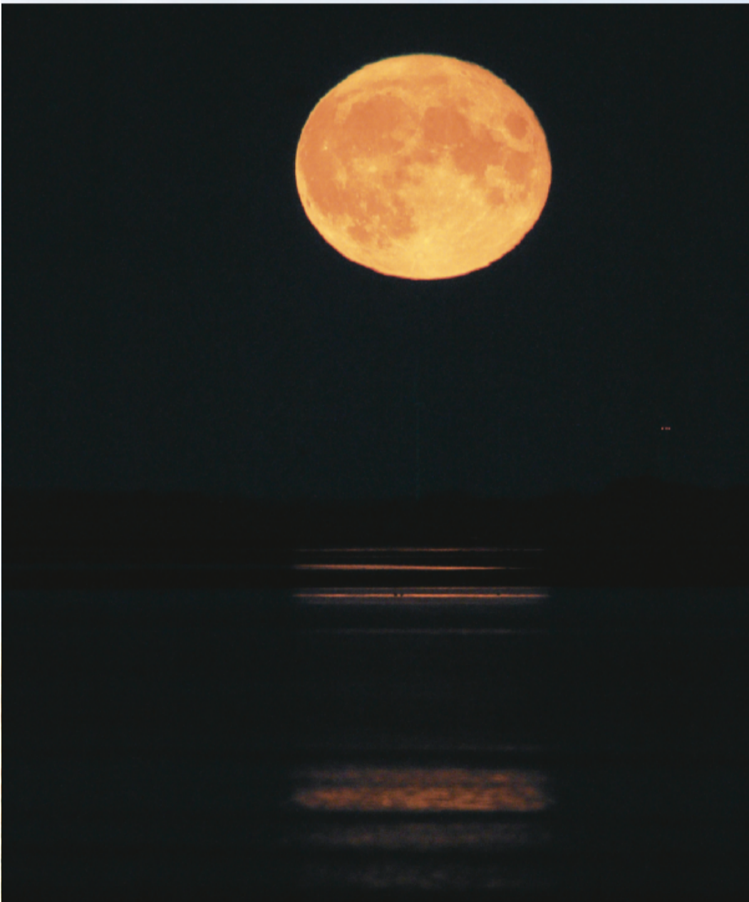
In klaren Nächten überrascht der Mond mit seinem Farbenspiel.