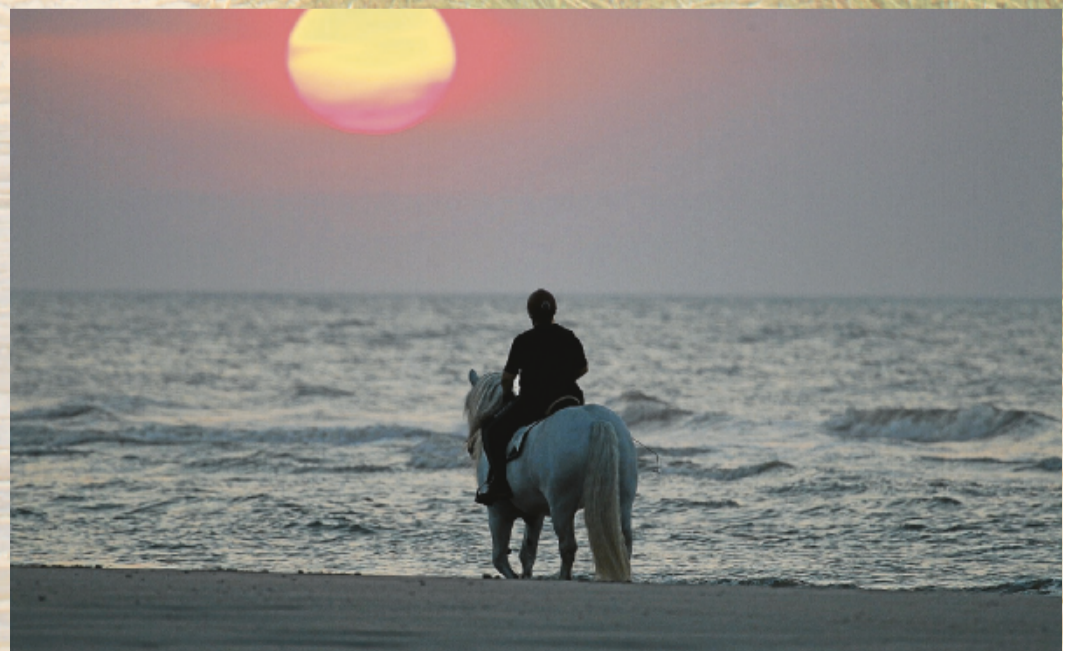
Das Rauschen der Wellen entspannt Pferd und Reiter.