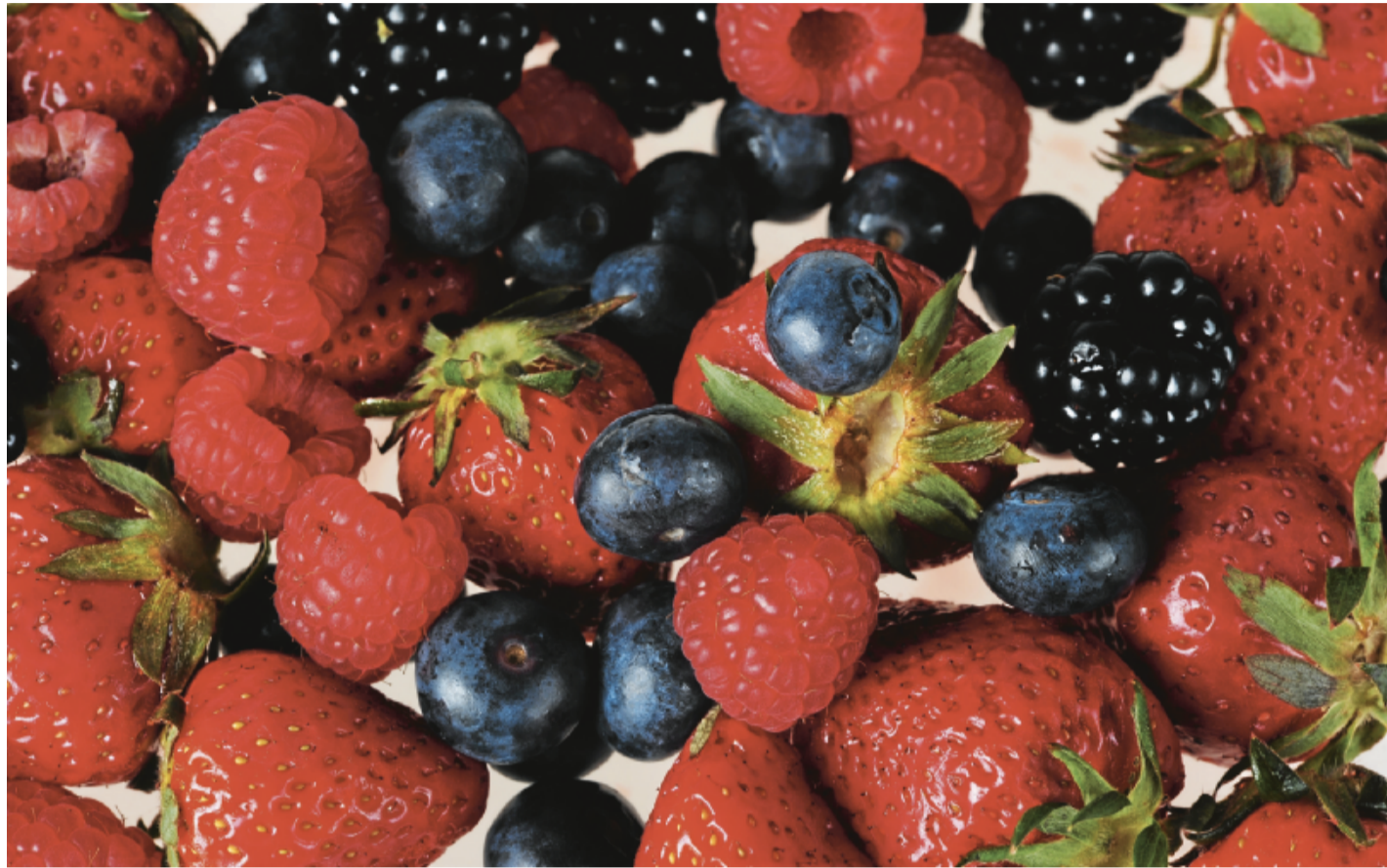
Eine gesunde und abwechslungsreiche Ernährung spielt auch im Alter eine große Rolle.

Bei den lebensnotwendigen Nährstoffen, wie den Vitaminen C und D oder dem