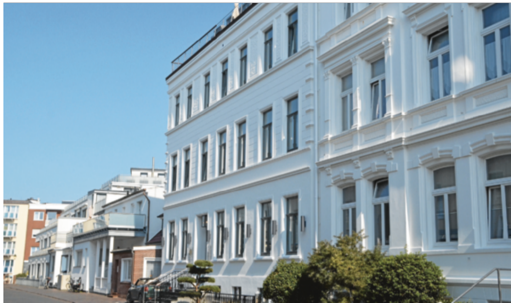
Bei diesem Gebäude wurde der Denkmalschutz missachtet.

Ein Kaufmann aus Aurich hatte 2017 ein mehrstöckiges Gebäude aus dem 19. Jahrhun-