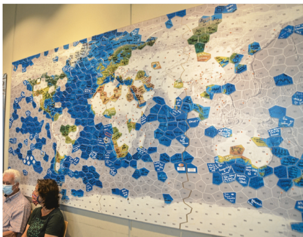
Noch sind Lücken auf dem Weltkartenpuzzle.

Gerechnet werden natürlich nicht nur die Sieben Weltmeere mit ihren Unmengen an Wasser. Auf der Erde verteilt gibt es einige Seen, die wahre Giganten sind. Das Kaspische Meer mit seinen 386 000 Quadratkilometern beispielsweise ist mit Abstand der größte See überhaupt und liegt in West-Asien und dem äußersten Osteuropa, grob gesagt zwischen Aserbaidschan und Turkmenistan. Eins hat der riesige See allerdings gemeinsam mit den Meeren, der Nordsee, um zurück nach Norderney zu kommen: Sein Wasser ist salzig, allerdings in unterschiedlicher Intensität,