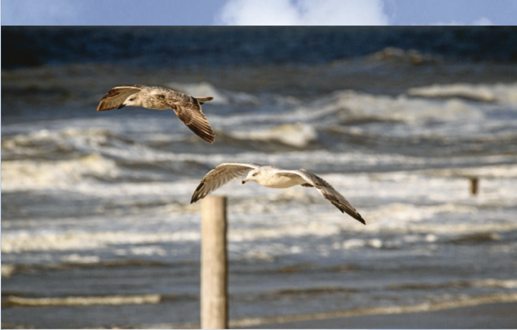
Zu zweit macht das Herumfliegen einfach mehr Spaß als allein.