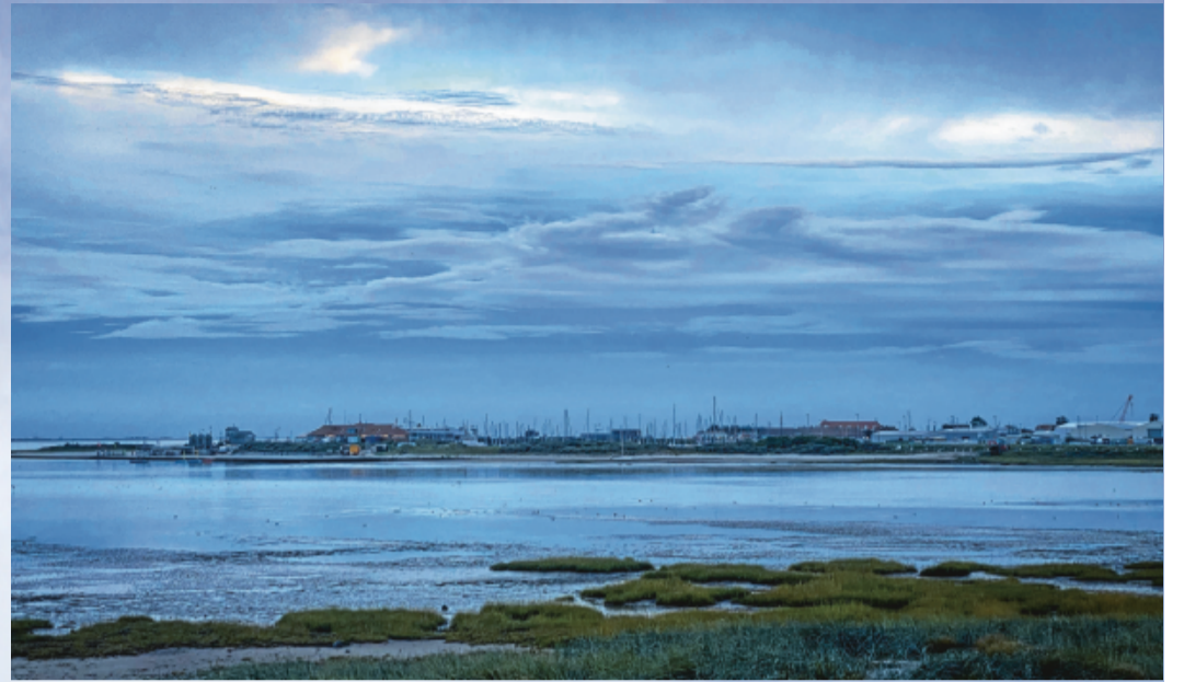
Die blaue Stunde wirkt auch auf Norderney magisch.