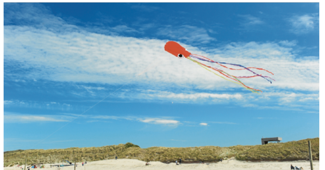
Die bunten Drachen am Himmel können von Vögeln für Greifvögel gehalten werden. Darum solltet man sie nur weit entfernt von Schutzzonen steigen lassen.

Auch, wenn ihr Menschen dabei keine bösen Absichten habt – wenn ich einen Gleitschirm oder Drachen am Himmel sehe, denke ich, dass dort ein großer Greifvogel in der Luft ist, der sich schnell von oben nach unten und von rechts nach links bewegt. Selbst, wenn gar keine direkte