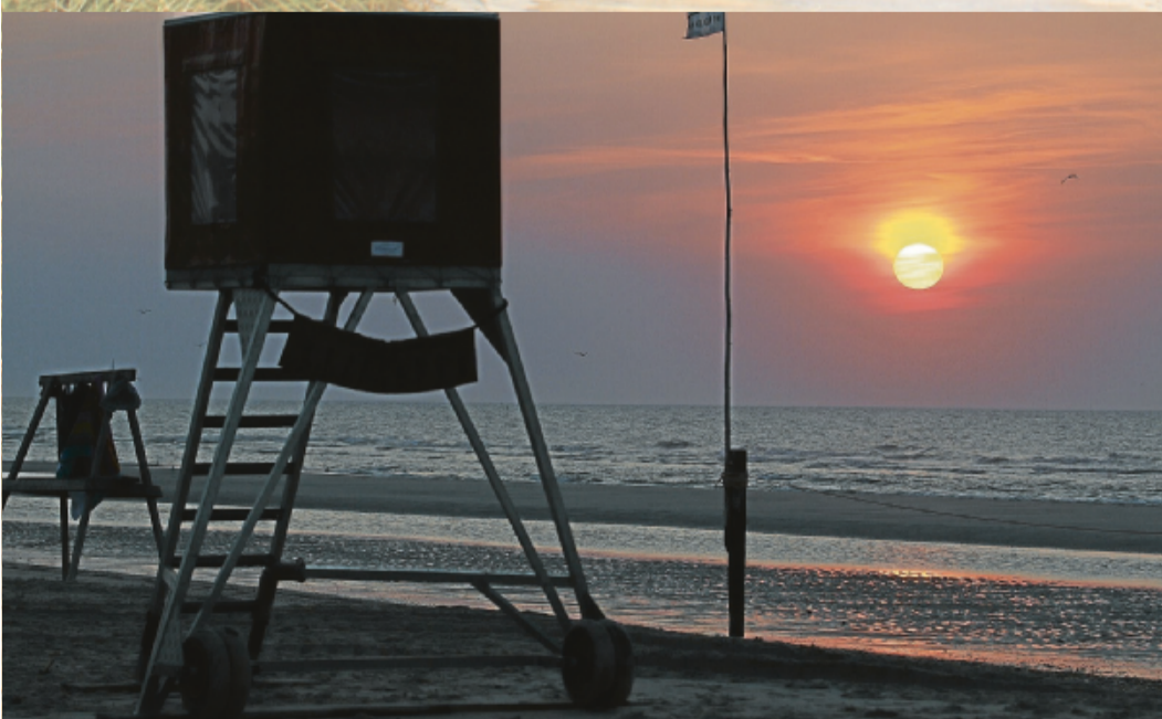
Romantik pur am Strand.