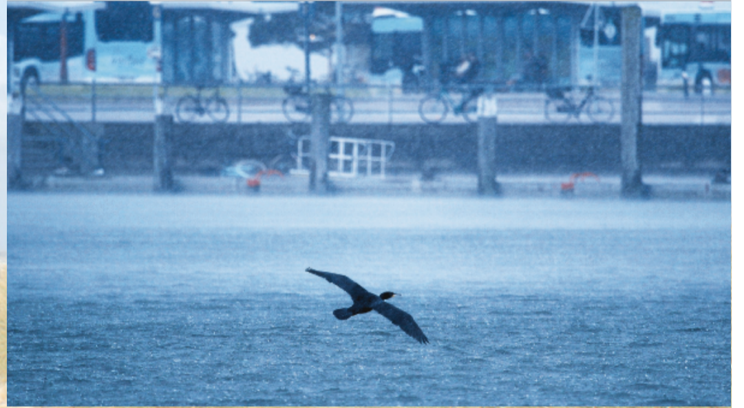
Auch Kormorane kann man mit etwas Glück auf Norderney beobachten.