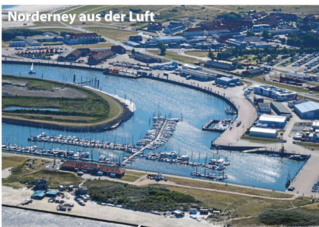
Die Bestellnummer lautet: Norderney Kurier 2038.

Jetzt wisst ihr Bescheid. Bis zum nächsten Mal, Euer Konrad