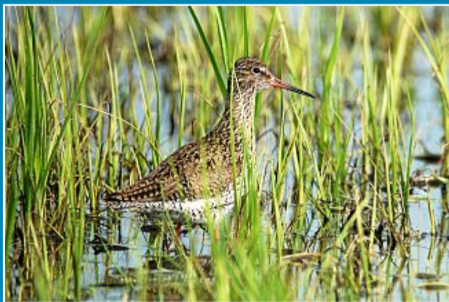
Zugvögel sind auf dem Weg in ihre südlichen Überwinterungsgebiete.

9. September: Rückzug der Vögel hat begonnen