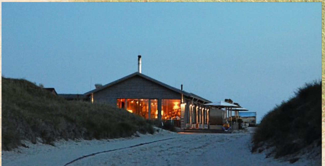
Jetzt beginnen die gemütlichen Stunden drinnen..