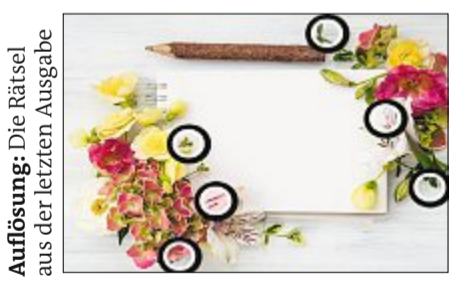
Auflösung: Die Rätsel aus der letzten Ausgabe