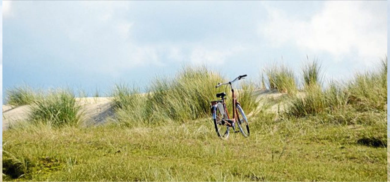
Uuups, ein Fahrrad in den Dünen des Nationalparks.