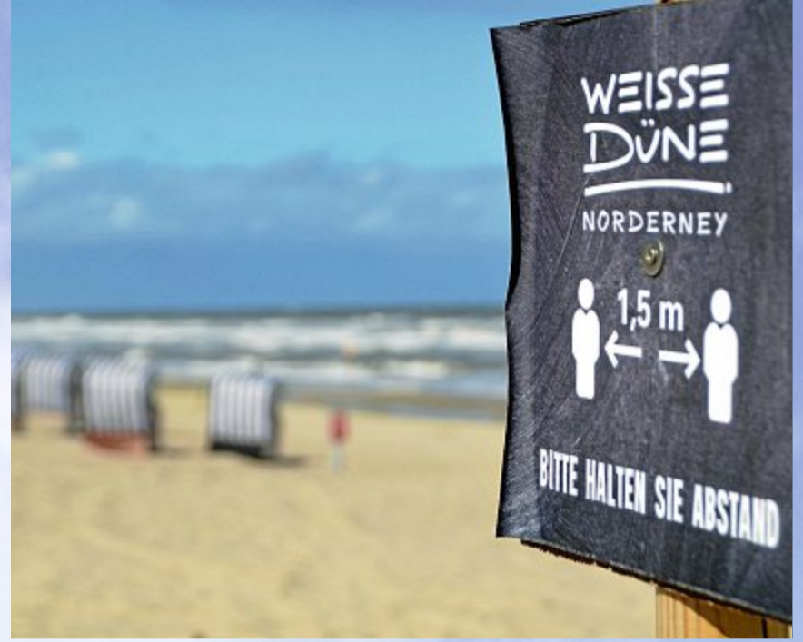
Nach wie vor das Gebot der Stunde: Abstand halten!