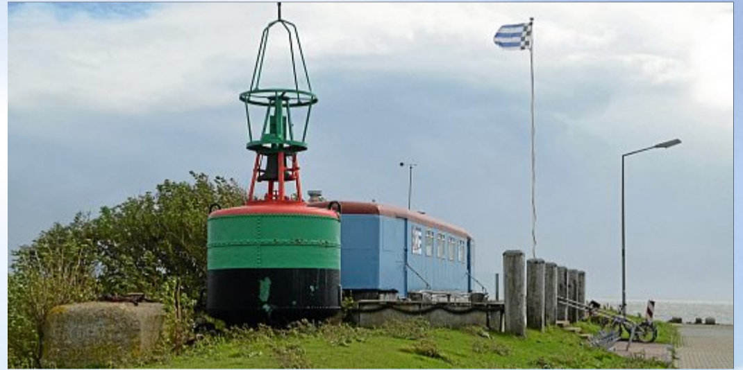
Farbenspiel zwischen Sportboothafen und Surferbucht.