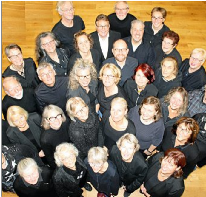
Existiert seit 50 Jahren: die Norderneyer Kantorei.

Die Musiker aus dem Kreis für Alte Musik und dem Posaunenchor können sich freuen: Sie dürfen in voller Besetzung im Gemeindehaus proben. Natürlich muss der Mindestabstand von 1,5 Metern zu jeder Zeit gewahrt,