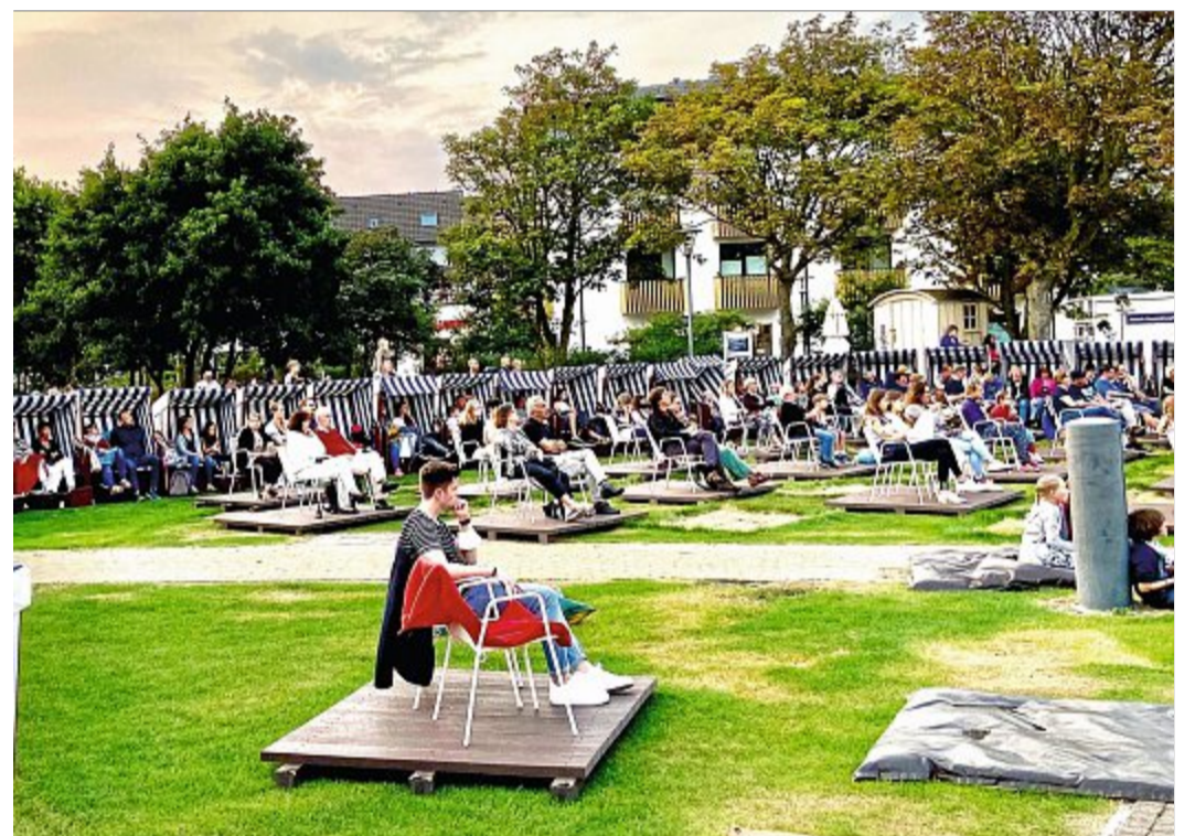
Der Kino-Abend des Lions Clubs im August.

Der größte Teil stamme aus den Einnahmen von Filmvorführungen auf dem Kurplatz, präzisierte Majert. Der Rest resultiere aus einer Weinprobe im Kurgarten. „Das waren gelungene Ver-