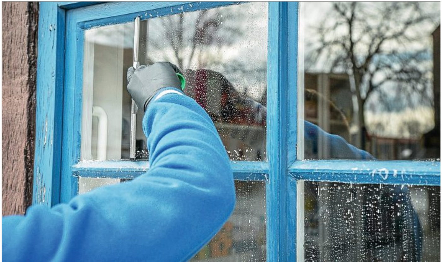
Damit auch im Herbst ein ungetrübler Blick nach draußen gewährt werden kann, bietet es sich an, nach dem Sommer die Fenster zu putzen.

Für eine schlieren- und streifenfreie Reinigung der Glasflächen ist in der Regel die Verwendung von Wasser mit Geschirrspülmittel oder von speziellen Glasreinigern in Sprühflaschen ratsam. Je nach Verschmutzung werden die Glasreiniger aus den Sprühflaschen direkt auf die zu reinigende