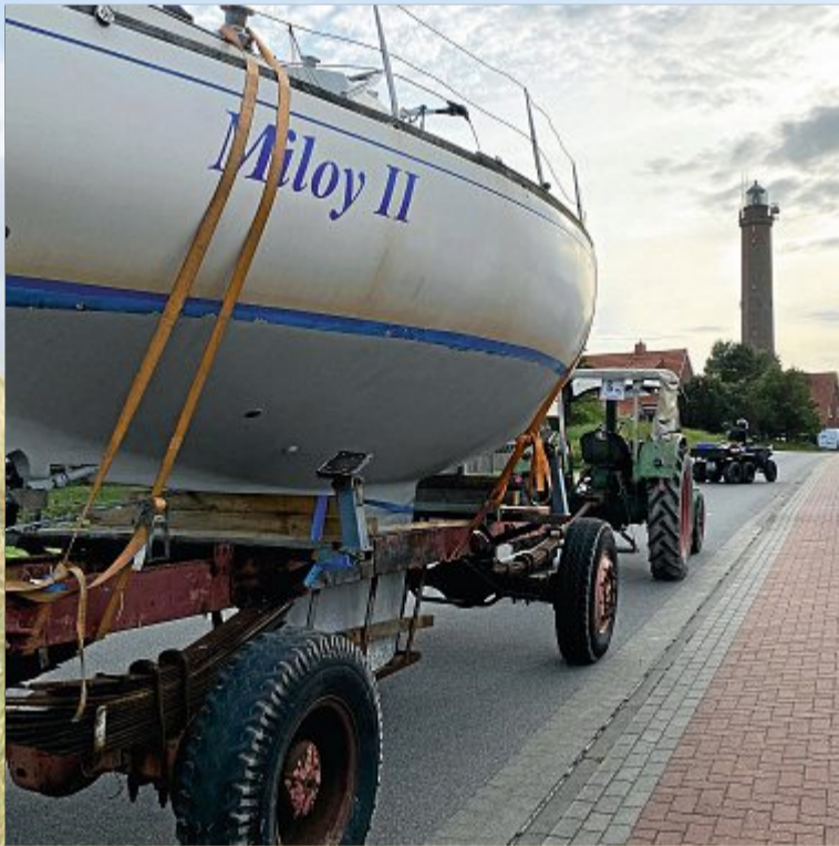
Die Miloy auf dem Weg zum Hafen.