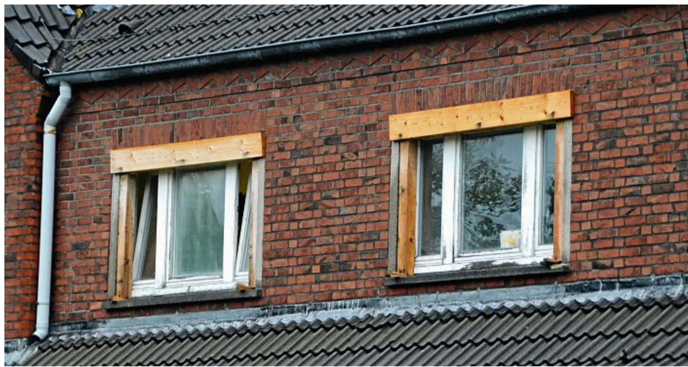
Am Gebäude der Forschungsstelle Küste wurde bereits mehrfach geflickt.

Weiter heißt es: „In der Sache sind wir verwundert. Wenn man das Gebäude der Forschungsstelle wirklich sorgfältig untersucht hat, kannte man dessen Zustand doch, der für eine Übergangszeit ja als durchaus noch tauglich erachtet wurde. Nun soll auf einmal alles anders sein! Was hat sich geändert? Das Haus mag von außen nicht den besten Eindruck erwecken; dass es allerdings nicht mehr sicher sein soll, erscheint kaum glaubhaft. Für einen nunmehr kurzfristig beabsichtigten Umzug der Einrichtung kann man kein Verständnis aufbringen. Dieser