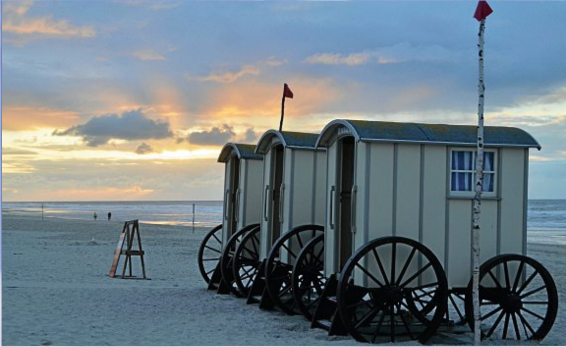
Abendidylle an der Weißen Düne.