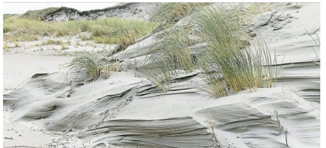
Die Dünen auf Norderney werden vom Wind gebildet.

Sandhaufen auf der Insel bilden Lebensraum für Pflanzen und Tiere