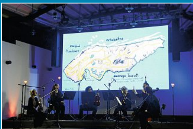
Das „Orchester im Treppenhaus“ beeindruckt die Zuhörer mit seiner Darbietung.

10. September: Seasounds Festival eröffnet