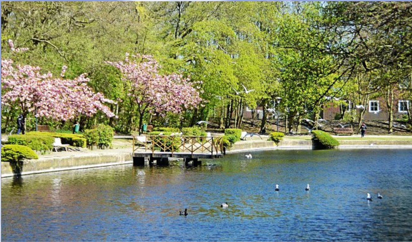
Frühling lässt sein blaues Band flattern durch die Lüfte ... hier am Schwanenteich.