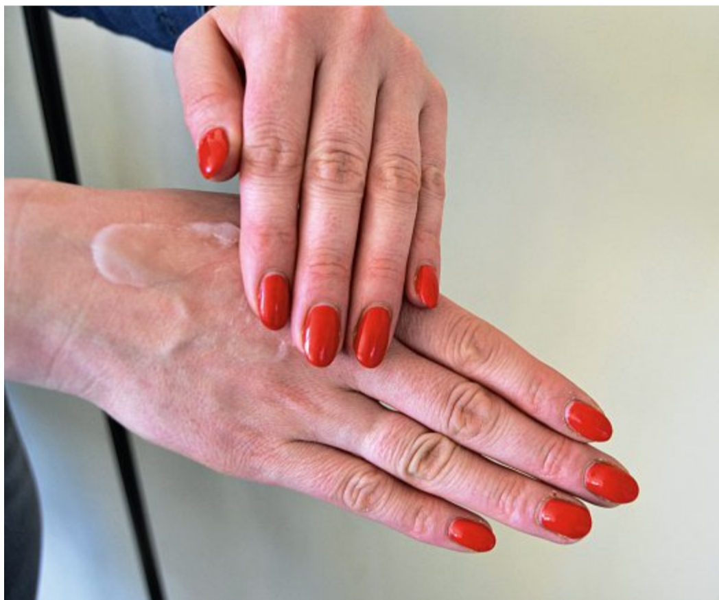
Das regelmäßige Eincremen schützt die Hände vor rissiger und schuppiger Haut.

Ein Handekzem macht sich meist durch schuppige, rissige Haut, Entzündungen und Juckreiz bemerkbar. Besonders verbreitet ist die Erkrankung in bestimmten hautbelastenden Berufen. Doch auch Hobbyhandwerker, die ihre Hände durch Bau- oder Renovierungsarbeiten ohne ausreichenden Schutz stark beanspruchen, sind gefährdet. Kommen hautreizende oder giftige Stoffe wie zum Beispiel Säuren oder Laugen ins Spiel, besteht die Gefahr eines toxischen Handekzems. Derzeit ist besondere Vorsicht geboten, da die Hautbarriere durch das häufige, gründliche Händewaschen stark angegriffen ist und Schadstoffe leichter in die Haut eindringen können. Zahlreiche Baustoffe wie Zement, Holz, Far-