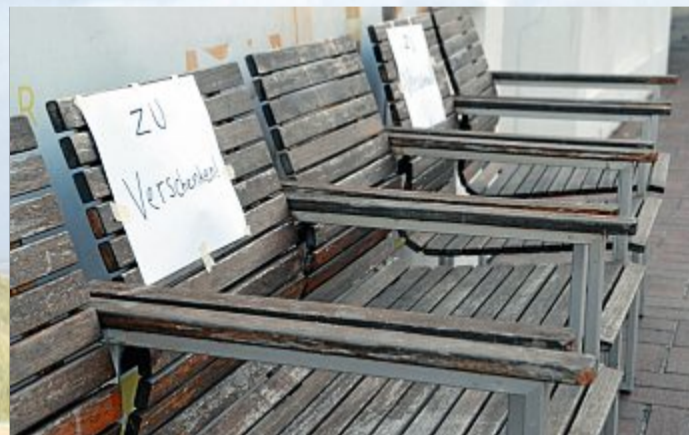
Insulaner nutzen die Zeit zum Ausmisten.