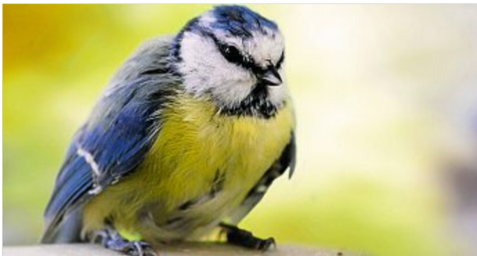
Viele Blaumeisen sterben an einer Lungenentzündung.

Der Erreger sei jeweils aus den inneren Organen der Tiere isoliert worden, hieß es von der Behörde. Demnach handelt es sich um ein Bakterium, das 1996 in England und Wa-