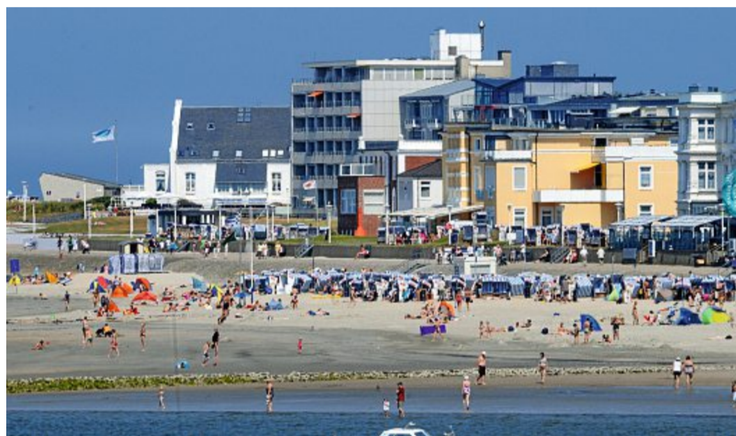
Der Strand voller Leute scheint ferne Zukunftsmusik zu sein.

„Dass Tourismus nicht zu allervorderst notwendig ist in einer Krise, ist uns völlig bewusst“, sagte der Kurdirektor und kritisiert: „Die Landkreise, die hier zuständig sind für unsere Region, sind nicht in der Lage gewesen, ein Nordseedach zu bilden. Das fällt uns heute auf die Füße. Es findet viel gut gemeinter Aktionismus statt, der aber unkoordiniert ist. Es gibt keinen, der mal zum Wirtschaftsminister geht und sagt: „darüber müssen wir dringend mal reden.“ Und ja, auch Unternehmen wie beispielsweise das Staatsbad können pleite gehen,