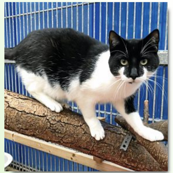
Name: Rhodos Rasse: EKH Geburt: zirka Mai 2019 Geschlecht: männlich, kastriert

Weitere Tiere finden Sie auf der Homepage des Tierheims unter www.tierheim-hage.de und unter www.norden.de .