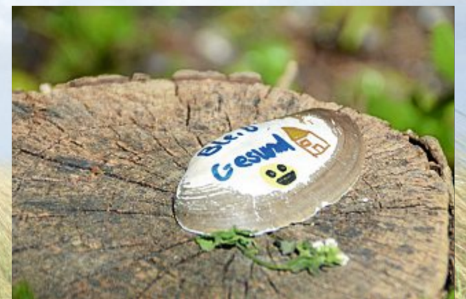
Mit guten Wünschen versehen wurde diese Muschel.