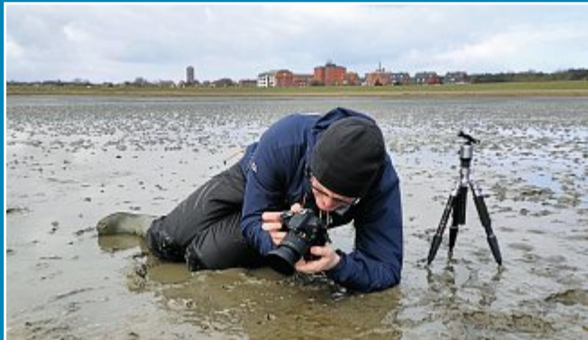
Ökologie Wenn die Natur Ehrensache ist – Freiwilligendienst auf Norderney.