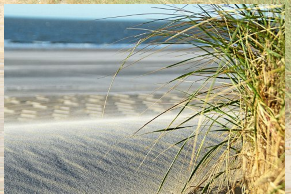
Der scharfe Ostwind schuf viele Sandverwehungen.