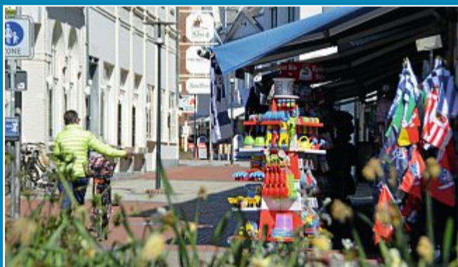
Wirtschaft Wenigstens die Pacht reinbekommen – Einzelhandel hat wieder geöffnet.