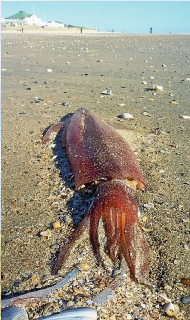
Gut 50 Zentimeter mass dieser Norddische Kalmar.