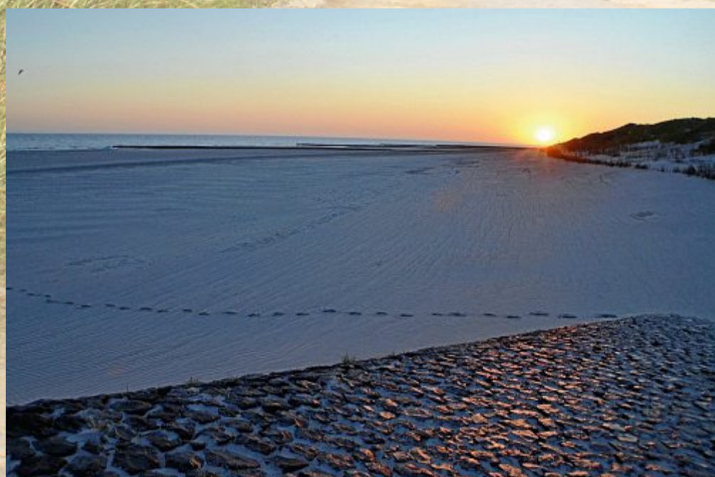
Früh auf den Beinen.