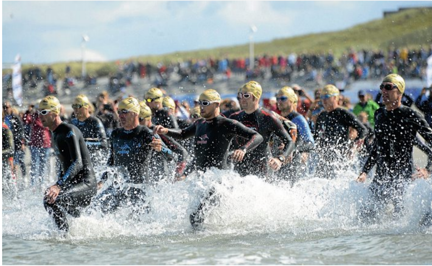
Der Islandman am 5. September findet nach derzeitigem Stand statt.

Bezüglich der Summertime @Norderney greife der Beschluss ebenfalls. Die Konzertreihe wird deshalb vom Veranstalter auf nächstes Jahr verschoben. „Das Event im kommenden Jahr ist vom 28. Juli