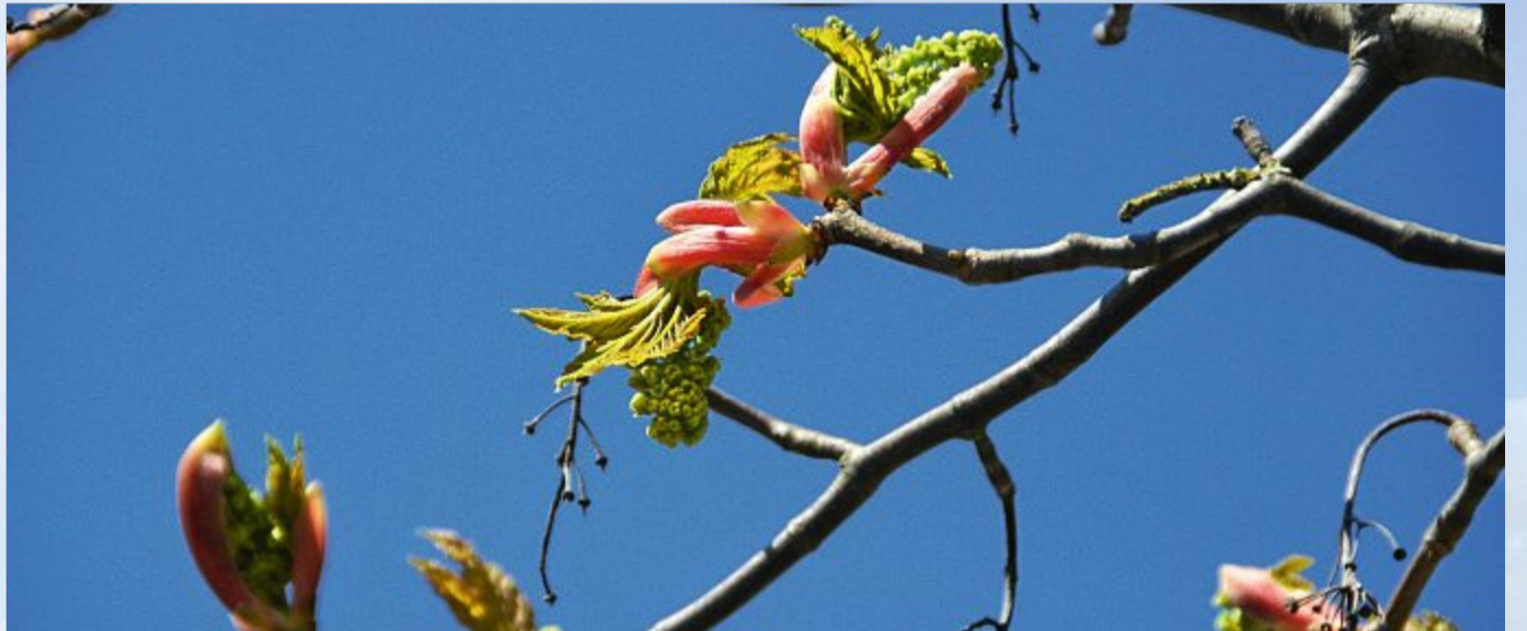
Zum Teil farbenfroh treiben Knospen und Blätter aus.