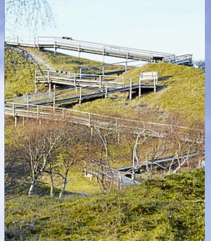
Selbst der Aufstieg zur Aussichtsplattform ist ein Motiv.