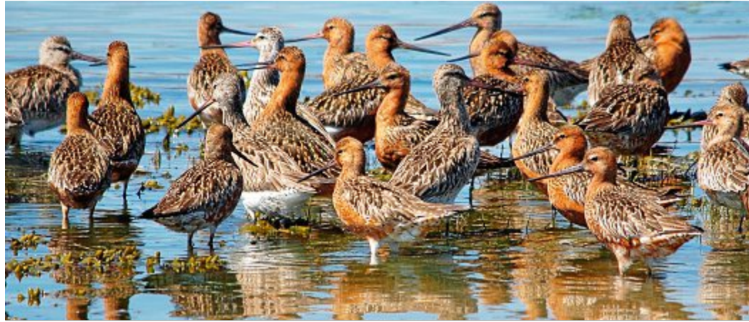
Pfuhschnepfen sind die Symbolvögel der Zugvogeltage im Nationalpark.

NORDERNEY – Die Nationalparkverwaltung, die Nationalpark-Informationseinrichtungen und viele Nationalparkpartner hoffen, dass bis dahin das Leben wieder in normaleren Bahnen verläuft als zurzeit. Sie bereiten sich jedenfalls intensiv darauf vor, Gästen und Einheimischen wieder ein vielfältiges Programm zu bieten, das sich neun Tage lang um den Vogelzug und die Zugvögel im und am Wattenmeer dreht. Wenn alles gut geht, sind die Aussicht und Vorfreude auf fachkundig unterstützte Zug-