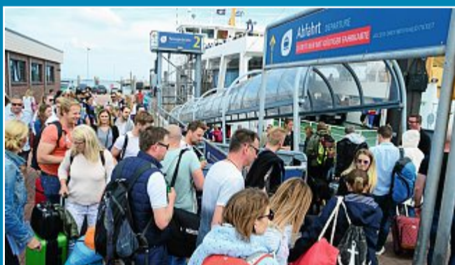
Tourismus Unter welcher Prämisse können Gäste wieder auf die Insel kommen?