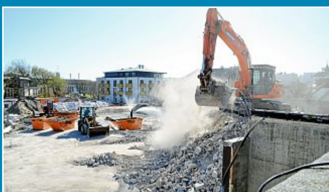
Wirtschaft Haus der Insel: Jetzt geht es an den Keller – 6000 Tonnen Schutt fallen an.