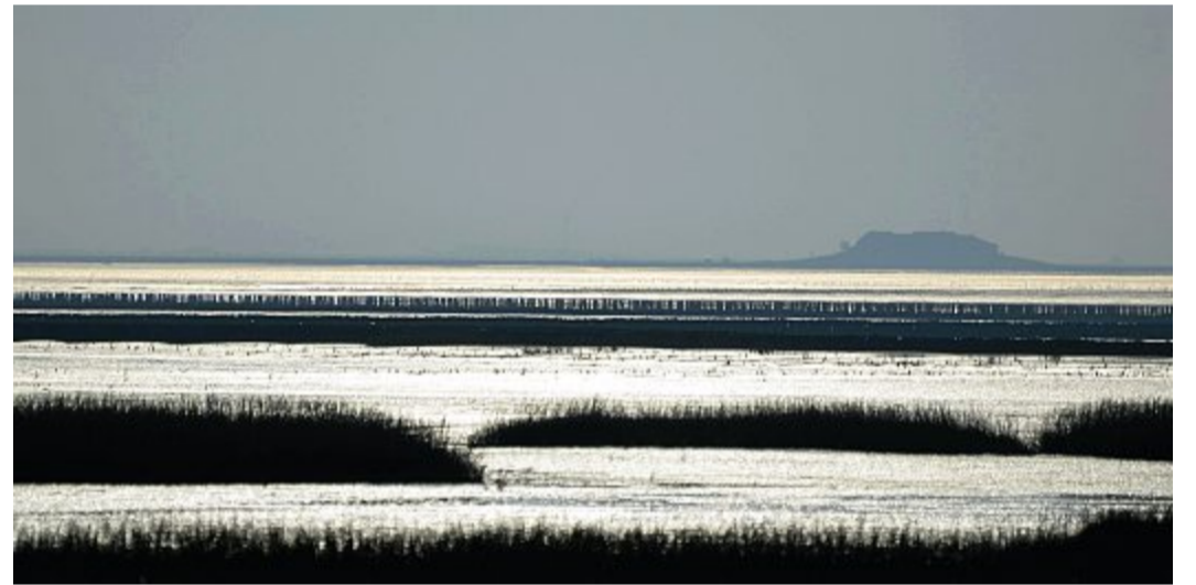
Halligen in Nordfriesland sind nicht eingedeicht.

Südfall und die Hamburger Hallig. Entstanden sind sie entweder durch Sandaufschwemmungen aufgrund von Ebbe und Flut oder dadurch, dass Teile des Festlands oder von Inseln über mehrere Jahre durch den Wind und die Gezeiten abgebrochen sind. Die „große Mandränke“, eine verheerende Sturmflut am 16. Januar 1362, war an der Entstehung der ersten Halligen in Nordfriesland schuld. So lange gibt es die also schon! Durch weitere Sturmfluten, Wind und Wetter veränderte sich die Halliglandschaft über die Jahre ständig. Mal gab es sehr viele – zwischen dem 14. und dem 19. Jahrhundert sollen es sogar bis zu 100 Stück gewesen sein – mal verschwanden wieder welche. Heutzutage