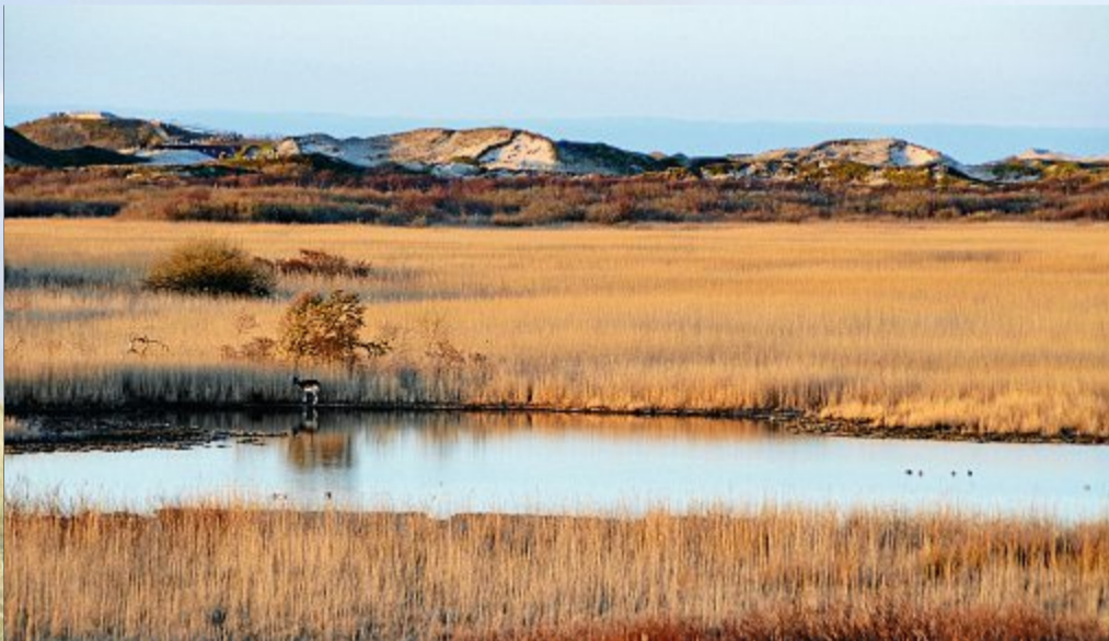
Abendstimmung am Südstrandpolder.