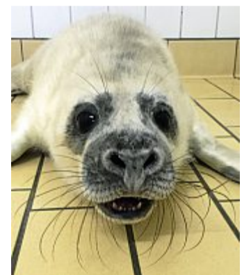
Die Jungen haben helles Fell.

Obwohl im Wattenmeer keine Jagd auf Kegelrobben gemacht wird, sind sie trotzdem durch die Menschen gefährdet. Sie verheddern sich zum Beispiel in Fischernetzen, aus denen sie alleine nicht mehr rauskommen, oder nehmen Schadstoffe, wie zum Beispiel Mikroplastik, aus dem Wasser oder aus ihrer Beute auf.