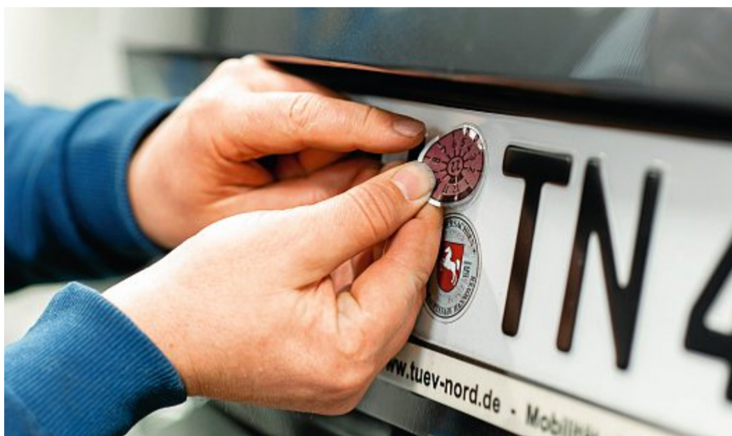
Wer einen festen Termin beim TÜV Nord braucht, sollte online buchen.

OSTFRIESLAND – Die derzeitige Lage bringt Ungewissheit und viele neue Herausforderungen mit sich. Um die Mobilität weiterhin zu sichern, bleiben fast alle Stationen von TÜV Nord geöffnet. Die Öffnungszeiten wurden an die besondere Situation angepasst. Alle aktuellen Änderungen für die jeweilige Station sind auf der Website von TÜV Nord abrufbar. Da die Gesundheit der Mitarbeitenden, Kunden und Partner an oberster Stelle steht, finden die Fahrzeuguntersuchungen unter Einhaltung aller wirksamen Schutzmaßnahmen statt. Im Vorhinein sollte entweder über die Rufnummer 0800/80700600 oder online ( www.tuev-nord.de ) ein Ter-