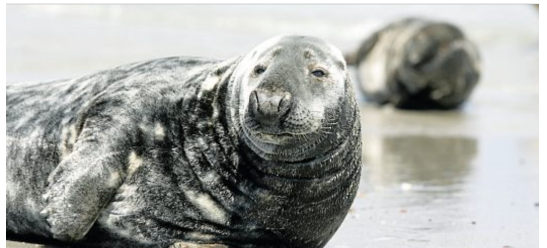
Wichtig ist, dass die Robben ungestört bleiben.

Im Wasser können Kegelrobben sogar noch schneller werden – etwa 30 Kilometer pro Stunde! Bei der Jagd taucht eine Kegelrobbe auf etwa 60 Meter hinab auf den Meeresgrund und schnappt dort nach allem, was sich schnappen lässt – verschiedene Fischarten, Oktopusse oder andere Weichtiere. Kegelrobben können bis zu 30