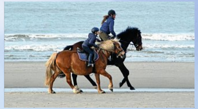
Das Glück der Erde, liegt auf dem Rücken der Pferde.