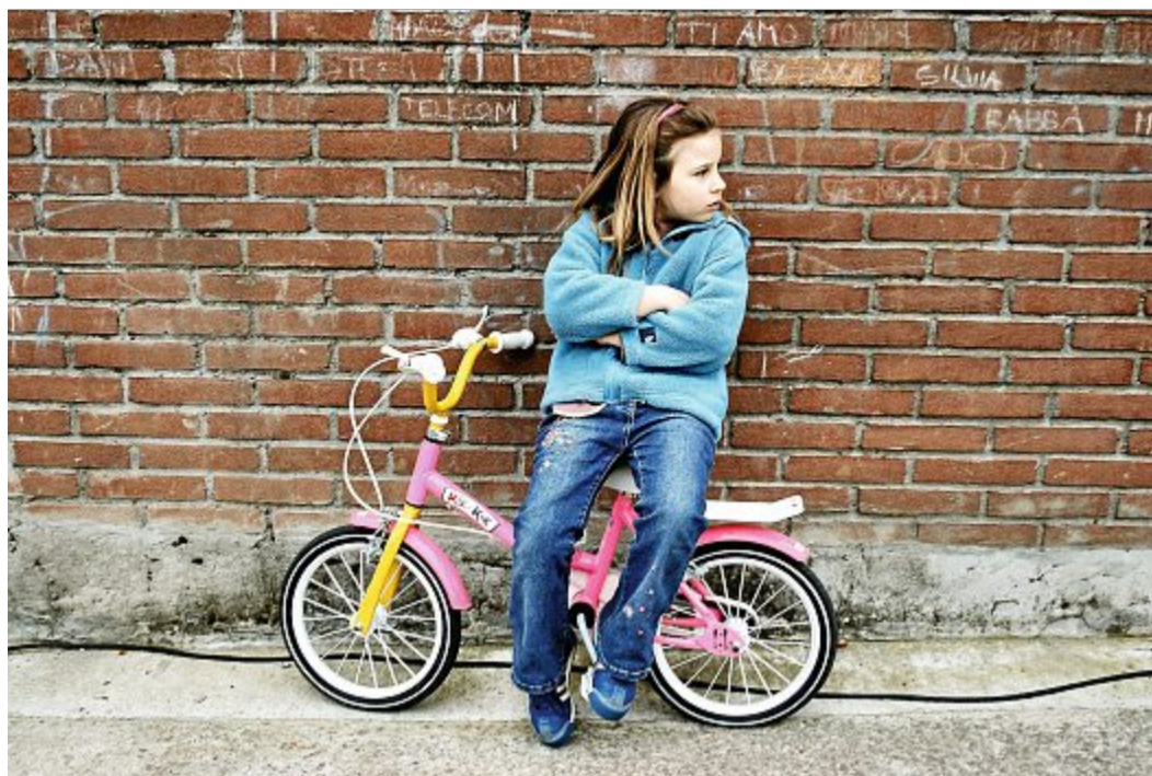
Kein Grund zur Langeweile, denn Schulen haben im Moment online Alternativen.