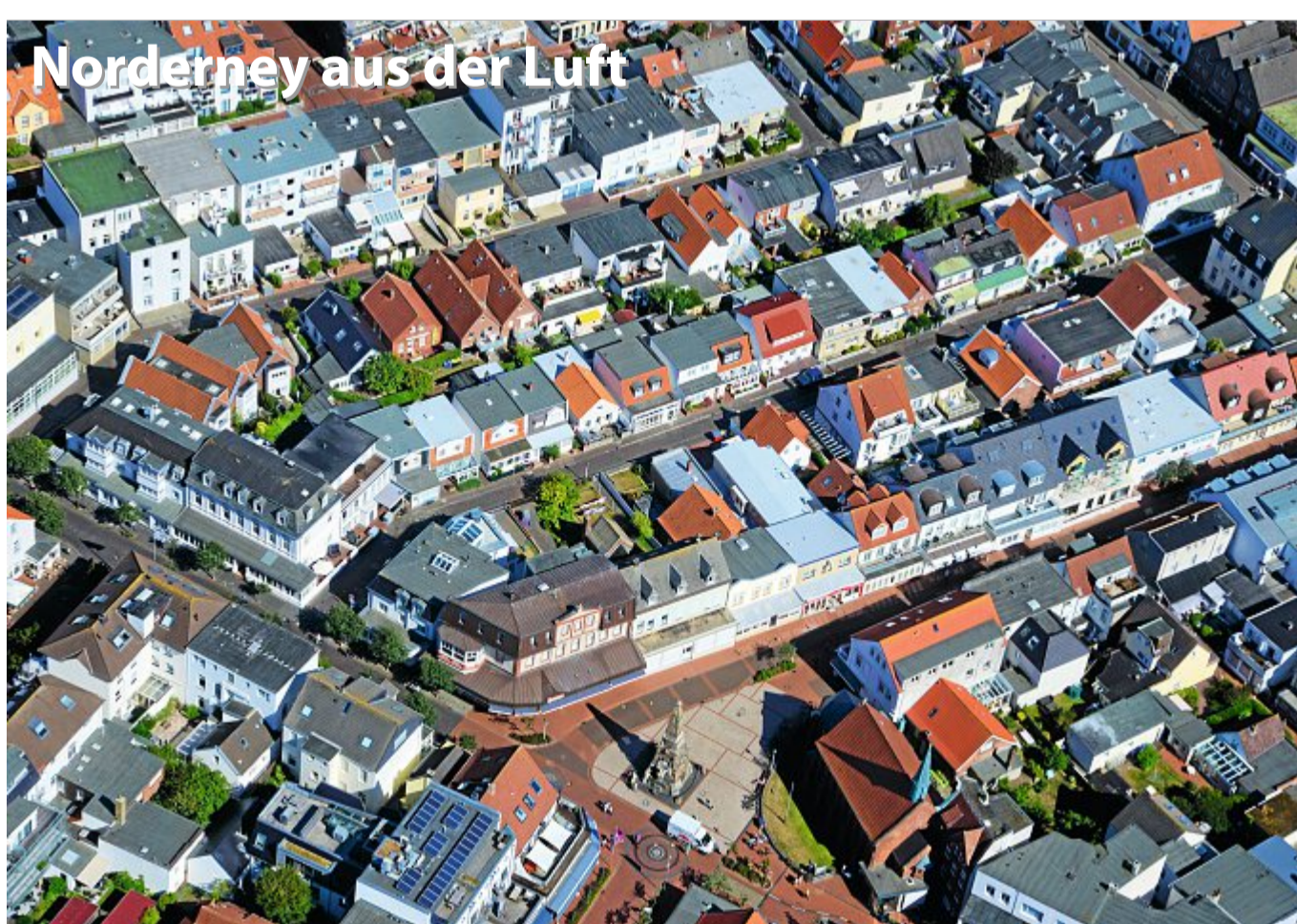
Die Bestellnummer lautet: Norderney Kurier 2014

Liebe Leserinnen und Leser! Dieses Foto und weitere Luftbilder können Sie unter Telefon 04932/991968-0 bestellen. In unserer Geschäftsstelle, Wilhelmstraße 2, auf Norderney nehmen unsere Mitarbeiter Ihre Bestellung auch gern persönlich entgegen. Ein Fotoposter im Format 13 x 18 cm ist für 5,80 Euro, im Format 20 x 30 cm für 14,80 Euro, im Format 30 x 45 cm für 25,80 Euro zu haben. Auch größere Formate bis zu Sondergrößen auf Leinwand sind möglich. Weitere Luftbilder finden Sie auch online unter www.skn.info/fotoweb/archives/5006-Bildergalerie_Luftbilder/ .