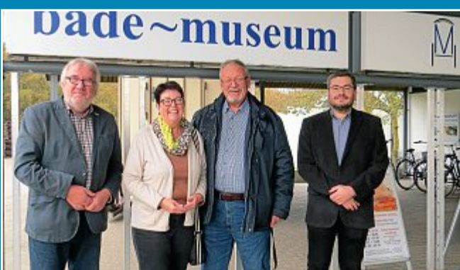
KULTUR: Bilanz des Bademuseums.

1. April: „Ein äußerst erfolgreiches Jahr“