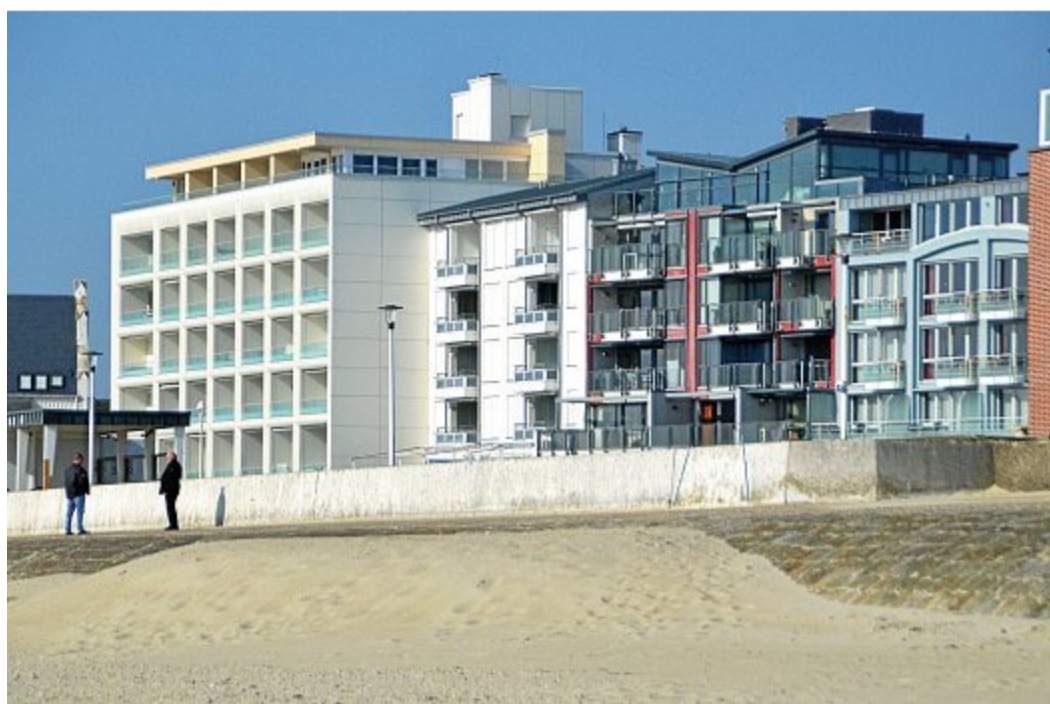
Zweitwohnungsbesitzer von den Inseln zu verweisen, war richtig (Symbolbild).

Das sieht das Verwaltungsgericht laut Landkreis anders. „Die in der Allgemeinverfügung enthaltene Rückreisean-