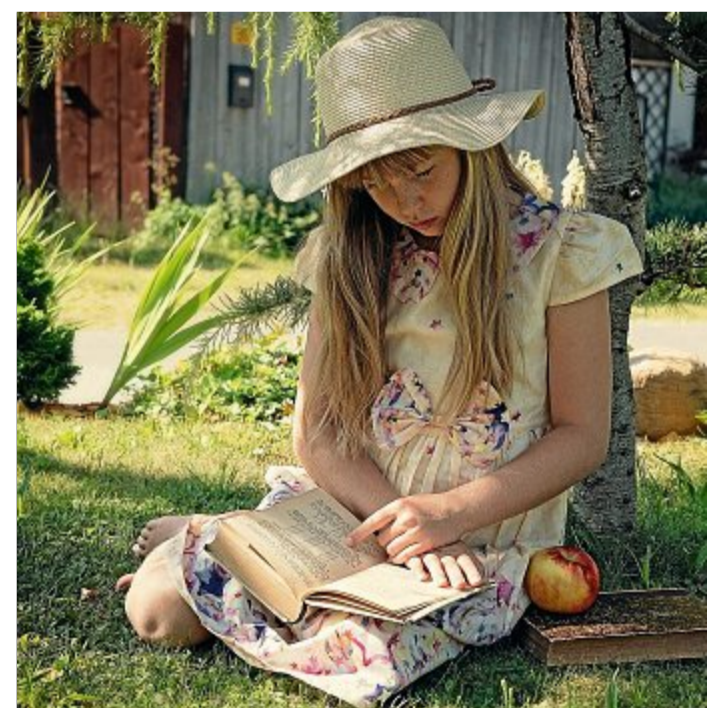
Viele Bücher für Kinder sind im Angebot.

Wir werden unser Angebot laufend aktualisieren, um Kinder und Jugendliche auch in dieser kontaktarmen Zeit fürs Lesen zu begeistern.“