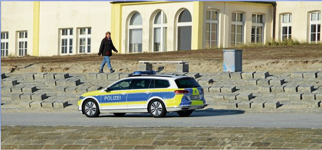
Ein vertrautes Motiv: Die Polizei fährt nach wie vor vermehrt Streife.