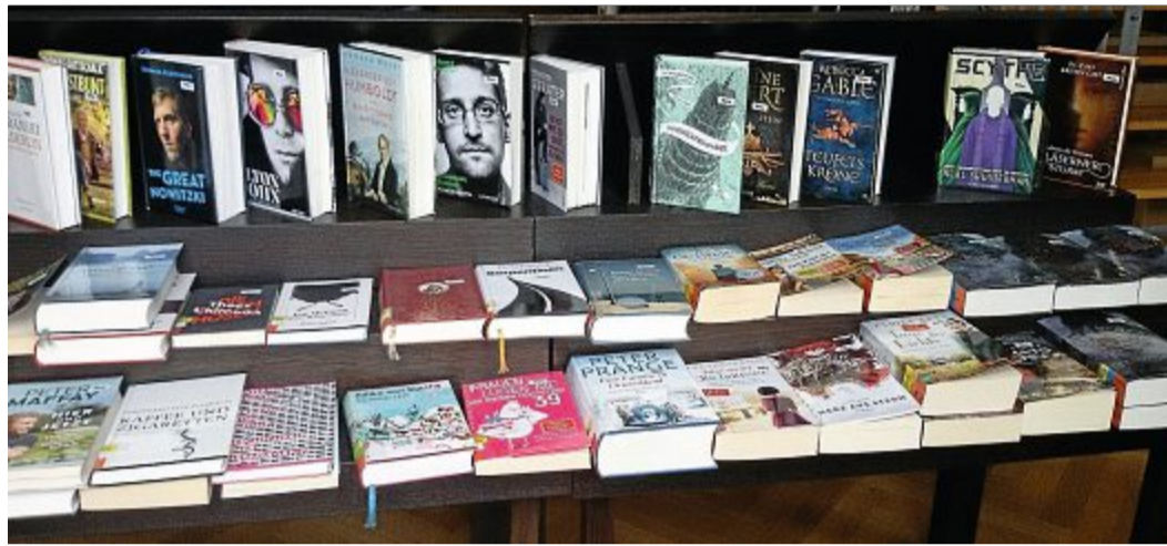
Der Medienverleih in der Bibliothek geht weiter.

NORDERNEY/BD – Nur die drei Euro für einen Bibliotheksausweis fallen weiterhin an, wenn jetzt jemand einen beantragt. Das ist weiterhin möglich, indem Interessierte entweder das Formular von der Homepage herunterladen oder sich die Formulare zu den derzeitigen Öffnungszeiten abholen, teilt Krumme auf Nachfrage dem KURIER mit. Für den Antrag muss ein Personalausweis mitgebracht werden, der Aus-