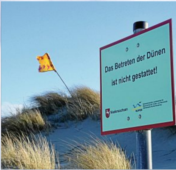
Widerrechtlich mit Strandfund erobert: Eine Düne.