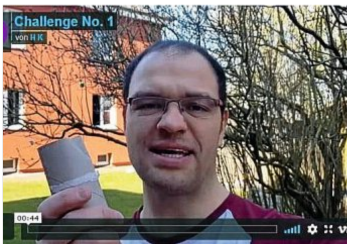
Eine Challenge läuft schon: zum Thema Klopapier.

Auf ihren Internetseiten hat die Grundschule Norderney noch zwei weitere Angebote für Jugendliche. Unter