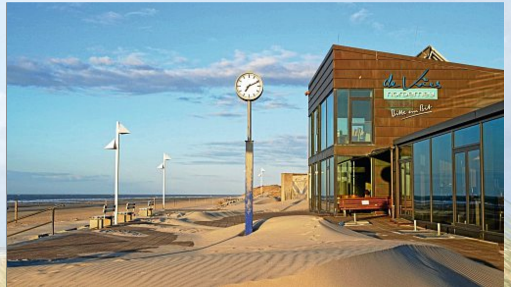
Die Zeit scheint am Nordstrand stehen geblieben zu sein.