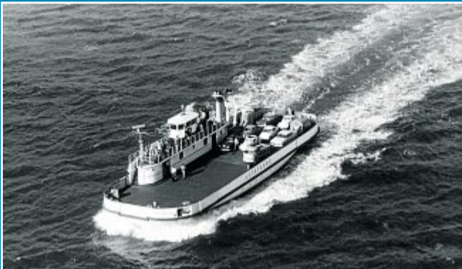
TRANSPORT: „Frisia VIII“ fährt heute in Costa Rica.