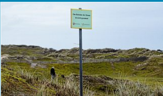
NATUR: Was in den Schutzzonen zu beachten ist.

30. März Regeln gelten auch für Insulaner