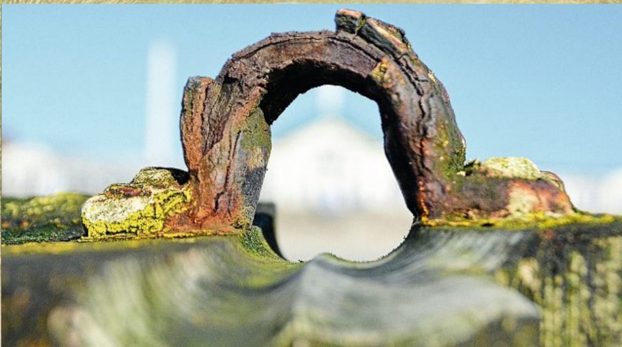
Mal ein anderer Blick auf das Biomaris-Haus?