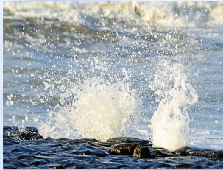
Brandungsspiele an einer Buhne