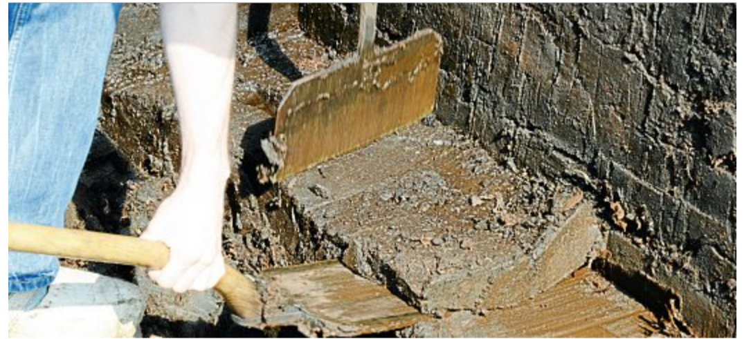
Früher musste der Torf noch per Hand gestochen werden. Das war sehr mühsam.

Menschen herausgefunden, dass getrockneter Torf sehr nützlich ist. Der brennt nämlich unheimlich gut, und isoliert auch Hütten und Häuser