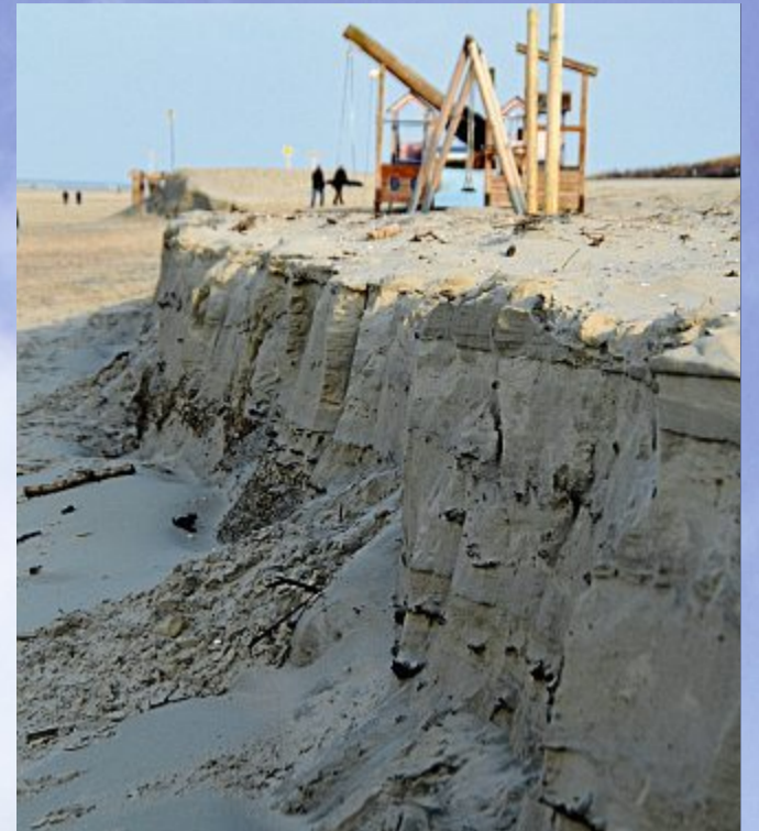
Spielplatz mit Steilkante gibt es an der Weißen Düne.