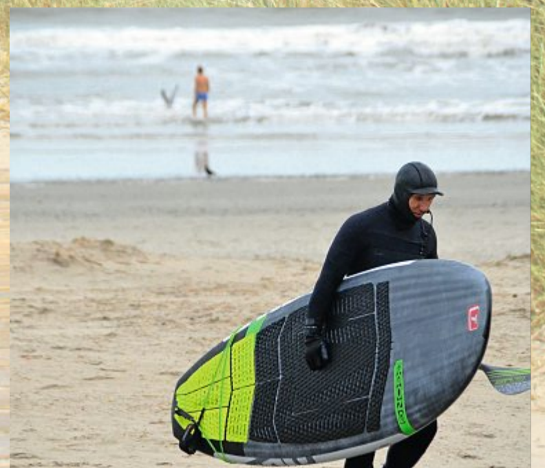
Thalasso und Stand Up-Paddler im Morgengrauen.