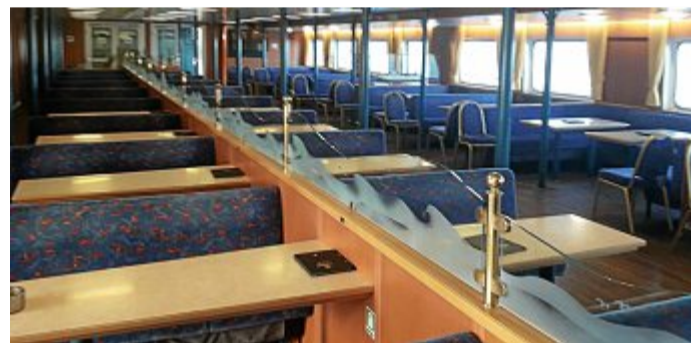
Wer mit einer Ausnahmegenehmigung auf die Insel kommt, wird auf einer fast leeren Fähre transportiert.

Ausgenommen sind Personen, die zur Sicherstellung der „kritischen Infrastruktur“ auf die Inseln kommen, also vor allem zur Versorgung der Bevölkerung mit Strom, Wasser und Gas. Ebenfalls ausgenommen sind Personen, die für die medizinische, notfallmedizinische, geburtshelfende und pfl-