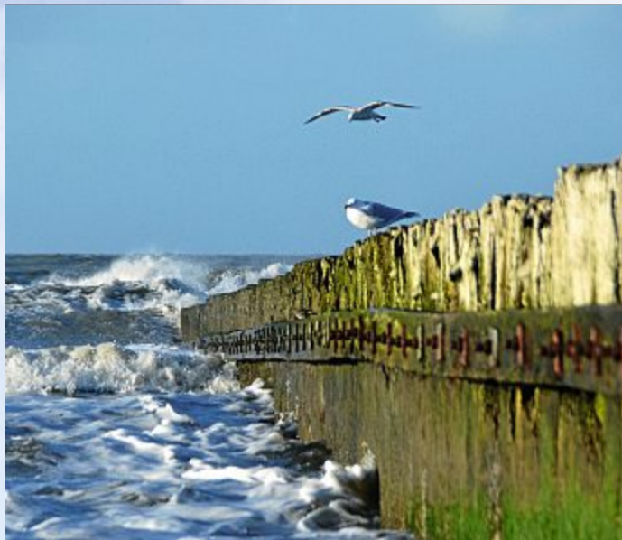
Bestes Wetter mit bester Brandung.