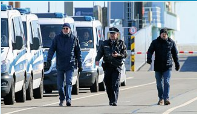
Die Insel wird systematisch durchkämt.