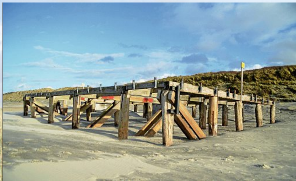
Derzeit nur ein Fotomotiv, allerdings ein schönes: Eine der Strandplattformen.