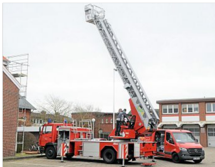
Die geliehene Drehleiter kam zum Einsatz.

Die Freiwillige Feuerwehr muss sich laut eigener Aussage aufgrund der aktuellen