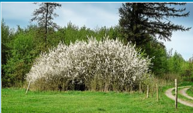
Schlehen: Die weiße Frühjahrspracht.