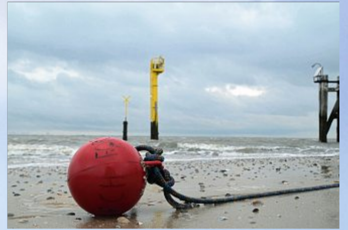
Die Ebbe legt so einiges frei.