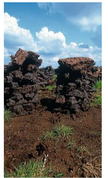
Torf ist ein beliebter Brennstoff.

Moore und der darin enthaltene Torf sind nämlich sehr wichtig für uns. Sie erfüllen bedeutende Funktionen für unsere Umwelt. Durch ihre besonderen Eigenschaften stellen Moore be-