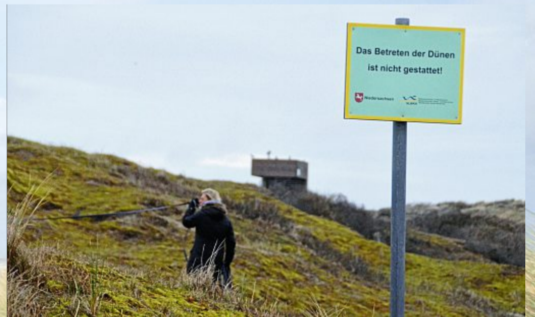
Sieht ja keiner! Denkste!