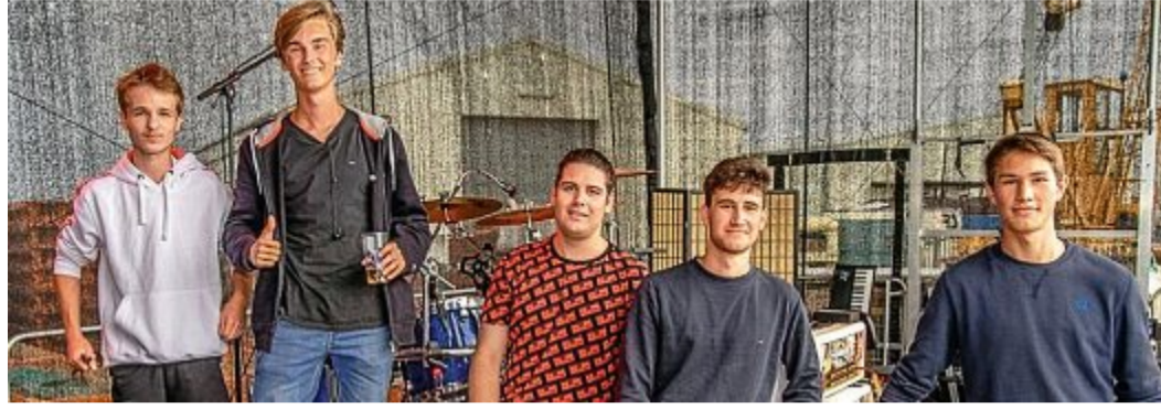
SoundControl gilt als Inselband mit viel Potenzial.

NORDERNEY – Wenn alles klappt, erfüllt sich in diesem Jahr für die Mitglieder und Mitwirkenden der Norderneyer Band SoundControl ein großer Wunsch. Die Band plant, ihr erstes eigenes Album zu veröffentlichen. Von Oktober 2019 bis zum Januar dieses Jahres arbeiteten die Musiker an dem Tonträger, der acht eigene Stücke in einer Mischung aus Alternative und Modern Rock enthält. Willem Nijenhuis ermöglichte durch seine Kontakte der Band den Besuch im Tonstudio.