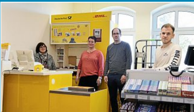
Lange Schlangen zur Eröffnung der neuen Postfilialen.