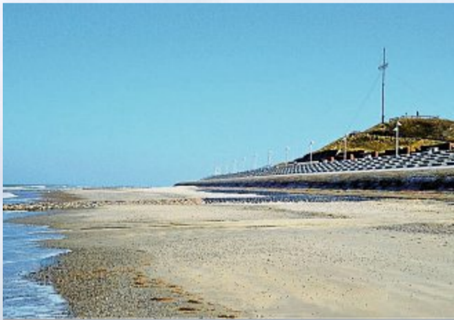
Georgshöhe zur Mittagszeit.