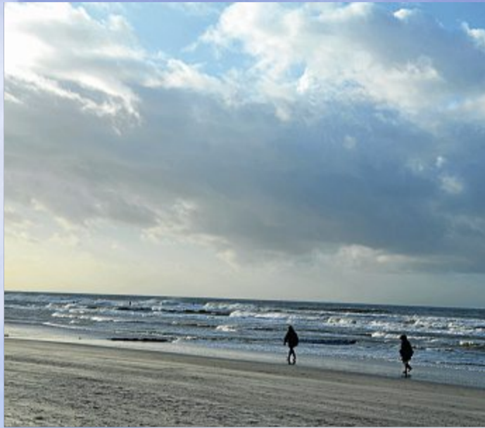
Derzeit ein seltener Anblick: Spaziergänger am Strand.