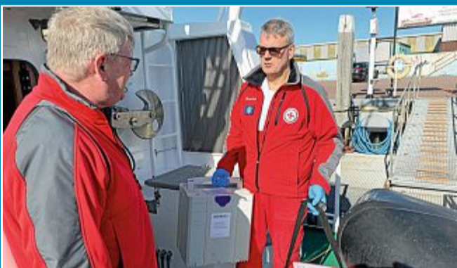
Seenotretter bringen Corona-Tests aufs Festland.