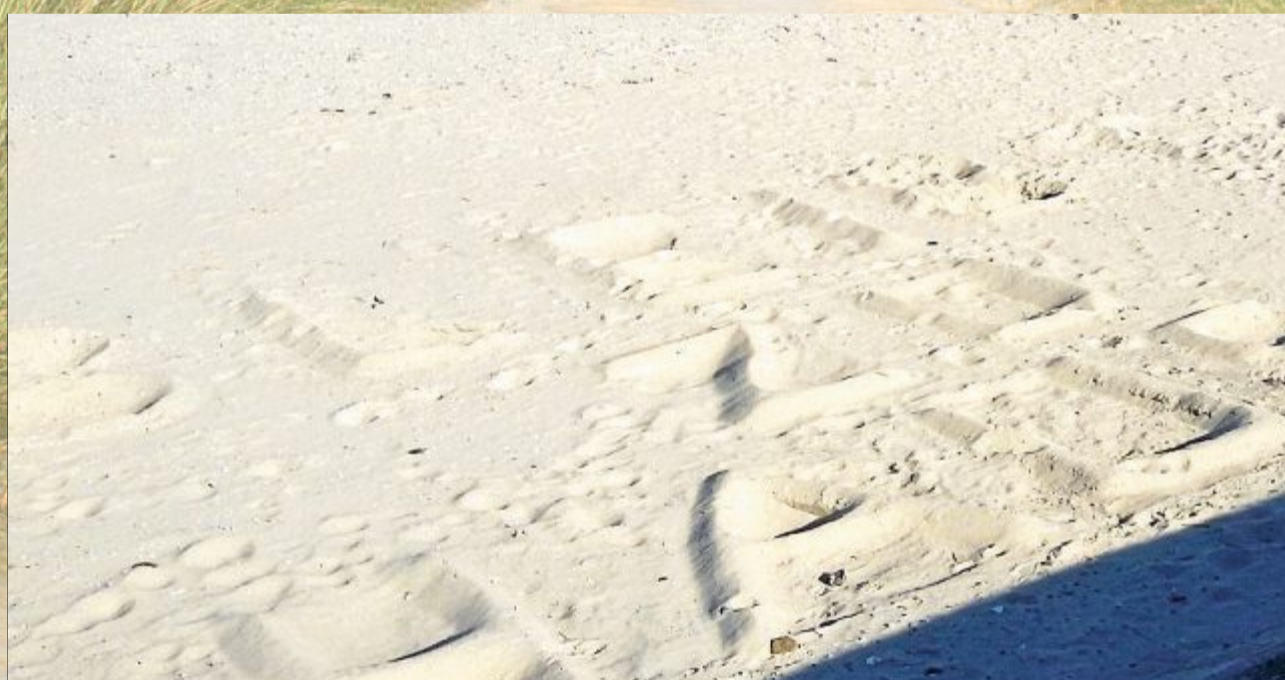
Was macht dann der Autor dieser Zeilen am Strand?