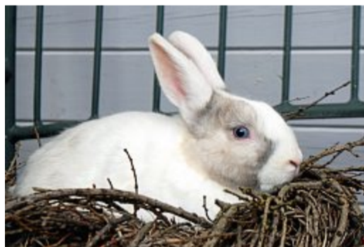
Kaninchen Trik sucht neue Halter.