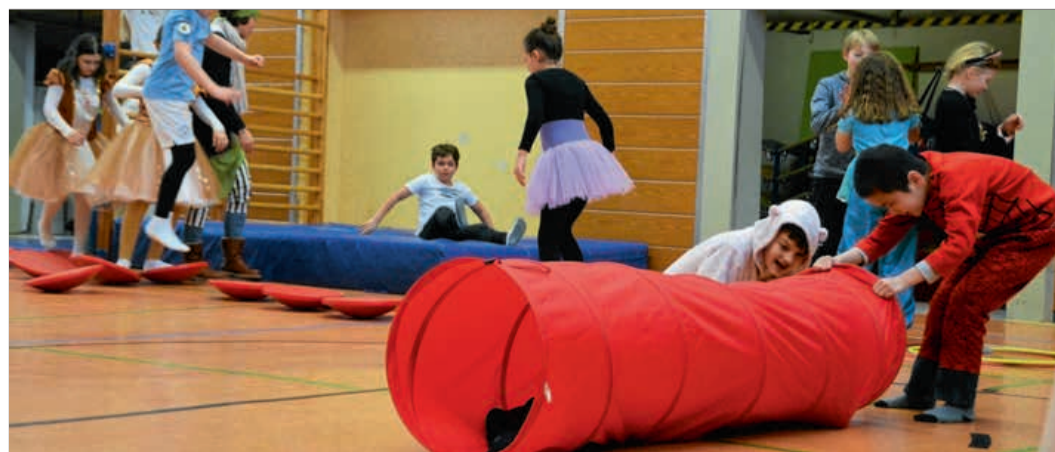
Viel Spaß hatten die Kinder bei ihrem persönlichen Faschingsmontag.

wurde das Angebot genutzt. Nicht alle Kinder hielten dabei ihre Verkleidung durch. Aufgrund aufsteigender Hitze durch ausgiebiges Herumtoben landete das eine oder andere Kleidungsstück in der Ecke. Wohl dem, der sich als Fußballprofi verkleidet hatte: Dank der Funktionswäsche blieben Verkleidung aufrecht erhalten und die Temperatur auf normalem Niveau.