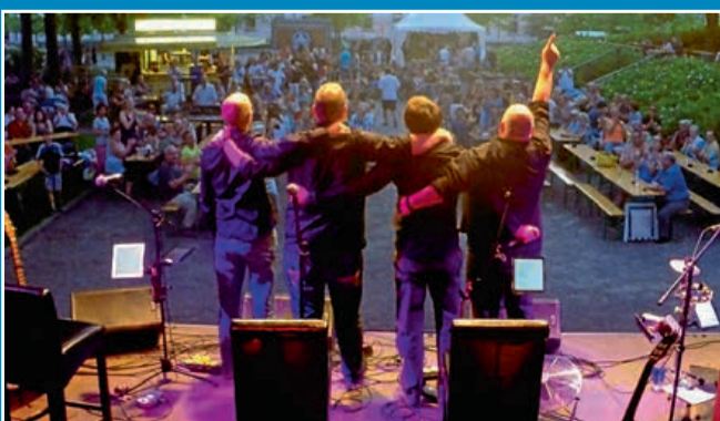
KONZERT: „Die Goldenen Reiter“ im Conversationshaus

25. Februar: Neue Deutsche Welle akustisch