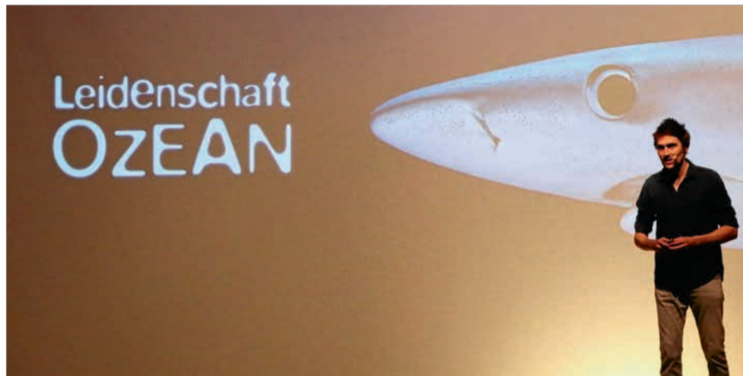
Nach einer kurzen Einführung ging es in die „Tiefe“.

Letzteres erklärt wohl seine Präsenz und Moderationsfähigkeit auf der Bühne, denn neben seinen eindrucksvollen Bildern war es die souveräne und charmante Art, mit der der Meeresbiologe seine Leidenschaft für den Ozean vermittelte und damit auch alle seine Zuschauer bis in die letzten Minuten hinein faszinierte.