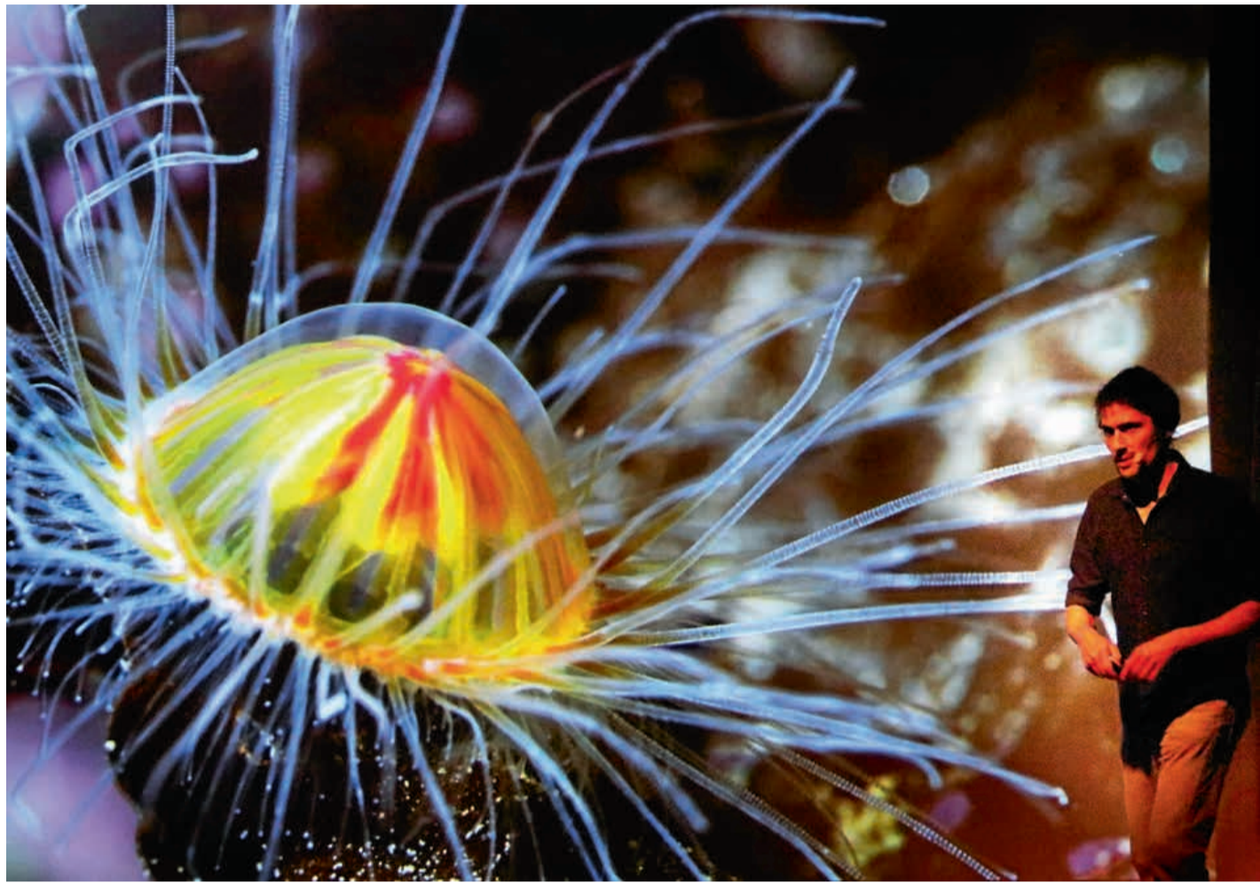
Das atemberaubende Foto zeigt eine Qualle in antarktischen Gewässern.

Seine Fotos zeigen eine Welt, die für viele verborgen bleibt. Kunz taucht im offenen Ozean, unter dem Eis, in Höhlen, die noch weitestgehend unerforscht sind, und bringt von diesen Expeditionen wunderbare Fotografien mit, die die Schönheit, aber auch die Bedrohung dieser Welten veranschaulichen. Die