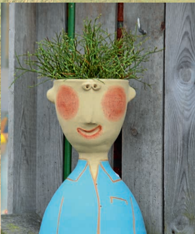
Ist das Heidelbeere auf dem Kopf?