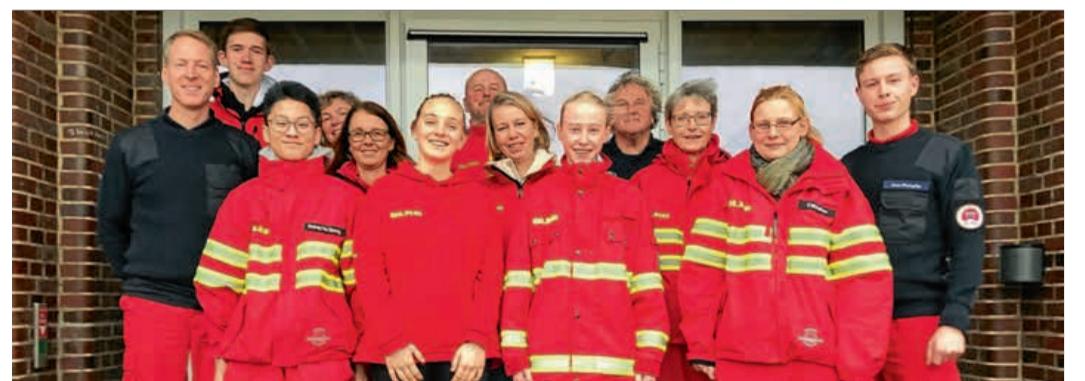
Die Teilnehmer für das „Basiswissen“ und ihre Ausbilder.