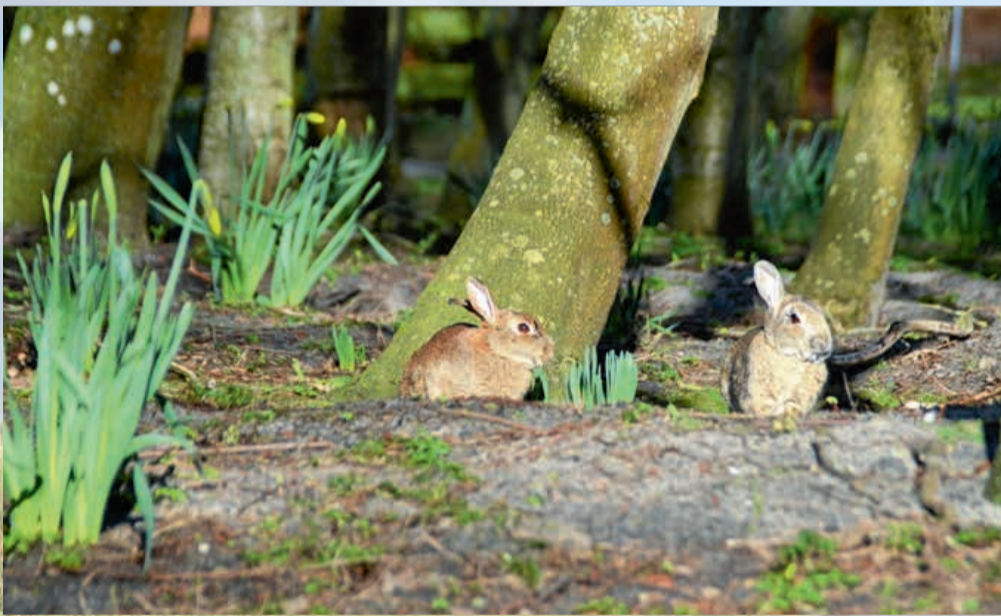
Die Kaninchen genießen ebenfalls die Sonne.