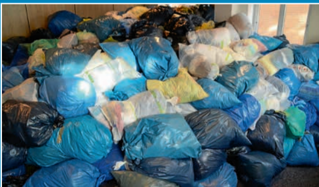
GESELLSCHAFT: Altkleideresammlung für Bethel

24. Februar: Ein Lastwagen voller Kleidung