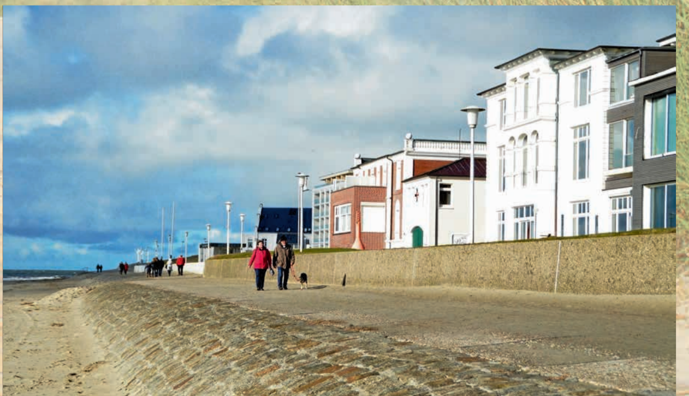
Jede Minute gutes Wetter wird dieser Tage genutzt.