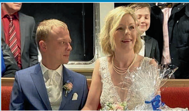
GESELLSCHAFT: Hochzeit wurde spendiert