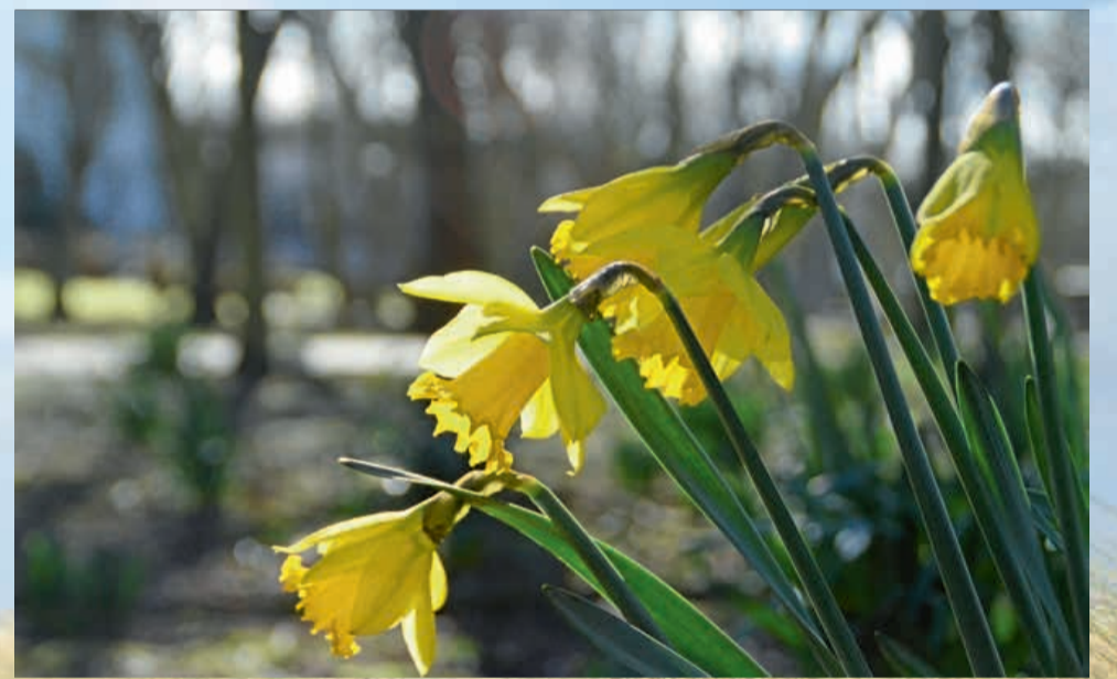
Narzissen als gelber Frühlingsgruß.