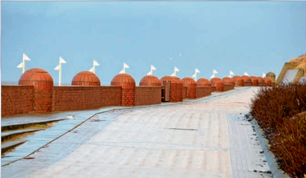
Ohne Leute – die Promenade Richtung Nordstrand.