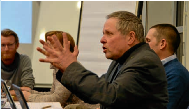
POLITIK: Tübingens Erfahrungen sollen verfolgt werden

21. Februar: Verpackungssteuer ist Thema