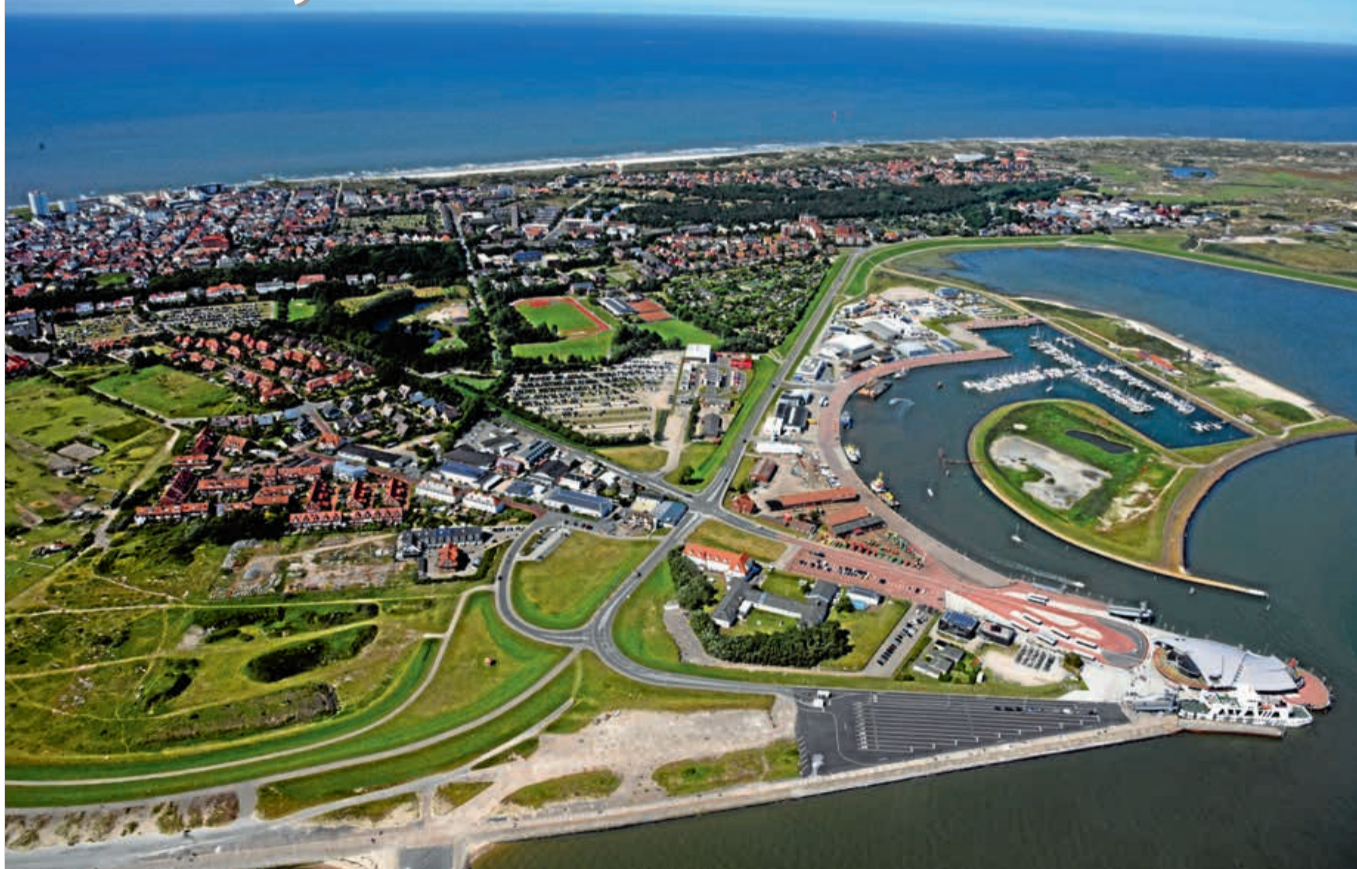
Die Bestellnummer lautet: Norderney Kurier 2009