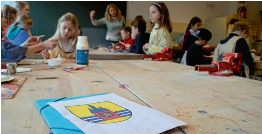
Drittklässler der Grundschule befassen sich mit Wangerooe.

Aber auch an die anderen Ostfriesischen Inseln wurde gedacht. Ein dritte Klas-