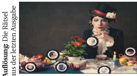
Auflösung: Die Rätsel aus der letzten Ausgabe