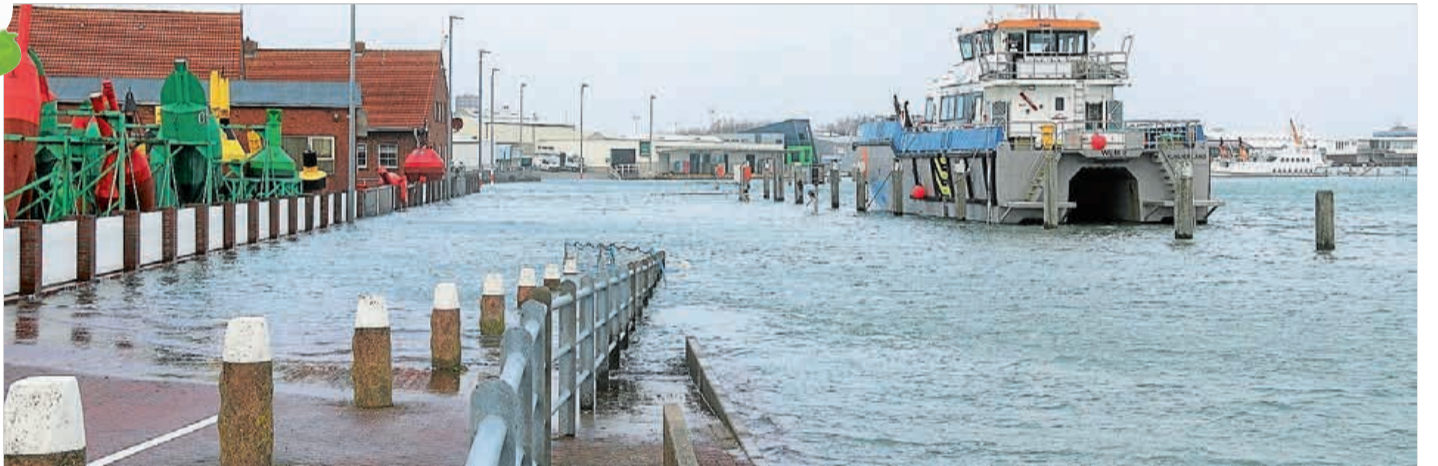
„Land unter“ heißt es oft am Hafen, wenn das Wasser über die normale Höhe steigt.

Beginnen wir mal damit, was eine Sturmflut ist; eigentlich ganz einfach: ein Ansteigen des Wassers an der Küste oder in Flussmündungen, bedingt durch starken Wind. Aber man muss noch ein klein wenig genauer sein. Für