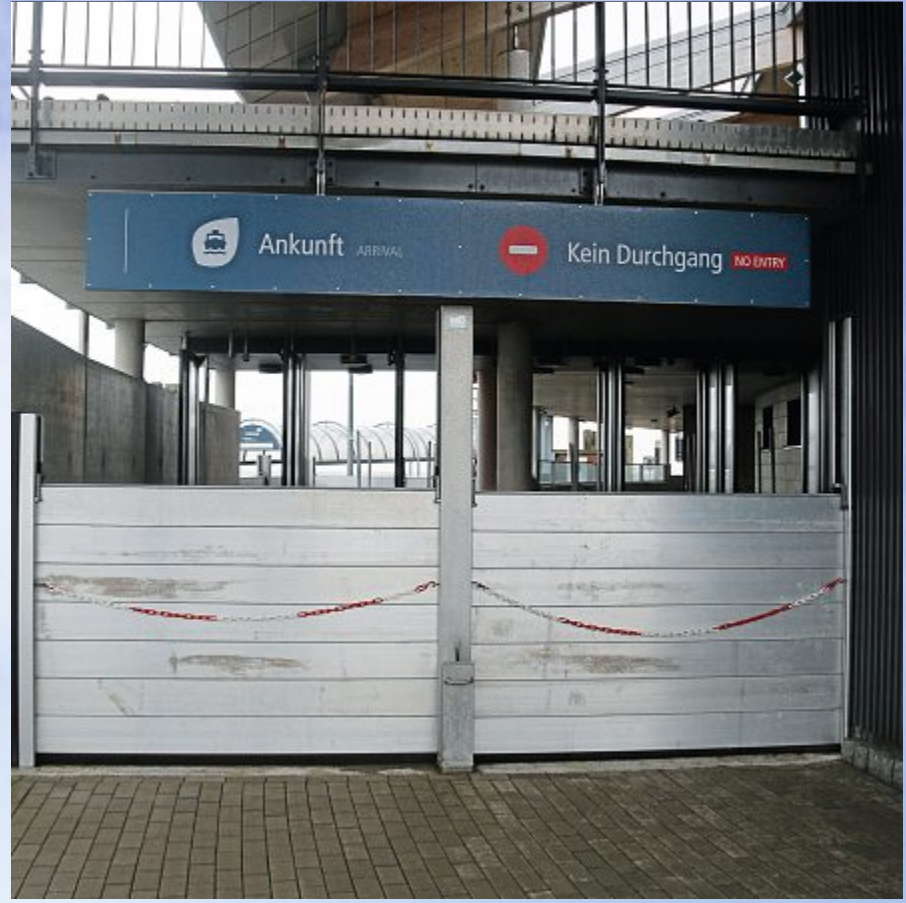
Selbst für Insulaner ein ungewöhnlicher Anblick: Die Schutzvorrichtung der Frisia.