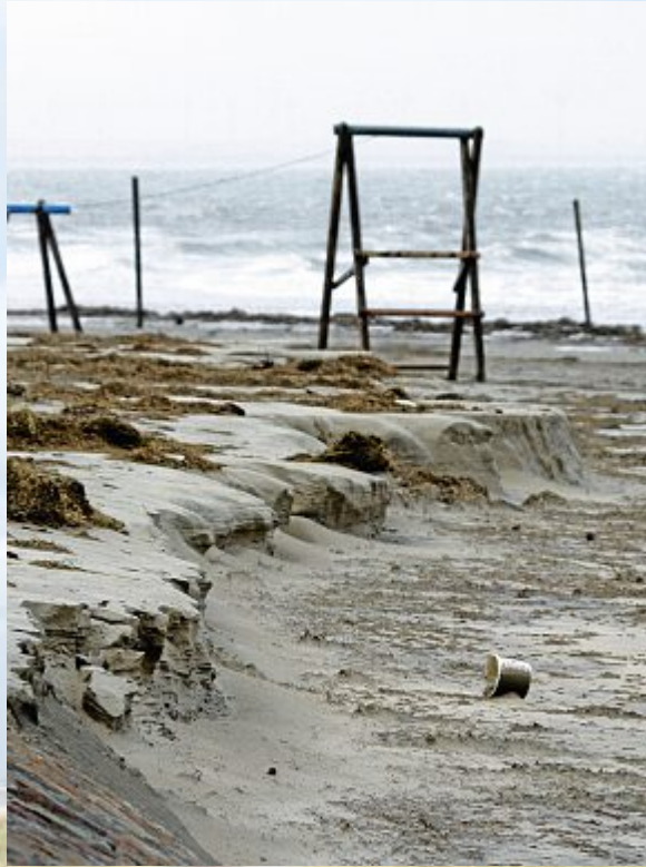
Die neue Abbruchkante ist ein Produkt des Wassers.