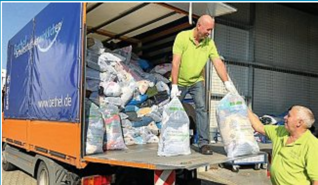
AKTION: Noch eine Woche Zeit zum Sammeln.