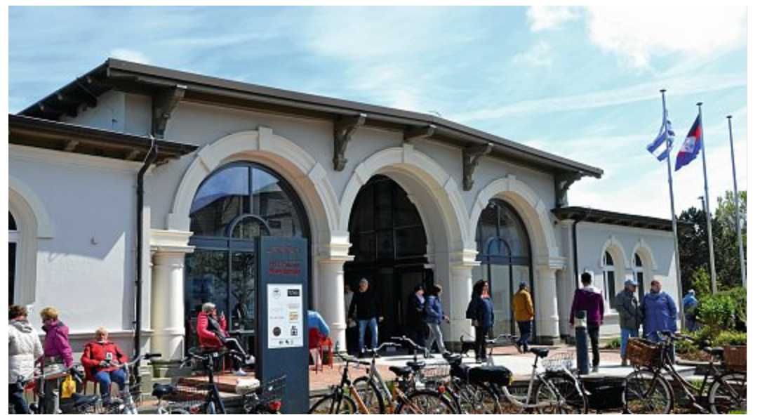
Das ehemalige „Haus Schifffahrt“ ist ab März Sitz der neuen Postfiliale.

In der jetzigen Bleibe, der Tankstelle Bodenstab, verweilt die Post nur etwa ein Jahr. Grund für den Wechsel des Standortes sind Probleme mit dem Platz. Außerdem sei zeitnah ein Umbau der Tankstelle geplant. Die Lagerräume würden dann für das Hauptgeschäft benötigt werden. Noch bis zum 23. März können Pakete, Briefe und alles, was auf postalischen Wege trans-