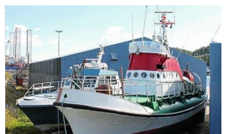
Hier liegt der Rettungskreuzer noch in Norwegen.

Auch am fünfeinhalb Meter langen Tochterboot wird bereits Hand angelegt, denn die „Fidi“ soll am 7. März bei der Aktion „Insulaner unner sück“ auf Hochglanz poliert zusammen mit der „Bismarck“ auf dem Kurpark glänzen. Die Überführung der „Otto Schülke“ ist für Mitte Mai angedacht. Jetzt wo der Motor läuft, könnte die alte