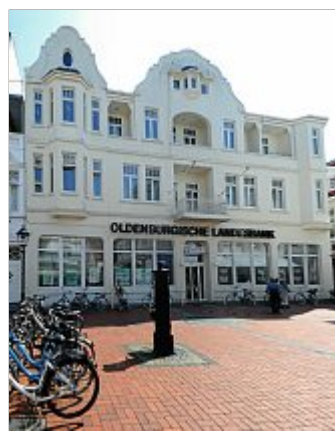
Bleibt weiterhin für ihre Kunden da. OLB-Bank Norderney.

wie Onlinebanking und Telefon nutzen und weniger die Filialen aufsuchen“, schreibt Timo Cyriacks.