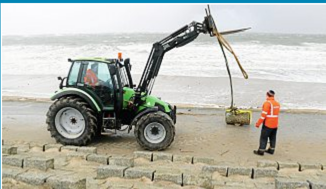
Sturm: NLWKV-Mitarbeiter bergen gelbe Tonne.