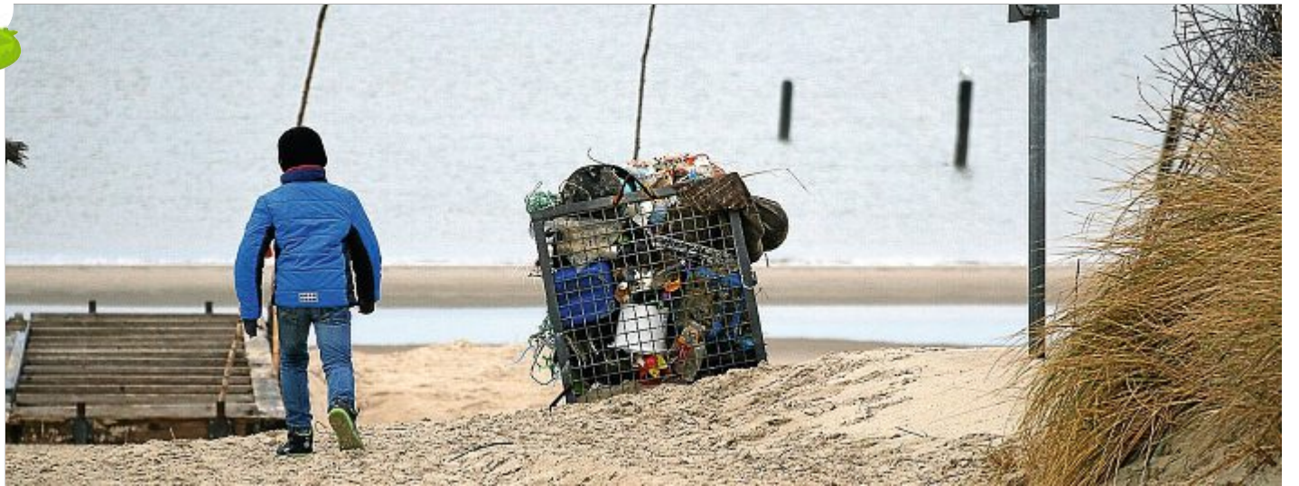
Wenn viel Plastik an Land gespült wurde, sind die Boxen schnell gefüllt.

Müllsammeln ist super, aber was soll man dort hineinwerfen und was nicht