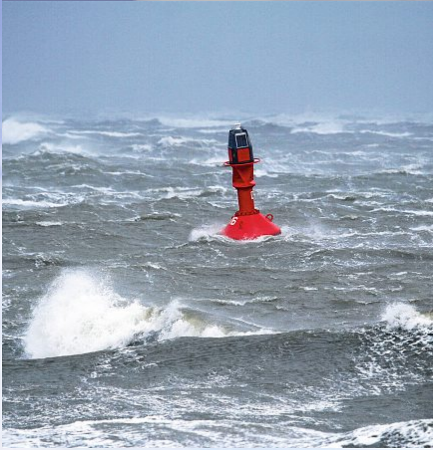
Als würde die Nordsee kochen. Sturm am Dienstag.