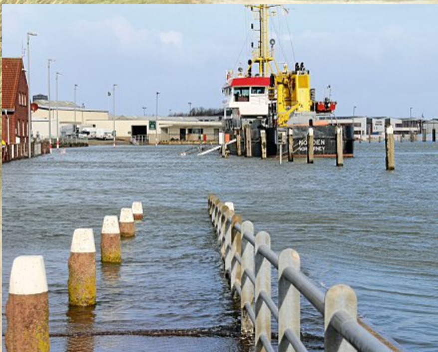
Nasse Füße für die Schiffsbesatzung. Land unter am Hafen.