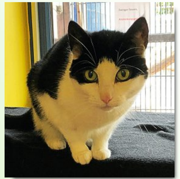
Name: Engeline Rasse: EKH Geburt: 29. Mai 2016 Geschlecht: weiblich, kastriert

Weitere Tiere finden Sie auf der Homepage des Tierheims unter www.tierheim-hage.de