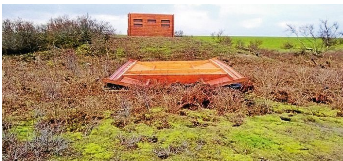
Der BUND hat als Sturmopfer das Dach der Beobachtungshütte zu beklagen.

Schwer erwischt hat es die Beobachtungshütte des NABU an den Temmeteichen am Südstrandpolder. Das Dach des Holzbaus wurde Opfer des Sturms und in einem Stück abgerissen und landete etwa 30 Meter entfernt auf dem Gras. Selbst die dicken Befesti-