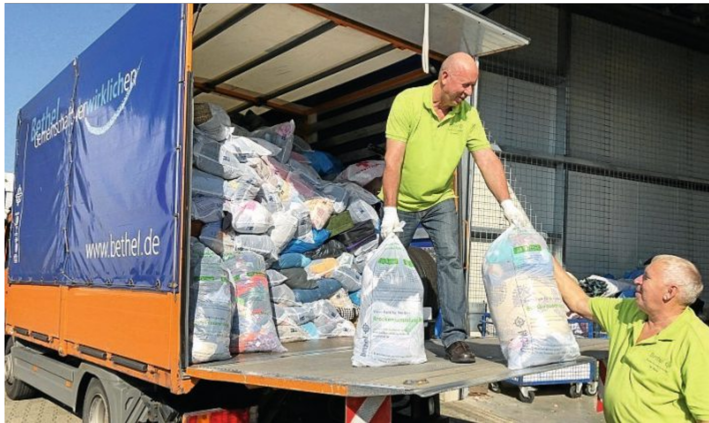
In der „Brockensammlung“ werden die Spenden sortiert und weiter verwertet.

Bethel ist eine diakonische Einrichtung, in der Menschen mit Behinderung, psychischen Beeinträchtigungen und Epilepsie sowie alte, pflegebedürftige und kranke Menschen, Jugendliche mit sozialen Problemen und wohnungslose Menschen betreut werden. Bereits im