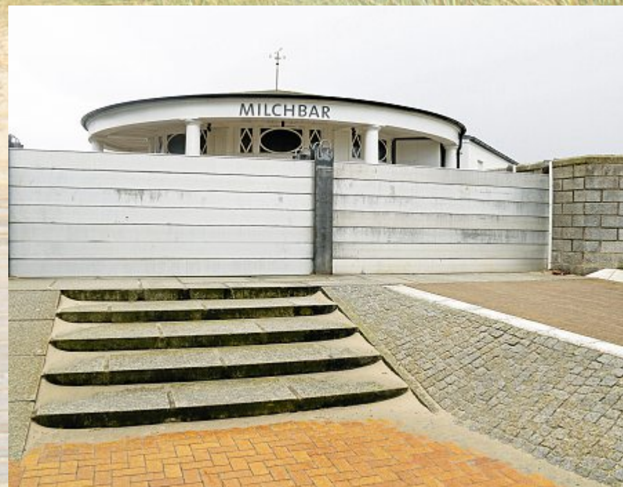
Wahrzeichen müssen geschützt werden. Die Milchbar hinter Flutwand.