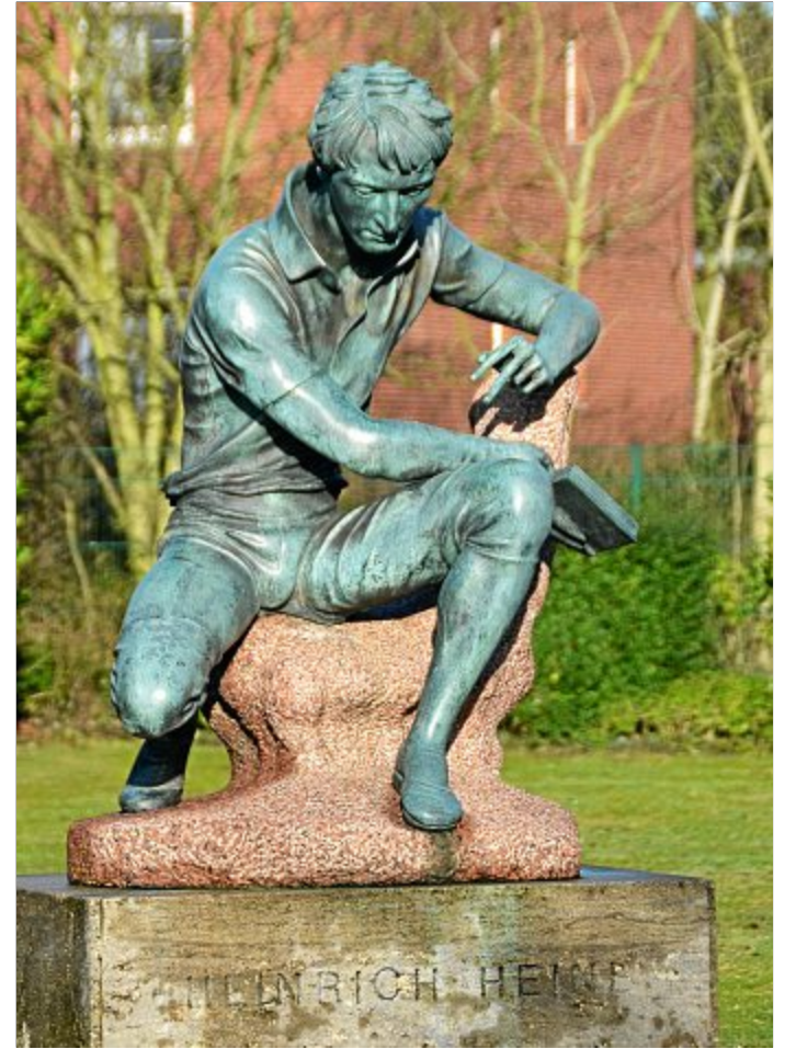
Wo, wie und ob die Heine-Statue auf der Insel wieder aufgestellt wird, ist noch nicht entschieden.

Auf Nachfrage des OK teilte Bürgermeister Ulrichs mit, dass die Zukunft des Heine-Denkmal recht unangenehm in der Politik diskutiert werde. Es gibt konstruktive Ansätze, das Denkmal wieder aufzustellen und dabei allen Interessen gerecht zu werden. Möglich wäre dies durch eine Infotafel am Denkmal selbst, auf der dieses sowohl als ‚Heinrich Heine-Denkmal‘, aber auch als ‚Brekerdenkmal‘ dargestellt und im letzteren Fall erläutert würde. Auch eine Verlinkung zum Beispiel über einen QR-Code auf eine Seite der Stadt/des Stadtarchives, um umfangreichere Informationen und Standpunkte darzulegen, wäre möglich. Wichtig ist, sich mit dem Kontext und der Historie auseinanderzusetzen, und das Denkmal eben nicht einfach verschwinden zu lassen, wie vereinzelt zu vernehmen war.“