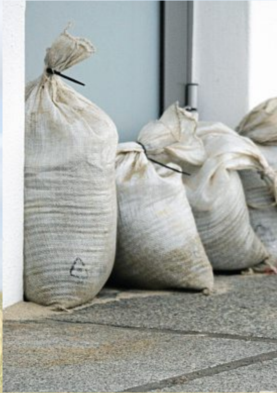
Wirksamer Schutz vor den Fluten.