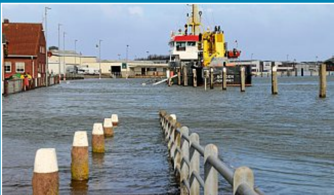
ORKAN: Landunter im Hafengebiet.