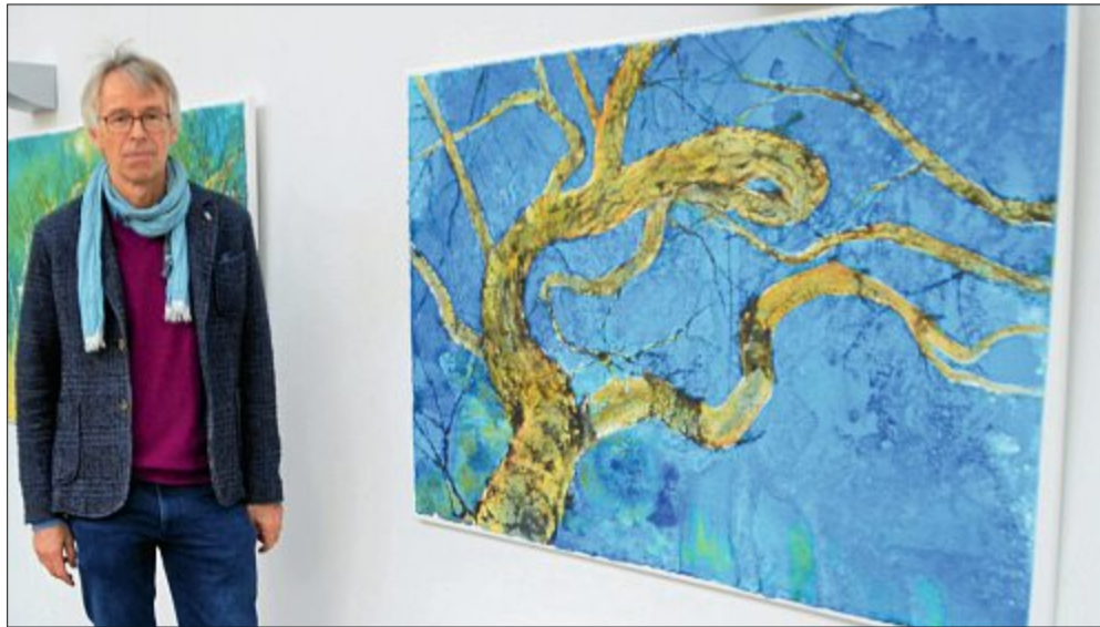
Aus der Ferne wirken die Bilder von Dirk Beckedorf fotorealistisch.

In den Bildern auf handgeschöpftem Papier kommt es zum Spiel von Objekt und Raum, Vordergrund und Hintergrund überlagern sich, das Objekt, ein