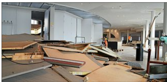
Derzeit wird das Haus der Insel, das Anfang 2020 abgerissen werden soll, ausgeräumt.