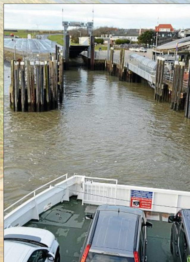
Willkommen für schöne Tage auf Norderney.