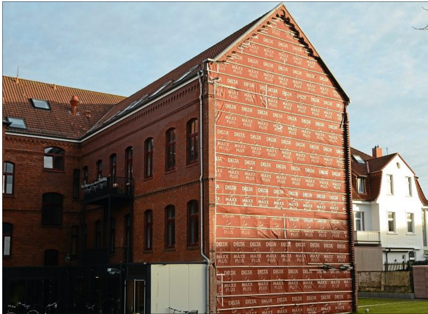
Zurzeit Thema öffentlicher Diskussionen: die Weiterentwicklung der Marienresidenz in der Georgstraße. Hier wäre Platz für 27 neue Pflegeplätze.

fung weiterer Pflegeplätze in der Marienresidenz hatte seinerzeit allerdings noch nicht das neue Seniorenzentrum „To Huus“ berücksichtigt, dessen Planung sich erst im zweiten Halbjahr 2016 entwickelt hatte. Grundsätzlich sollte vielmehr ein Pendant zur damals noch äußerst desolaten und nicht zukunftsfähigen Situation des Altenheimes in der Mühlenstraße geschaffen werden.