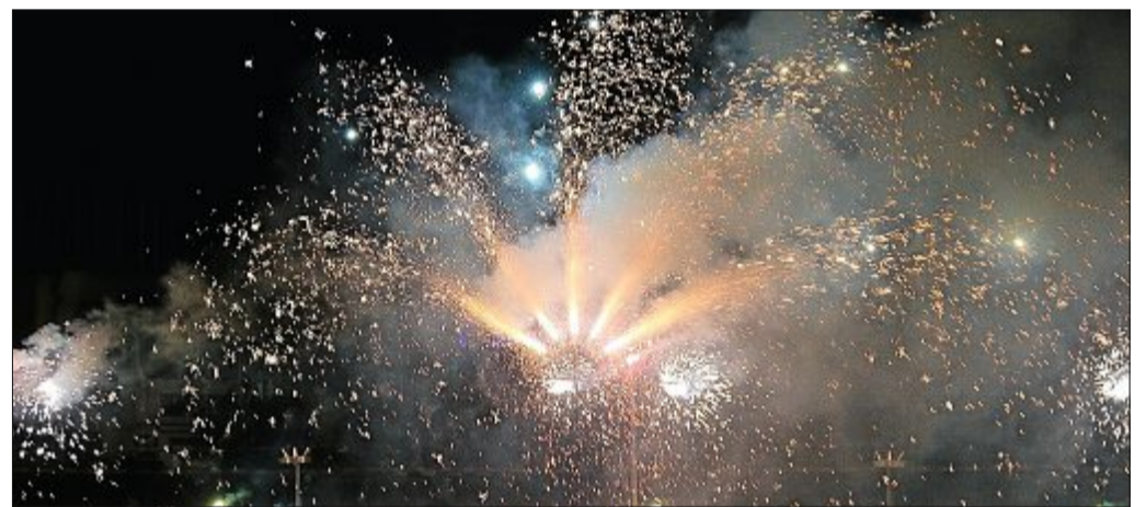
Wer Silvester Feuerwerke zünden will, muss dies in der Stadt tun.

Für die zahlreichen Gäste sowie Insulaner gibt es natürlich auch ein breit gefächertes Angebot an Veranstaltungen, wie zum Beispiel der Winterzauber-Markt auf dem Kurplatz oder die Silvesterparty im Conversationshaus. Oder für ganz Harte: Der Silvesterlauf am 31. Dezember und das traditionelle Anbaden am 1. Januar. Also mir persönlich wäre das viel zu kalt! Ich verkrieche mich lieber in den Inselosten, wo ich meine Ruhe habe. Dort kriege ich auch nicht so viel von dem ganzen Lärm des