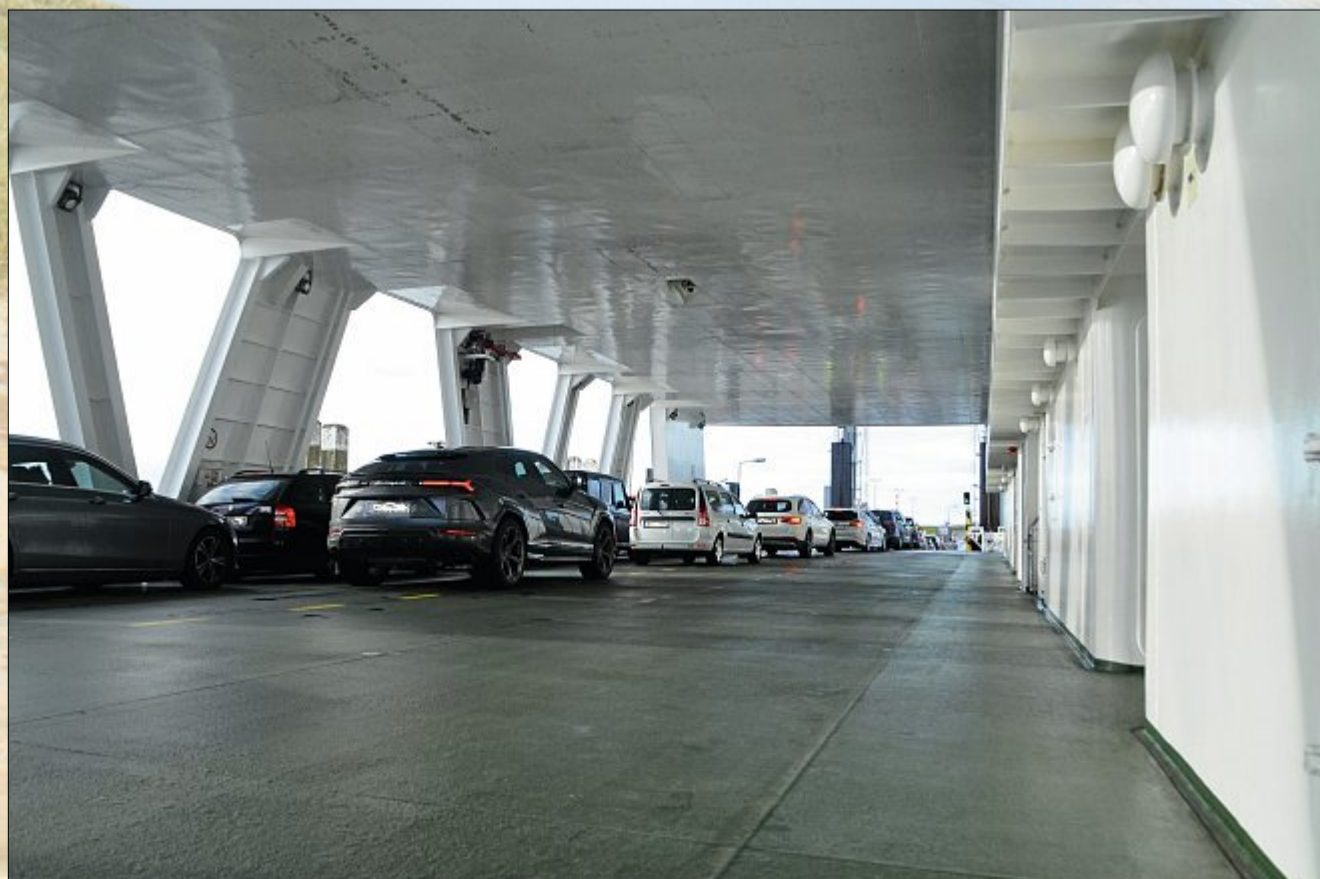
Der Anreiseverkehr über die Festtage hielt sich in Grenzen.