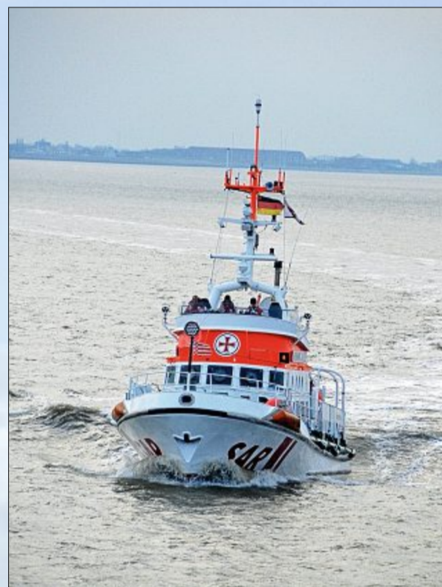
Für Seenotretter gibt es nur Wochentage.