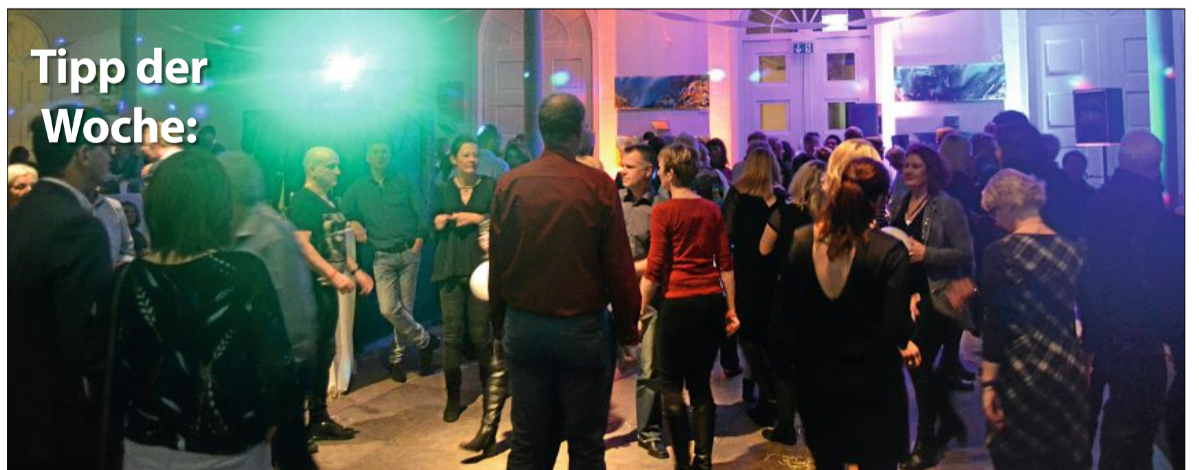
Silvesterparty: Gemeinsam mit Freunden und der Familie das neue Jahr begrüßen, das ist in der Silvesternacht im Conversationshaus bei der großen Silvesterparty möglich.

Wenn auch Sie Ihre Veranstaltung hier veröffentlicht haben möchten, setzen Sie sich mit uns in Verbindung.