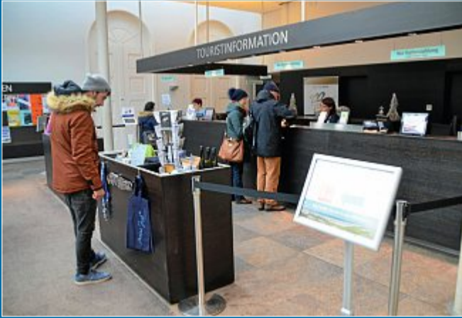
WIRTSCHAFT Kontaktloses Zahlen mit neuer Technik möglich

23. Dezember Tourist-Info ist fast bargeldlos