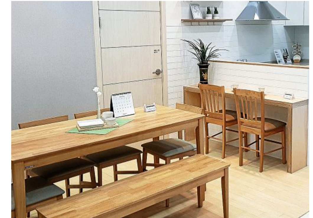
Bereits die Ausstattung der Ferienwohnung kann ausschlaggebend dafür sein, ob ein Gast wiederkommt oder nicht.

Dazu gehören auch Dinge wie der Außenbereich. Macht es Sinn,