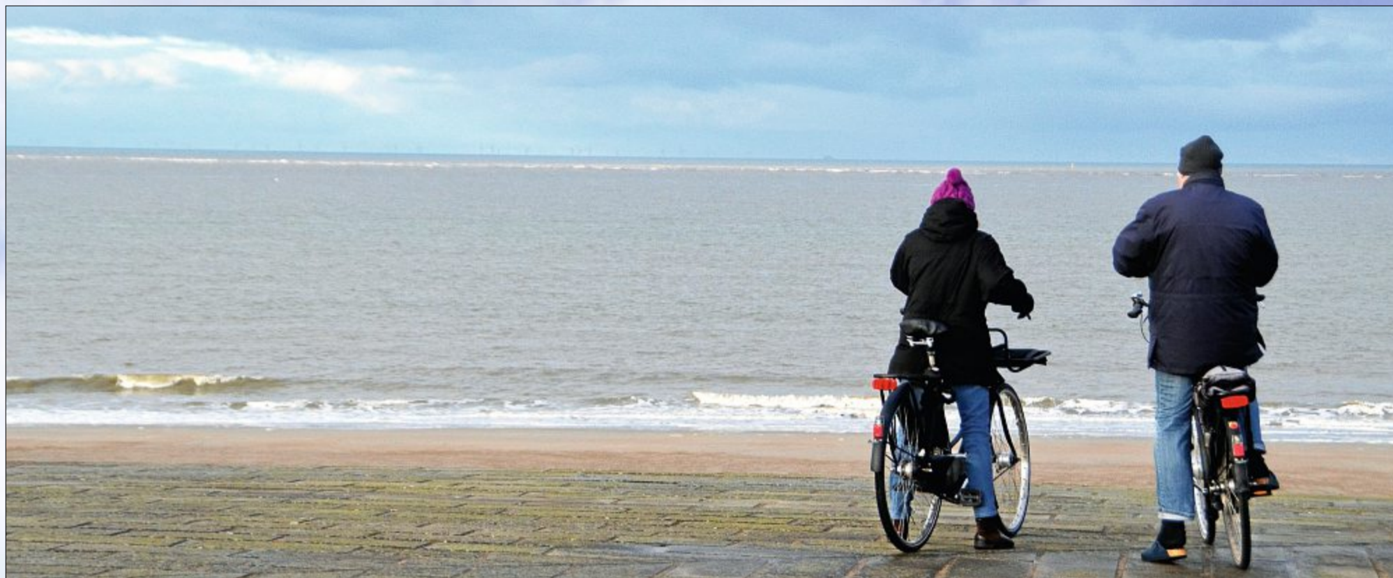
Nahezu freien Blick gab es über die Festtage über den Strand auf das Meer.