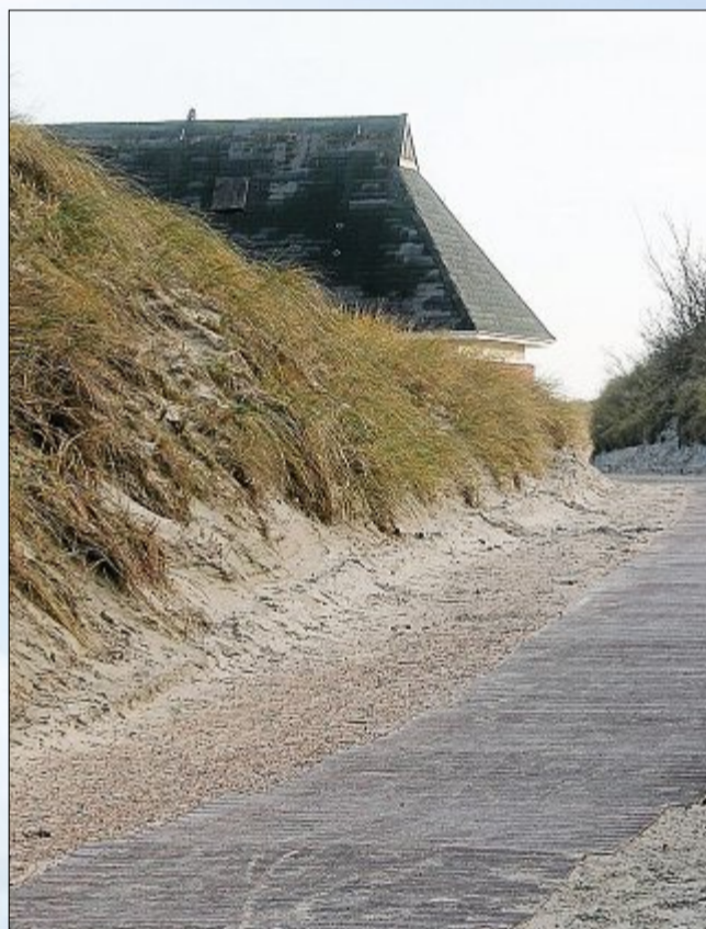
Wenig Menschen waren trotz Sonnenschein unterwegs.