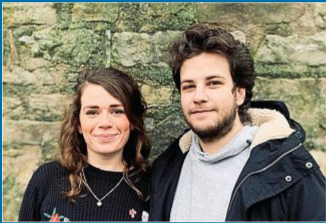
KULTUR Musikalische Begleitung der Billy-Wilder-Komödie

24. Dezember Norderneyer Stimme für „Irma la Douce“