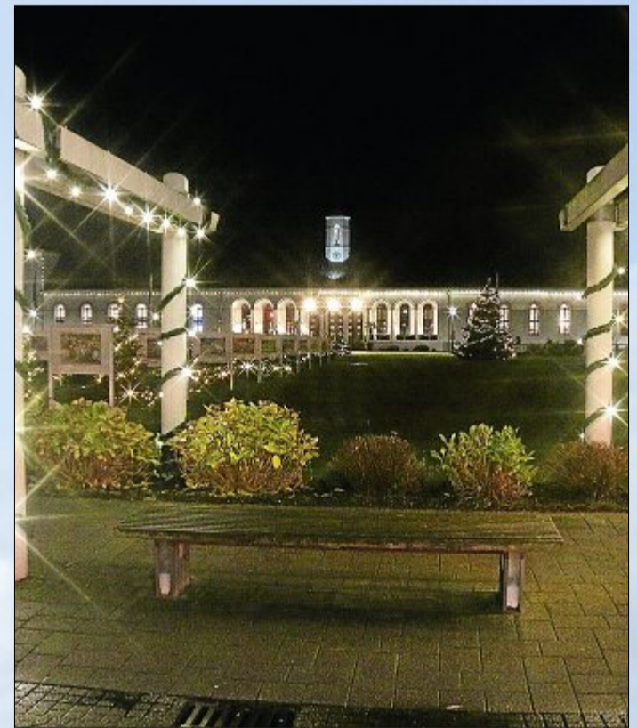
In einer solch besinnlichen Atmosphäre nimmt man sicher gern auf einer Bank im Freien Platz – vorausgesetzt sie ist trocken.