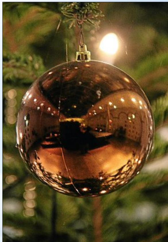
Die Vorfreude steigt und die ersten Bäume sind schon geschmückt worden.