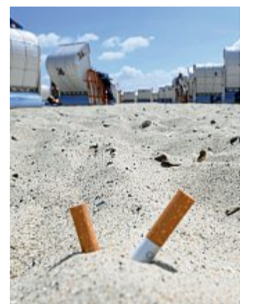
An den Stränden auf der Insel gibt es viel Müll.

Die Inselkommunen versuchten auf unterschiedlichen Wegen, einen Ausverkauf zu stoppen. So soll auf Norderney ein strenges Regelwerk verhindern, dass Wohnraum für gewerbliche oder berufliche Zwecke umgewandelt wird. Die neue Satzung sieht bei Verstößen Geldbußen bis zu 100 000 Euro vor. Auch auf Baltrum regelt eine spezielle Satzung, dass die Aufteilung von Wohnraum genehmigt werden muss.