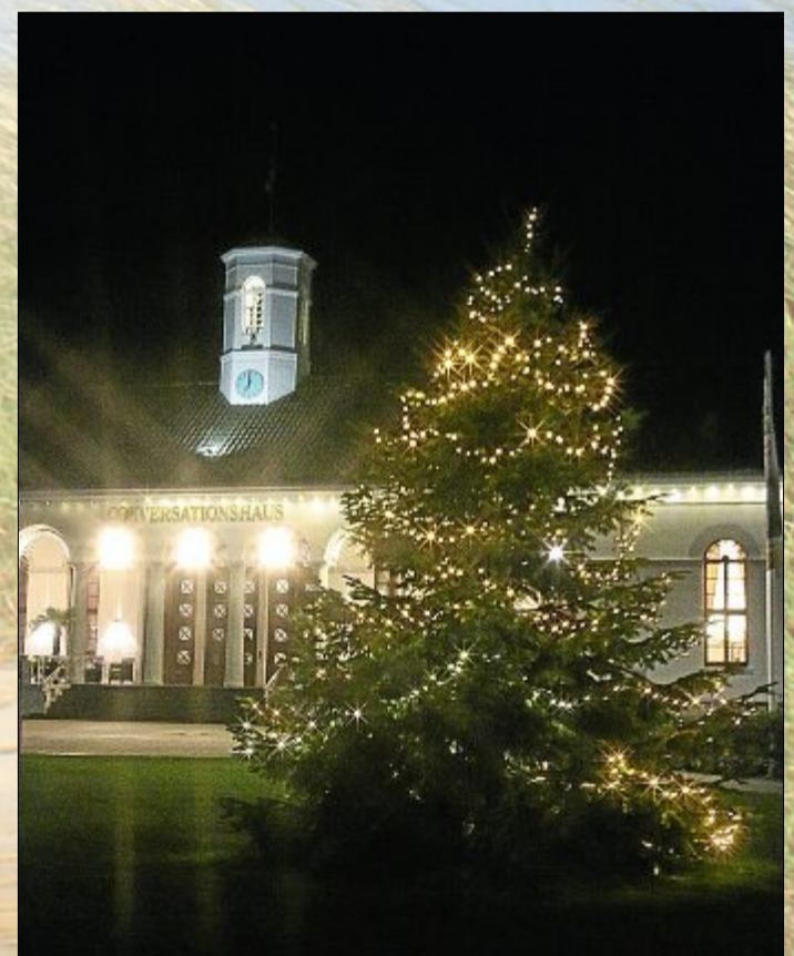
Schön geschmückte und beleuchtete Weihnachtsbäume dürfen auf öffentlichen Plätzen während des Advents nicht fehlen.