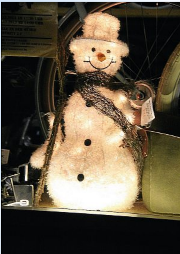
Beleuchtung kann zu Weihnachten jede Form annehmen.