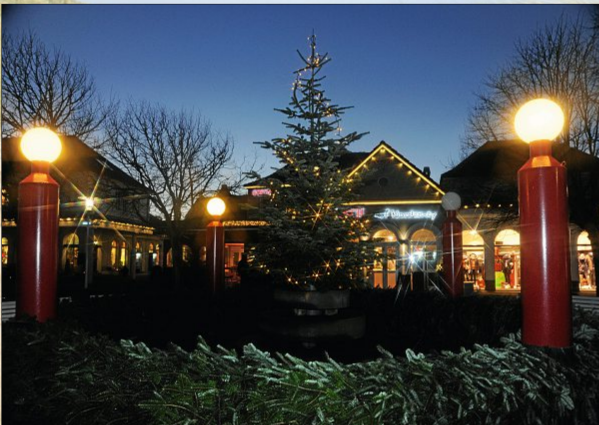
Lange dauert es nicht mehr, bis das vierte Lichtlein brennt. In zwei Tagen wird das dritte Licht angezündet.