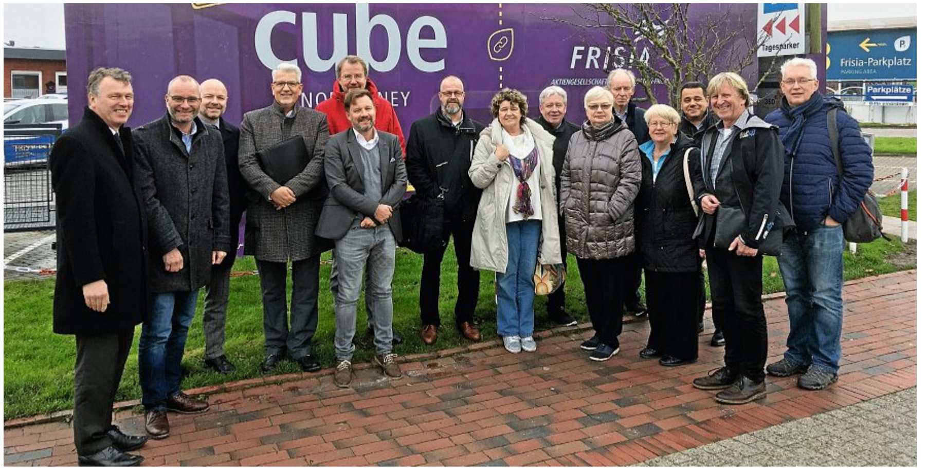
Der Tourismusausschuss der IHK vor dem digitalen Hotel-Modul „cube“ der Reederei Norden-Frisia.

Vor allem der Campingbereich boome weiterhin. Und auch die Umbauarbeiten am Strand in Norddeich taten den Gästezahlen keinen Abbruch. Eine der zentralen Herausforderungen bleibe aber der Mangel an Fach- und Arbeitskräften. „In der Hauptsaison geraten viele Betriebe in der Region mittlerweile an ihre Kapazitätsgrenzen. Eine Verkürzung des Sommerferienkorridors würde dieses Problem noch verschärfen“, so Fröhlich. Hintergrund ist