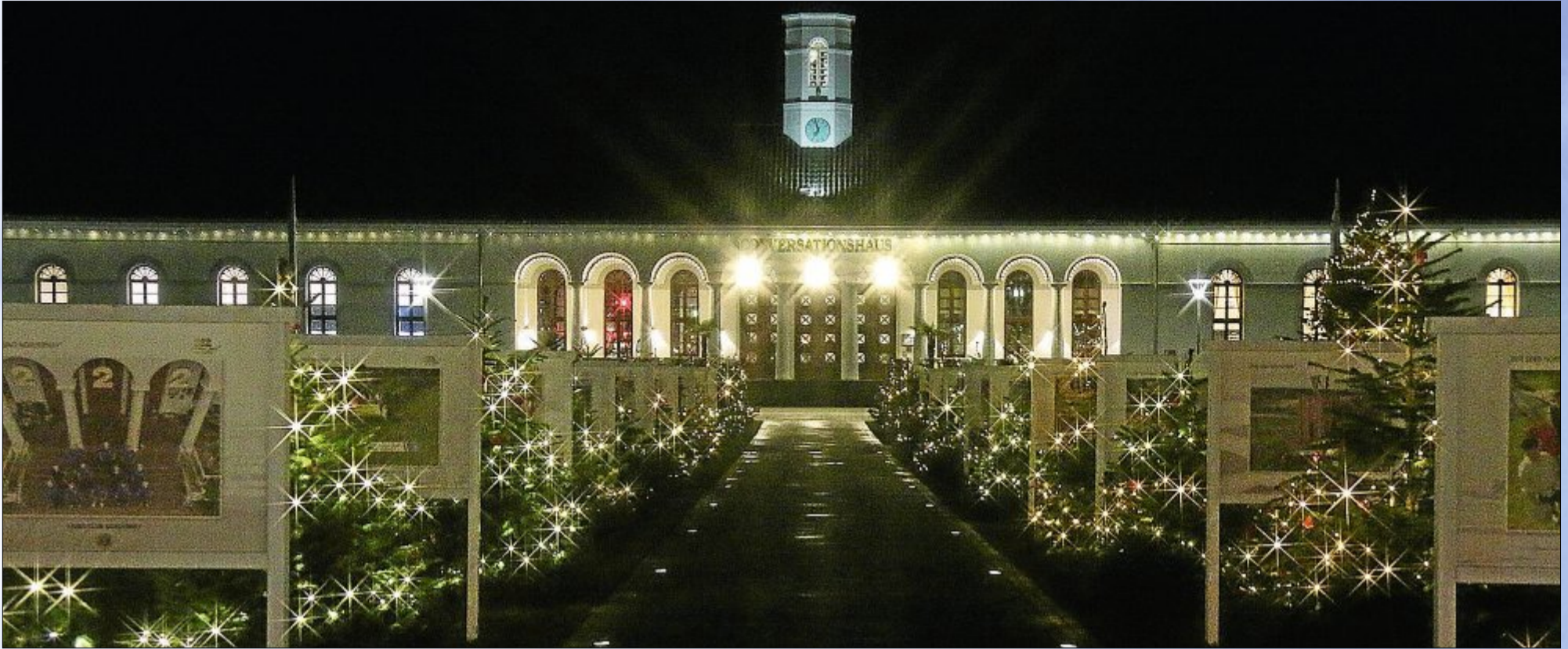
Die Weihnachtsbäume am Wegesrand machen den Gang zum Conversationshaus zu einem märchenhaften Erlebnis.