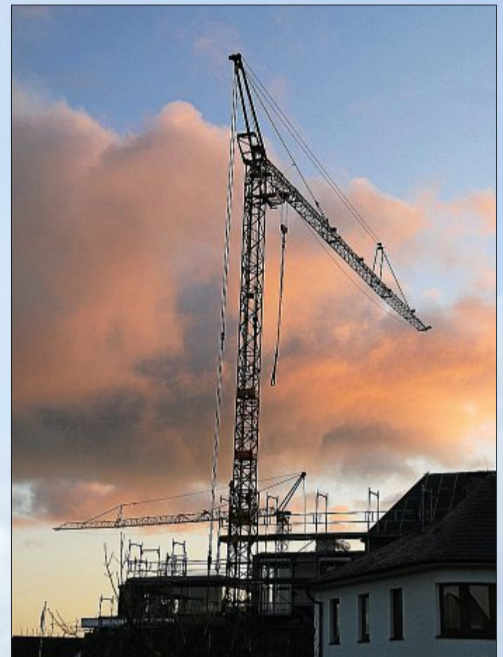
Im Winter ein Gegenstand, den man vermehrt auf Norderney sieht: den Kran.