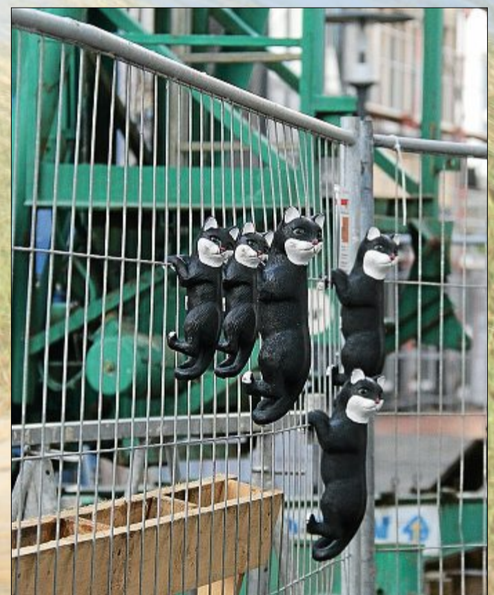
Neugierde siegt – Die kleinen Katzenfiguren erklimmen den Zaun.