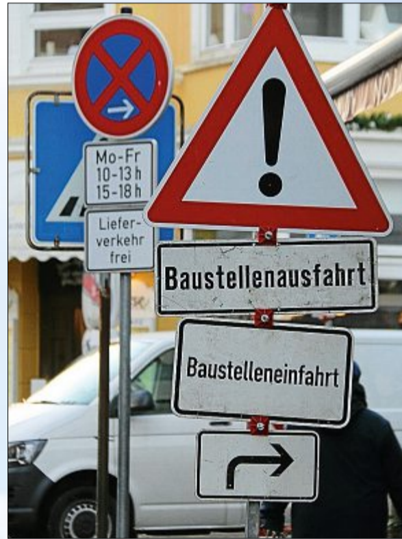
Auf den ersten Blick wirken diese Schilder nur verwirrend.