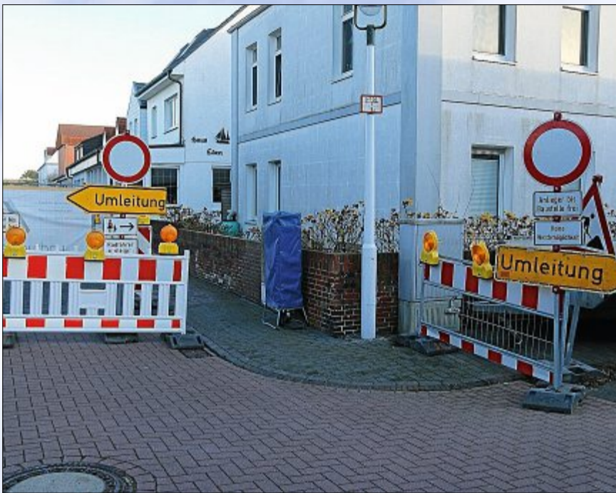
Es fällt schwer, sich im Schilderwald zurechtzufinden.