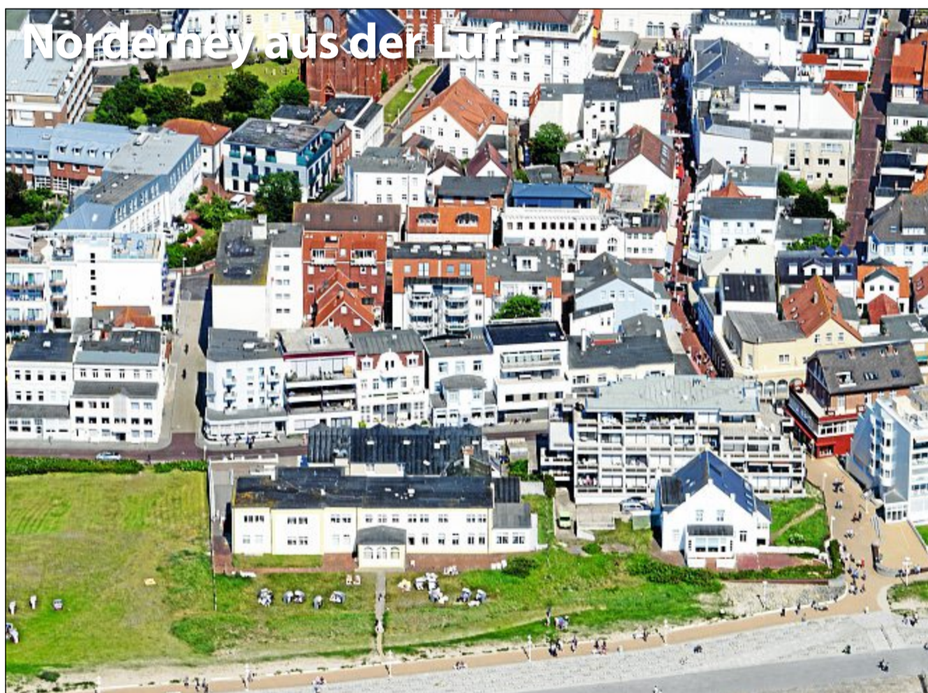
Die Bestellnummer lautet: Norderney Kurier 1049

Gesamtherstellung: Ostfriesischer Kurier GmbH & Co. KG, Stellmacherstraße 14, 26506 Norden Geschäftsführung: Charlotte Basse, Gabriele Basse, Victoria Basse Redaktion: Heidi Janssen, Thomas Fastenau, Ellen Sörries Anzeigen: Sabrina Hamphoff, Tido Ruhr Vertrieb: Benjamin Oldewurtel Druck: Industriedruck Norden, GmbH & Co. KG Für unverlangt eingesandte Manuskripte und Fotos wird keine Gewähr übernommen. Telefon: siehe Seite 1 Erscheinungsweise: einmal wöchentlich Verteilung: kostenlos an alle Haushalte und an mehr als 40 Ausgestellen Auflage: 4500 Exemplare