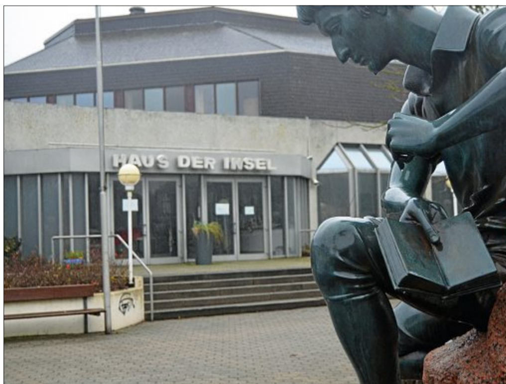
Noch steht das Haus der Insel. Bald sollen die Bagger anrollen und das Gebäude abreißen. Doch was danach mit dem Standort geschieht, ist noch offen.

Erste Abriss-Überlegungen gab es schon 2009. Wegen erheblicher Mängel beim Brandschutz und bei der Elektrik hatte die Un-