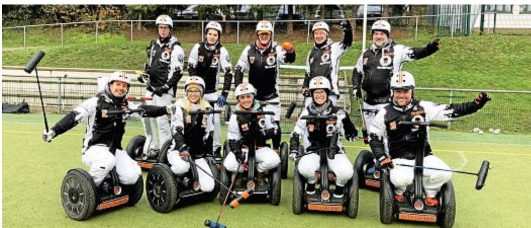
Das Team der „Norderneer Pirates“ durften in Solingen beim Nikolausturnier mitspielen.

Als Nächstes steuern sie nun die Europameisterschaft im Juni an. Das große Ziel bleibt aber die Weltmeisterschaft.