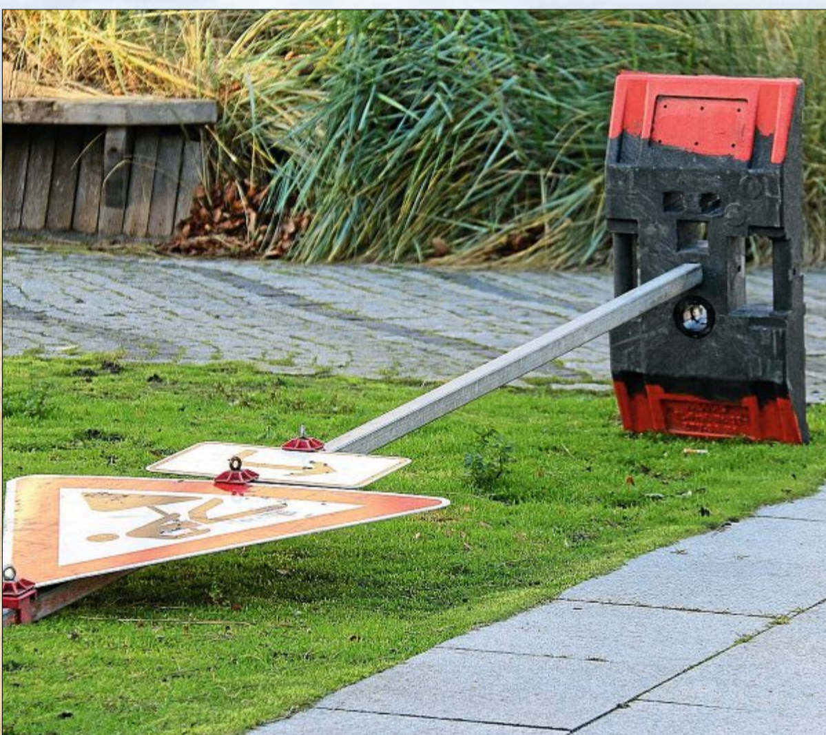
Das Schild hat es bereits umgehauen.