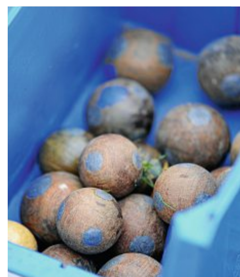
An der Tabellenspitze der Bofler auf Norderney gibt es keine Veränderung. Weiterhin steht Putz Hum ganz oben.

Keine Mannschaft konnte sich klar absetzen und so standen im Ziel dann 66 Meter für Wasserbau auf dem Messrad und mar-