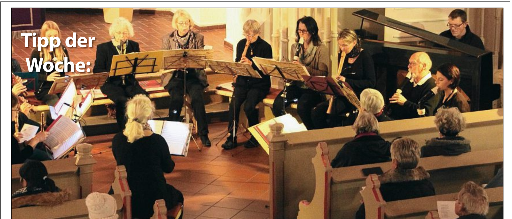
Adventskonzert: Der Kreis für Alte Musik verzaubert seine Zuhörer und schickt sie auf eine Reise durch die Jahrhunderte zu Adventschorälen und stimmt so auf die Weihnachtszeit ein. Das Konzert findet am Sonnabend um 17 Uhr in der Inselkirche statt. ARCHIVFOTO

Wenn auch Sie Ihre Veranstaltung hier veröffentlicht haben möchten, setzen Sie sich mit uns in Verbindung.