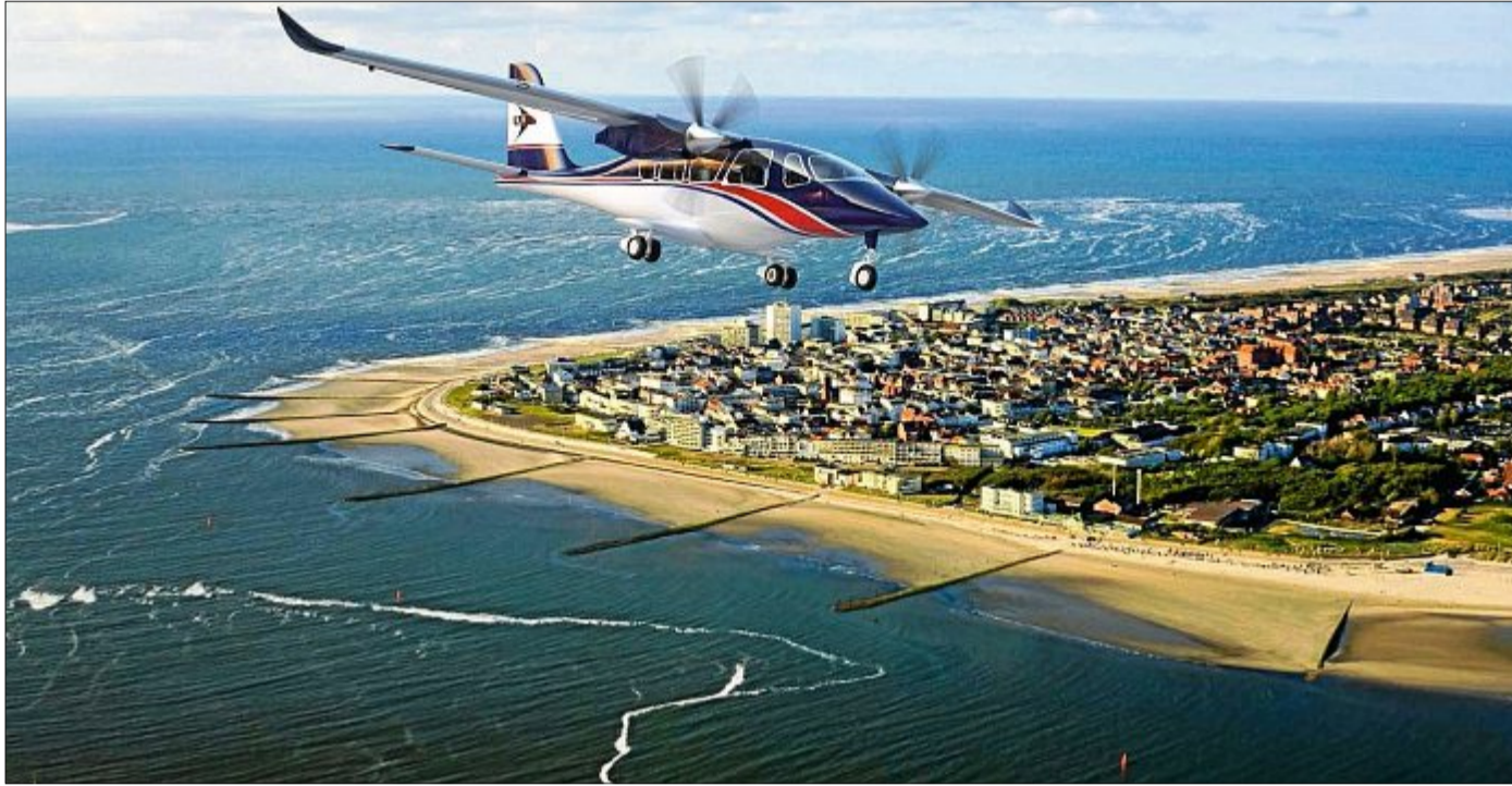
Die Britten-Norman-Islander wurde vor mehr als 40 Jahren entwickelt, ist der Inbegriff des Busch- und Inselflugzeugs – und das Modell für den E-Flieger von morgen.

Die beiden Ingenieure John Britten und Desmond Norman konzipierten das zweimotorige Mehrzweckflugzeug in den 60er-Jahren, um schlecht erschlossene Regionen mit unbefestigten Flugplätzen andienen zu können: Inseln, den tropischen Regenwald, das Australische Outback. Auf das Ursprungsmuster BN-2 folgte die Version BN-2A und später die weiter verbesserte BN-2B. Von außen sind die Varianten nur an Details zu unterscheiden. Durch ihre Leistungsstärke wurde die Britten-Norman-Islander seit ihrem