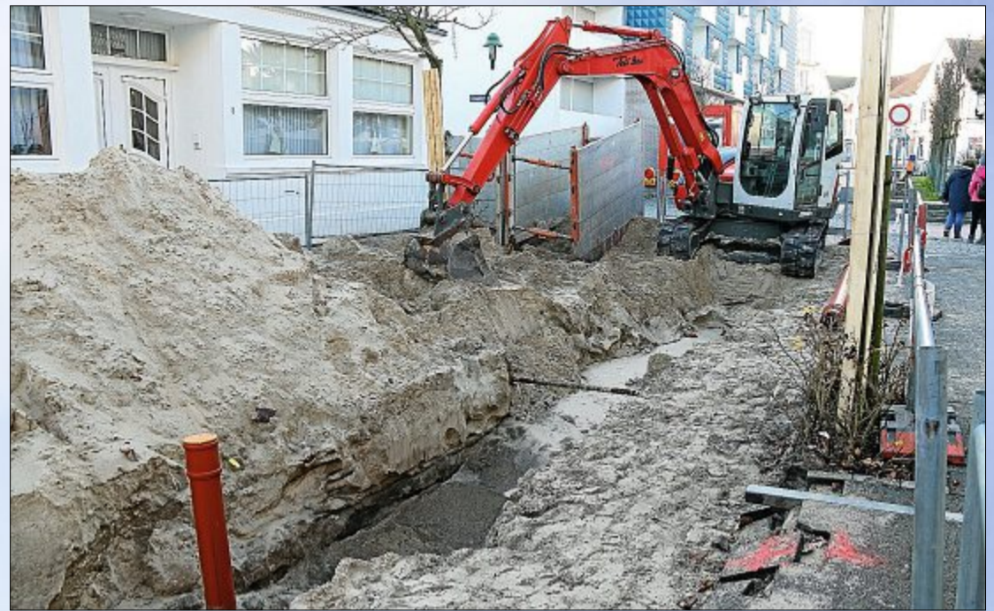
Baustellen sind häufig der Grund dafür, dass Schilder aufgestellt werden.