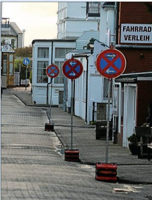
Hier darf nicht geparkt werden, also gar nicht.