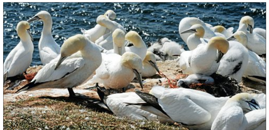
Basstöpel gehören zu den fünf Vogelarten, die auf Helgoland vorkommen. Zur Brutzeit kommen Tausende der Vögel auf die Hochseinsel.

Auf Helgoland lässt sich fast ganzjährig der Vogelzug beobachten. Natürlich gibt es, wie im Wattenmeer auch, Hochzeiten von Ende März bis Mitte Mai und von Ende August bis Anfang November. Viele Zugvögel überfliegen aber nur die Felseninsel. Nur in Ausnahmefällen legen die Vögel eine Rast ein. Generell sind aber in dieser Zeit sehr viele Vögel auf Helgoland, da die Büsche, Wiesen, Strände und das umgebende Meerwasser sehr einladend sind und es ein gutes Nah-