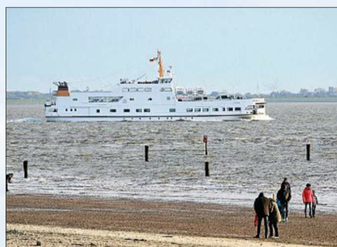
Tschüss, bis zum nächsten Mal.