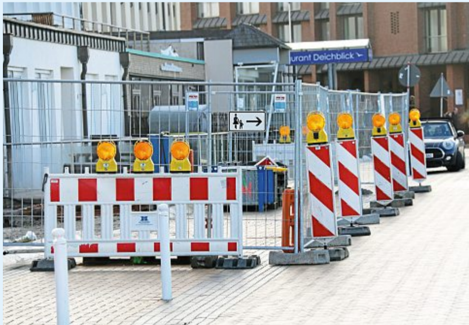
Auf der Kaiserstraße muss der Fußgängerverkehr noch immer umgeleitet werden.

Für Transporte, Abbruch- und Erdarbeiten sowie Pflasterarbeiten und Entsorgungen sind wir Ihr Ansprechpartner auf der Insel!