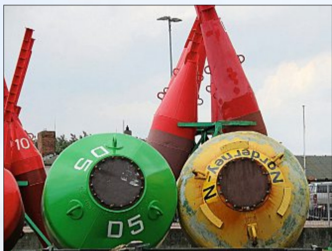
Auch die Schifffahrtszeichen gehen in den Winterschlaf.