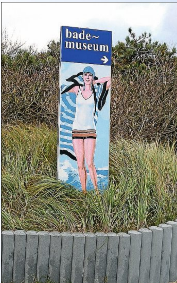
Zur Zeit wohl die einzige leicht bekleidete Dame am Strand.