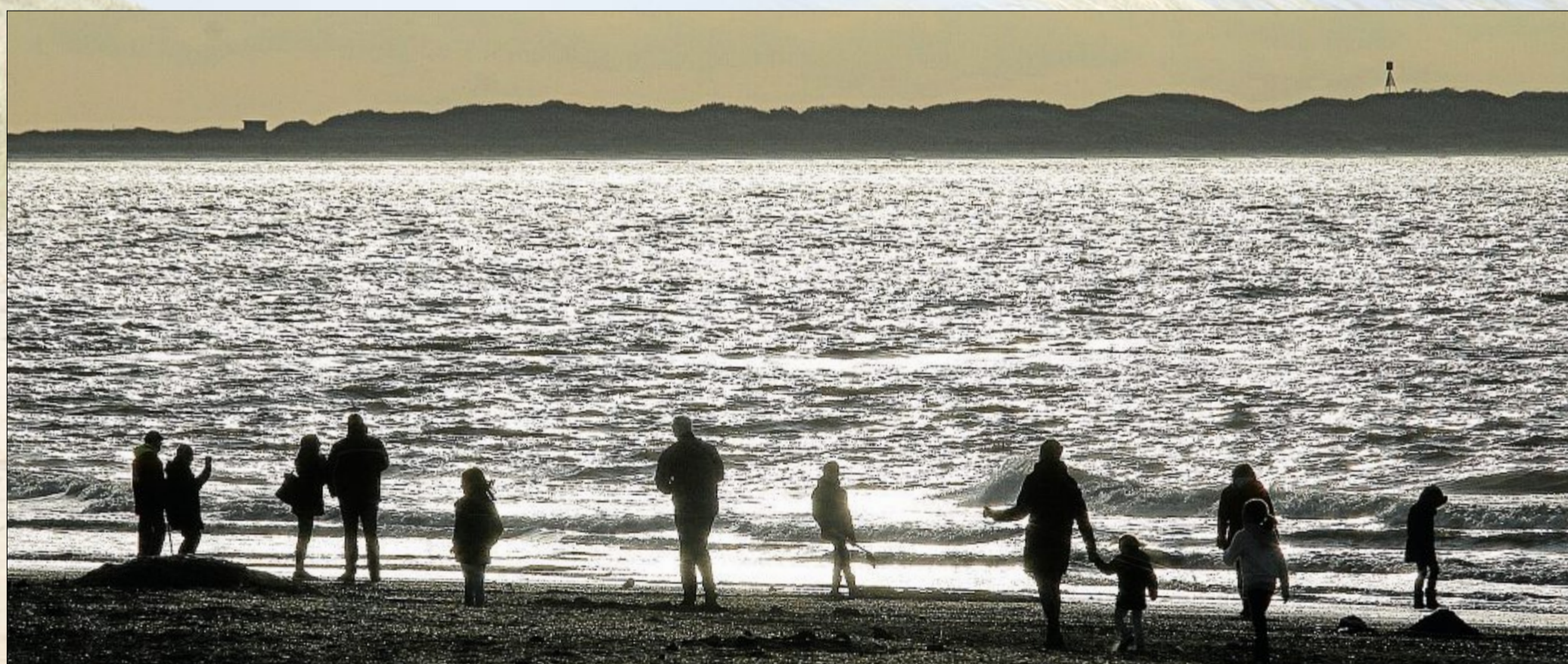
Wenn die letzten wärmenden Sonnenstrahlen heraus kommen, geht es auch mal ohne Strandkorb.