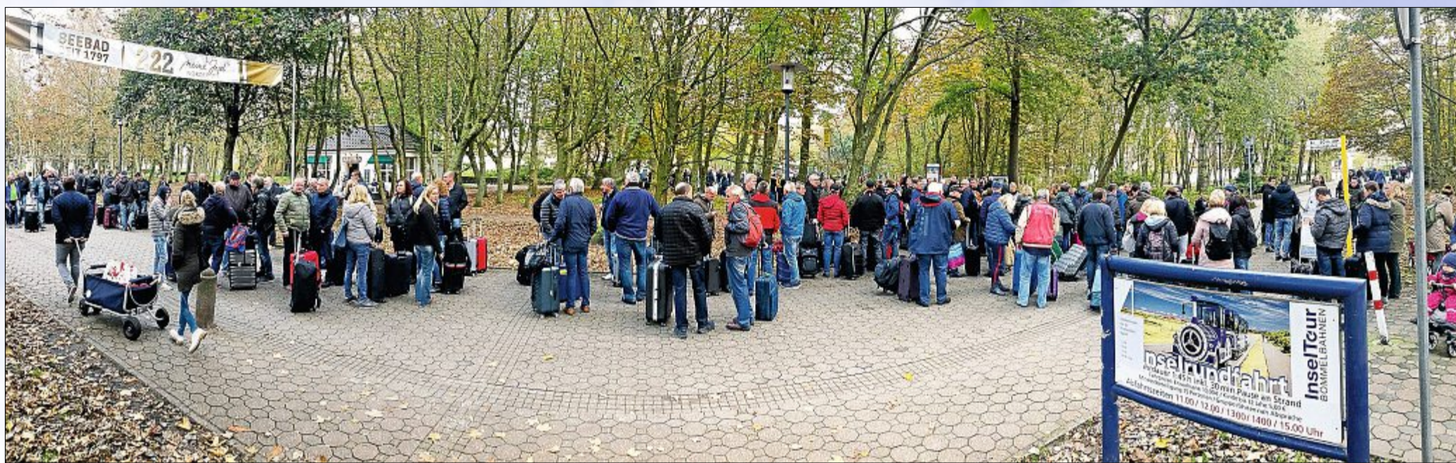
Hunderte von Abreisenden warteten am letzten Wochenende auf den Bus zum Hafen. Das ist selbst für Norderney ein ungewöhnliches Bild.