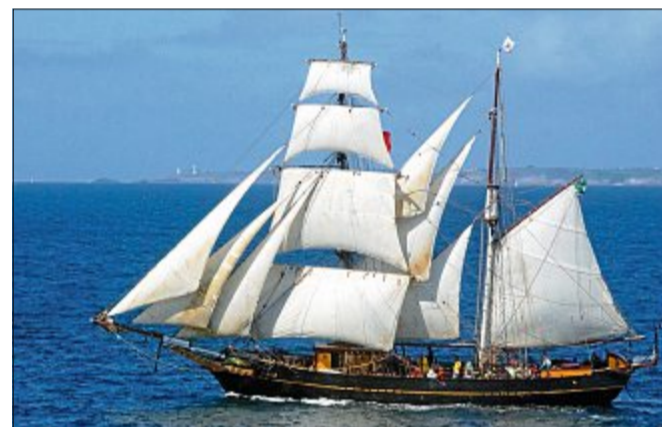
Die „Tres Hombres“ unter vollen Segeln auf der Fahrt von der Karibik nach Amsterdam.

Amsterdam angekommen, werden die Kakaobohnen von den „Chocolate Makers“ zu Schokolade verarbeitet. Diese wird dann aber nicht wie sonst, in LKWs, in die verschiedenen Supermärkte gefahren, sondern mit dem Fahrrad! Die sogenannte „Schokofahrt“ ist eine Aktion, bei der sich über 150 Radfahrer und Radfahrerinnen freiwillig melden, um die Schokolade klimafreundlich zu uns zu bringen. Toll, oder? So hat auch einer dieser Schokofahrer letzte Woche die 100 Tafeln ganze 250 Kilometer von Amsterdam