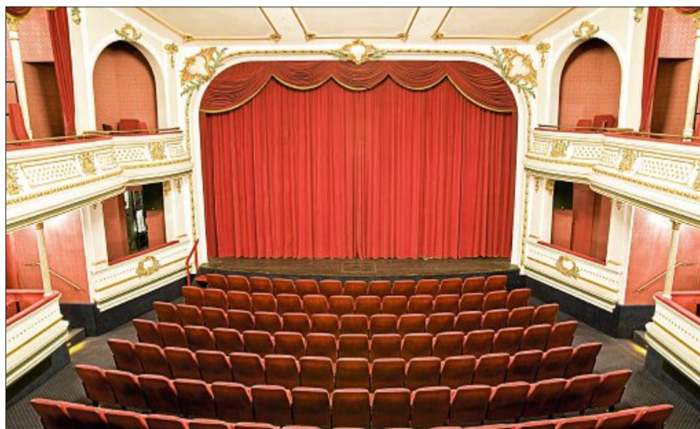
Besonders betroffen ist die Wand zur Trennung von Bühne und Zuschauersaal. Mit Stahlträgern soll das Gebäude kurzfristig gesichert werden. FOTO:

In der nächsten Zeit werden laut Schönemann in Abstimmung mit Statiker, Denkmalschutzbehörde und weiteren Beteiligten besprochen, wie die Sicherung, konkret die Stahlstützen, angebracht werden. „Wenn das insgesamt mit allen erforderlichen Genehmigungen