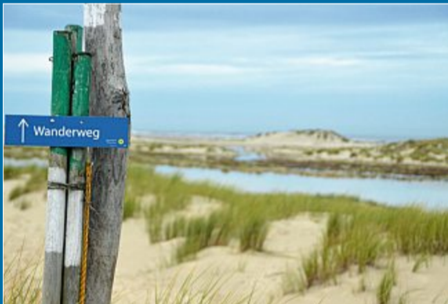
NATUR Bei Hochwasser ist hier Achtsamkeit gefragt

22. Oktober Inselosten: Die Gefahr im Blick