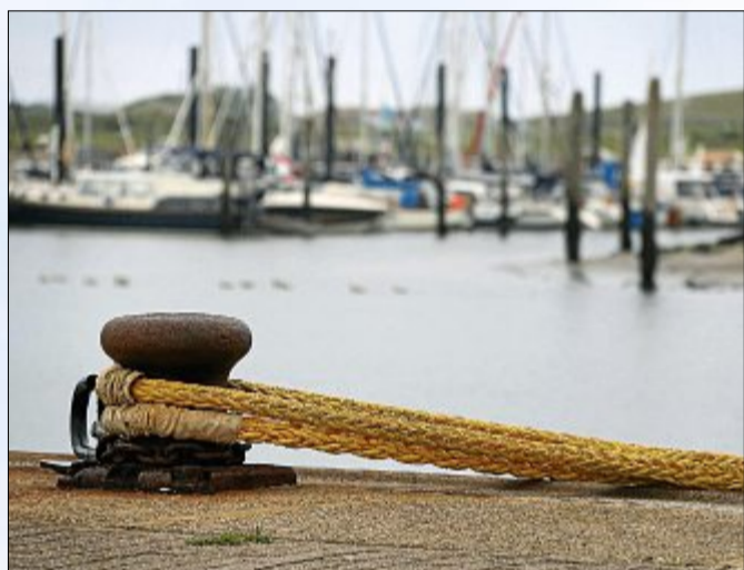
Nur noch weniger Segler machen jetzt fest.