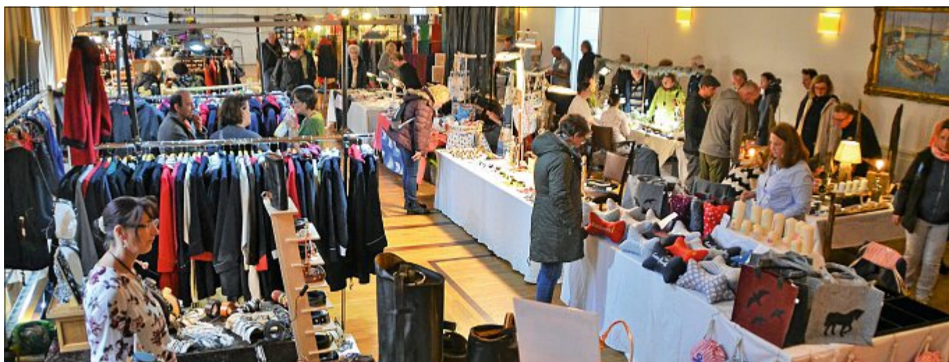
Ob Einzelstück oder in Kleinserie produziert. Die auf dem Markt angebotenen Waren haben meist den Charakter des Individuellen, da sie von Künstlerhand gefertigt sind.

Dekoratives, Nützliches und Zauberhaftes für Groß und Klein – das Angebot ist vielfältig und ein Rundgang über diesen Markt für schöne Dinge ein Muss für jeden, der Handgemachtes aus hochwertigem Material und edles Design schätzt. Alle anwesenden Handwerker, Desi-