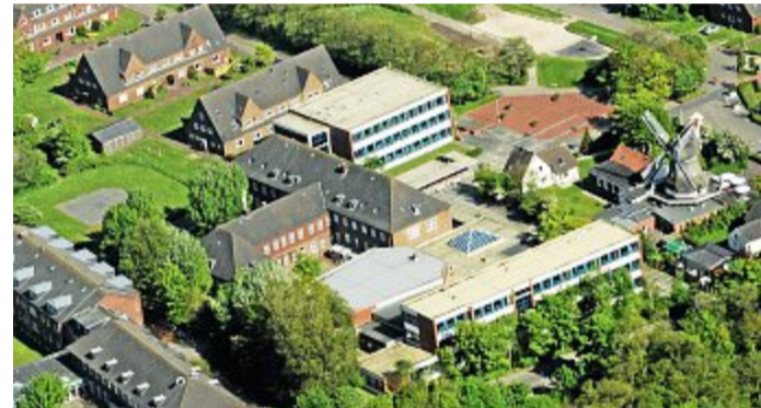
Noch ist die Prüfungsphase nicht vorbei, aber bis dato wurden die Grundlagen an Informationen geschaffen, um eine Entscheidung über die Situation der Norderneyer Schulen zu treffen.