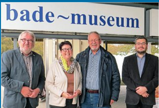
KULTUR DIE ÜBERRASCHUNG BLEIBT ALS URLAUBSERINNERUNG

24. Oktober 10 000. Besucher im Bademuseum