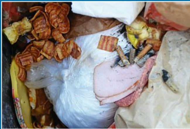
WIRTSCHAFT Kampagne zur optimalen Müllsortierung

23. Oktober Biomüll wird schlecht getrennt