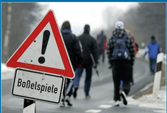
SPORT Ligaspiele beginnen im November