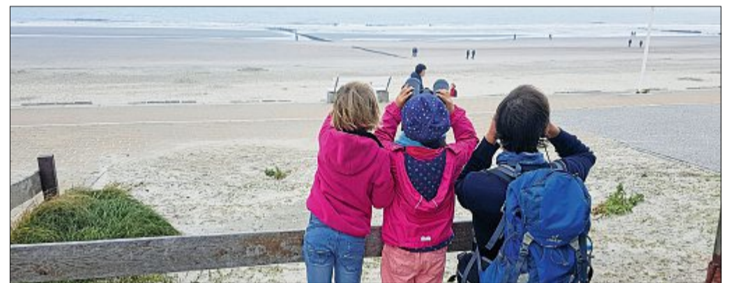
Was fliegt denn da? Während der Zugvogeltage werden an zwei Beobachtungsstellen Ferngläser und Informationsmaterial bereitgestellt.

Norden kommen, fliegen manche auch über das Partnerland der Zugvogeltage in diesem Jahr: Estland.