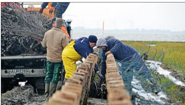
Nur händisch kann das Buschwerk eingebracht werden.