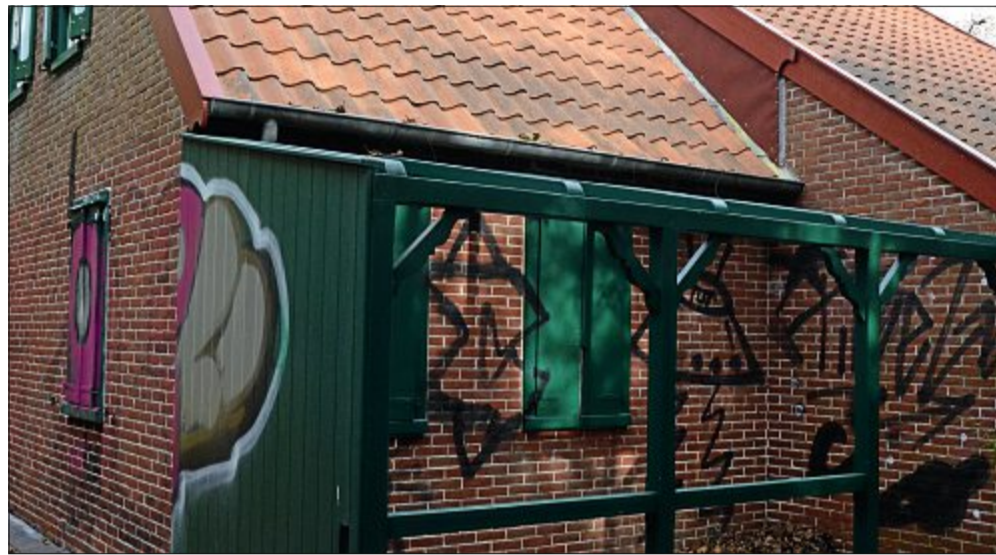
Der linke Teil der Ziegelwand wurde bereits gereinigt, aber noch immer sind die Farbspuren zu erkennen.

Der Heimatverein Norderney bedankt sich bei den Einheimischen und Gästen für die Spendenbereitschaft anlässlich des Vandalismus am Fischerhaus-Museum. Noch immer ist es für die vielen ehrenamtlichen