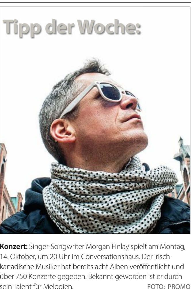
Konzert: Singer-Songwriter Morgan Finlay spielt am Montag, 14. Oktober, um 20 Uhr im Conversationshaus. Der irisch-kanadische Musiker hat bereits acht Alben veröffentlicht und über 750 Konzerte gegeben. Bekannt geworden ist er durch sein Talent für Melodien. FOTO: PROMO

(Witterungsbedingte Änderungen sowie geänderte Öffnungszeiten an Feiertagen möglich, alle Angaben ohne Gewähr)