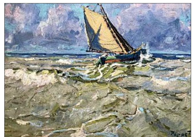
Auch auf dem Ausstellungsplakat: ein auslaufender Segler.