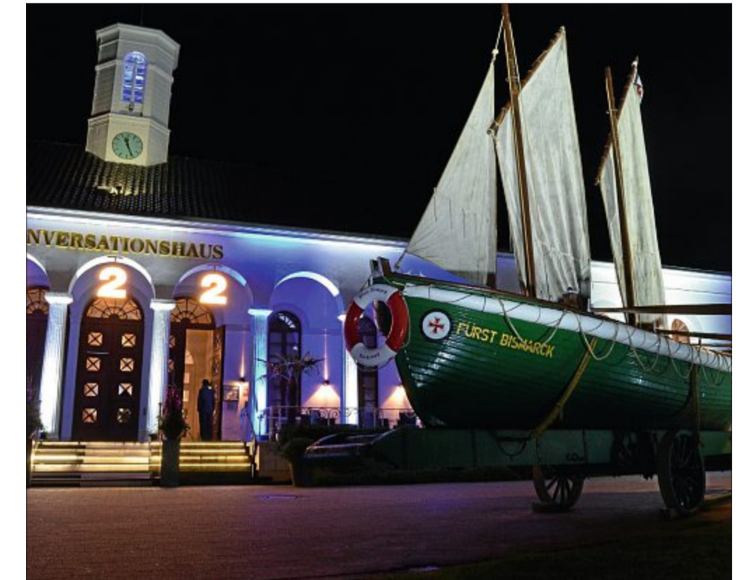
Schmucke Illumination und das historische Rettungsboot „Fürst Bismarck“ begrüßten die Gäste zum Festakt des 222-jährigen Jubiläums des Staatsbades.

Ob Lies an diesem Abend sein Beruf Freude machte? Sonnabendnachmittag hatte er wegen der Forschungsstelle eine Sitzung mit dem Verwaltungsausschuss, Ulrich flocht elegant eine Spitze und die Wehrhaftigkeit der Insulaner gegen die Schließung in seine Rede ein und später am Abend stellte sich der Umweltmi-