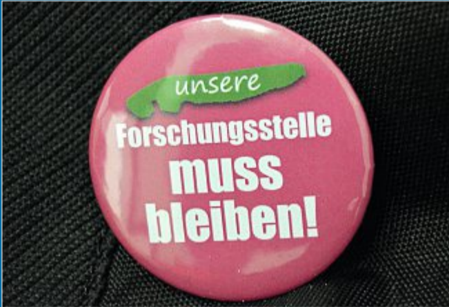
POLITIK Olaf Lies (SPD) teilt die Entscheidung mit

5. Oktober Forschungsstelle soll 2023 umziehen