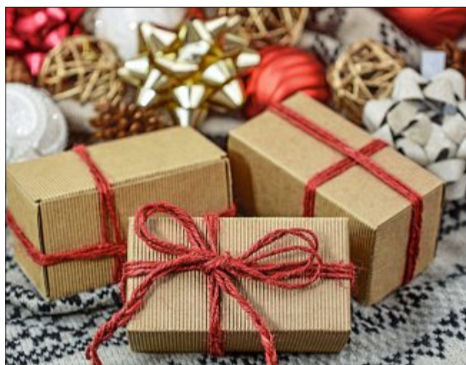
Päckchen können im SKN-Kundenzentrum abgegeben werden. ARCHIVFOTO

Päckchen für Kindergartenkinder (drei bis sechs Jahre), Grundschulkindern (sechs bis zehn Jahre) und Teenager (elf bis 15 Jahre), neutral oder jeweils für Jungen oder Mädchen. Die neutrale Variante nutzt auch Bodenstab, damit die Helfer vor Ort variieren können. Persönlich packt sie jedes Jahr vier Pakete, immer für Jugendliche, da