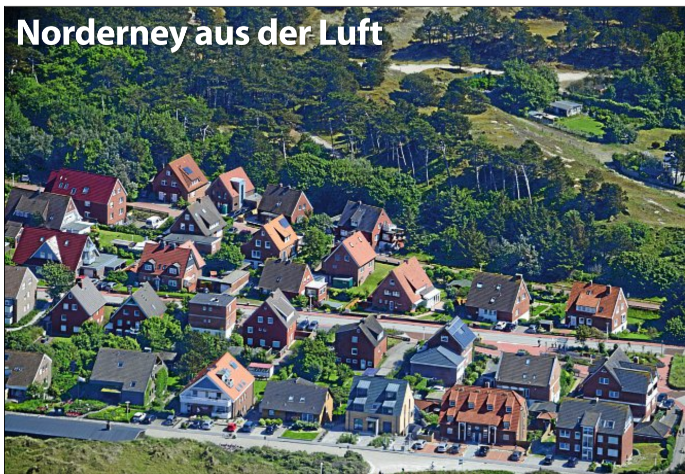
Die Bestellnummer lautet: Norderney Kurier 1041