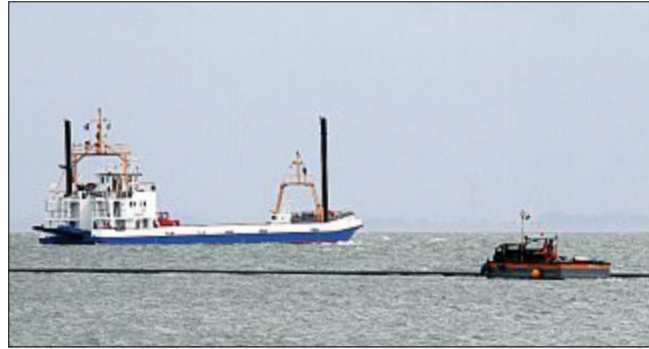
Deutlich ist das schwarze Rohr im Wasser zu erkennen, das schwimmend zum südlichen Arbeitsponton gebracht wird.

Im nächsten Schritt werden jetzt die Kabel, die in den vergangenen Wochen am Weststrand zu einer langen Einheit verschweißt worden waren, durch die