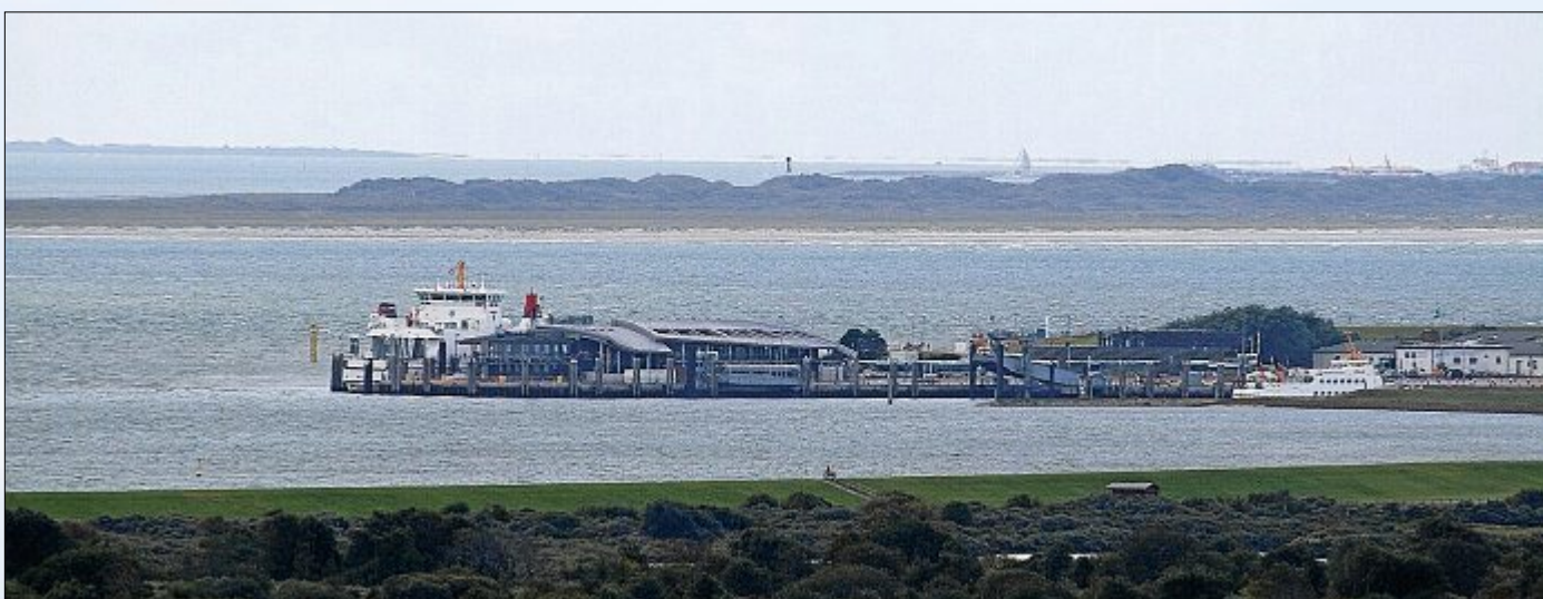
Ungewöhnliche Hafenspektive. Im Hintergrund Juist.