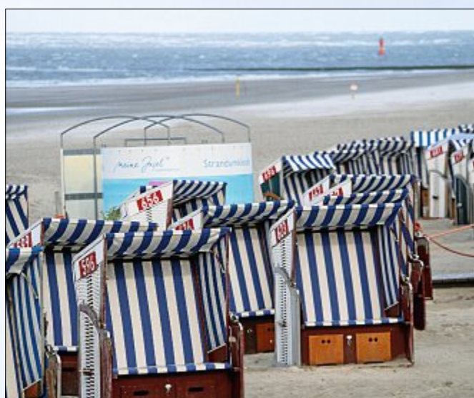
Bei solchem Wetter bleiben die Strandkörbe leer.