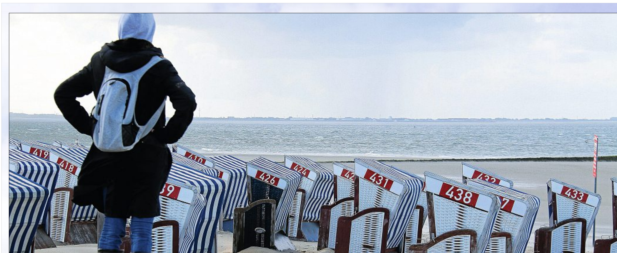
Das ist ja das Schöne an der Küste. Man sieht schon von Weitem, dass der Regen kommt und kann sich schnell ein warmes Plätzchen suchen, bis der Schauer vorbei ist.