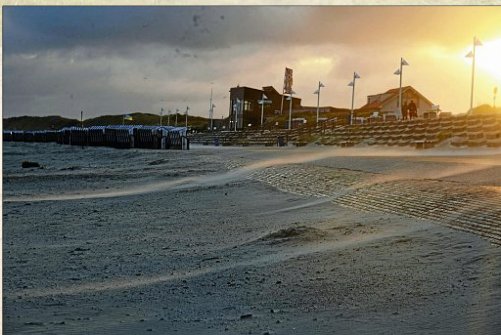
Wenn es frühmorgens schon so weht, wird es meist ein stürmischer Tag.