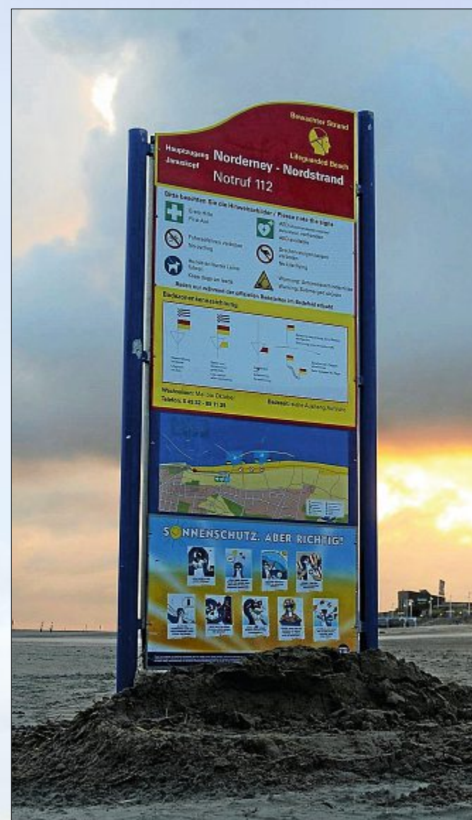
Alle Infos auf einen Blick. Nur nicht, wie das Wetter wird.