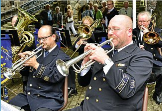
KONZERT Handgemachte Blasmusik auf dem Kurplatz