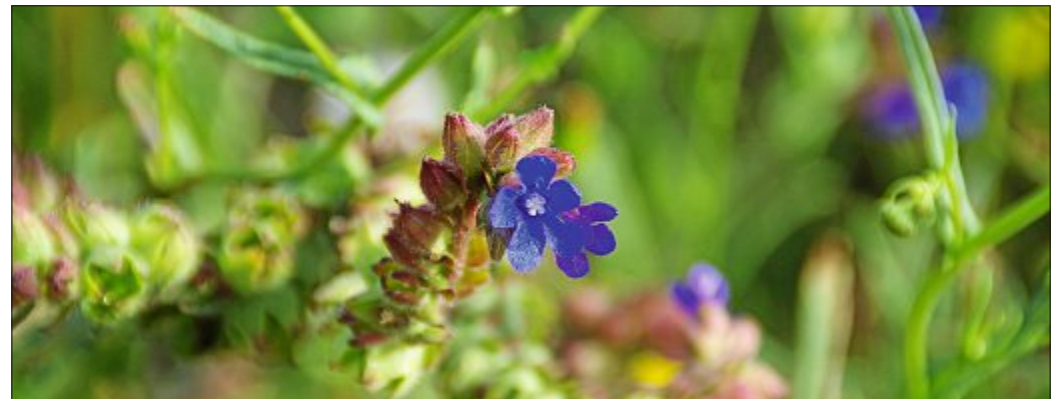
Die kleinen Blüten der Ochsenzunge fallen durch ihre violette Färbung auf. Besonders Schmetterlinge lieben diese Pflanze, die auf Norderney an vielen Stellen zu finden ist.

Die Ochsenzunge findet man überwiegend im südlichen Europa, aber vereinzelt auch weiter nördlich, wie bei uns auf Norderney.