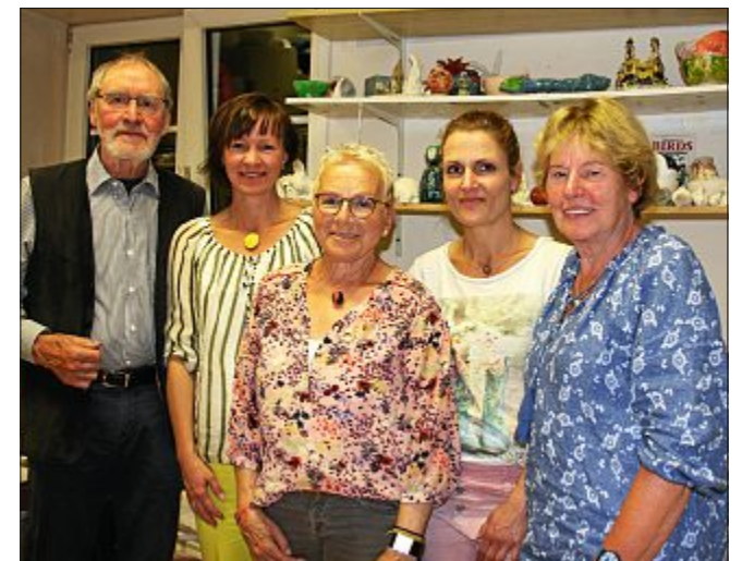
Der Vorstand des Kunst- und Literaturvereins stellt das neue Jahresprogramm auf der Hauptversammlung vor.

Das Programm – siehe Aufstellung – werde jetzt gedruckt und wie gewohnt noch vor Beginn der Herbstferien in den