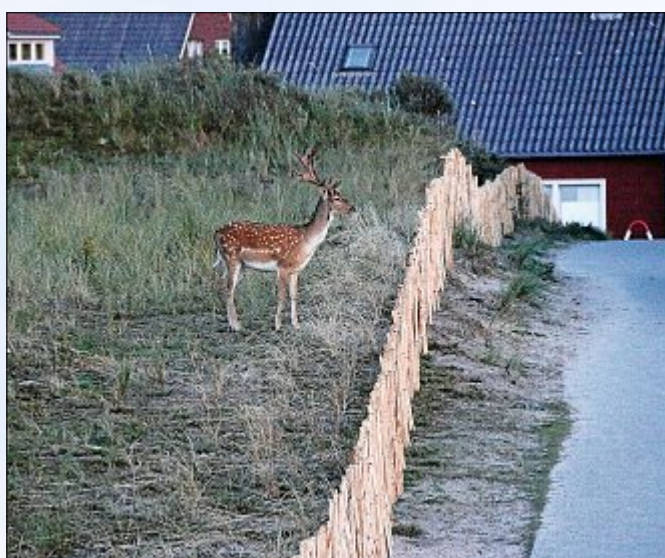
So ein Zaun funktioniert offensichtlich in beide Richtungen.