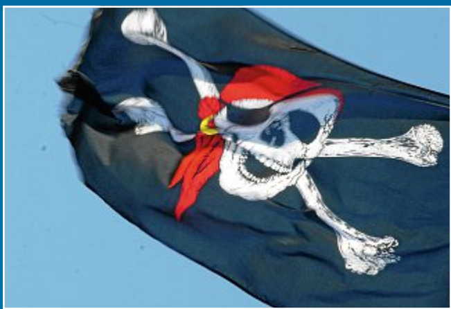
ANIMATION Schrecken der Meere

4. September Piratenwoche mit Valerie Drücker