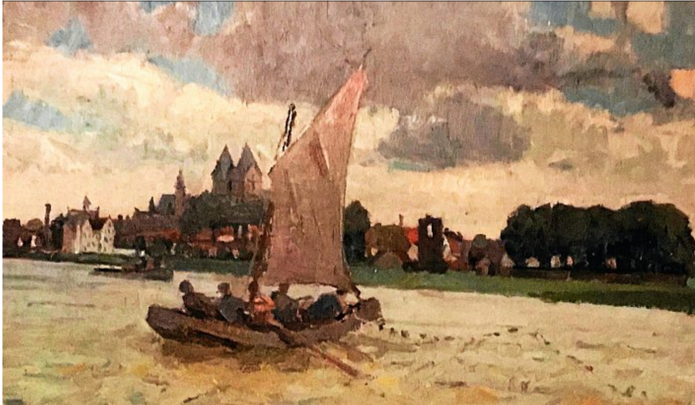
Im Jahr 1936 schuf Poppe Folkerts das Bild „Rees am Rhein“ bei einer Reise mit dem Boot rheinaufwärts. Dazu wurde am linken Rheinufer nahe Kalkar geankert.

Poppe Folkerts jetzt auch in Kalkar, weshalb? Er war nie ein Stubenhocker; als Künstler ein neugieriger Maler, der viel von der Welt sehen wollte. Skandinavien und den Mittelmeerraum kannte er von den großen Reisen (1900-1902) mit