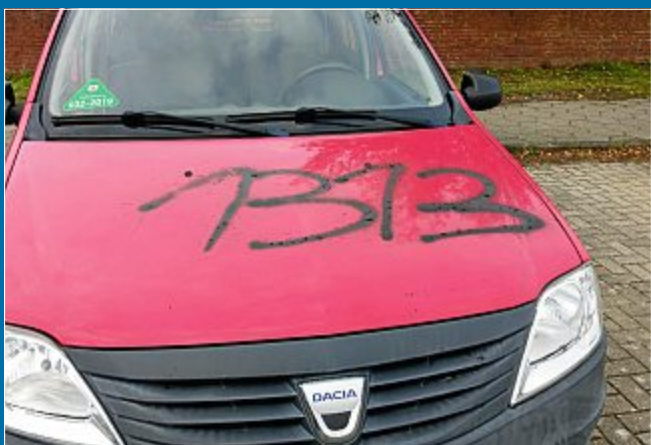
STRAFAT Sprayer beschmieren Autos, Schilder und Balkone

3. September Zwölf Motive – eine Signatur