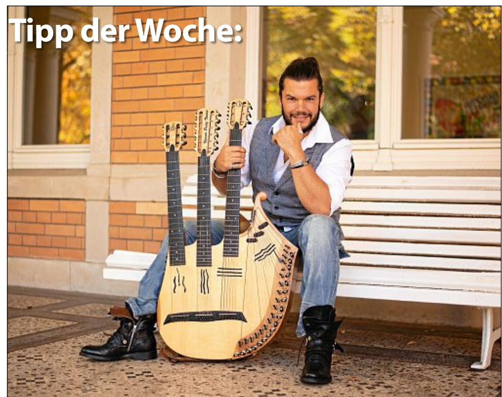
Konzert: Vicente Patiz begeistert mit seiner Virtuosität auf unterschiedlichen Instrumenten das Publikum. Er ist in der Lage mit seiner 42-saitigen Harfengitarre außergewöhnliche Klangwelten zu erschaffen. Donnerstag, 12. September, 20 Uhr, Conversationshaus.

Wenn auch Sie Ihre Veranstaltung hier veröffentlicht haben möchten, setzen Sie sich mit uns in Verbindung.