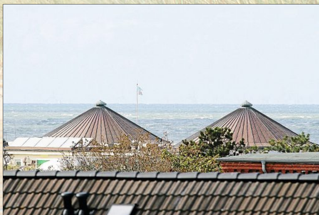
Für ein paar Minuten kommt dann immer wieder die Sonne raus.