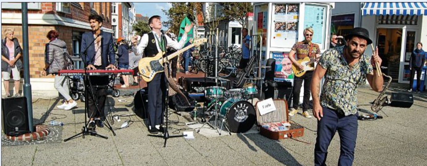
Die Band „Faela“ sorgte mit Guter-Laune-Musik für Stimmung in der Poststraße.