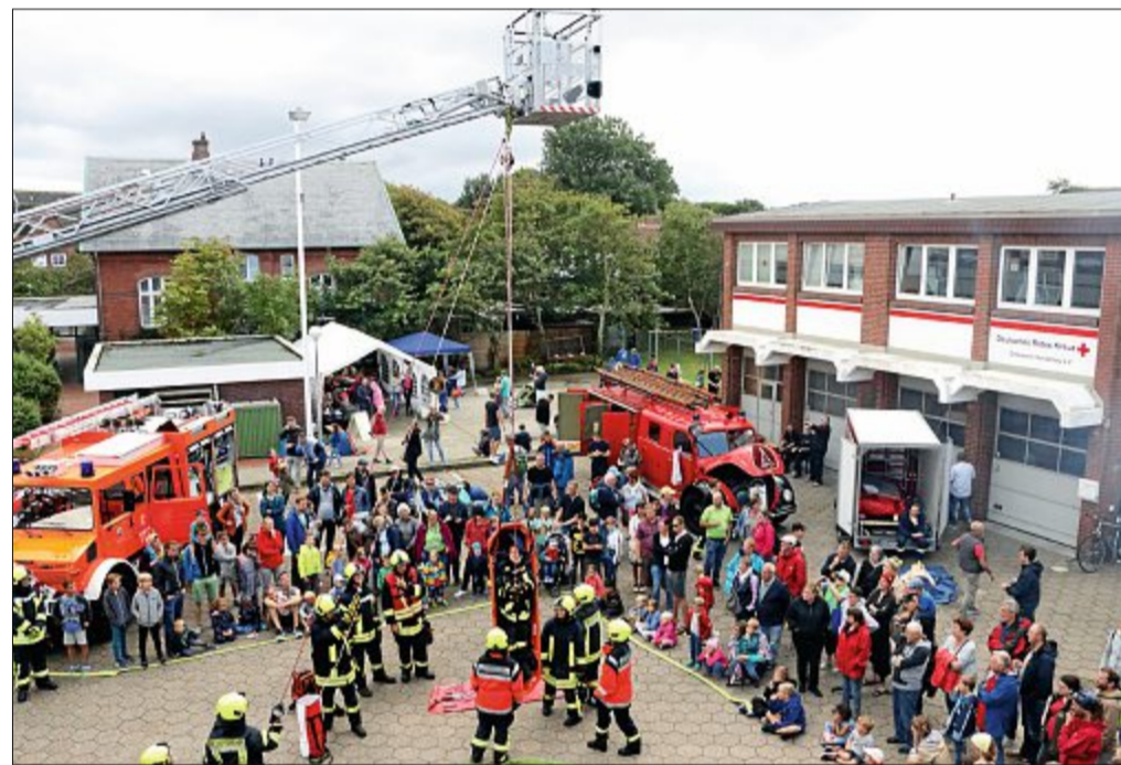
Eine Übung zeigt die Bergung eines Patienten, wobei die „First Responder“ die Vorbereitungen für die Kameraden übernehmen.

Heiß her ging es im Grillzelt, denn die Stamm- besucher des Feuerwehrfestes wissen, hier gibt es super leckere Hamburger.