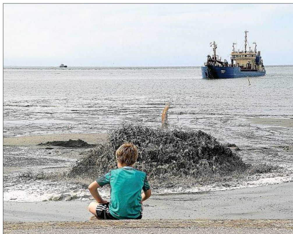
Für alle interessant: Die Aufspülmaßnahme am Norderneyer Strand ist abgeschlossen. Das gute Wetter unterstützte eine zeitgerechte Fertigstellung.