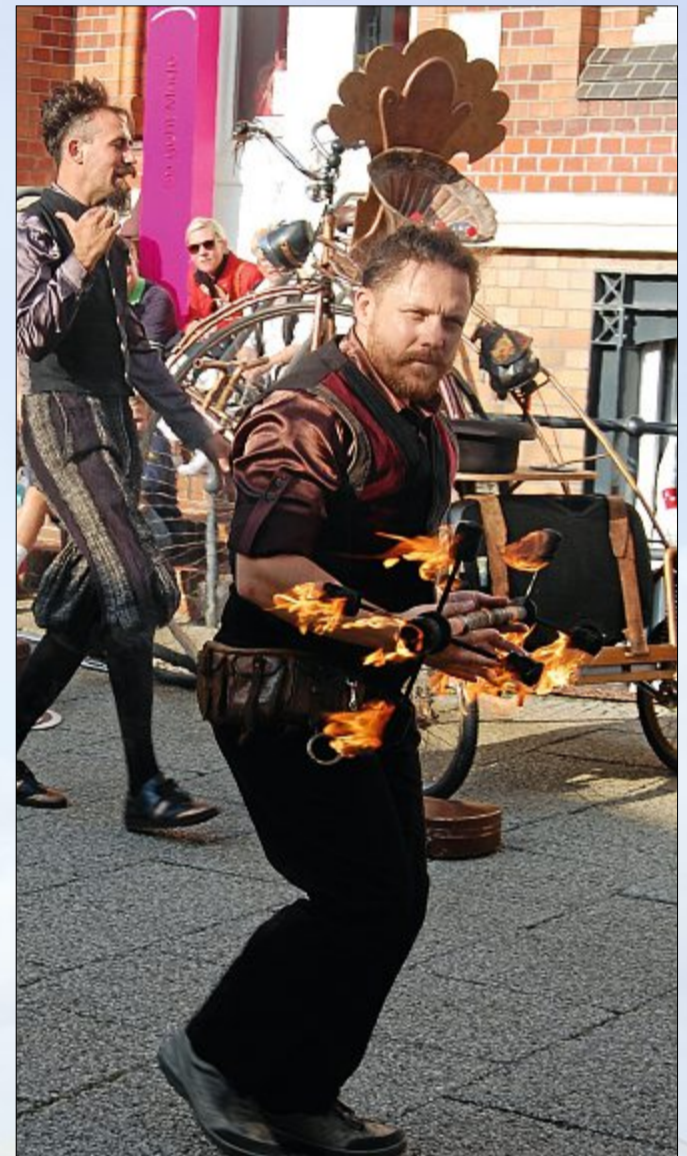
Haben Sie mal Feuer?