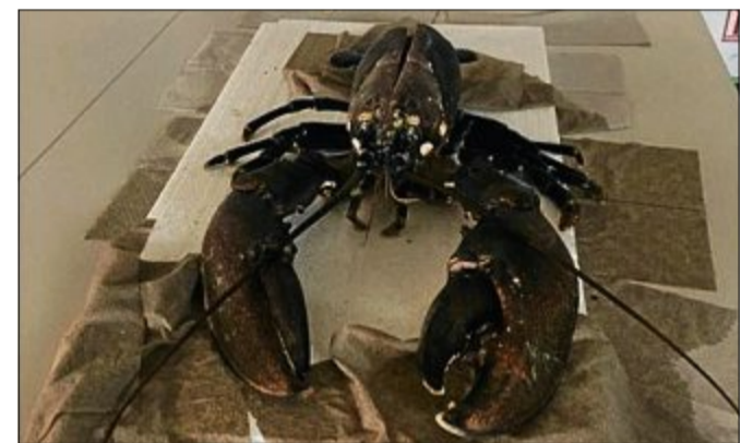
Der „Haushummer“ des Watt Welten Besucherzentrums hat den Namen Waldemar.

Im ersten Lebensjahr häuten sich Hummer bis zu zehnmal. Wenn die Tiere erwachsen sind, passiert das nur noch alle zwei bis drei Jahre. Deswegen war das ein sehr besonderes Ereignis in den Watt Welten, denn Waldemar ist schon ein sehr großer Hummer. Bei der letzten Häutung von vor zwei Jahren musste eine Mitarbeiterin von den Watt Welten ihm helfen, aus seinem Panzer herauszuschlüpfen. Sie hat vorsichtig die Schale festgehalten, sodass