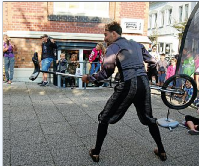
...mit ungewöhnlichen Einrad-Späßen.