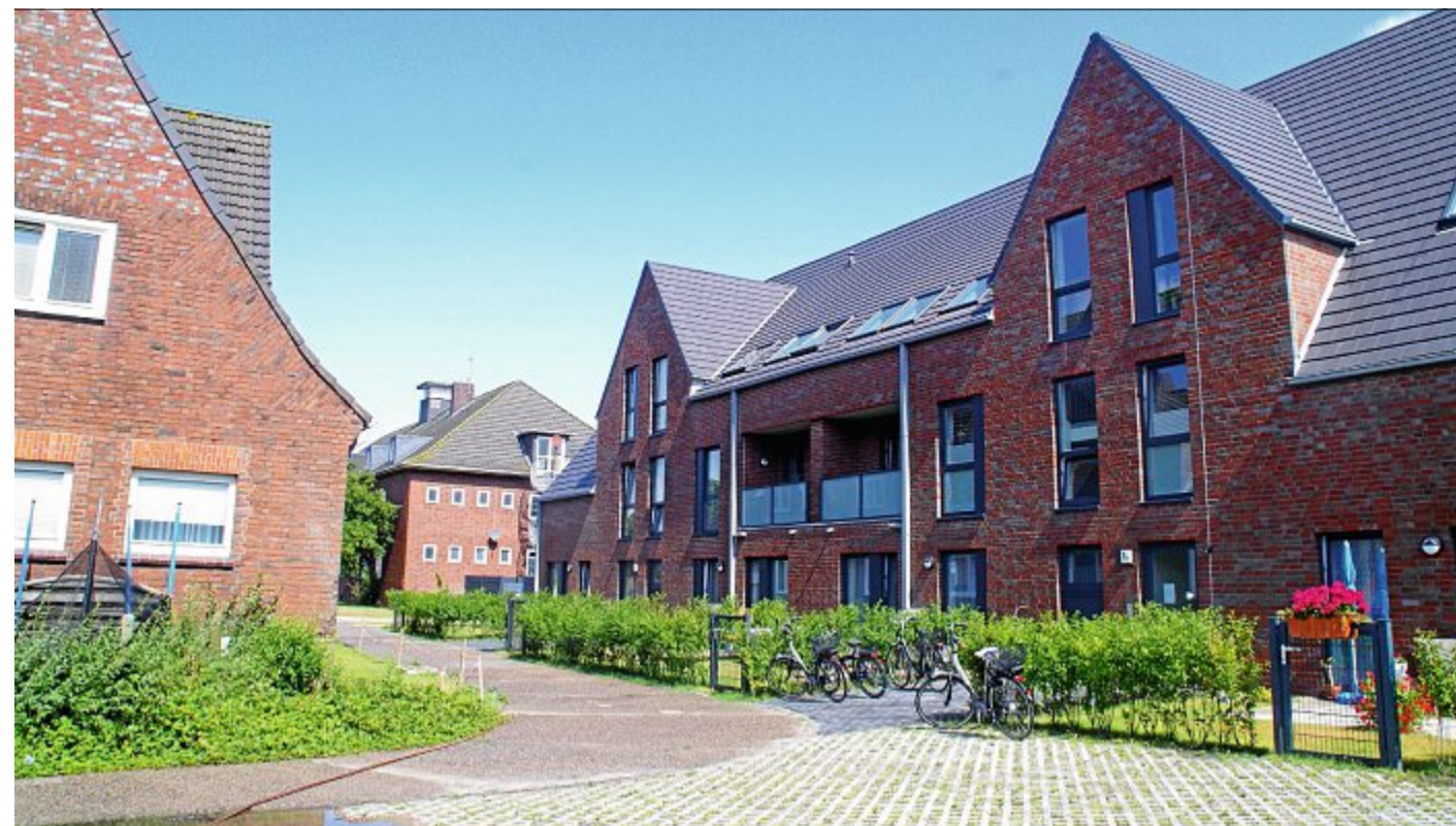
Ein Mix aus Alt und Neu: Rechts der Neubau der Wohnungsgesellschaft, der im vergangenen Jahr eingeweiht werden konnte, links eines der alten Häuser und in der Mitte das Haus der Begegnung.