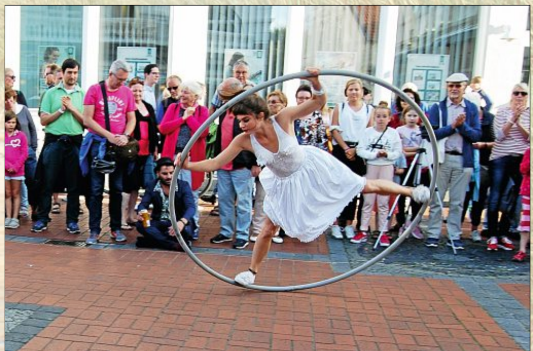
...bei einigen Kunststücken wurde darauf allerdings verzichtet.