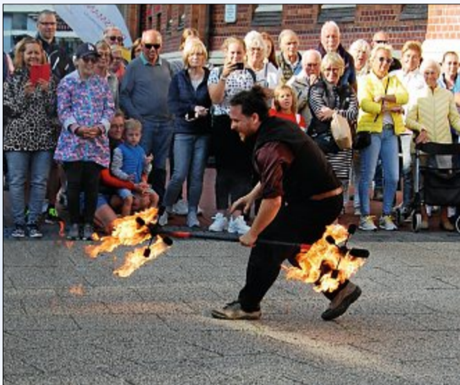
Faszinierendes Feuerspektakel wechselte...

*) Die Telefonnummer des Anrufers wird nicht angezeigt.