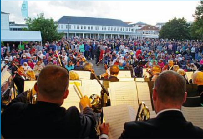
KONZERT Das Musikevent auf dem Kurplatz hat inzwischen Kultstatus erreicht

16. August 21. Norderneyer OLB-Classical-Night