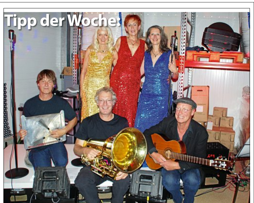
Konzert: Die Norderneyer SeaStars treten mit ihrem umfangreichen Repertoire am Sonnabend, 24. August, um 19.30 Uhr in der Norderneyer Brauhalle im Gewerbegebiet 18 auf. Der Eintritt ist frei, die Sitzplätze sind begrenzt.