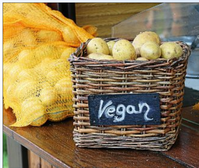
Es gab aber auch etwas für Gesundheitsbewusste.