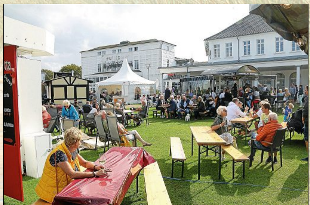
15 Winzer aus unterschiedlichen Weingebieten boten ihren Produkte an.