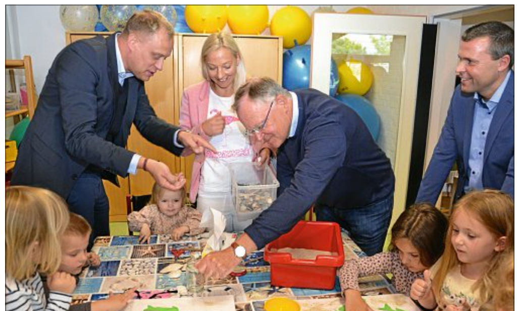
Zur Eröffnung der Krippengruppe im Kükennest bastelten die Politiker gemeinsam mit den Kindern Kleinigkeiten aus Muscheln und Sand.

Doch trotz des Rückhalts aus der Bevölkerung hat auch das Norderneyer Krankenhaus zu kämpfen. „Wie sieht es denn mit der Personallage aus?“, wollte Weil wissen. Die Planstellen seien gerade so gedeckt, berichtete der Geschäftsführer. Schwierig werde es, wenn Personal geht.