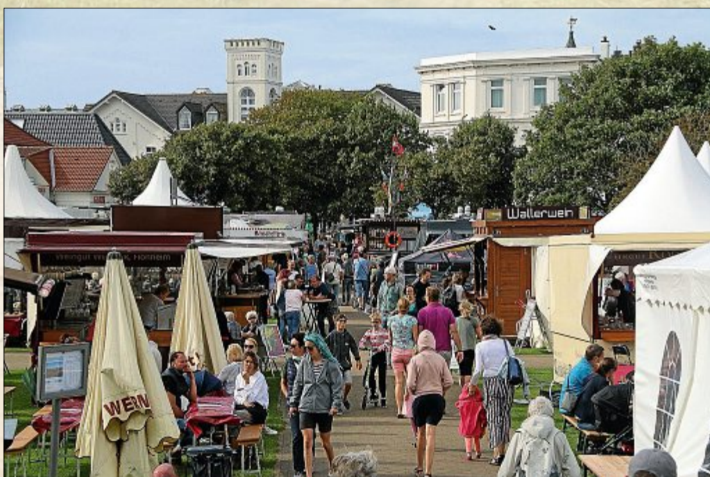
Richtig voll wurde es dann immer am späten Nachmittag und das blieb so bis gegen 23 Uhr.