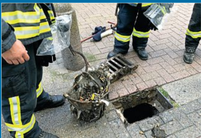
BRAND Offensichtlich waren Zigarettenkippen verantwortlich.

13. August Viel Rauch bei zwei Feuerwehr-Einsätzen