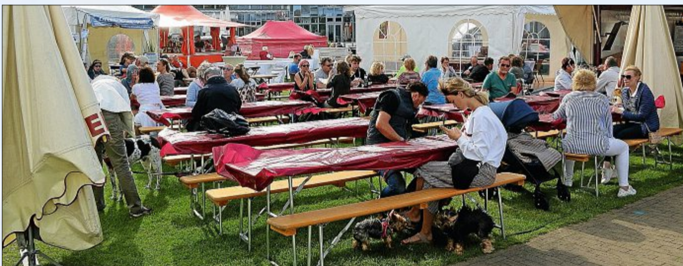
Zwischen den Pagodenzelten war ausreichend Platz, um in Ruhe ein Gläschen Wein zu genießen.