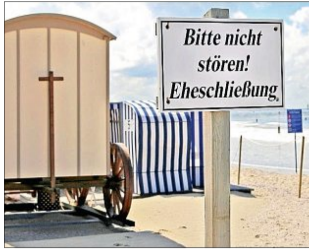
Heiraten im Badekarren. Für 2020 gibt es noch Restplätze.

Für die Zeremonie zieht er einen Fahrradanhänger mit den wichtigsten Utensilien durch den Sand: einen Tisch, etwas Dekoration und einen Sonnenschirm. Die Hochzeitsgäste können den festlichen Rahmen aber mit eigenen Ideen mitgestalten. Drei Monate seit der ersten Freiluft-Trauung am Strand von Juist haben bisher 32 Paare das neue Angebot genutzt – selten Insulaner, zumeist waren es Urlauber vom Festland. Und die Nachfrage steigt: 78 weitere Anmeldungen liegen