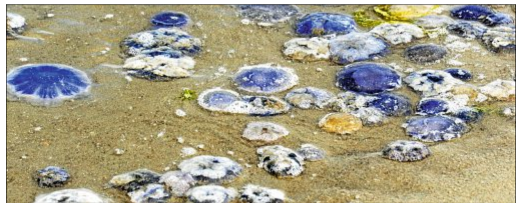
Die meisten Quallen, die man bei uns am Strand findet, sind blau und für Menschen ungefährlich. Nur ein paar sind gelblich oder rot. Von denen sollte man sich fernhalten. ARCHIVFOTO

mund-Qualle oder die Ohren-Qualle. Andere können auch uns ganz schön wehtun. Eine davon ist die