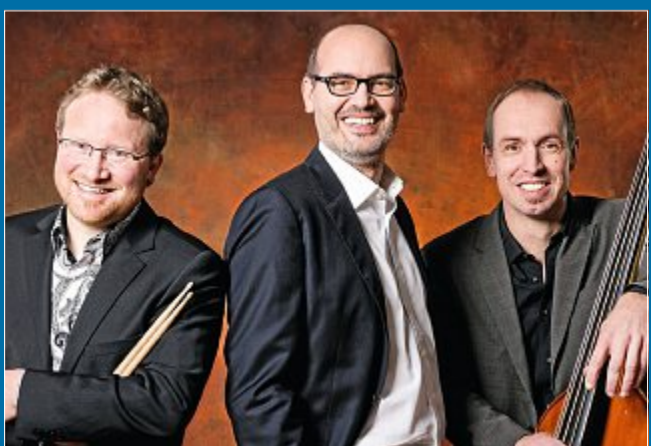
KONZERT Besonderer Auftritt im Conversationshaus.

14. August Blues & Boogie mit Symphonie-Orchester