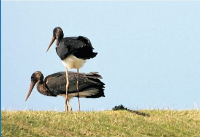
NATUR Die letzte belegte Sichtung des Gastvogels war 2006.

9. August Junge Schwarzstörche auf der Insel