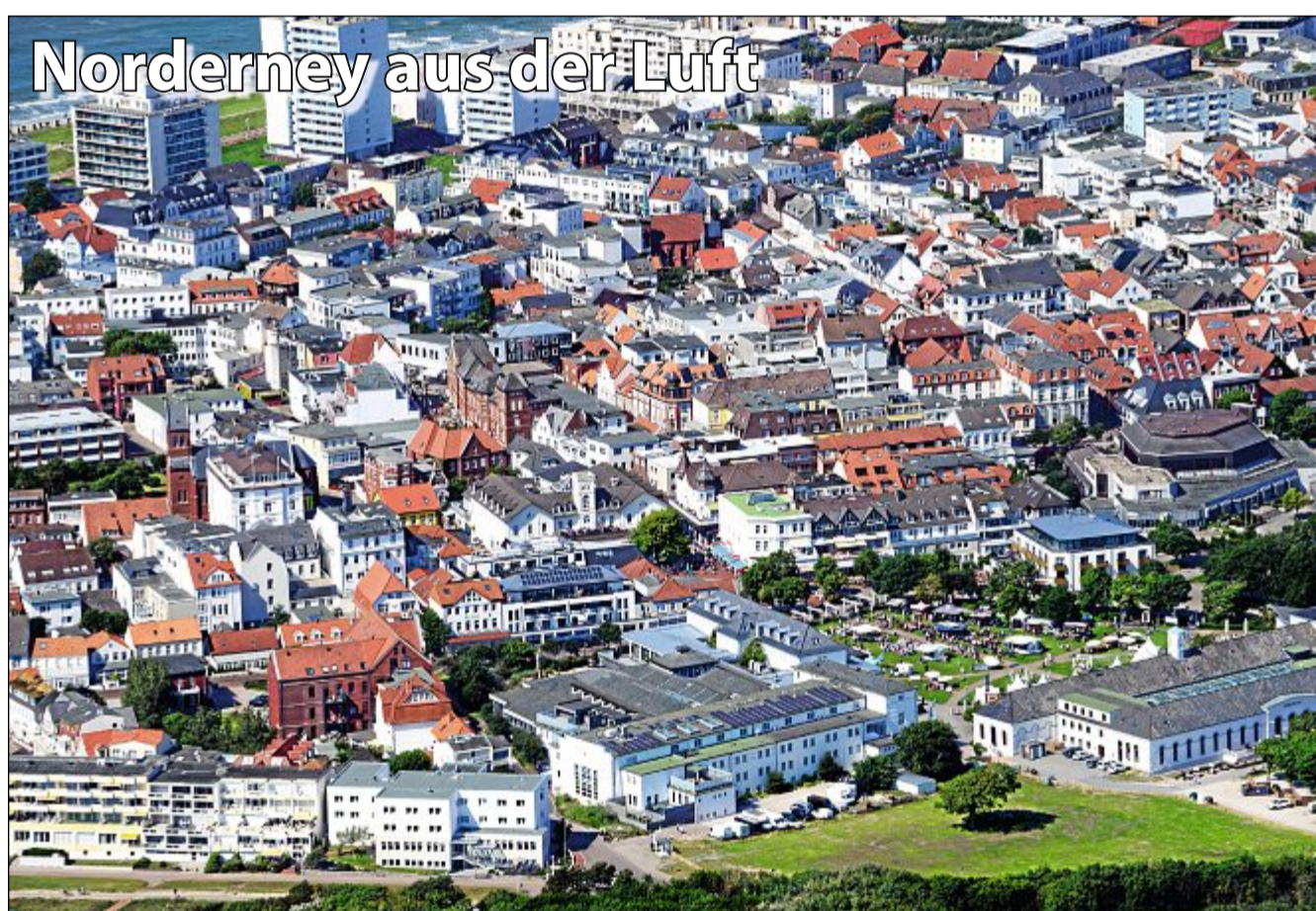
Die Bestellnummer lautet: Norderney Kurier 1033

Fragen beantworten. Auch das Maskottchen Kornrad Kornweihe trifft ihr in dem Besucherzentrum wieder. Kornrad Kornweihe hat übrigens schon die Frage für kommende Woche für euch parat, wie ihr in der Sprechblase seht.