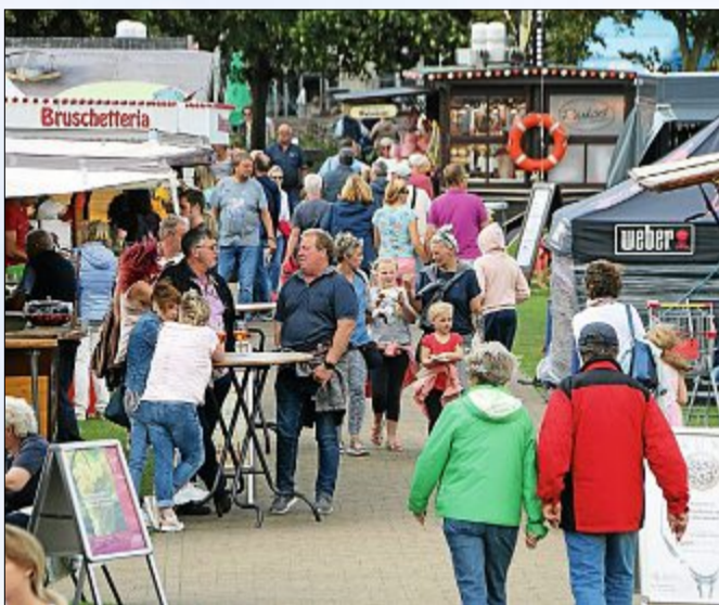
Auch kulinarisch ein Highlight, besonders für Grillfreunde.

*Die Telefonnummer des Anrufers wird nicht angezeigt.