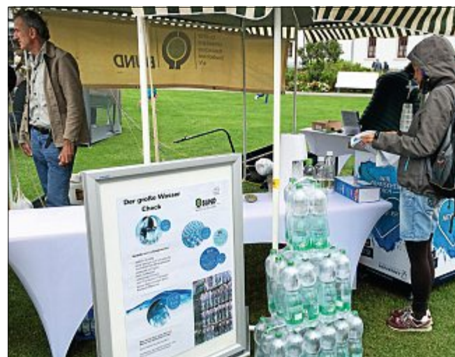
Der Stand vom BUND auf dem „Watt'n Markt“ machte sich stark für das Norderneyer Trinkwasser.

In den zahlreichen Gesprächen mit Gästen stellte sich heraus, dass viele wegen der leichten Gelbfärbung davor zurückschreckten, Norderneyer Wasser aus der Leitung zu trinken und stattdessen Wasser in Plastikflaschen kauften. Hier konnte Aufklärungsarbeit betrieben werden. Die Qualität des Trinkwassers auf Norderney sei dank versickernden Niederschlagswassers und der Süßwasserlinse von besonders hoher Qualität. Aufgrund der fehlenden Landwirtschaft gibt es keine Belastung durch Nitrate oder Rückstände aus Schädlings- und Pflanzenschutz-