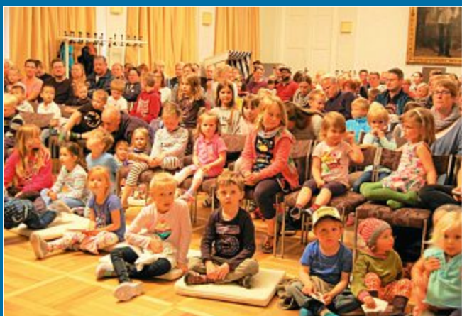
KUNST Das Puppentheater Rumpelkiste besucht regelmäßig die Insel