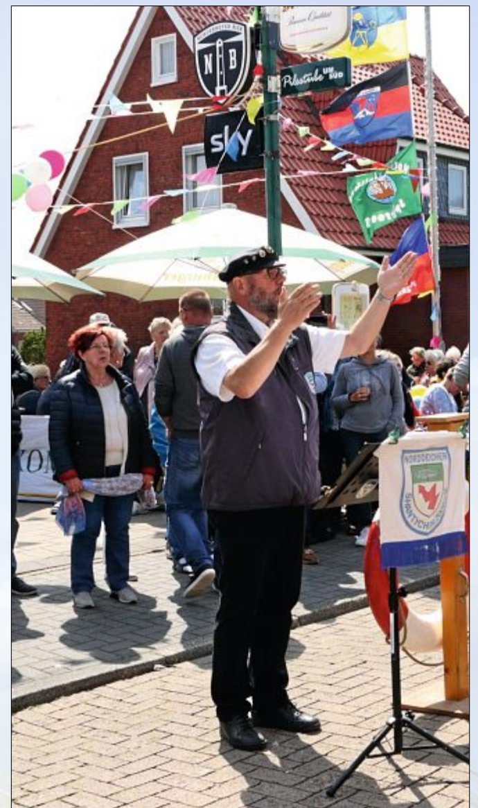
Alles unter Kontrolle: der Chef der Shanties 2000.