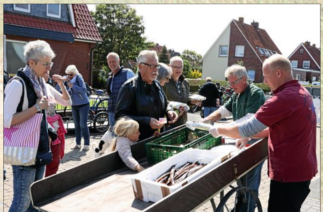
Der Räucherfisch fand wieder reißenden Absatz und der Fischstand war früh ausverkauft.