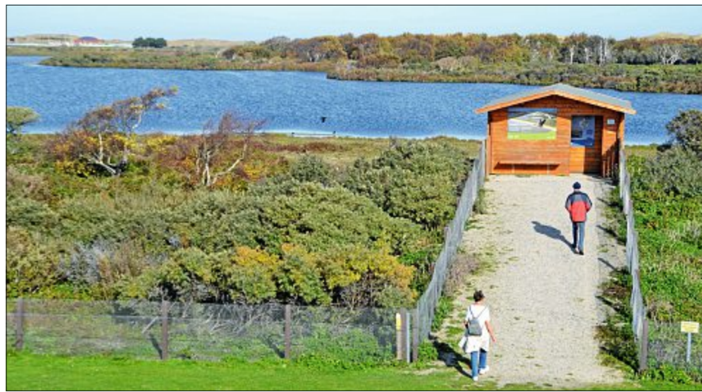
Die Beobachtungshütte am Südpolder dient eigentlich dazu, Vögel beobachten zu können, ohne sie zu stören. Ein Rauchschwalbenpärchen aber nutzt sie als Nistplatz.

Durch eine anschließende Untersuchung des Kots durch den Norderneyer Biologen Dr. Manfred Temme wurde festgestellt, dass zahlreiche kleinste Käfer und viele der harmlosen Büschelmücken an