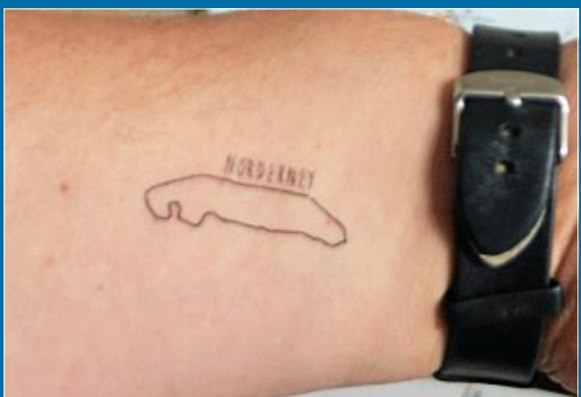
TOURISMUS Ostfriesische Inseln verlosen Tattoos.

18. Juli Inseln, die unter die Haut gehen