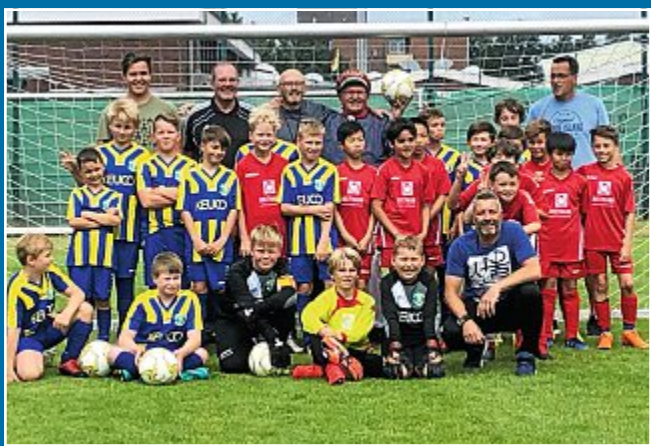
FUSSBALL Norderneyer Kids gewinnen 8:4.

17. Juli E-Jugend von Juist kommt zum Freundschaftsspiel