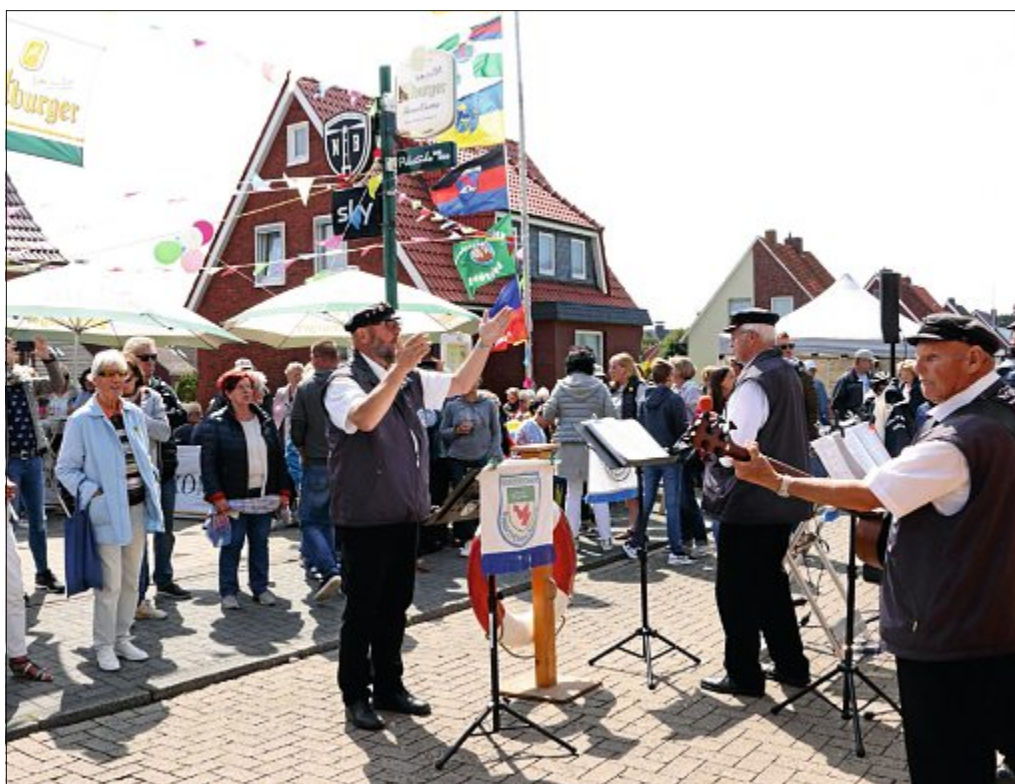
Der Norddeicher Shantychor 2000 lud die Besucherinnen und Besucher nachmittags zum Schunkeln ein und auf den Bürgersteigen wurde bereits mitgesungen.