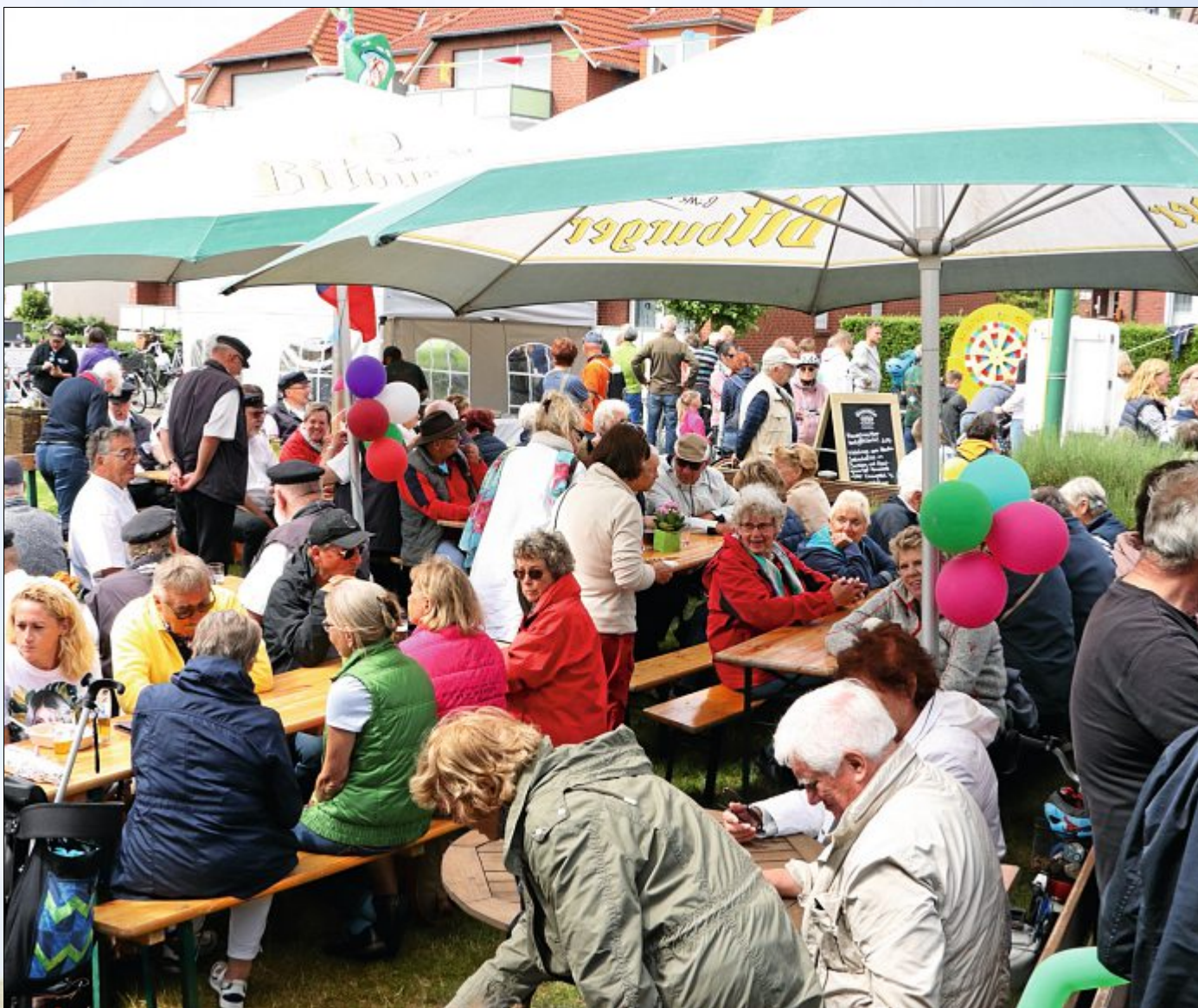
Voll bis auf den letzten Platz. Das Sommerfest „Um Süd“ hat sich zum beliebten Event auch für Gäste gemauert.

*) Die Telefonnummer des Anrufers wird nicht angezeigt.