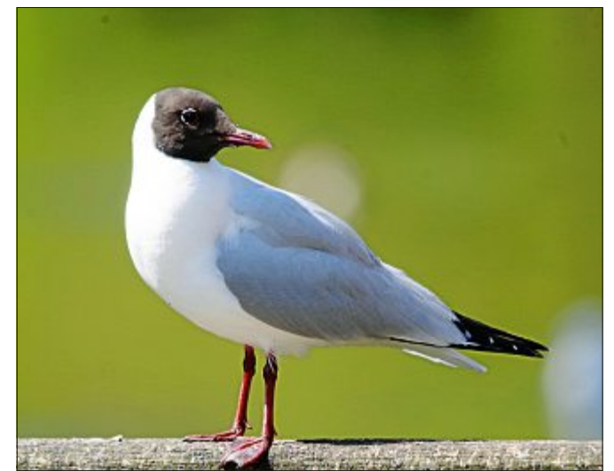
Eine Lachmöwe in der Brutzeit trägt ihr Prachtgefieder mit dem dunklen Kopf und den hellgrauen Flügeldecken.

aus denen nach zwei Wochen die kleinen Küken schlüpfen. Diese werden von beiden Elternteilen durchgefüttert. Schon nach einem Monat sind die kleinen Vögel flügge, das heißt flugfähig, und können selbstständig leben. Die Eltern tragen zu der Brutzeit ihr Prachtkleid, sind also richtig schick. Der Kopf ist dann dunkel schwarzbraun, die Augen sind schmal weiß gerandet und der Rücken und die Flügeldecken sind hellgrau, letztere sind an der Spitze schwarz. Wenn es Winter wird, legen sie das Kleid