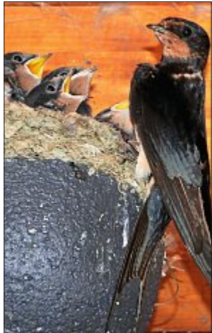
Rauchschwalbe bei der Fütterung der Jungen.

Die Vogelbeobachtungshütte am Südstrandpolder bietet nicht nur draußen beste Vogelbeobachtungen, sondern auch im Innen-