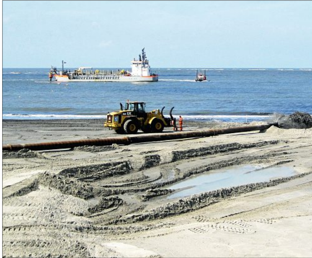
Die letzte Aufspülung auf Norderney fand im Jahr 2012 statt. Der Strand wird nur eingeschränkt begehbar sein.

Der Leiter der NLWKN-Betriebsstelle Nor-