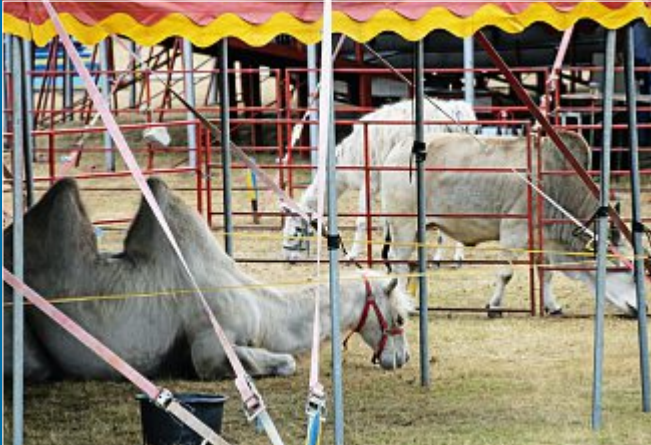
AKTION Norddeutschlands größter Zirkus „Olympia“ auf der Insel

12. Juli Manege frei – der Zirkus ist da.