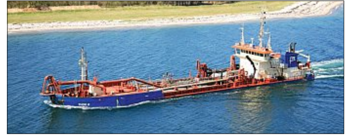
Noch liegt die „Thor R“ im dänischen Esbjerg.

„Thor R“ der dänischen Firma Rhode Nielsen A/S aus Kopenhagen mit dem Strandbereich. „An diese Leitung koppelt die voll beladene „Thor R“ im Zuge der Aufspülung an und pumpt ein Sand-Wasser-Gemisch auf den Strand, wo sich der Sand ablagert und mit Unterstützung von Planiertrauben gelenkt wird“, erklärt Prof. Thorenz den Aufspül-