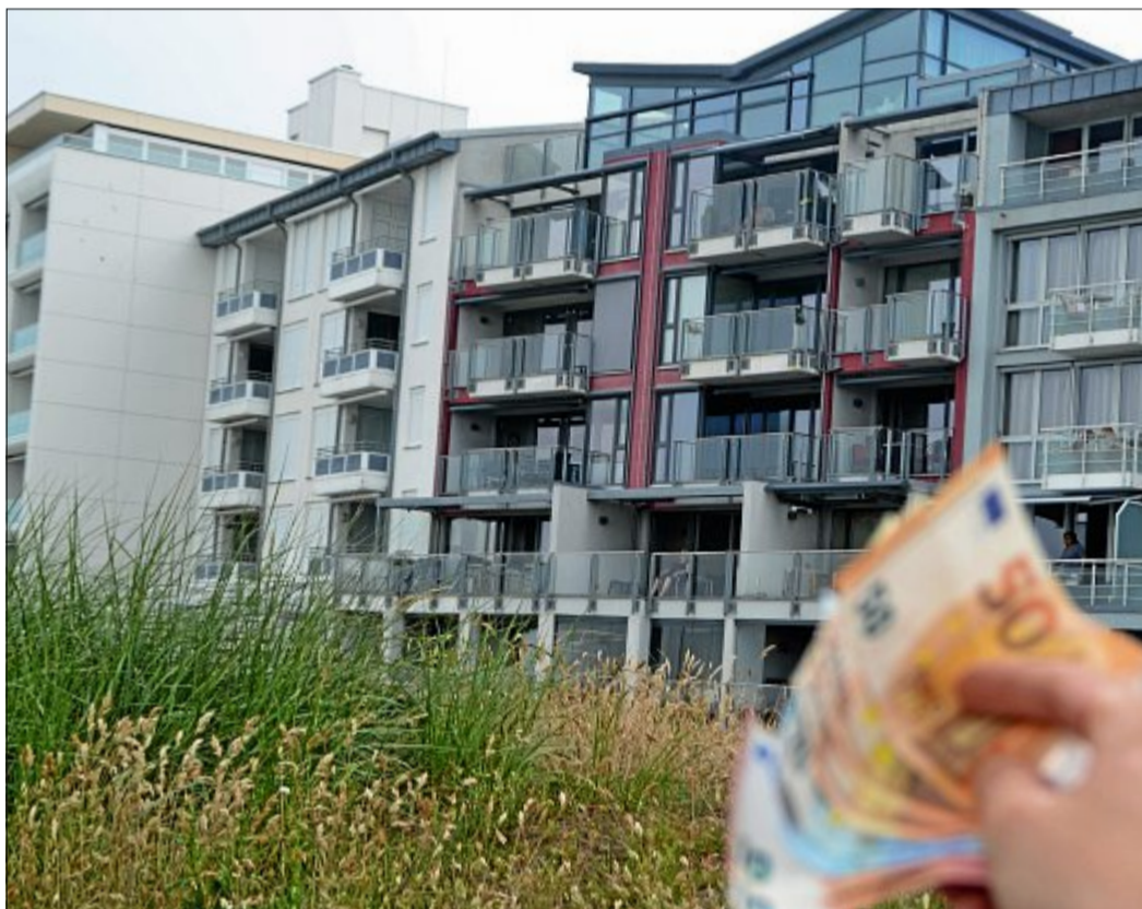
Wenn es um Immobilien in sehr guter Lage geht, hat Norderney die Insel Sylt vom ersten Platz verdrängt: Bis zu 18 000 Euro kostet der Quadratmeter auf Norderney.

8700 bis 15 000 Euro, während auf Norderney Preise von 10 500 bis 14 000 Euro aufgerufen werden. In der