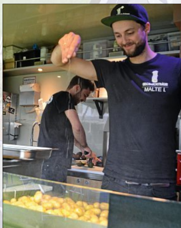
Der letzte Feinschliff kurz vor Beginn. Das Festival läuft noch bis Sonntag.