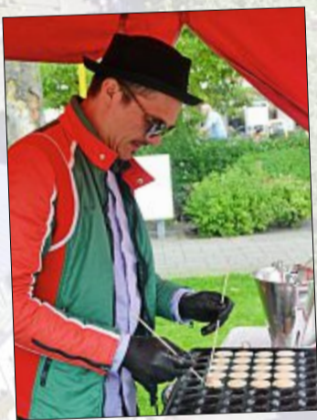
Die Poffertjes sind fertig.