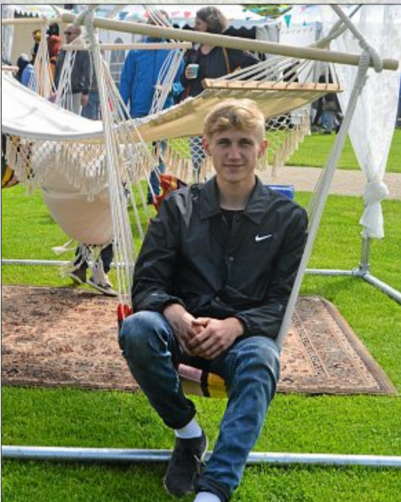
Einfach mal abhängen: Auch das ist auf dem Festival problemlos möglich, denn zahlreiche Hängematten bieten genug Platz.