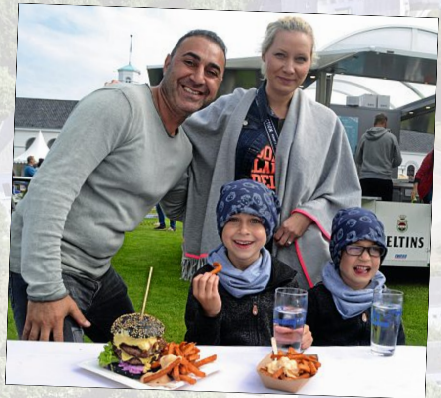
Das Food&Feel-Festival auf dem Norderneyer Kurplatz schmeckt sprichwörtlich der gesamten Familie.