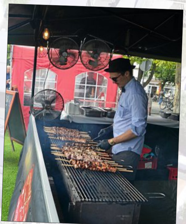
Fleisch gibt es in vielen Variationen – scharf, eher leicht, gegrillt, gebacken, geräuchert und noch auf vielerlei anderer Art.