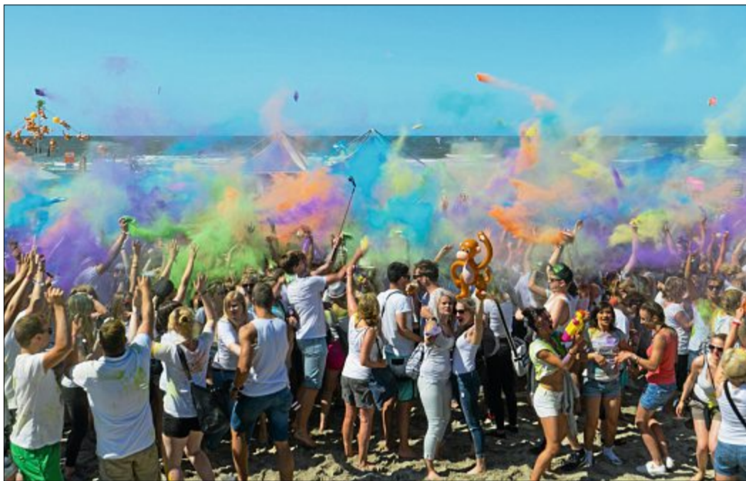
Ein buntes Spektakel: Morgen ab 14 Uhr startet zum mittlerweile fünften Mal das Holi-Beach-Festival auf Norderney. Es warten Hunderte Besucher erwartet.

Familien, Freunde, Pärchen und sogar Junggesellinnenabschiede: Die Holi-BeachTour lockt, ganz im Sinne seines Ursprungs, ganz unterschiedliche Besucher an. Dabei ist dem Alter keine Grenze gesetzt – hier feiern Jung und Alt gemeinsam, versprechen die Veranstalter. Auf Norderney tanzen die Besucher zu den angesagten Beach-Mixes direkt mit den Füßen im weißen Sandstrand. Die diesjäh-