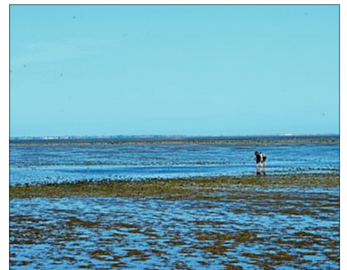
Ein Spaziergang durch das Wattenmeer fasziniert Jung und Alt. Birgt aber auch erhebliche Gefahren.

Für wissbegierige Kinder: Mit Kornrad Kornweihe durch den Nationalpark – Heute: Wattenmeer