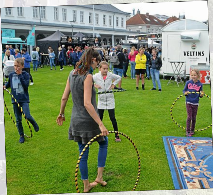
Auch sportlich geht es auf dem Festival zu. Hula-Hoop-Reifen und Co. sind vertreten und da können Klein und Groß ihr Können unter Beweis stellen.