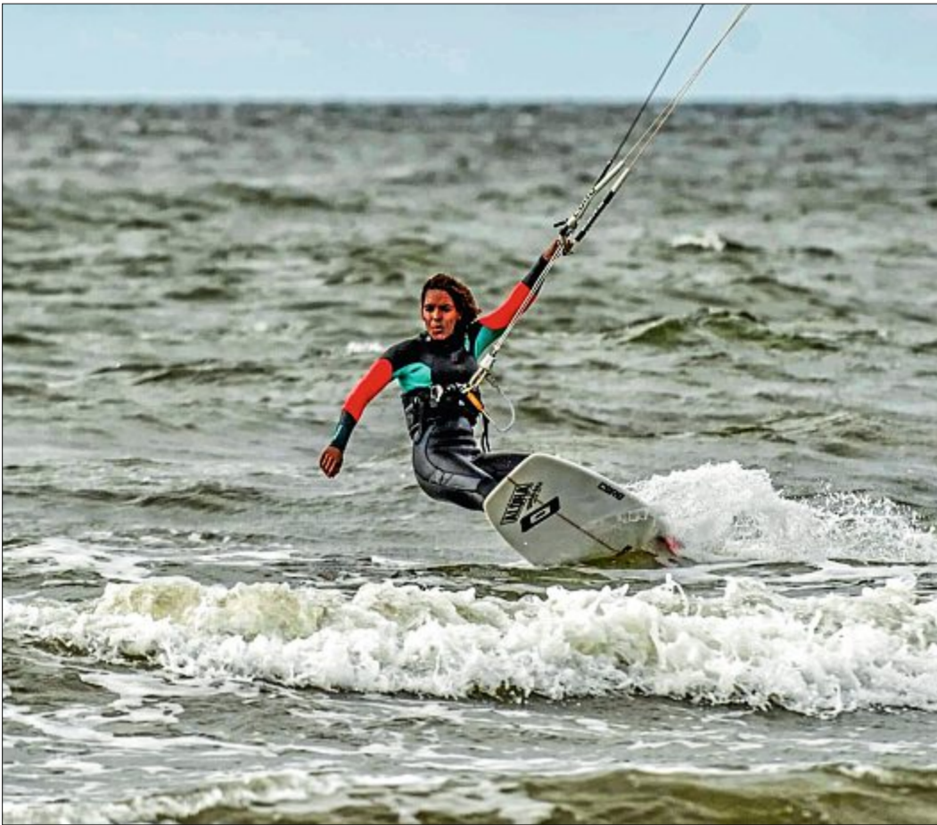
Die Nordsee bietet für die 25-Jährige tolle Bedingungen, um ihrem Hobby nachzugehen.