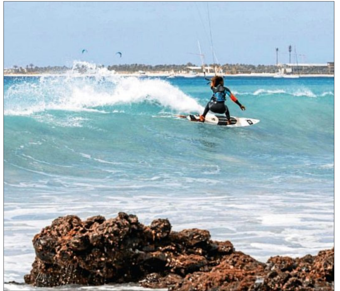
Die Surf-Begeisterung nahm ihren Anfang auf den Kapverden.