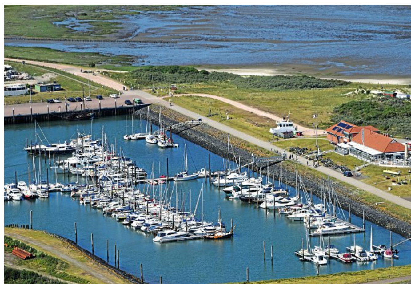
Die Bestellnummer lautet: Norderney Kurier 1025