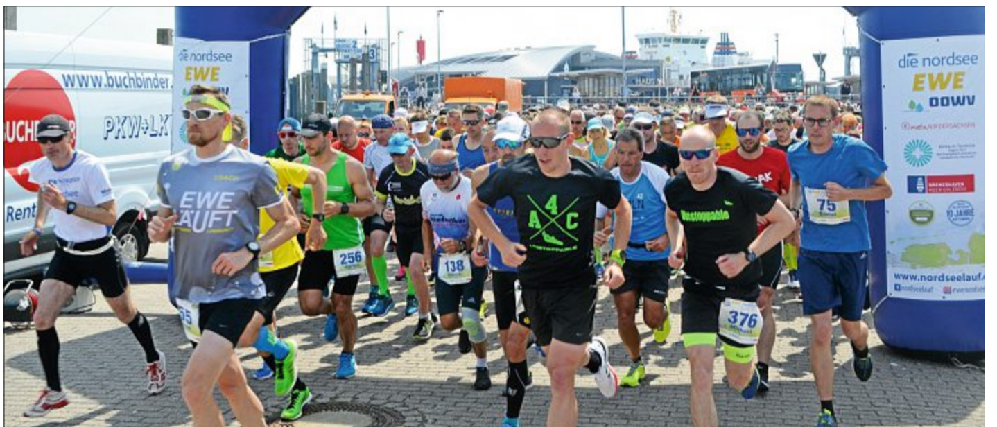
Der Startschuss ist gefallen und die Läufer begeben sich auf die elf Kilometer lange Etappe über die Nordseeinsel.

Name: Picky Rasse: Mischling Geburt: 2. Februar 2016 Geschlecht: männlich, kastriert