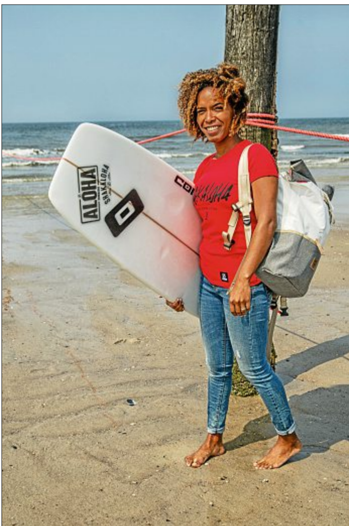
Sie schätzt an Norderney besonders die Weitläufigkeit und Ruhe. Aber auch der Wind gefällt der Surferin.

Juni treten die besten Kitesurfer der Welt gegeneinander an und zeigen, was sie können. An diesem Event nimmt auch Kohler teil – als eine der ersten Frauen von den Kapverden. Ob sie sich große Chancen auf eine gute Platzierung ausrechnet, weiß sie selbst nicht. „Für mich stehen der Spaß und die tollen Erfahrungen im Vordergrund“, so Kohler. Da sie aufgrund der fehlenden Aufenthaltserlaubnisse und Visa auch nicht