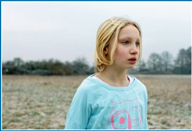
KINO Besonderes Zusammenspiel führt zum großen Erfolg

19. Juni Systemsprenger erhält DGB-Preis