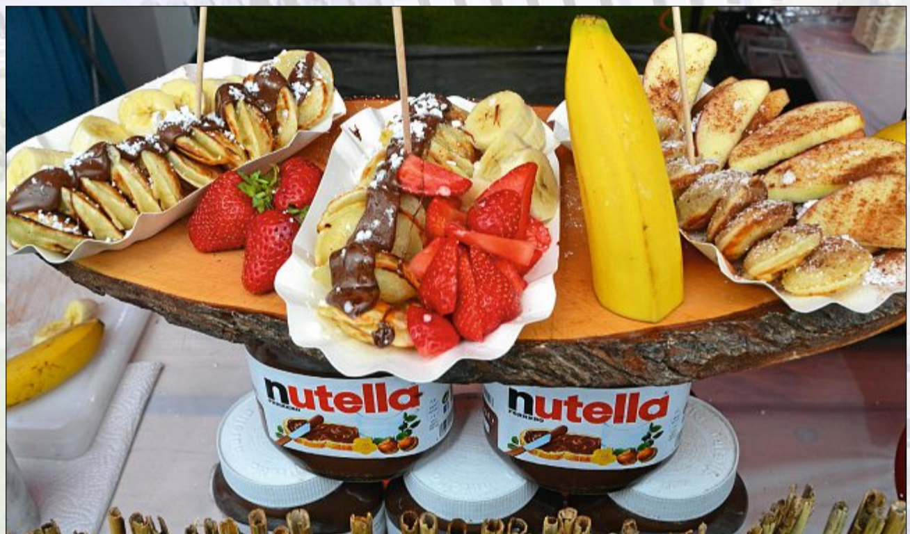
Köstliche Naschereien gibt es natürlich noch bis Sonntag zu verkosten.