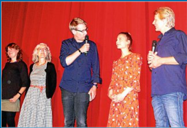
FESTIVAL Ganz neues Drehbuch durch „Schreibtisch am Meer“

17. Juni Man gönnt den Geschwistern ihre Liebe