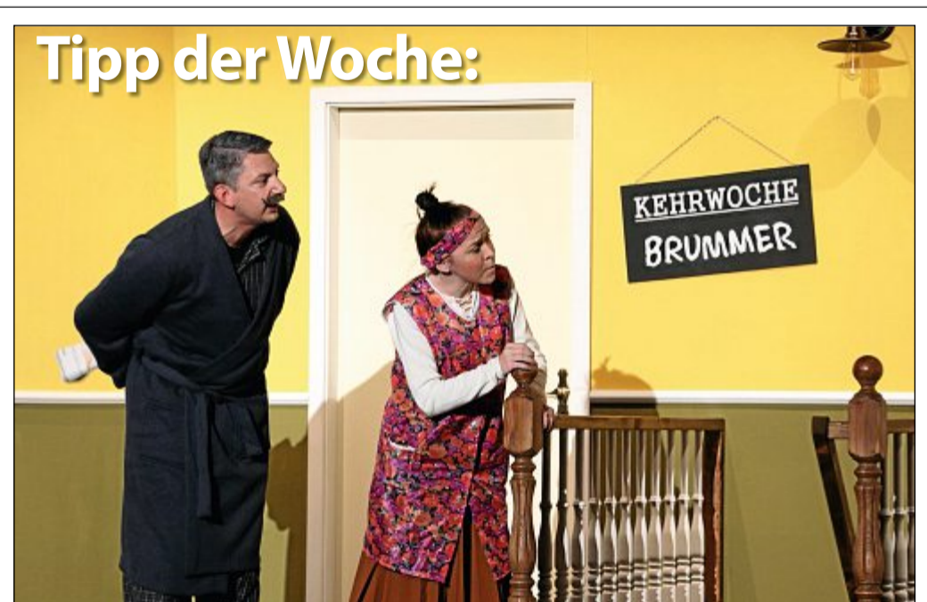
Theater: Das Laientheater Norderney spielt am Freitag, 28. Juni um 19.30 Uhr im Kurtheater das Stück "Tratsch im Treppenhaus". Der Eintritt kostet im Vorverkauf an der Touristinformation zehn Euro und an der Abendkasse elf Euro. ARCHIVFOTO

*Die Telefonnummer des Anrufers wird nicht angezeigt.