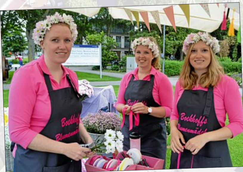
Kreativität ist gefragt: Auf dem „Food&Feel“ können Gäste ihren ganz eigenen, individuellen Blumenbaarschmuck binden.