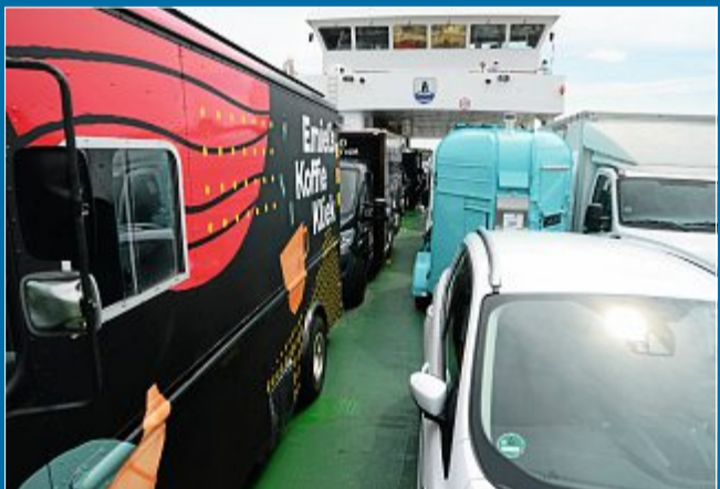
VERANSTALTUNG 16 Fahrzeuge auf der Fähre nach Norderney

20. Juni Food-Trucks machen sich auf den Weg