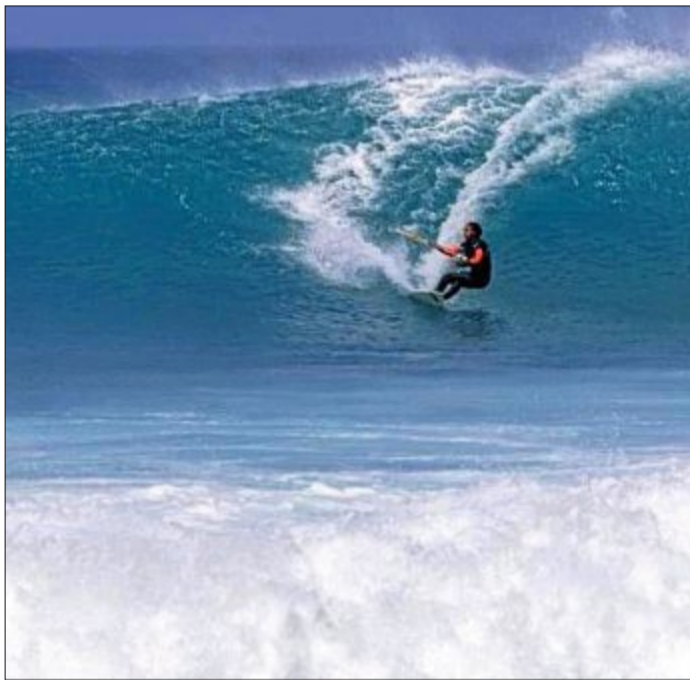
In ihrer Heimat surfte sie große und hohe Wellen – mit der Kraft des Windes und einer Menge Talent.