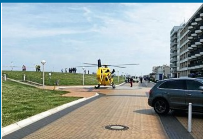
FEUERWEHR Hubschrauber brachte Frau ins Krankenhaus