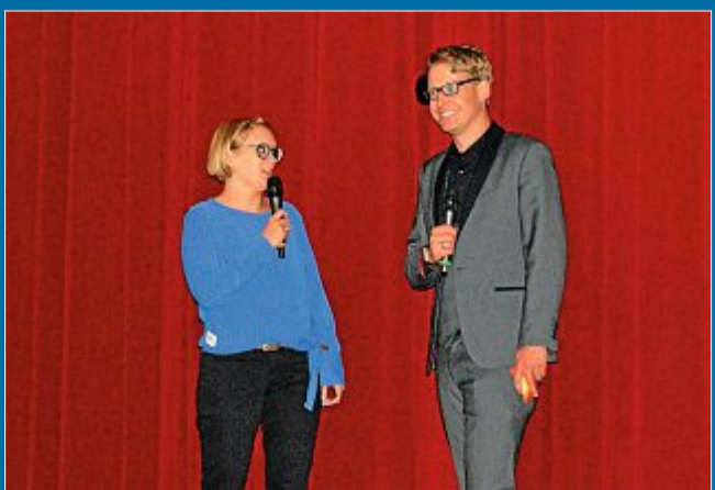
KULTUR Eröffnung im Kurztheater