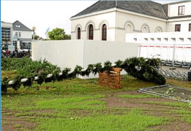
TRADITIONEN Zum ersten Mal in der Geschichte ohne Baum