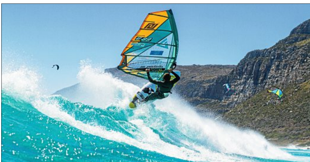
Radikale Manöver vor Kapstadt. Ohne Neopren ist Windsurfen immer noch am schönsten. Bei Wassertemperaturen von über 25 Grad ist der auch nicht nötig.