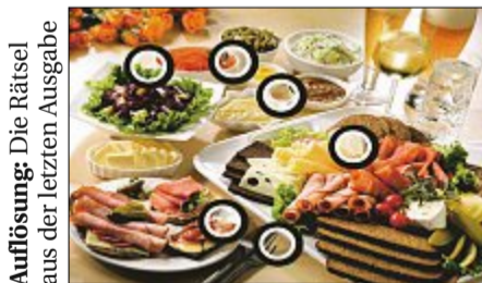
Auflösung: Die Rätsel aus der letzten Ausgabe