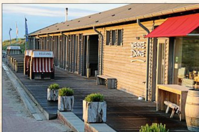
Die Stimmung nach dem letzten Gast.