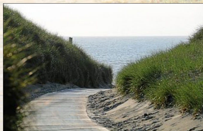
Auch die Wege zum Strand leeren sich in den Abendstunden.