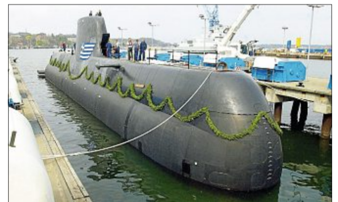
Ein U-Boot, wenn es mal nicht taucht. Im Inneren des Schiffes ist es extrem eng und Fenster gibt es auch nicht. ARCHIVFOTO

sechs U-Boote der deutschen Marine. Bei Probe-Manövern sind die Matrosen in so ziemlich allen Ozeanen unterwegs. Außerdem auch in der Nordsee. Wenn die mal wieder wild und aufgebraust ist, hat die Besatzung eines Tauchbootes Glück: Denn je tiefer man damit taucht, desto weniger Wellengang gibt es. Und was kann man aus einem Bullauge guckend auf dem Grund der Nordsee so alles entdecken? Da wären zum Beispiel ganz viele Würmer, Schnecken, Muscheln und Algen. Und spannend aussehende