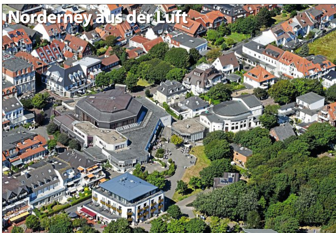
Die Bestellnummer lautet: Norderney Kurier 1024

gen beantworten. Auch das Maskottchen Kornrad Kornweibe trifft ihr in dem Besucherzentrum wieder. Kornrad Kornweibe hat übrigens schon die Frage für kommende Woche für euch parat, wie ihr in der Sprechblase seht.