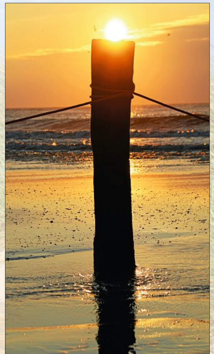
Schließlich bleiben nur noch Silhouetten.