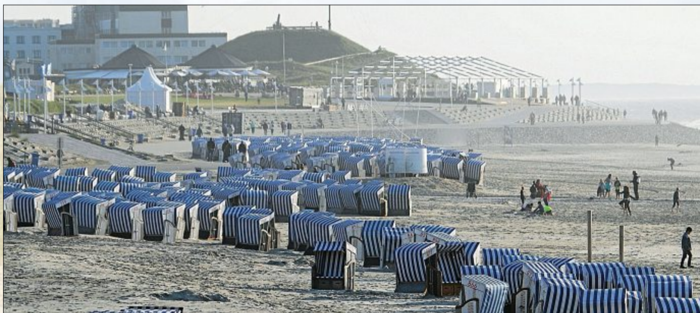
Ein paar Gäste tummeln sich noch in der Abendsonne, dann wird es rubig.