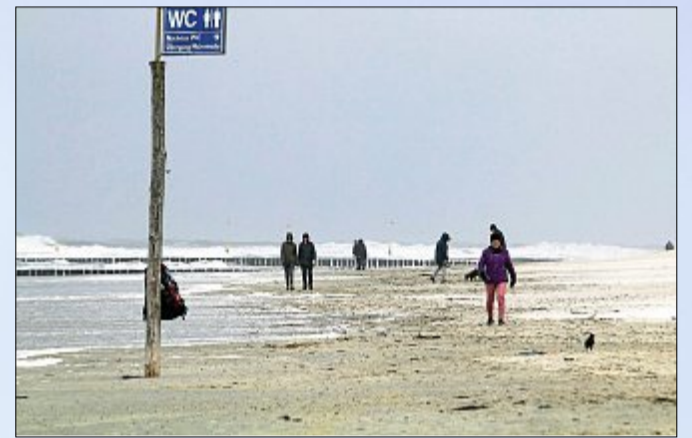
...oder am Flutsaum nach Aerosolen haschen.