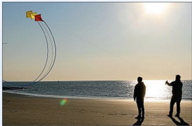
Und wenn dann der Wind kommt, kann man sportlich sein...