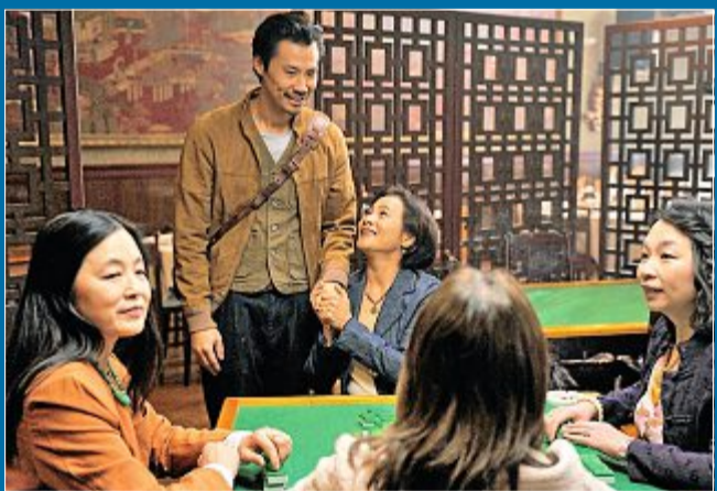
KINO Film „Made in China“ wird auf Felmfest gezeigt.