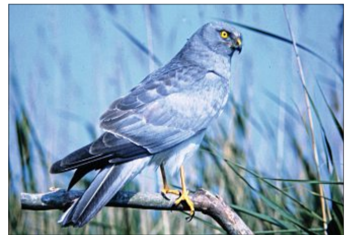
Auch die Federn der Kornweihe haben unterschiedliche Funktionen, die für den Vogel hilfreich sind.

liegenden Daunen, die die meisten Vogelarten haben. Das sind weiche, kleinere Federn, die uns warm hal- ten. So warm, dass die durchschnittliche Körper- temperatur von vielen Vö- geln bei 41 Grad Celsius liegt. Das ist viel wärmer als bei den Menschen. Die haben nur etwa 37 Grad Körpertemperatur. Puh, da kann ich ein Lied von sin- gen. Auch wenn ich kein Singvogel bin. Weil Dau- nen so schön warm halten, benutzen Menschen sie auch. In Kopfkissen zum Beispiel. Aber nicht nur Daunen sind nützlich, ge-