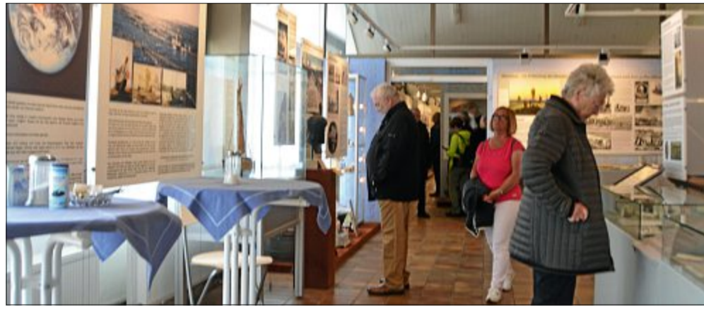
Es gab viel zu entdecken für die Besucher. Die meisten jedoch kamen wegen der Sonderausstellung ins Museum und einige bestimmt auch wegen des leckeren Kuchens.

Eines allerdings lag im Fokus der meisten Besucher: Die neue Sonderausstellung „Das Seebad Norderney ist