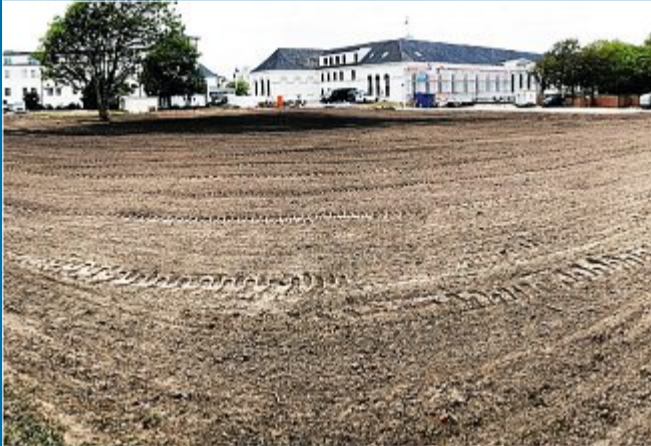
STADT Diskussionen um Hotelstandort geben weiter.