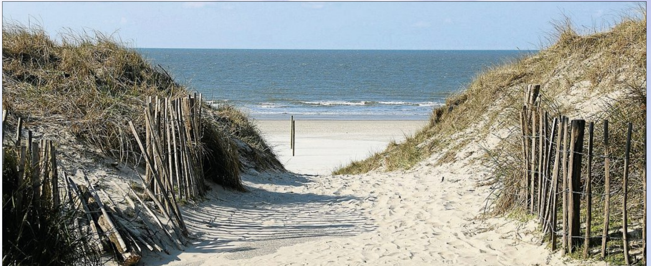
Als würde der Weg ins Unendliche führen: ein Dünenübergang am Nordstrand. Auch wenn die Strände langsam voller werden, findet sich auf Norderney immer ein Plätzchen zum Alleinsein.