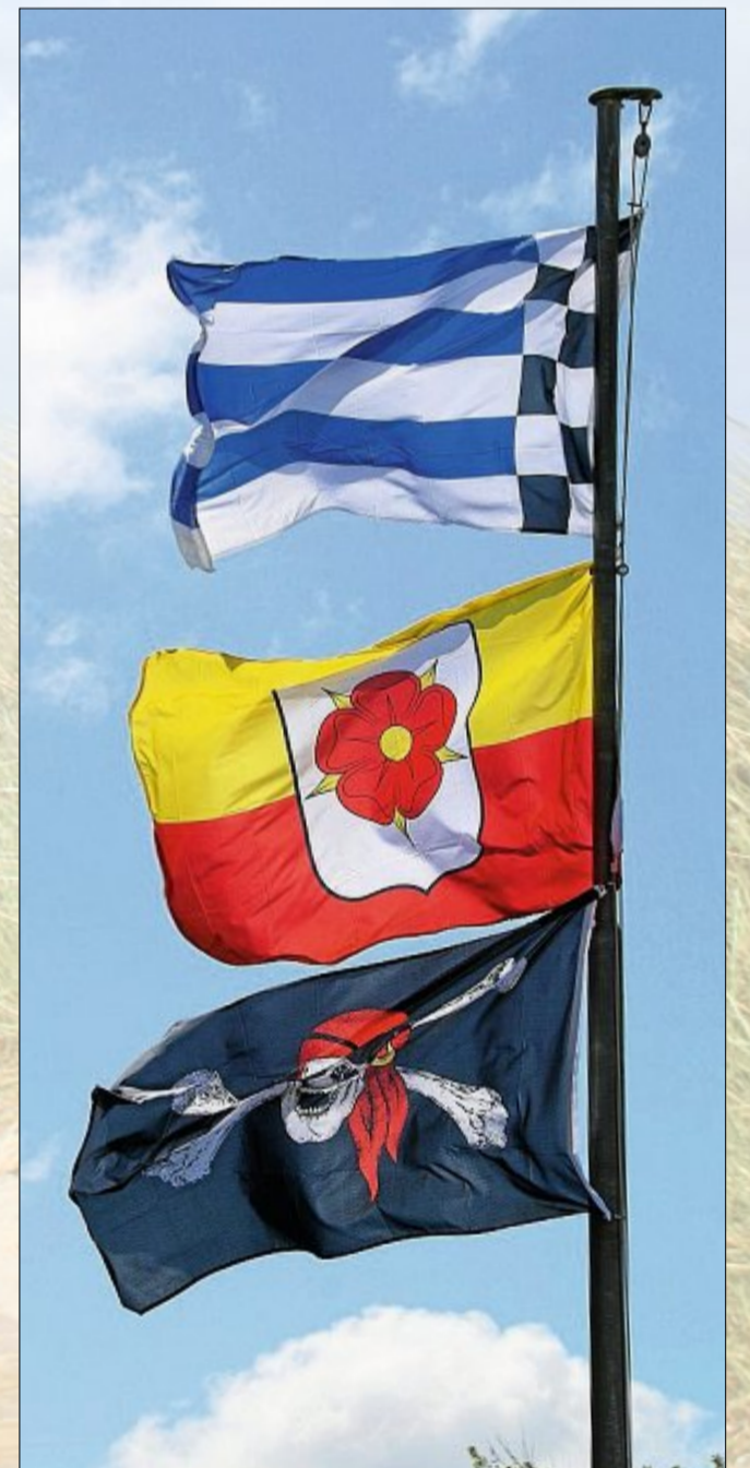
Miniquiz für Flaggenfans: Wo kommt die mittlere Fahne her?