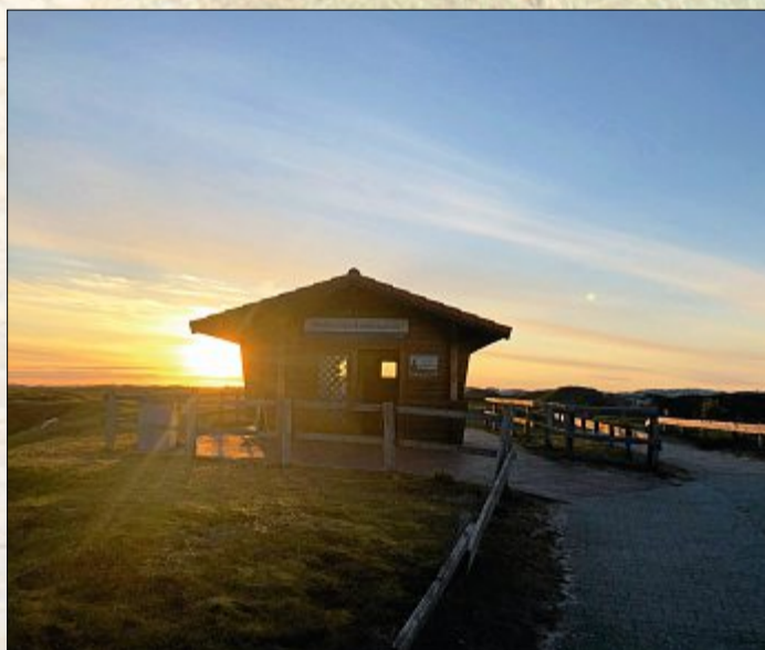
Die Inselmitte. Ab hier gibt es nur noch Sand und Dünen.