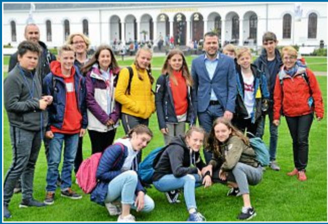
AUSTAUSCH Bürgermeister begrüßt Schulklasse im Rathaus.