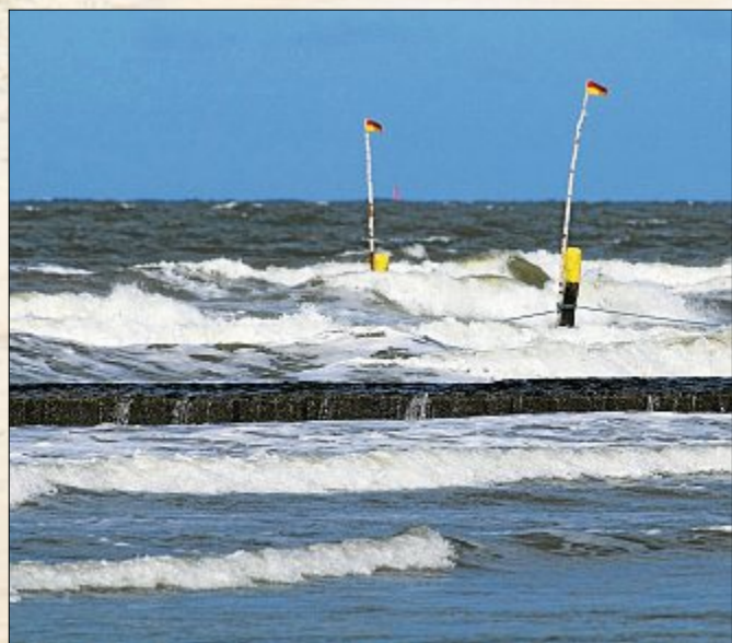
Einfache Gleichung: Je mehr Wind, desto mehr Wellen.