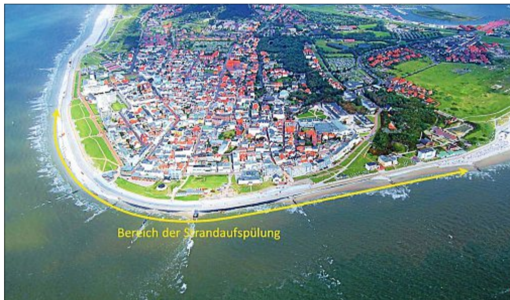
Der Sand für die Aufspülung am Westkopf stammt von der Robbenplate, die westlich der Insel liegt.

Strandaufspülungen als Maßnahme zum Schutz der Ostfriesischen Inseln gegen die Angriffe des Meeres haben sich nicht nur auf Norderney bewährt. Sie fügen sich in die dynamischen Prozesse ein und gleichen als Maßnahme des aktiven Küstenschutzes natürliche Sedimentdefizite aus. „Weil am Westkopf von Norderney auf natürliche Weise nicht genügend Sand ankommt, müssen die Strände regelmäßig durch künstliche Zufuhr von Sand aufgespült werden. International werden derartige Maßnahmen als Building with Nature bezeichnet“, ergänzt der Küstenschutzexperte. Die erste derartige Maßnahme zum Schutz Norderneys erfolgte bereits im Jahr 1951/52 als erste Strandaufspülung in Deutschland überhaupt. Die letzte von bisher zwölf durchgeführten Aufspülungen auf Norderney fand im Jahr 2012 statt.