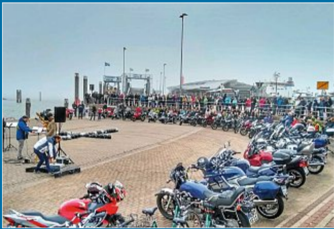
KIRCHE 46 Bikes rollen über das Norderneyer Hafengelände.

21. Mai Biker beim ökumenischen Gottesdienst