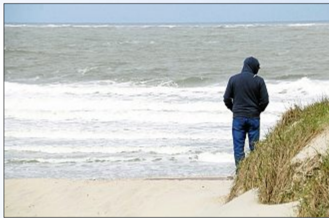
...sich in den Windschatten stellen...