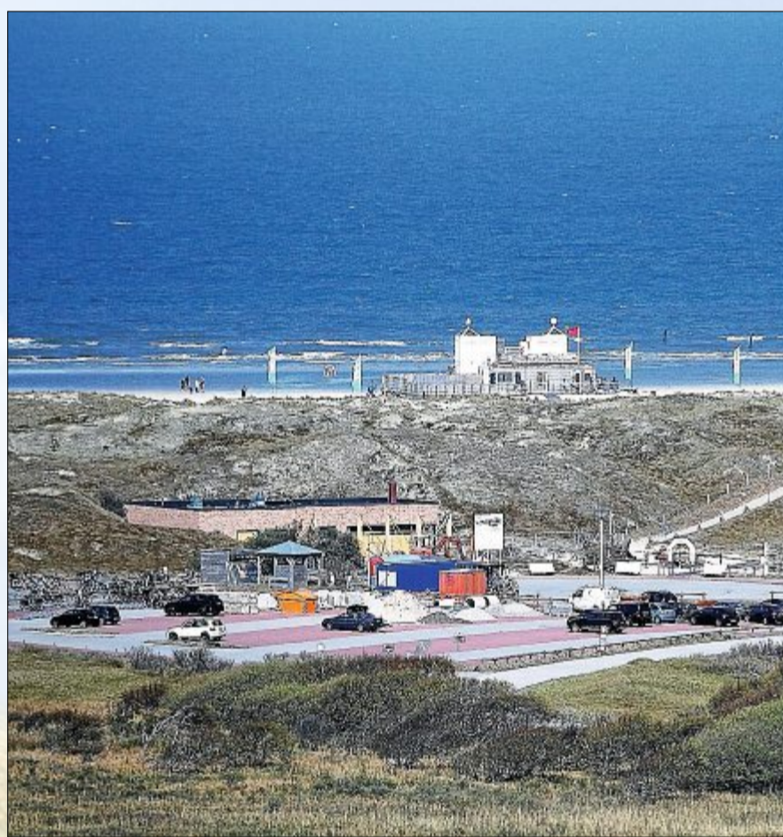
Ein gutes Tele-Objektiv macht es möglich: Blick auf die ehemalige „Oase“ und den davor befindlichen Parkplatz. Noch sind die Bauarbeiten nicht ganz abgeschlossen.