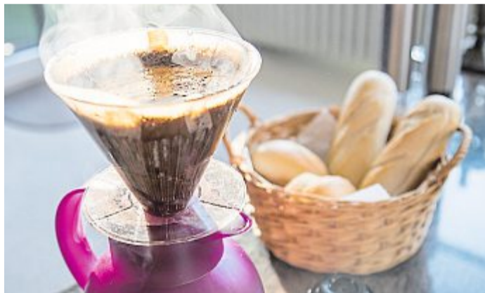
Kaffee, Brötchen, Marmelade: Ein kontinentales Frühstück ist selten üppig.

Durch acht US-Bundesstaaten führt sie – von Chicago in Illinois bis nach Santa Monica in Kalifornien, also vom mittleren Westen der USA bis zur Pazifikküste. Die Route 66