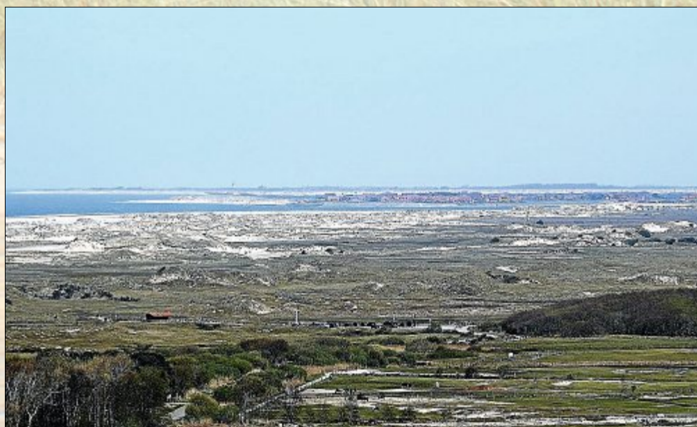
Richtung Osten erkennt man den Ostheller Parkplatz und im Hintergrund Baltrum.