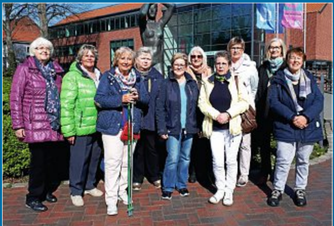
AUSFLUG Zur Ausstellung „Portraits“ in der Kunsthalle Emden