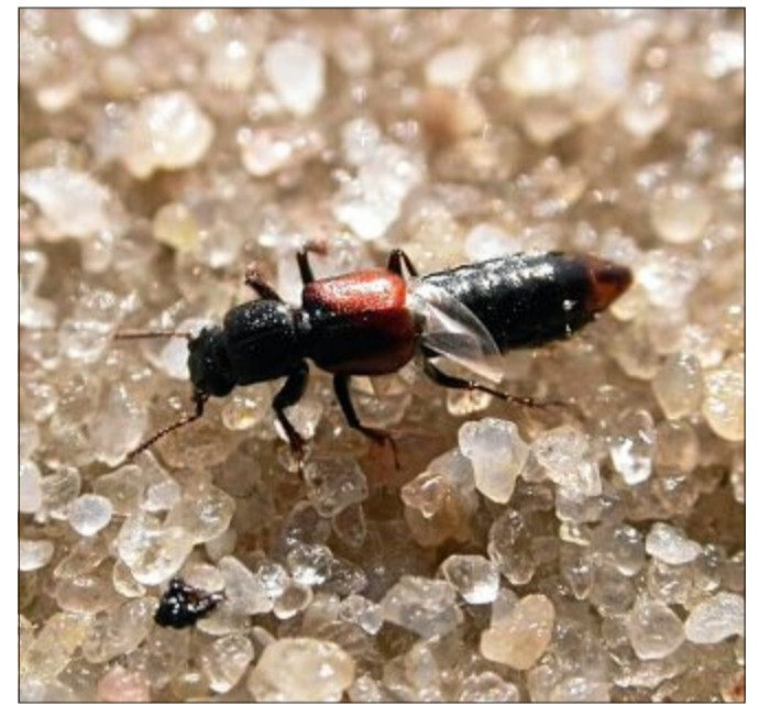
Der prächtige Salzkäfer gräbt sich Röhren unter der Erde, in denen er leben kann.

He liebe Kinder! bestimmt habt ihr schon oft vom Weltnaturerbe Wattenmeer mit seiner riesigen Artenvielfalt gehört. Dabei denkt man ja meist an die kleinen Tierchen, die im Watt leben, wie die Wattwürmer, Strandkrabben und Herzmuscheln, an die Fische in der tiefen Nordsee, an die vielen Zugvögel, die hier Rast machen oder an die große Vielfalt an Pflanzen in den Dünen. Aber wusstet ihr auch, dass es einige Insek-