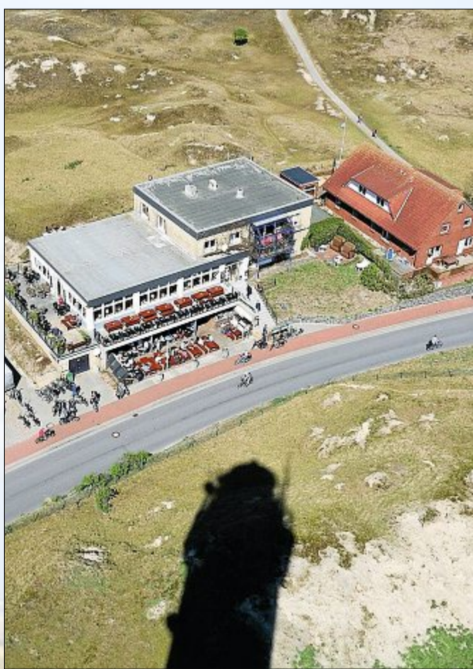
Im Schatten des Riesen genießen die ameisen großen Urlauber eine Erfrischung nach der Wanderung oder einer Radtour.