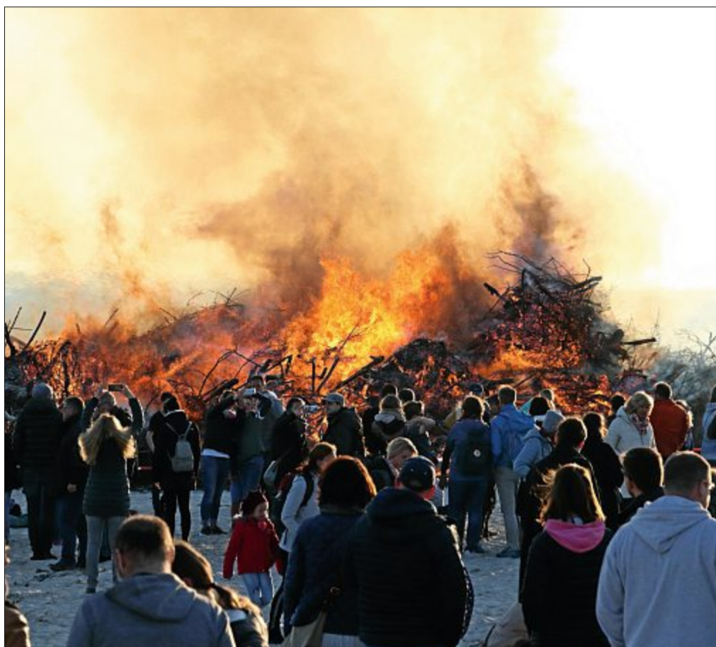
Den Winter brachte man in diesem Jahr mit dem Feuer nicht vertreiben. Mehrere hundert Menschen säumten den Strand auch am Samstag zum Osterfeuer.

termalung lieferte, zeigte sich sehr zufrieden, auch mit dem ebenfalls traditionellen Eiertrullern am Ostersonntag. Unzählige Kinder standen morgens ab 11 Uhr an, um ein Osterei zu bekommen und mit den anderen Kindern um die Wette zu Trullern. Ziel war es, von einer kleinen aufgeschütteten Düne das bunte Ei so weit wie möglich runter zu rollen, oder wie es auf Norderney heißt, zu trullern. Auch hier kamen Osterhase Dieke und Osterhäsin Lana vorbei, um sich vom ordnungsgemäßen Zustand der „Ostereiertrullerdüne“ zu überzeugen. Die Kinder hatten großen Spaß. Eifrig wurden verschiedenste Rampen in den Sand gedrückt, um dem eigenen Ei den besten Start zu ermöglichen. Für das leibliche Wohl war beim Osterfeuer und beim Eiertrullern bestens gesorgt. Getränke, Bratwurst und Pommes, gebrannte Mandeln und vieles mehr, was das Herz bei so einem herrlichen Strandwetter begehrt, gab es zur