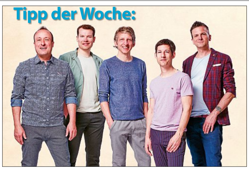
Konzert: Das Quintett "basta" präsentiert ihr neues Programm "In Farbe" am Donnerstag, 2. Mai um 20 Uhr im Kurtheater. Die Karten kosten zwischen 22 und 26 Euro im Vorverkauf an der Touristinformation und sind an der Abendkasse jeweils drei Euro teurer.

Wenn auch Sie Ihre Veranstaltung hier veröffentlicht haben möchten, setzen Sie sich mit uns in Verbindung.