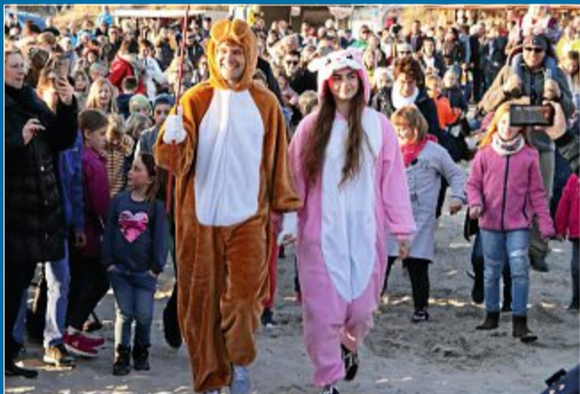
AKTIONEN Osterfeuer und Eiertrullern bei sommerlicher Atmosphäre lockte Tausende an den Strand

23. April 1000 Kinder – 1000 Eier: Ein Ostertraum