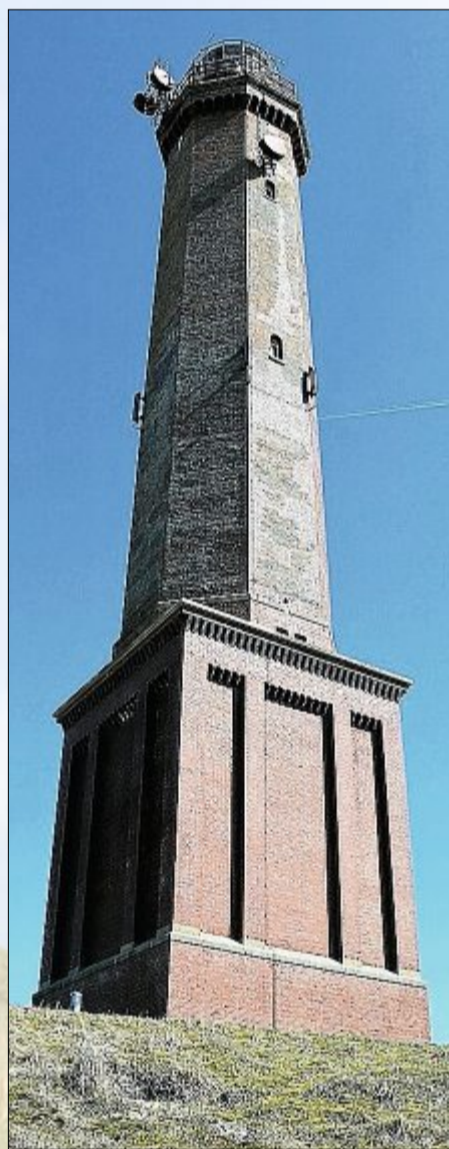
Erbaut in den Jahren 1872 – 1874 ist der Leuchtturm ein beliebtes Ausflugsziel.