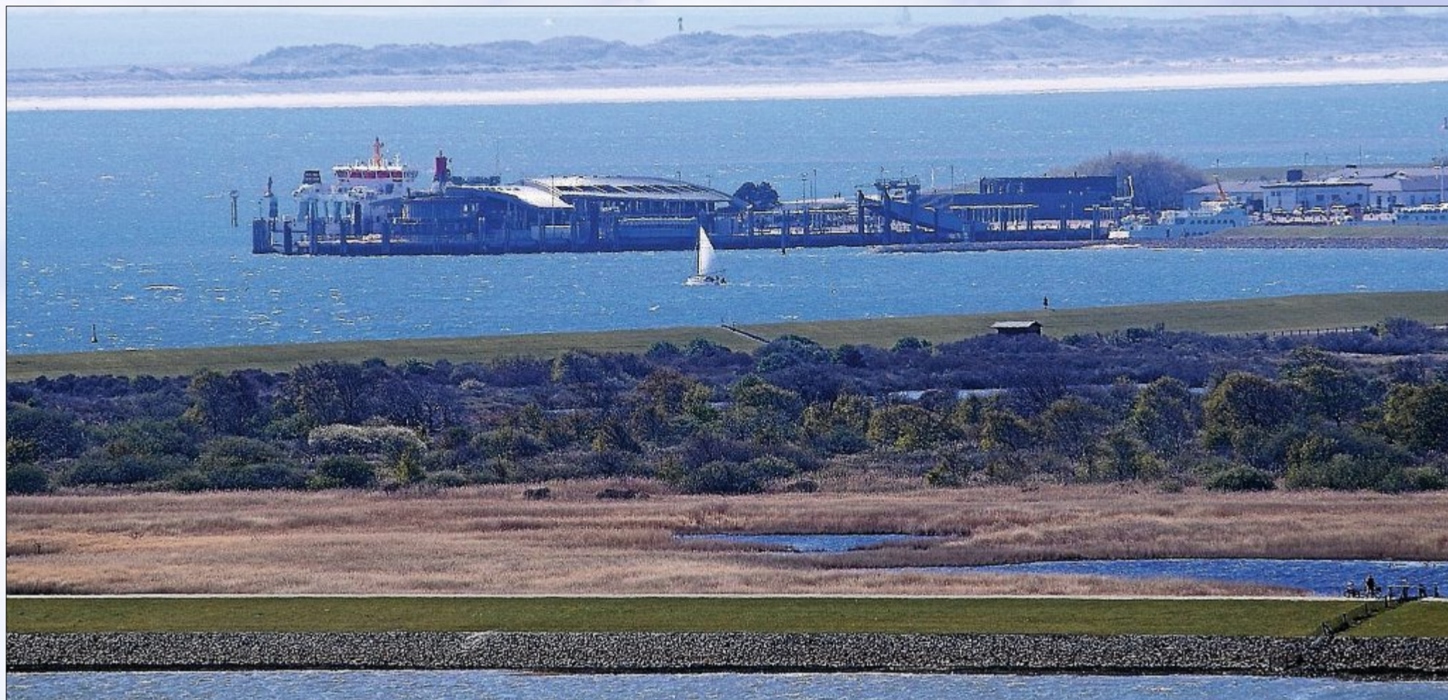
Hat man die 252 Stufen erklommen, gibt ein Blick in westlicher Richtung die Sicht frei auf den Fährterminal. Im Hintergrund strahlt der Strand von Juist.