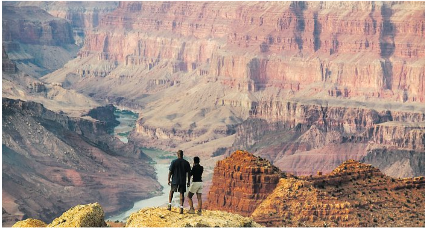
Aussichtspunkt am Grand Canyon: Wer die Schlucht mit allen Sinnen erleben will, wandert hindurch.

Karg ist es am Ufer des Colorado, dessen braunes Wasser mit hoher Geschwindigkeit durch die Schlucht fließt. Ab und zu tanzen Gummi-