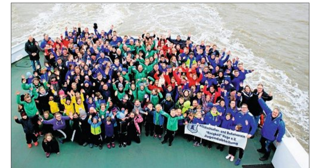
Ein Bild vom Finale 2018 lässt erahnen, was morgen auf den Norderneyer Straßen los sein wird. Ein Vorteil der bunten Jacken: Man findet die Spieler auch im Schnee. ARCHIVFOTO

Für Urlauber und Einheimische wird es auf dem Karl-Rieger-Weg zu Be-