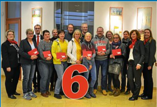
SPENDE Sparkasse honoriert die Arbeit der Ebnenamtlichen

29. Januar 6000 Euro für sechs Norderneyer Vereine