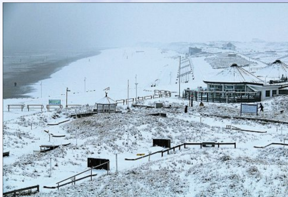
Verschnittenes Norderney: Der Januskopf hält Winterschlaf, um für den Sommer wieder fit zu sein.