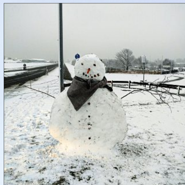
Kaum gibt es ein bisschen Schnee, da sprießen sie aus dem Boden: niedliche Schneemänner. Mal schauen, wie lange dieses Exemplar am Leben bleibt.