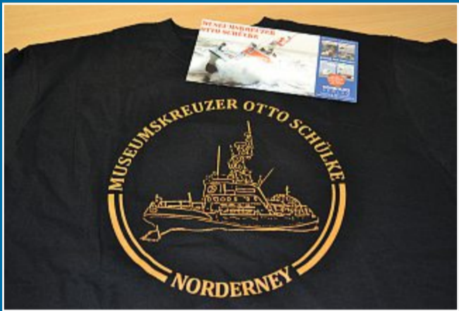
VEREIN Mitglieder tüten die Dankeschöns für die Spender ein