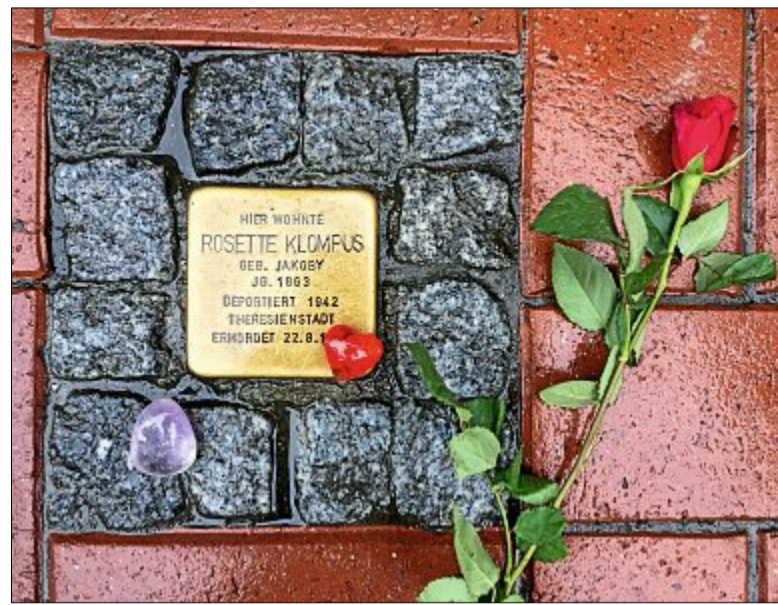
Im Gedenken an die jüdischen Mitbürger der Insel haben die Grünen Rosen an den Stolpersteinen niedergelegt.

Mitbürgern der Insel übernahmen und dies auch nach wie vor tun. Bisher erinnern acht Stolpersteine an die jüdischen Mitbürger von Norderney und daran, dass sie in den Konzentrationslagern der Nationalsozialisten ermordet wurden. In diesem Jahr sollen weitere Stolpersteine folgen. Seit 2005 ist der Tag der Befreiung des Konzentrationslagers in Auschwitz durch die Rote Armee Gedenktag für die Opfer des Holocaust. Ein-