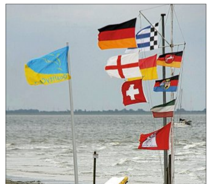
Auf Norderney kann es manchmal ganz schön windig werden, wie man an diesen Fahnen erkennen kann.

lücke, die wieder gefüllt werden muss. Und zwar von der kälteren Luft vom Meer. Sie strömt nach. So entsteht der sogenannte „Seewind“ aus Meeresrichtung. In den oberen Luftschichten kühlt die aufgestiegene warme Luft derweil ab – denn dort ist es kälter – und fällt dann über dem Meer wieder herunter. Denn kalte Luft sinkt ab. So entsteht ein Kreislauf. Oben, wo die nun abgekühlte Luft abgesunken ist, strömt die neu aufgewärmte Luft von Land nach, wird wieder kälter, sinkt wieder ab, wird wieder erwärmt und so weiter. Nachts ist dieser Kreislauf