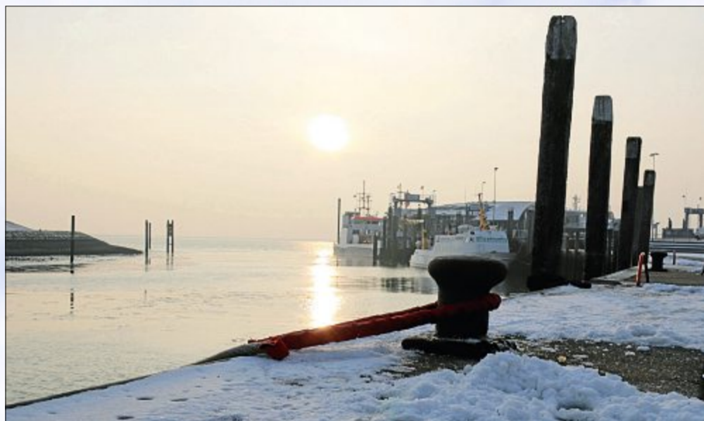
Die anhaltenden Minusgrade sorgen mittlerweile für einen leichten Eisfilm auf der Wasseroberfläche des Hafenbeckens. Die Sonnenstrahlen bringen keine Wärme, die zum Schmelzen reichen würde. Der Schiffs- und Fährverkehr wird hierdurch derzeit aber noch nicht behindert – dafür müsste es noch ein Weilchen frieren.