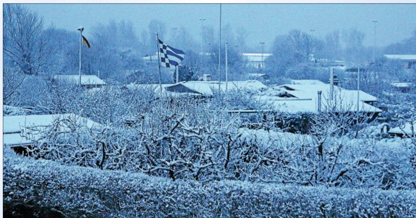
Die Dächer der Kleingärten am Schlickdreieck – alles friedlich bedeckt von einem Mantel aus Schnee.