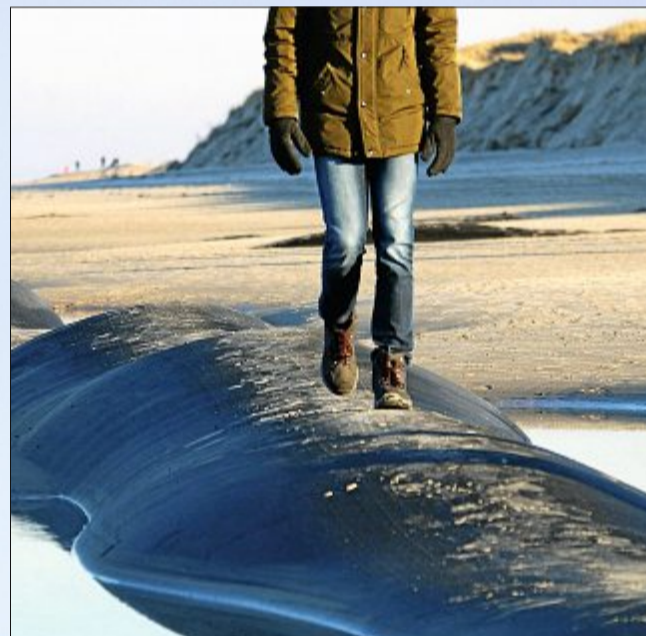
Durch das niedrige Strandniveau sieht man derzeit die mit Sand gefüllte Gewebeschläuche wieder sehr gut. Auch die abgebrochenen Dünenkanten geben ein markantes Bild ab. Laut NLWKN besteht aber in beiden Fällen kein Grund zur Sorge. Die machen sich jedoch einige Norderneyer aufgrund der Zustände der Säcke, die teilweise zerrissen sind. Dadurch gelange noch mehr Müll ins Meer, so ihre Meinung.