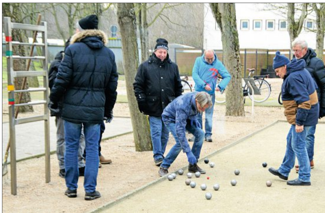
Zu längeren Diskussionen kommt es in der fröhlichen Männerrunde fast nie, denn meistens ist es klar ersichtlich, wessen Kugel am nächsten zum „Schwein“ liegt.

ton ist locker. Drei der acht Freizeitsportler sind Urlaubsgäste und einer von ihnen spielt hier auf der Insel das erste Mal. Kein Problem, denn die Regeln sind schnell erklärt und offensichtlich hat der Neuling ein gutes Händchen für die etwa 800 Gramm schwere Kugel aus Metall, die so nah wie möglich an eine kleinere Holzkugel geworfen werden muss, die „Schwein“ genannt wird. Heute wird in zwei Mannschaften gespielt. Die Mannschaft, die am Ende aller Würfe – jeder Mitspieler hat zwei Kugeln – am nächsten am Schwein liegt, erhält einen Punkt. Wenn es zwei Kugeln sind, zwei Punkte und