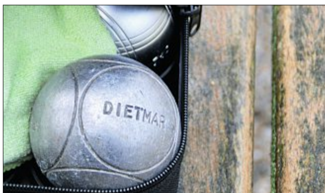
Etwa 800 Gramm wiegen die Metallkugeln, die zur besseren Unterscheidung ein unikates Muster besitzen.

westlich des Conversationshauses gibt es unterschiedliche Bahnen, von hartem Untergrund bis zur weichen Spielfläche, die frei nutzbar sind. Kugeln können im Kurpalais ausgeliehen werden. bos