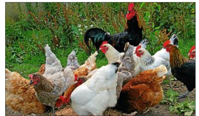
Auch normale Haushühner können an der Vogelgrippe erkranken.

2003 erkrankten einige Menschen an der Vogelgrippe. Daraufhin wollten sich viele vorsorglich durch eine Impfung vor der Krankheit schützen. Ein gutes Gegenmittel oder einen Impfstoff gibt es aber leider nicht. Doch die Vogelgrippe kann zum