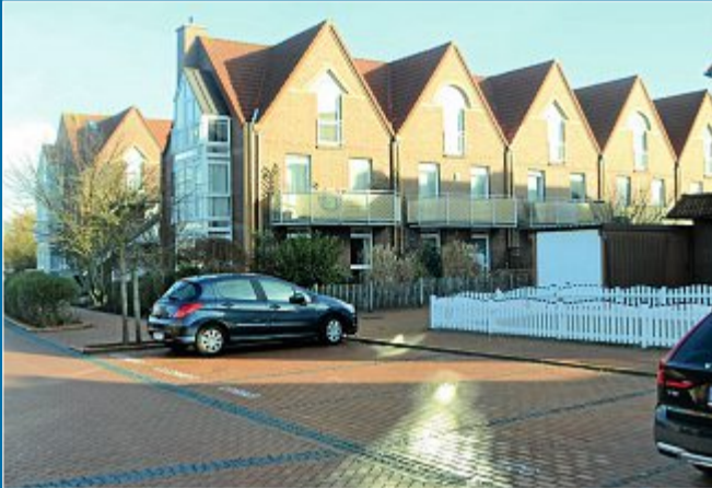
SITZUNG Zahlungssumme an Bodenrichtwerte angeglichen

19. Januar Ablösebetrag für Parkplätze teurer