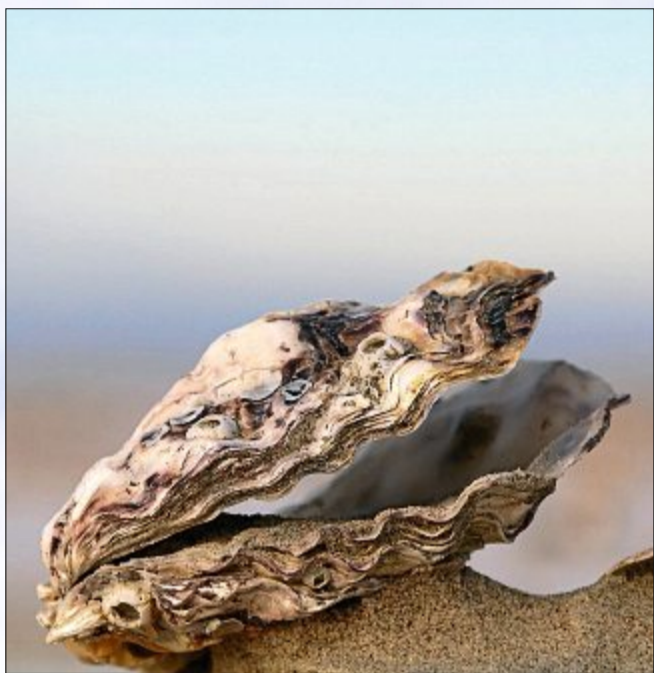
Kleine Schätze am Strand.