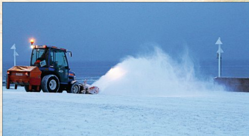
Die TDN sind auch auf eisige Wetterlagen vorbereitet. Der Winterdienst und damit die Aufgabe, öffentliche Wege und Plätze schneefrei zu halten, gehört auf die lange To-do-Liste des städtischen Eigenbetriebes. Ein immenses Pensum, denn trotz der Überschaubarkeit der Insel sind es etliche Kilometer, die es zu säubern gilt. Die ersten Maschinen laufen daher bei den TDN bereits ab 5.20 Uhr.