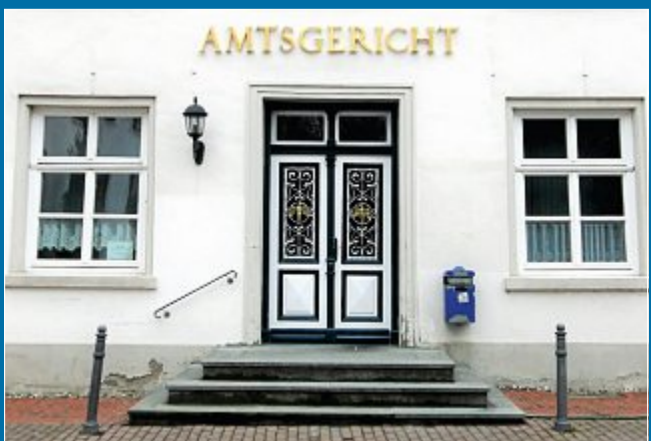
JUSTIZ Ein Anklagepunkt gegen die einstige Chefin des ehemaligen Seniorenheims „Inselfrieden“ fallen gelassen

24. Januar Gericht: Körperverletzung nicht beweisbar