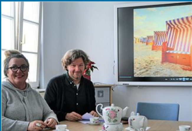
2018 Rück- und Ausblicke des Staatsbades