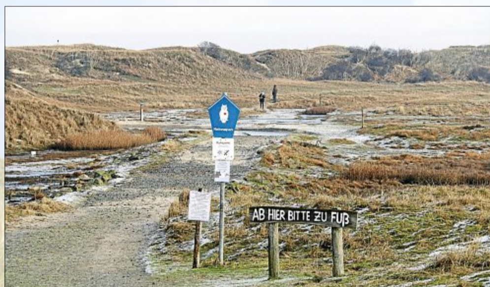
Ruhe und Zeit für sich in (fast) unberührter Natur findet man auf Norderney an vielen Stellen, besonders aber im Inselosten.