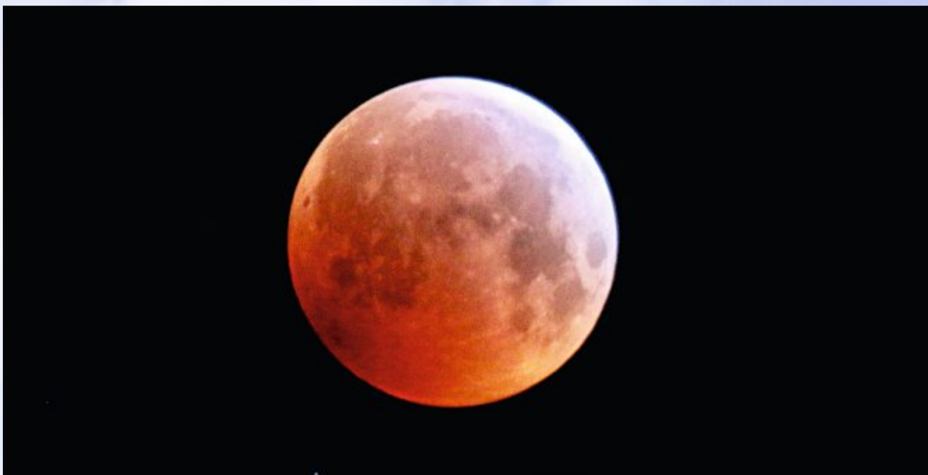
Wer am Montagmorgen ganz früh unterwegs war, durfte wieder einmal einen Blutmond genießen.