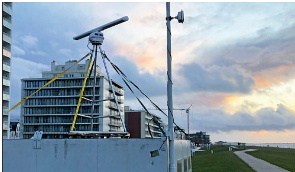
Mithilfe dieses Geräts sollen Informationen rund um den Seegang bei Sturmfluten eingefangen werden.

Neben dem grundsätzlichen Erkenntnisgewinn erhofft sich der NLWKN