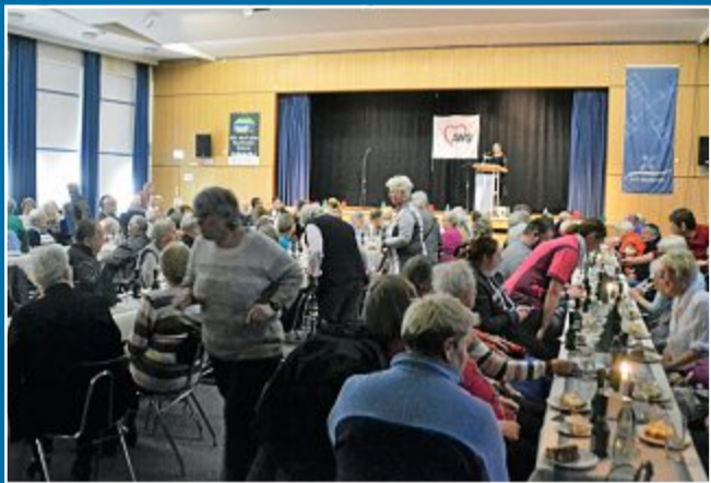
SILVESTER Launiger Nachmittag mit 120 Ollnörderneers der Awo

2. Januar 70. Olljoahrsabend: Frohsinn und Wehmut