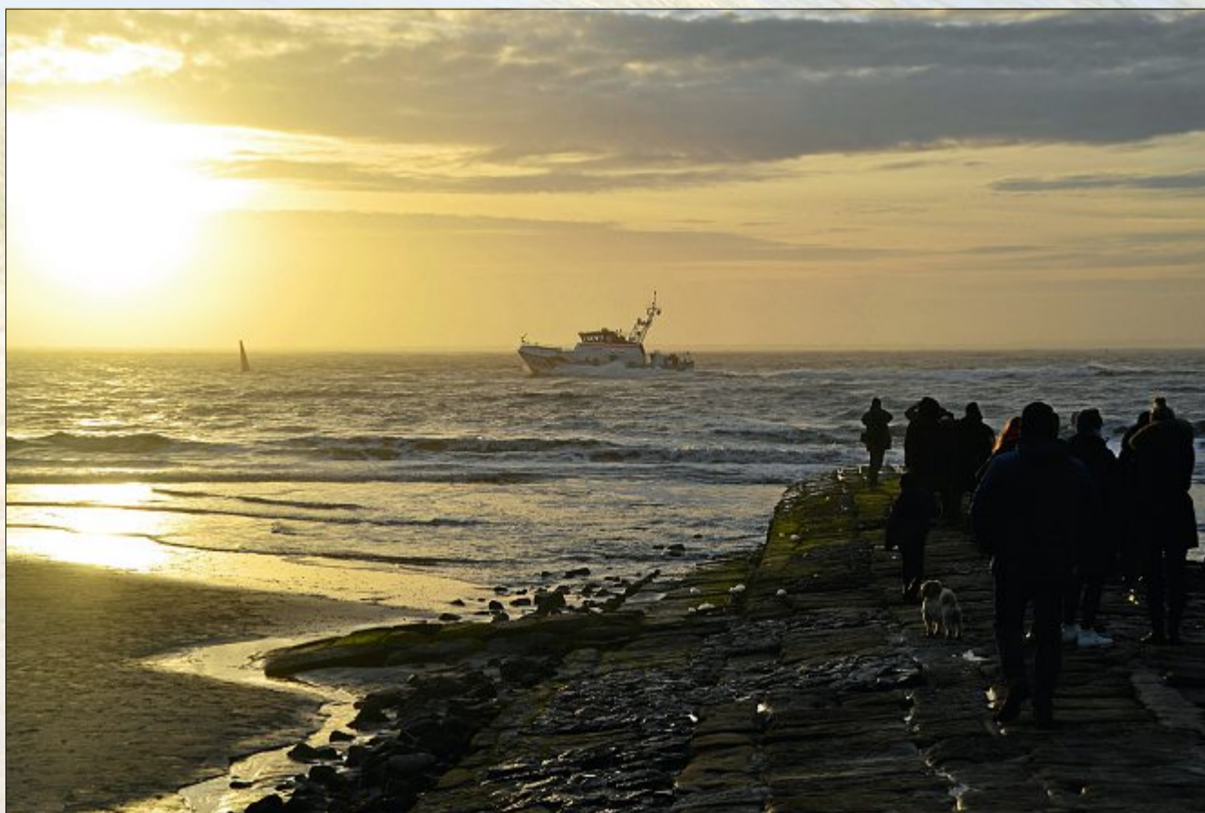
Diesen herrlichen Anblick gab es über den Jahreswechsel beim „Glühenden Meer“ der Seenotretter.