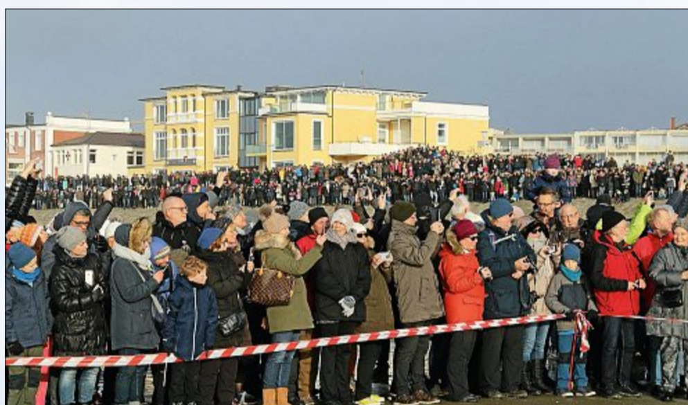
Rund 7000 Zuschauer zog es am Dienstag zum Anbaden an den Weststrand.