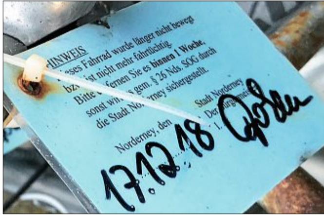
Die Hinweisschildchen des Ordnungsamtes sind wetterfest eingeschweißt und mit Kabelbinder befestigt.

herhalten mussten, tragen eingeschweißte Hinweis-karten in himmelblauer Farbe mit dem Text: „Dieses Fahrrad wurde länger nicht bewegt bzw. ist nicht mehr fahrbereit. Bitte entfernen Sie es binnen 1 Woche, sonst wird es gem. § 26 Nds. SOG durch die Stadt Norderney sichergestellt.“