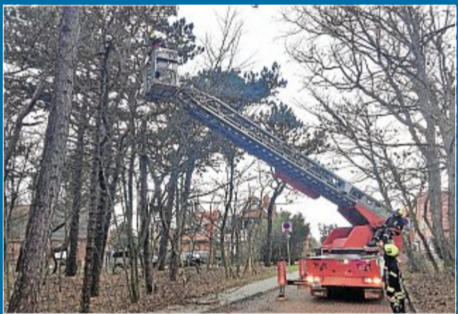
EINSATZ Inselwehr rückt aus – Baum nach Sturm beschädigt

3. Januar Technische Hilfeleistung nach Sturmschäden