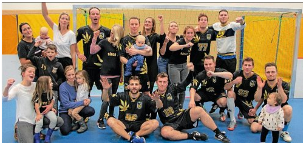
So sehen Sieger aus: Spieler und Familienanschluss der Mannschaft „Ganja '04“, die beim 35. Neujahrsturnier ohne Niederlage ihren siebten Sieg einfahren konnte.

Im Finale wartete nun der Dauerrivale und mit sieben Turniererfolgen Rekordsieger „Die Goldenen Füße“. Die Brisanz und die Spannung, die in der Luft lagen, war für jeden Zuschauer in der gut besuchten Sporthalle spürbar und dass das Ergebnis nach abgelaufener Spielzeit 0:0 lautete,