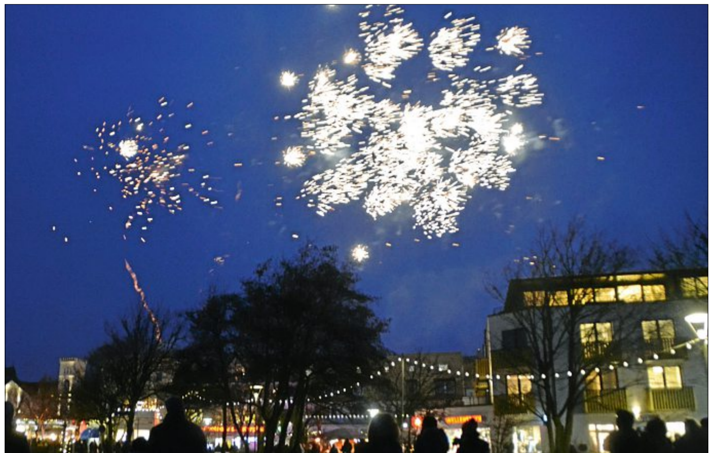
Zum letzten Mal hat es am Sonnabend ein Feuerwerk von Kai Schnieder gegeben. Trotz Regenwetters fanden sich viele Menschen extra hierfür auf dem Kurplatz ein.

Es wird auch die Möglichkeit eines Probetrainings angeboten. Die Gruppe trifft sich ab Jahresbeginn jeden Montagabend von 20 bis 22 Uhr in der großen Sporthalle an der Mühle. Sportliche Kleidung ist mitzubringen, eine Voranmeldung ist nicht unbedingt erforderlich.