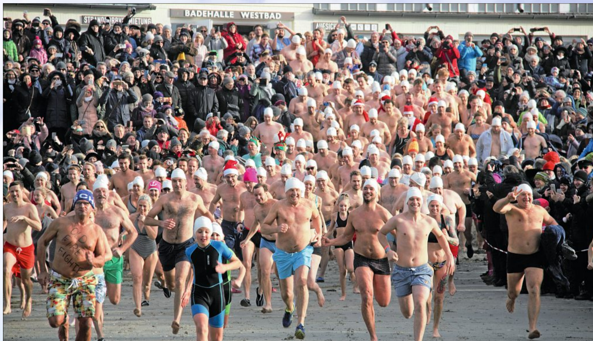
Das neue Jahr beginnt man auf der Insel am besten mit einem Sprung ins kühle Nass – zumindest, wenn man sich diese 500 Mutigen beim 20. Anbaden anschaut (Bericht Seite 1).