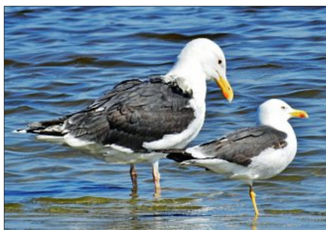
Der enorme Größenunterschied zwischen der großen Mantelmöwe – die in Schottland und Skandinavien brütet – und der kleineren Heringsmöwe kommt hier gut zur Geltung. Die Heringsmöwe nistet auch in dieser Region.