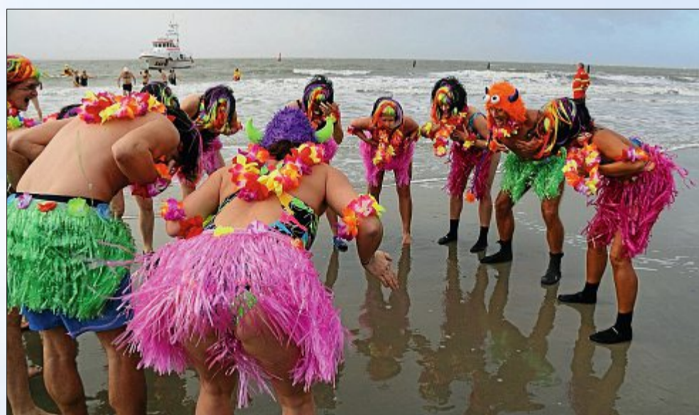
Aufwärmen gehört vor dem Sprung ins kalte Wasser dazu – diese Norderneyer zeigen, wie es geht.