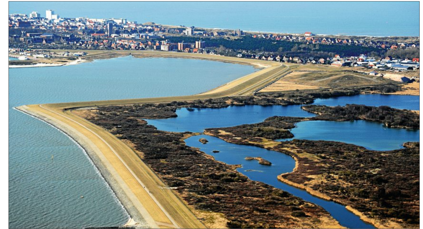
Vor 30 Jahren wurden die Teiche am Südstrandpolder angelegt. Heute sind sie unter anderem für viele Watvögel ein Hochwasserrastplatz – das heißt, um die Hochwasserzeit herum hat man die beste Chance, diese Vogelarten hier zu beobachten.

Vor 30 Jahren war dies an dieser Stelle so noch nicht möglich, denn das Gebiet war verbuscht. Während des Zweiten Weltkrieges sollte hier durch Eindeichung ein militärischer Flugplatz entstehen, doch die Kriegswirren verhinderten dies. Durch Vernässung mittels eines eingebauten Siels entstand zunächst ein Biotop mit Schilfgebiet und Süßwasserteichen, das 1962 unter Naturschutz gestellt und 1986 dem Natio-