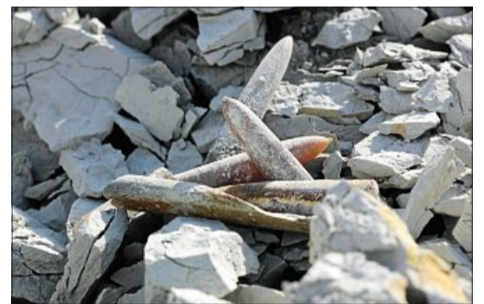
Donnerkeile kann man immer mal wieder am Strand finden. Die Fossile sind mehrere Millionen Jahre alt.

Früher galten Donnerkeile in verschiedenen Kulturen als Heilmittel gegen verschiedene Krankheiten, zum Beispiel gegen einen Hexenschuss. Der Donnerkeil wurde dann als Amulett um den Hals getragen oder auch gemahlen als Medizin verabreicht. Wer einen Donnerkeil bei sich trug,