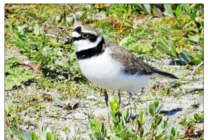
Durch die im Zuge von Pflegemaßnahmen geschaffenen freien Sandflächen am Ufer konnte sich der Flussregenpfeifer ansiedeln. Die in dieser Region selten vorkommende Art zog erfolgreich Junge auf. Zur Erkennung dient der gelbe Augenring.