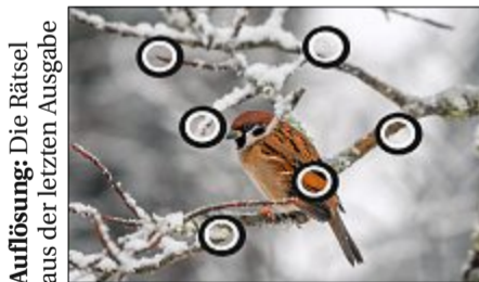
Auflösung: Die Rätsel aus der letzten Ausgabe