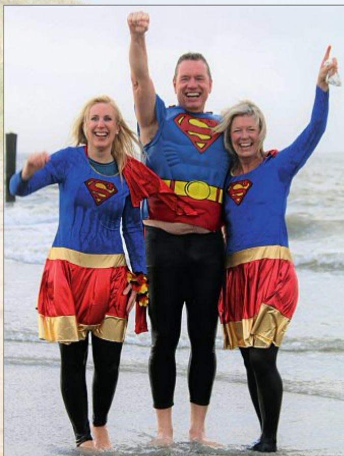
Im Superman-Kostüm spürt man die Kälte sicherlich nicht.