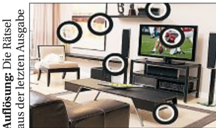
Auflösung: Die Rätsel aus der letzten Ausgabe