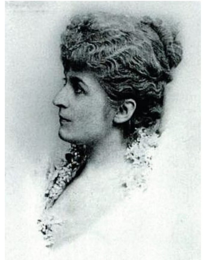
Gräfin Alice Harriet von Kessler wurde 1844 in Bombay geboren und starb 1919.