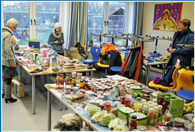
AKTION „Verwenden statt verschwenden“ international interessant