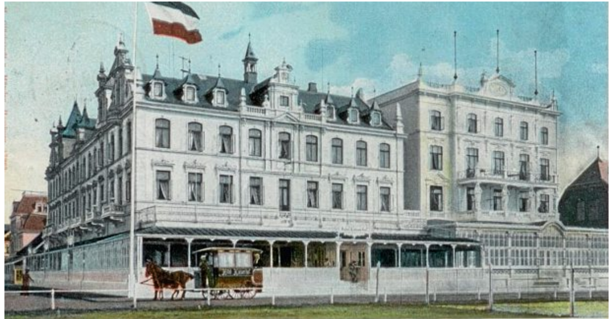
Vornehme Unterkunft: Graf Kessler wohnte natürlich im größten und einem der besten Hotels am Platze, dem Hotel Kaiserhof (links im Bild) an der Kaiserstraße, mit 180 Zimmern und 280 Betten.

Hätte es seinerzeit schon Gesellschaftsmagazine wie die heutige „Gala“ oder „Bunte“ gegeben, so wären Kessler und seiner Familie wahrscheinlich in jedem Heft seitenweise Artikel gewidmet worden. Sein ganzes Leben liest sich nicht nur wie ein spannender Zeitroman der hereinbrechenden Moderne; als zeitgeschichtliche Figur und Neuerer ist Kessler bis heute eine der faszinierendsten, einflussreichsten und zuweilen widersprüchlichsten geblieben. Als akribisch-sachlicher Tagebuchschreiber und ausgesprochener Kunstkenner und Netzwerker war er von bedeutsamem Einfluss auf das kulturelle und politische Leben von den 1890er-Jahren bis zur Machtergreifung Hitlers in Deutschland und lässt seine Leser bis heute hieran teilhaben.