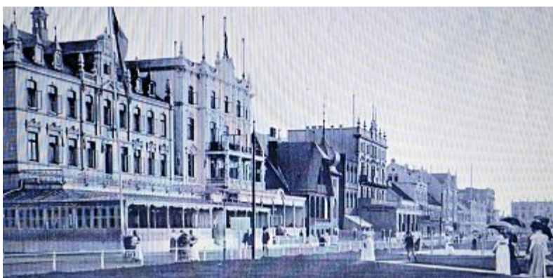
Die Kaiserstraße um die Jahrhundertwende: eine feine Adresse und ein beliebter Ort zum Flanieren.