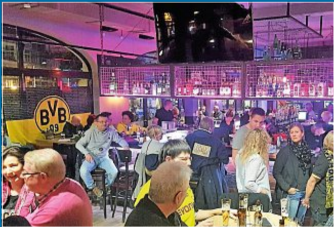
ENGAGEMENT Neun Vereine werden vom BVB-Fanclub bedacht