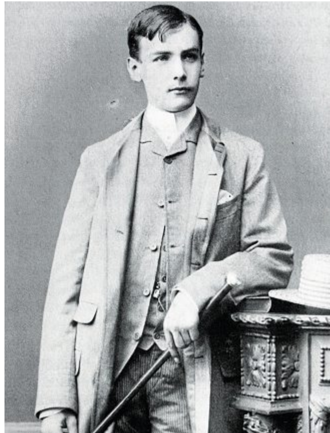
Harry Graf Kessler im Jahr seiner Abiturprüfung und Norderney-Reise 1888.