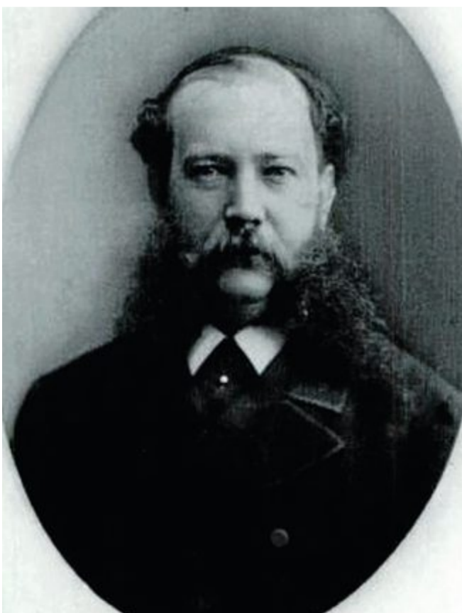
Graf Adolf Wilhelm von Kessler (1839 bis 1895) wurde 1879 in den Adelsstand und 1881 in den Grafenstand erhoben.