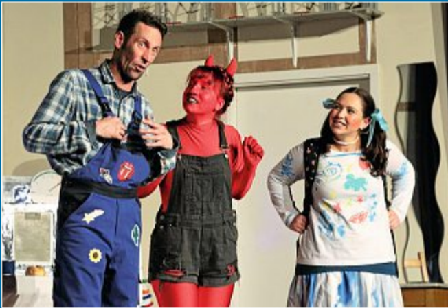
UNTERHALTUNG Aufführung mit Teufelchen begeistert Zuschauer

26. November Laientheater triumphiert mit „Meffi“