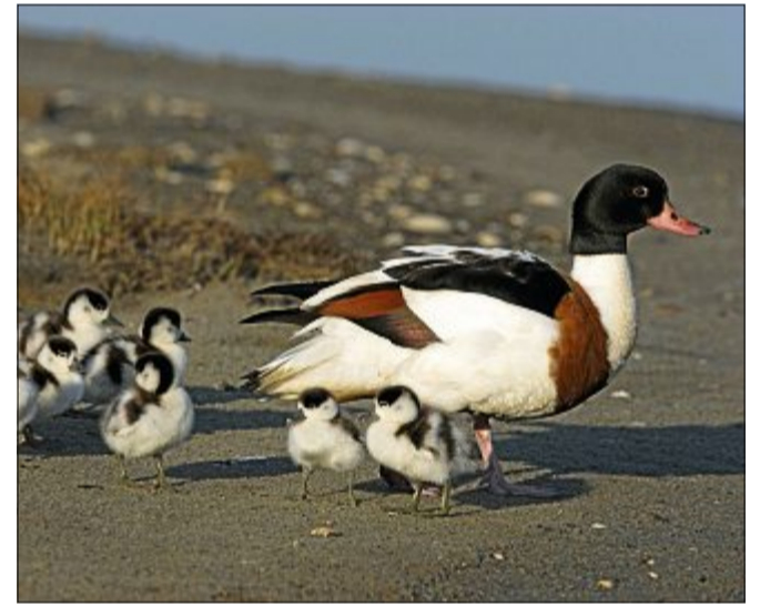
Eine Brandgans mit ihren Küken. Man erkennt sie gut an ihren braunen, schwarz-grünen und weißen Bereichen.

Brandgänse kommen bei uns an der Küste ganzjährig vor, gehören aber auch zu den Zugvögeln. Sie fliegen in geringem Abstand zum Boden und können hohe Geschwindigkeiten