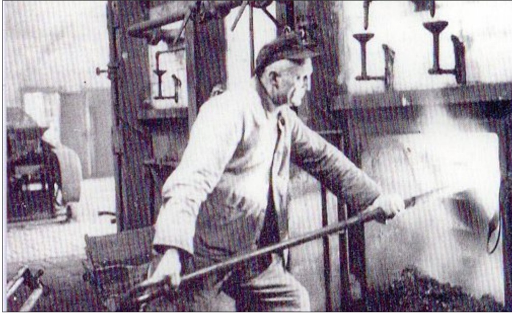
Die Arbeit eines Heizers (240) gehörte zu den schwersten Berufen. Sei es auf dem Gaswerk, im Maschinenhaus der Kurverwaltung, im Seehospiz oder auf den Dampfschiffen der Reederei Frisia. Der Heizer musste eine kräftige Statur besitzen, um das Befüllen und das Entleeren der Öfen zu bewerkstelligen. Damals wurden die großen Maschinen mit Dampf betrieben.

Bald ist die Badezeit wieder vorbei, dann kommt wieder eine schöne Zeit.