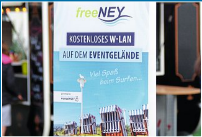
UNTERNEHMEN Sponsoring der Norderneyer Stadtwerke