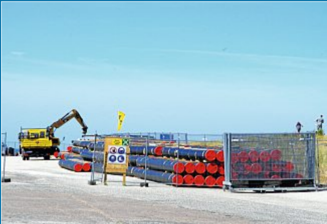
BAU Schweißplatz am Weststrand

13. August TenneT startet Bohrung für Offshore