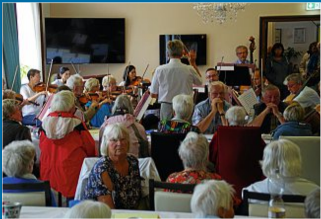
INSEL Sommerfeier des Seniorenzentrums „To Huus“

14. August Blick auf die Zukunft lässt hoffen