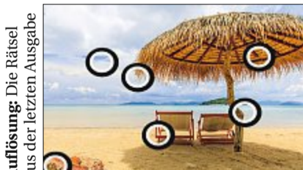
Auflösung: Die Rätsel aus der letzten Ausgabe