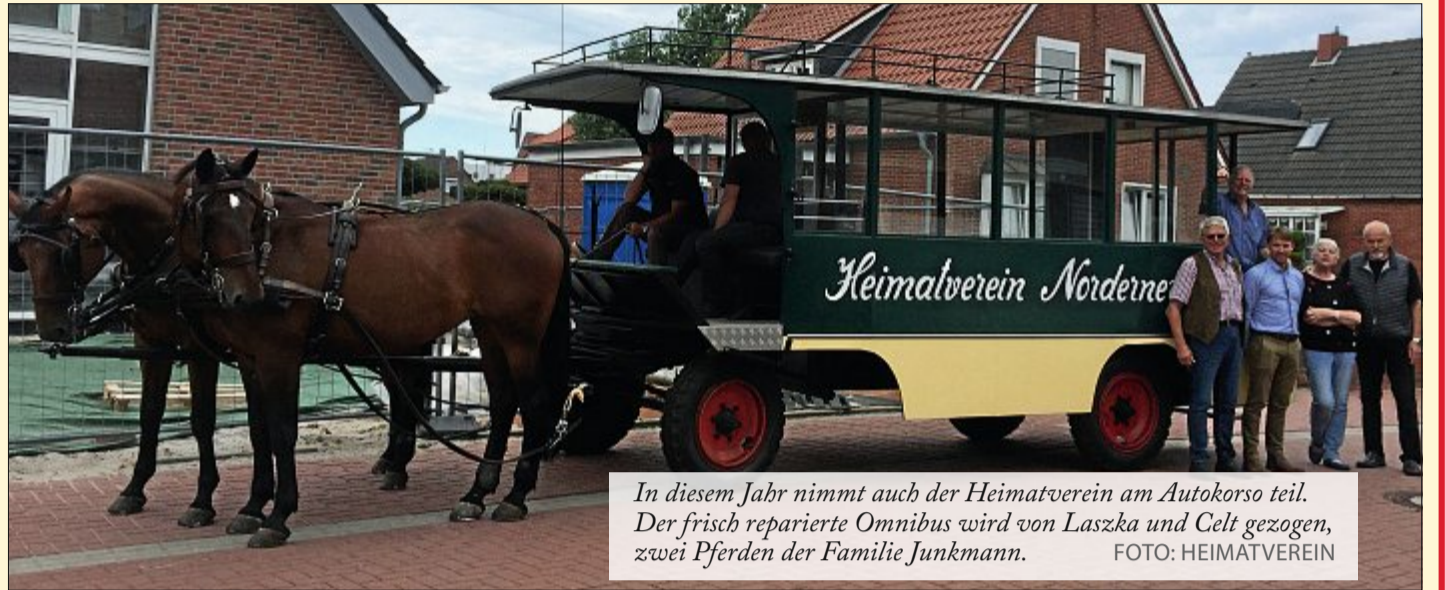
In diesem Jahr nimmt auch der Heimatverein am Autokorso teil. Der frisch reparierte Omnibus wird von Laszka und Celt gezogen, zwei Pferden der Familie Junkmann.