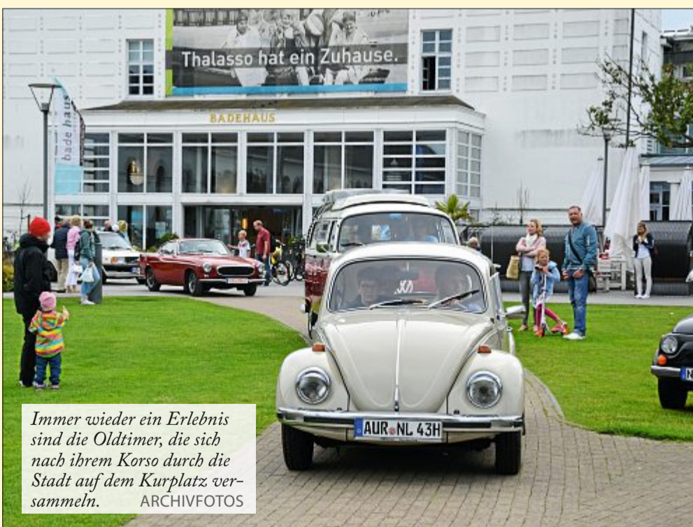
Immer wieder ein Erlebnis sind die Oldtimer, die sich nach ihrem Korso durch die Stadt auf dem Kurplatz versammeln.