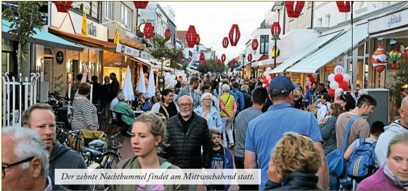
Der zehnte Nachtbummel findet am Mittwochabend statt.