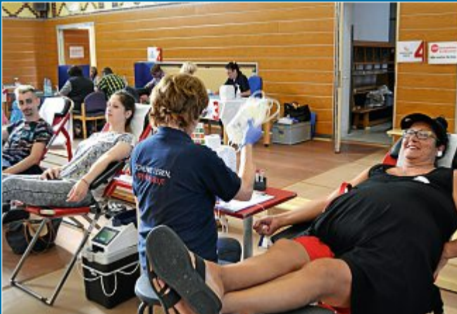
DRK Die nächste Blutspende auf der Insel ist am 24. Oktober

23. Juli 164 Menschen bei der Blutspende