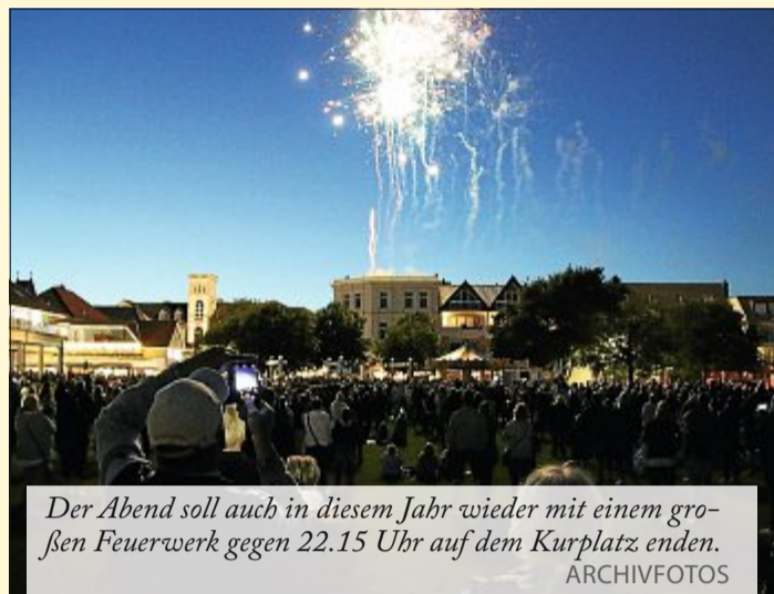
Der Abend soll auch in diesem Jahr wieder mit einem großen Feuerwerk gegen 22.15 Uhr auf dem Kurplatz enden.