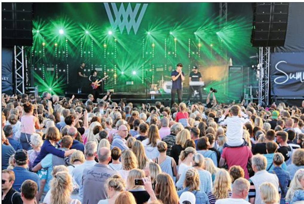
Wincent Weiss hat am Mittwoch die Summertime vor ausverkaufter Arena eröffnet.

nige Schiffe festgemacht. Bevor Weiss aber überhaupt auf die Bühne kam, eröffnete die Vorband „Körner“ mit ihrer gefühlvollen Pop-Poesie den Abend, so Veranstalter König Event Marketing (KEM). Im Duett mit Weiss und dem Lied „Zum Glück ist Liebe niemals out“ gab es während des Hauptkonzertes noch einen weiteren Auftritt für „Körner“. Nicht nur dieses Lied wurde vom Publikum ordentlich gefeiert. Mit seiner charmanten Art schaffte Weiss es bei seinem ersten Besuch auf Norderney nahezu mühelos, seine Songs dem Publikum ans Herz zu legen, sie zum Mitmachen zu animieren, und ihnen manchmal auch ganz nah zu sein. Publikumssehne war er nämlich keineswegs: Ein Spaziergang durch die Menschenmenge hin zur Tribüne sorgte für viel Freude, gerade auch bei den jüngeren Fans. Wie KEM mitteilt, fühlte sich der an der Ostsee geborene Weiss auch am Norderneyer Strand wohl – eine Tatsache, die man dem