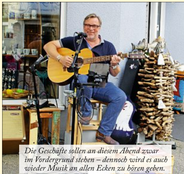
Die Geschäfte sollen an diesem Abend zwar im Vordergrund stehen – dennoch wird es auch wieder Musik an allen Ecken zu hören geben.