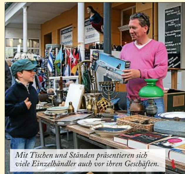
Mit Tischen und Ständen präsentieren sich viele Einzelhändler auch vor ihren Geschäften.