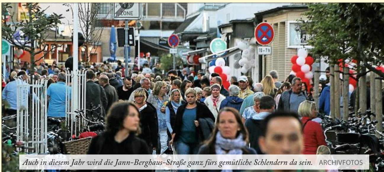
Auch in diesem Jahr wird die Jann-Berghaus-Straße ganz fürs gemütliche Schlendern da sein. ARCHIVFOTOS