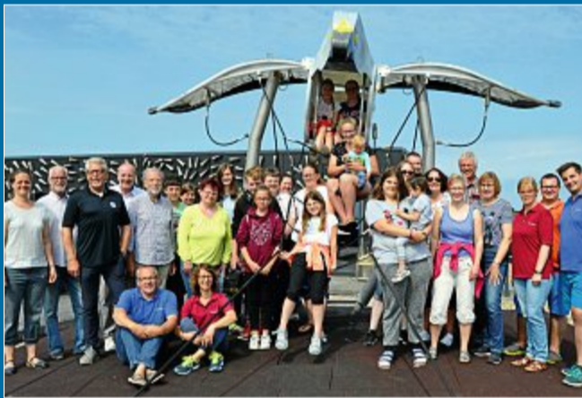
AUSFLUG Kinderhospiz Löwenherz aus Syke besucht Norderney

24. Juli Auszeit auf der Insel für die Familie