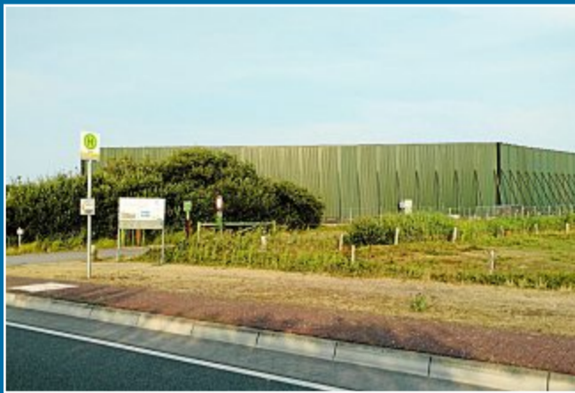
ARBEITEN Bohrungen der Firma TenneT beginnen am 6. August