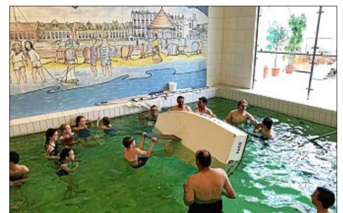
Wie richtet man einen Optimisten auf? Dieser Junge demonstriert es im Schwimmbad.

Für diese Übungen wurde unter anderem eine komplette Optimisten-Jolle mit in das Schwimmbaden genommen. Zum Trainingsabschluss wurde dann noch eine vollautomatische