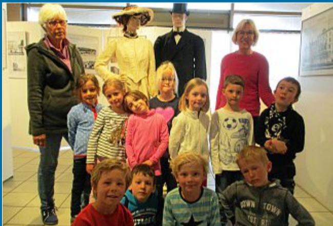
PÄDAGOGIK Vorschulkinder besuchen das Bademuseum

7. Mai Kleine Norderneyer auf Entdeckungstour