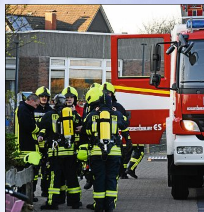
Die Feuerwehrleute helfen sich gegenseitig beim Anlegen der Ausrüstung.