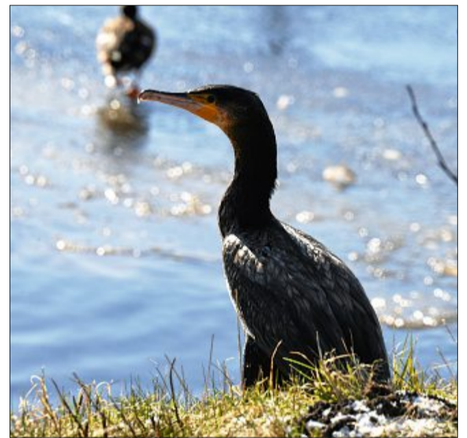
Kormorane müssen nach ihrem Tauchgang ein sonniges Plätzchen finden, um ihr Gefieder zu trocknen.

Vielleicht sehnt er sich tatsächlich ein bisschen nach Zuneigung, denn der Kormoran wurde in Deutschland lange Zeit gejagt und in seiner Fortpflanzung weit eingeschränkt, da er für den Rückgang oder gar das Aussterben von Fischen verantwortlich gemacht wurde. Mittlerweile ist aber bewiesen, dass das nicht der Fall ist