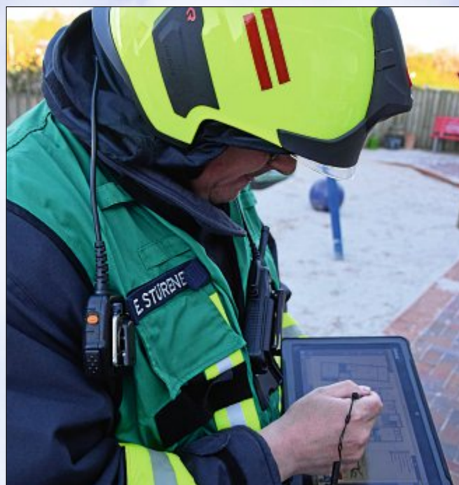
Digital und vernetzt – per Tablet kann die Feuerwehr auf Grundrisse und andere wichtige Informationen zugreifen.