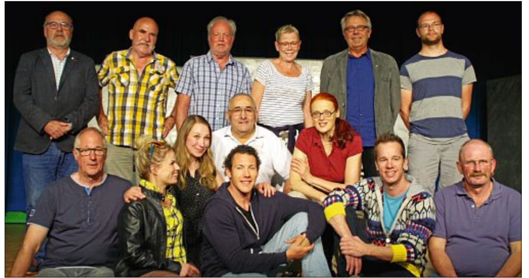
Mitglieder der Selbsthilfegruppe, Vertreter der KGS und der Norderneyer Rotarier rahmen die Schauspieltruppe aus Witten ein.