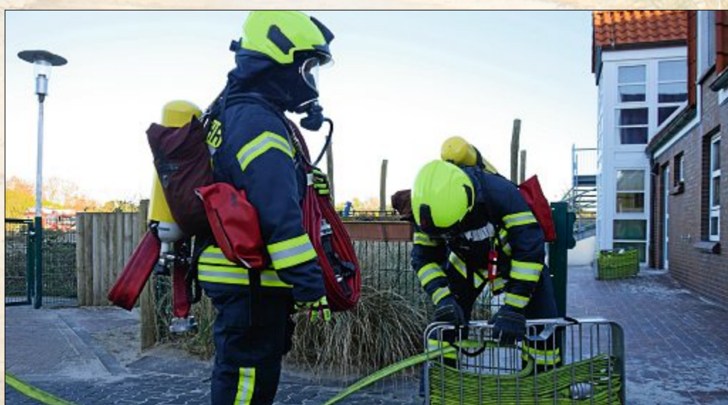
Jeder einzelne übernimmt beim Einsatz spezielle Aufgaben und jeder Griff muss sitzen.