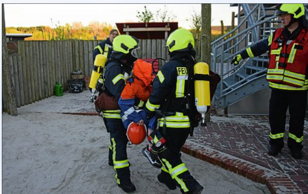
Eine Freiwillige, die laut Unglücks-Szenario Rauchvergiftungen erlitten hat, wird von zwei Kameraden in Sicherheit gebracht.