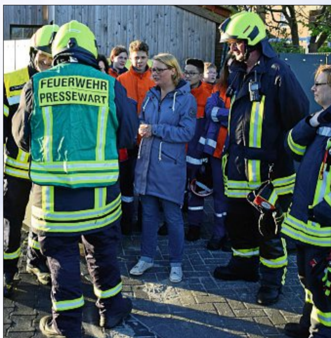
Vor Ort angekommen, werden die Einsatzleiter von den Betroffenen über die aktuelle Lage informiert.