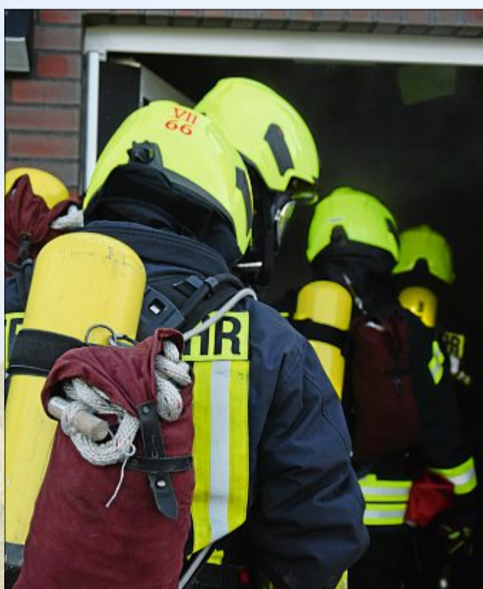
Alle passen aufeinander auf, wenn es in die Gefahrenzone geht. Bei dichtem Rauch ist die Orientierung schwer.