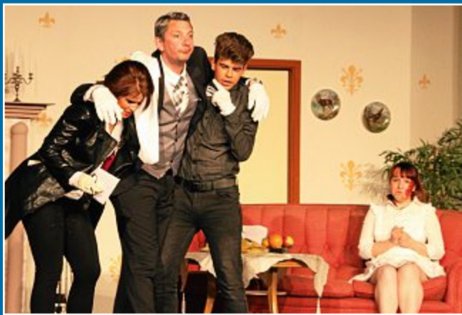
VERANSTALTUNG Premiere von „Mörder mögen's messerscharf“

8. Mai Bei jeder Rolle gibt es das gewisse Etwas