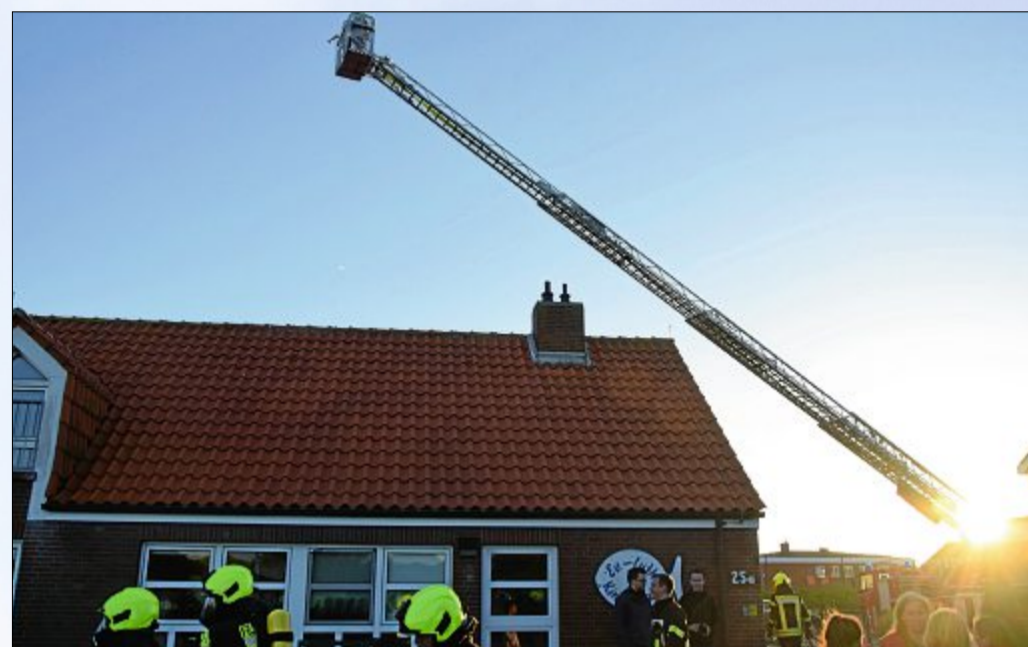
Ein Brand im Kindergarten am Kap mit Menschen im Gebäude ist das Szenario, das der Übung der Freiwilligen Feuerwehr Norderney am vergangenen Freitag zugrundelag.