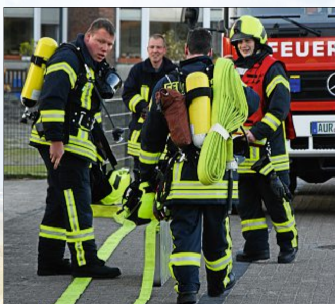
Auch wenn der Einsatz beendet ist – Feierabend ist für die Freiwilligen noch lange nicht.