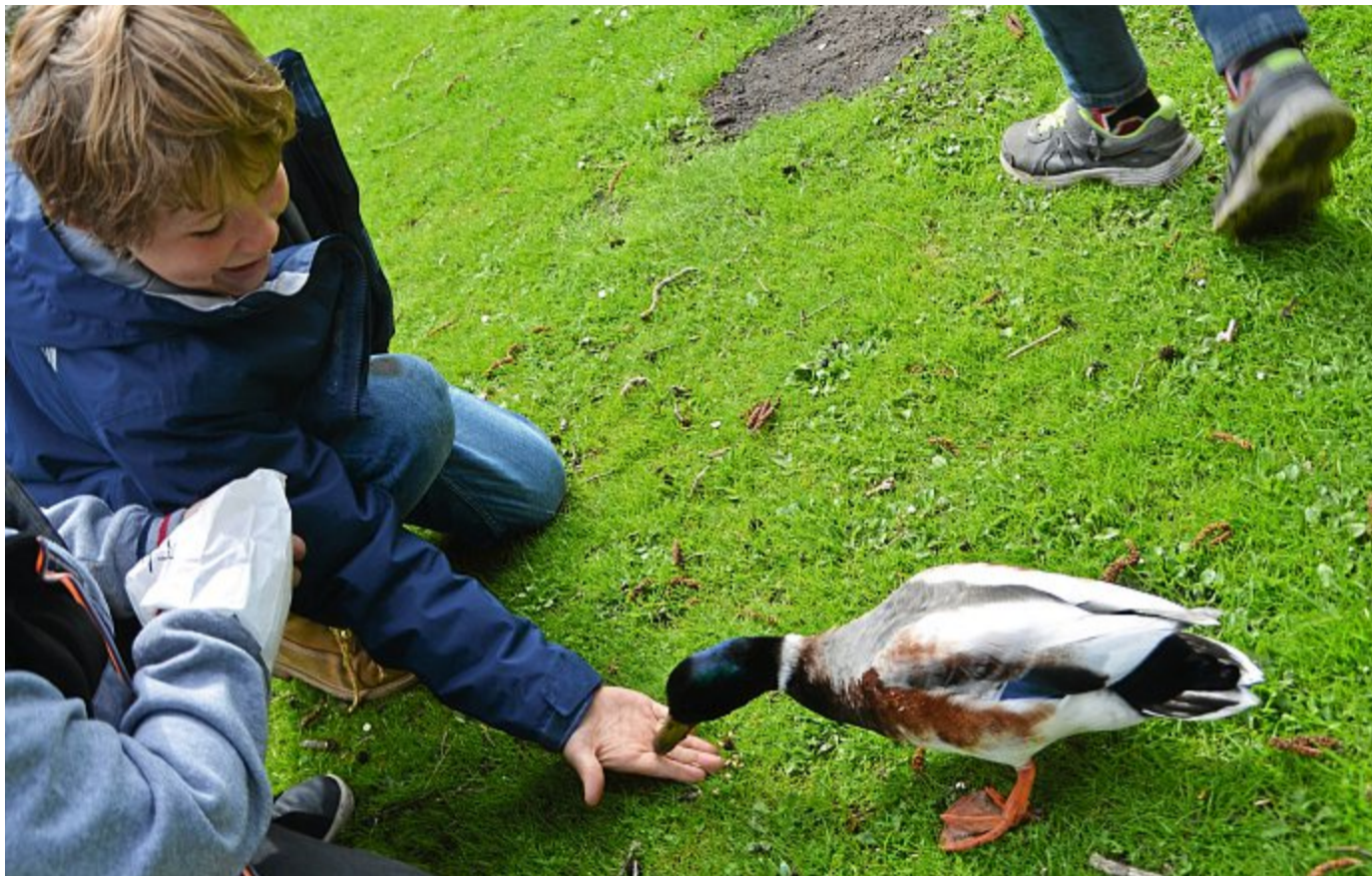
Mit Getreidekörnern können die Kinder der Klasse 3 B der Norderneyer Grundschule am Gondelteich Enten anlocken, die ihnen sogar aus der Hand fressen.