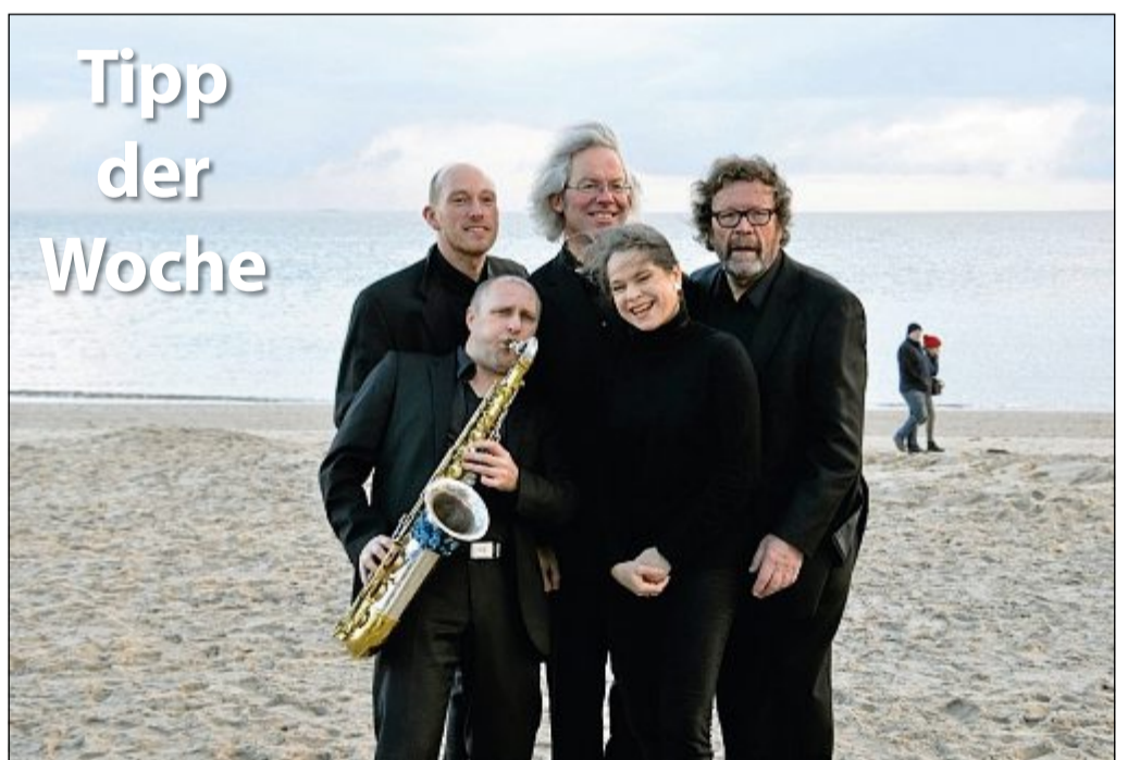
Unterhaltung: Das Jazzquintett Hanse Swing Project präsentiert am Sonnabend, 28. April, um 20 Uhr im Conversationshaus sein Programm „Swingin' Broadway – von George Gershwin bis Jerome Kern“. Der Eintritt kostet 18 Euro im Vorverkauf an der Tourist-Information und 21 Euro an der Abendkasse.

Wenn auch Sie Ihre Veranstaltung hier veröffentlicht haben möchten, setzen Sie sich mit uns in Verbindung.