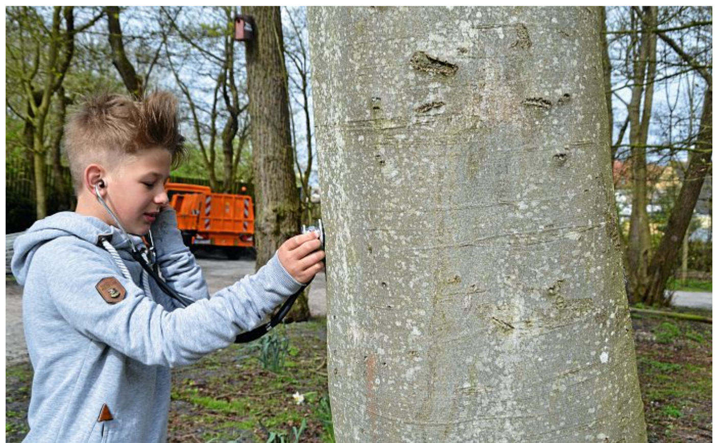
Ein Baum lebt und ist nicht immer nur ein ruhiger Geselle. Dass es im Inneren eines Baumes Geräusche gibt, haben die Jungen und Mädchen mit einem Stethoskop in Erfahrung bringen können. Im Frühjahr kann man den Saftfluss im Baum vernehmen.