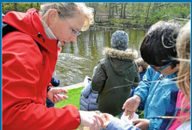
PÄDAGOGIK Umweltbildung an der frischen Luft

26.4. Die Natur mit allen Sinnen erforschen