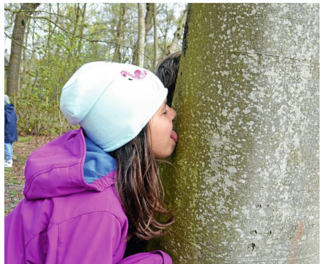
„Bäume schmecken ein bisschen erdig“ ist das Fazit, das die Kinder ziehen, nachdem sie ein paar Bäume im Park angeleckt und geschmeckt haben.