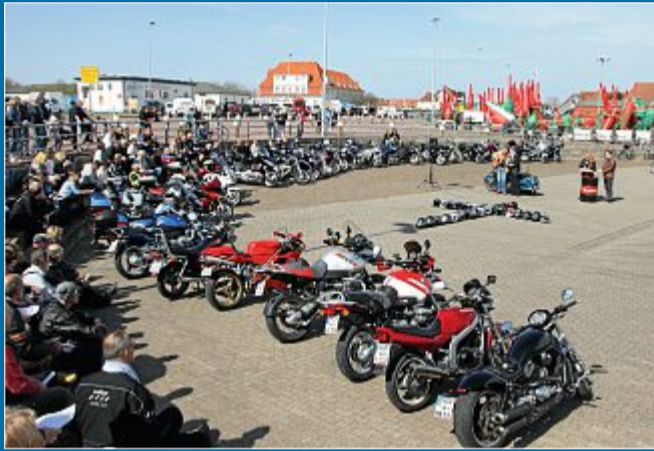
HOBBY Zum zwölften Mal findet ein Motorradgottesdienst statt

23.4. Auf dem Motorrad des Lebens sitzen