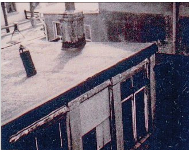
Schuppen-Werkstätte der selbstständigen Handwerkermeister waren auf Norderney Gang und Gabe. Es war nicht üblich, für die Werkstätten der Firmen viel Geld in die Hand zu nehmen. Lediglich große Bauunternehmen und Tischler hatten für ihre Bearbeitungsmaschinen größere Anbauten an ihren Privathäusern.