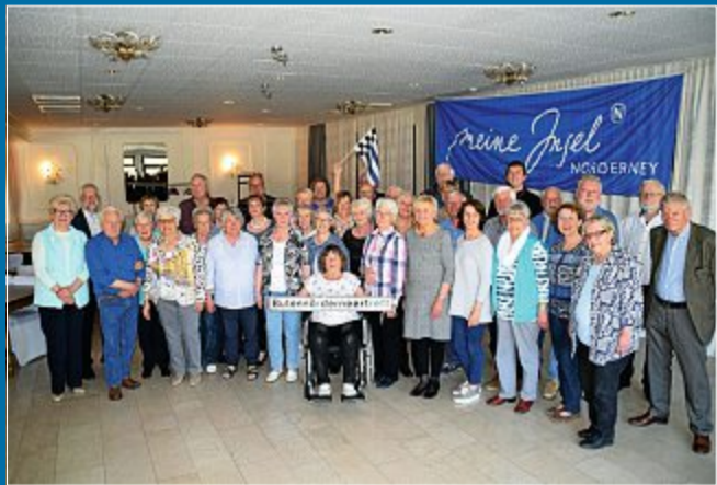
TREFFEN 50 Butennöderneer kommen zusammen