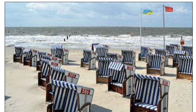
Der Strand ohne Strandkörbe? Nicht nur auf Norderney kaum vorstellbar – zumindest in der Sommerzeit.