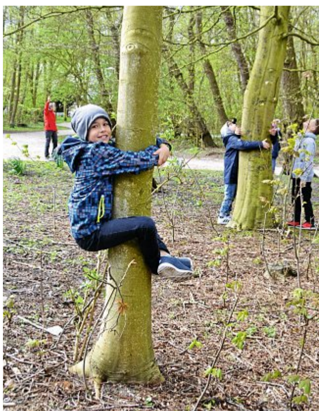
Auf Bäumen lässt es sich super spielen. Ziel des Mobilums ist es unter anderem, Kindern die Freude am Spielen in der Natur zu vermitteln.