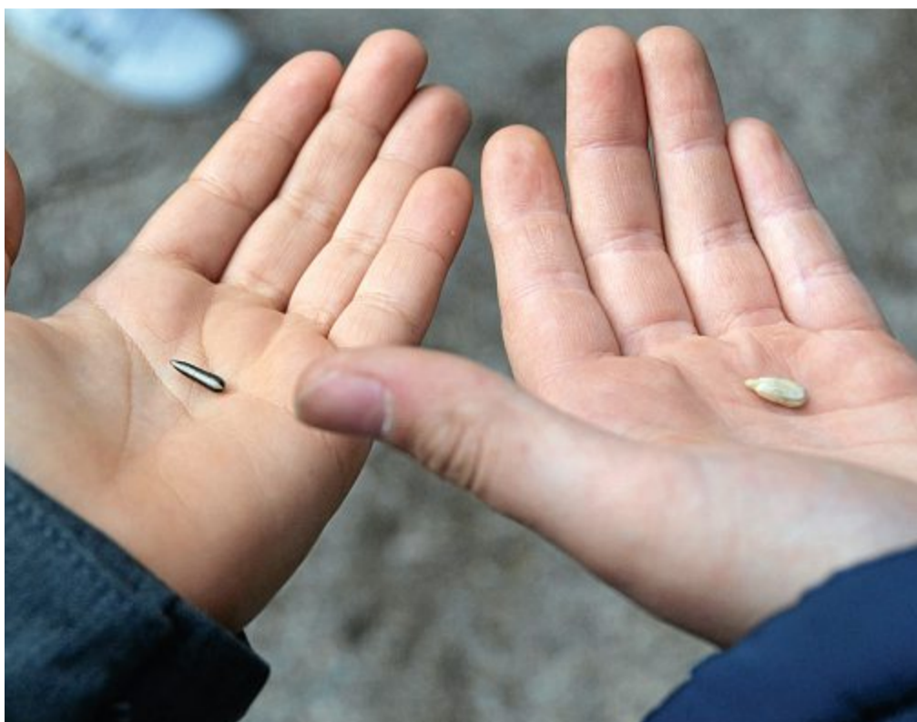
Es sind manchmal die kleinen Dinge, die etwas Großes, Wunderschönes entstehen lassen. Die Mädchen und Jungen der dritten Klassen haben erfahren, dass Sonnenblumenkerne essbar sind, nachdem sie geschält wurden und dass Sonnenblumen aus ihnen entstehen, wenn man sie einpflanzt.