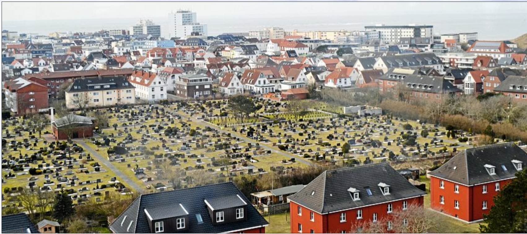
Ganz besondere Ausblicke kann genießen, wer einmal den Norderneyer Wasserturm besteigt. Öffentlich zugänglich ist der jedoch nicht, weshalb man auf besondere Gelegenheiten warten muss. So wie die Aktion des Fanclubs Norderney, der am Dienstag zu einem Besuch des Wahrzeichens eingeladen hat.