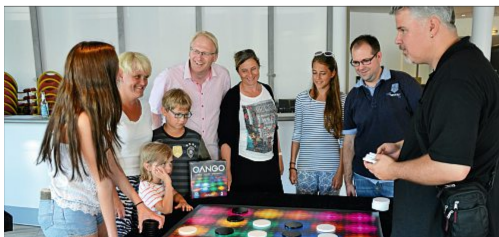
Egal zu welcher Jahreszeit, Brettspiele begeistern bei jedem Wetter.

besondere Aktionen und mehrere Gewinnspiele sowie Turniere, bei denen die Besucher ihr Können unter Beweis stellen und Preise gewinnen können. Der Eintritt ist frei. Die Veranstaltung wird in Kooperation von Anspieler mit der Staatsbad Norderney GmbH und dem Qango Verlag ausgerichtet.