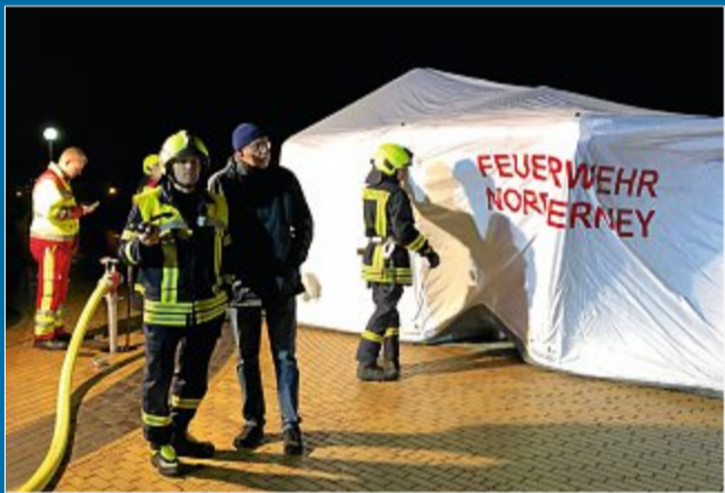
EINSATZ 24 Menschen und ein Hund gerettet

26. März Feuer im Appartementhaus Europäischer Hof