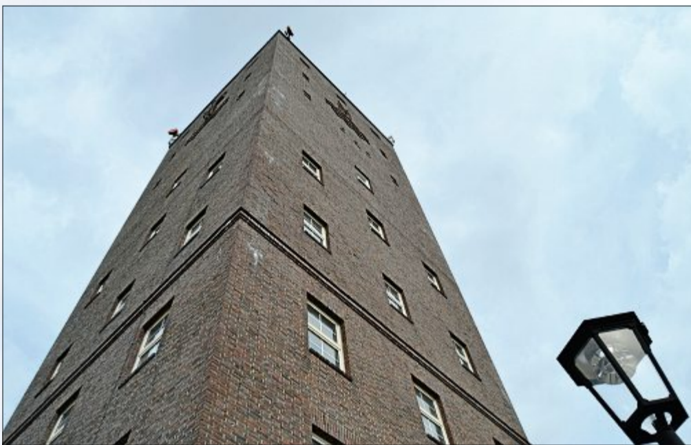
42 Meter hoch ist der 1929 erbaute Wasserturm, bei einer Außenbreite von elf mal elf Metern. Innen gemessen sind es zehn mal zehn Meter. 205 Stufen führen bis ganz nach oben, das letzte Stück wird über eine enge Wendeltreppe erreicht, bei der es einem schnell schwindelig wird. Doch die Anstrengung lohnt sich.