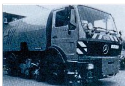
Das obere Bild zeigt Ludwig Rosenboom (139) in seinem Garten. Im unteren Bild ist die Kehrmaschine zu sehen, die sein Arbeitsbereich war.