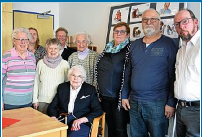
EHRENAMT Neue Satzung des DRK Norderney angenommen

28. März Neuwahlen finden im November statt