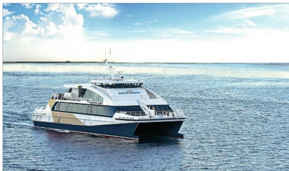
Ab dem 6. April fährt die „Adler Cat“ von Norderney nach Helgoland.

Der Ausflugstag startet um 10.15 Uhr ab Nor-