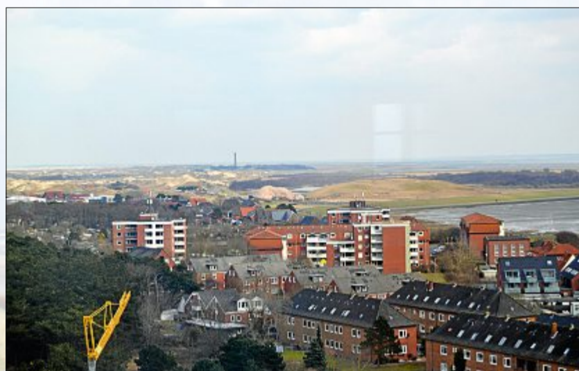
Wer die 205 Stufen erklommen hat und oben auf dem Wasserturm angekommen ist, kann rundherum die gesamte Insel aus einer ganz neuen Perspektive betrachten. Alles scheint zum Greifen nah, so auch die beiden anderen Wahrzeichen der Insel: das neu errichtete Kap (linkes Bild) und der Leuchtturm (rechtes Bild).