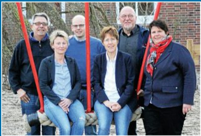
VERSAMMLUNG AG Soziale Einrichtungen tauscht sich aus