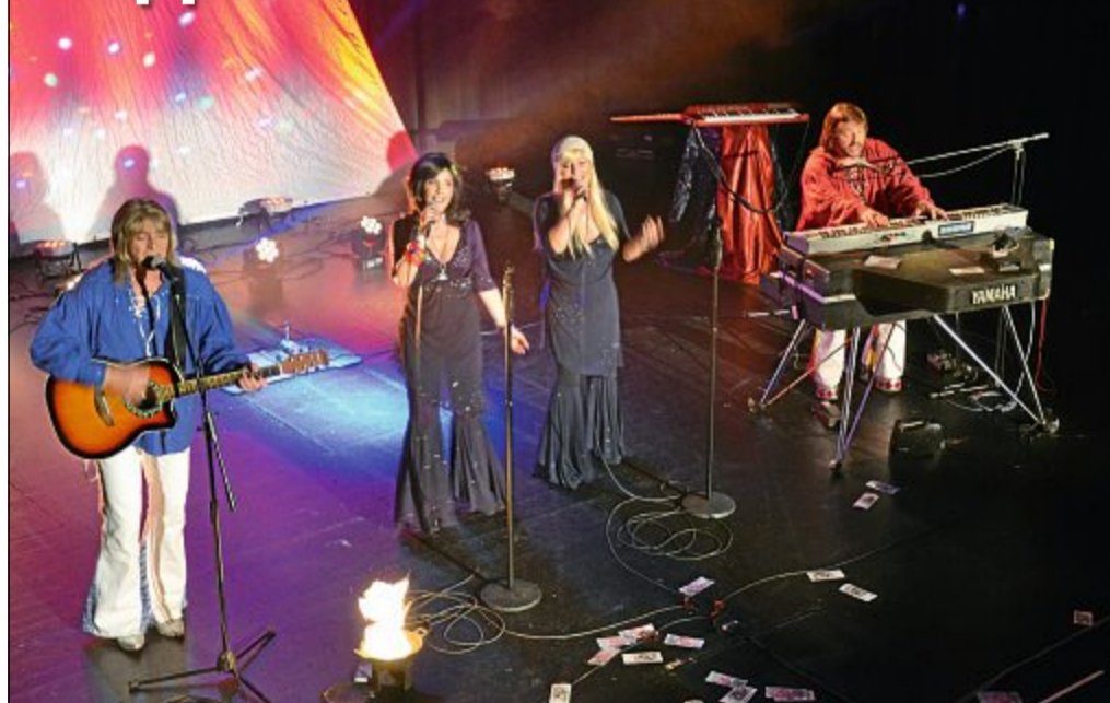
Konzert: „A4u – Die ABBA Revival Show“ mit „Liedern, die um die Welt gingen“, ist am Sonntag, 25. März, im Kurtheater zu sehen und zu hören. Start ist um 20 Uhr, der Eintritt beträgt zwischen 20 und 24 Euro.