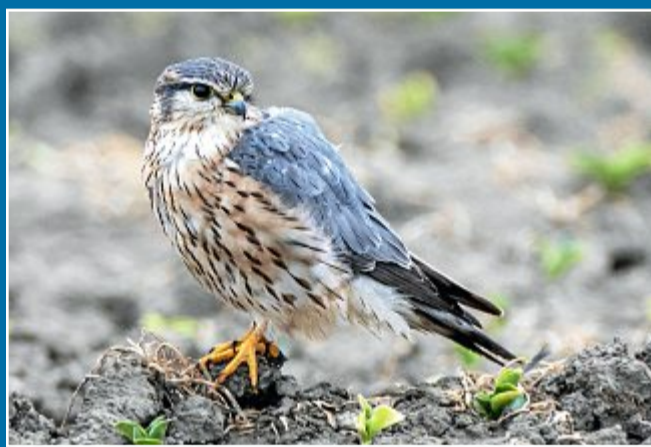
NATURSERIE Vogel des Monats ist der kleinste Falke Europas

21.3. Der Merlin liebt die offene Landschaft