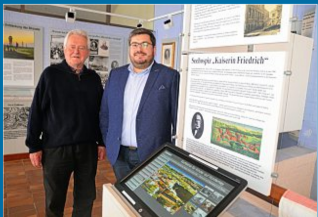
KULTUR Programm des Bademuseums wird vorgestellt

22.3. Drei Sonderausstellungen in diesem Jahr