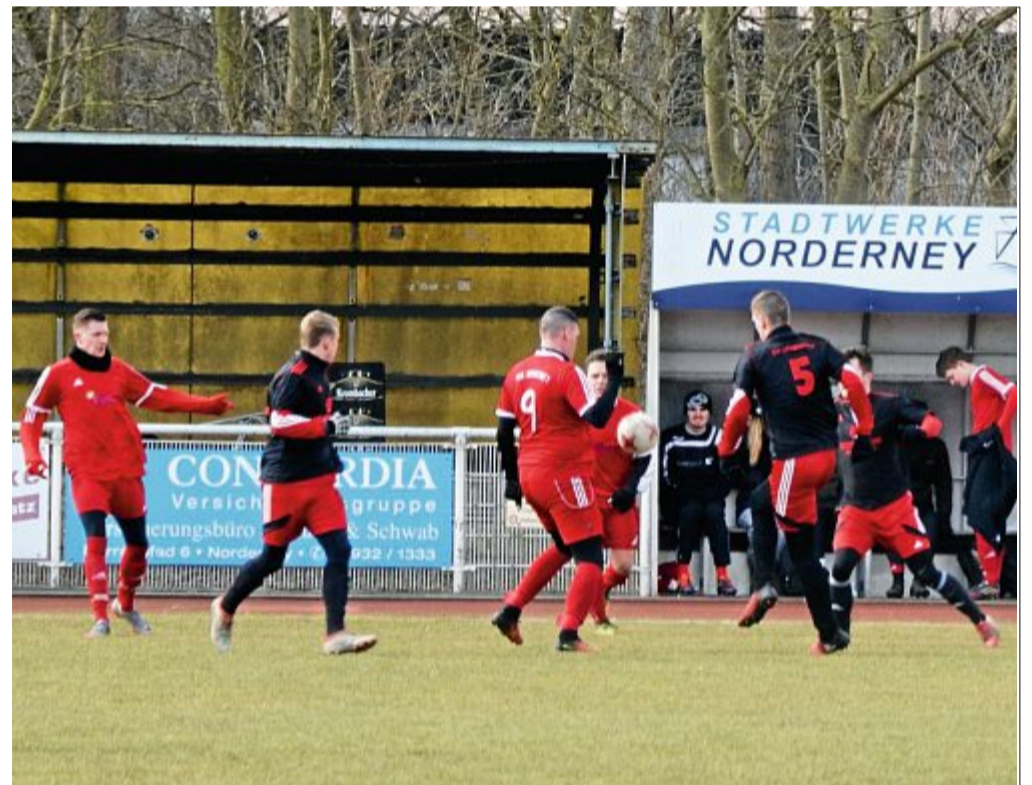
Mit langen Hosen, Handschuben und Schal spielten die Fußball-Herren des TuS (in Rot) gegen den Gegner SV Leybucht am Sonnabend und gegen den starken Wind.