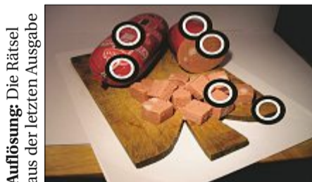
Auflösung: Die Rätsel aus der letzten Ausgabe