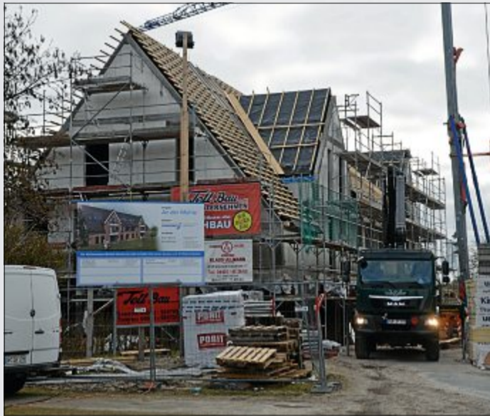
Die Wohnungsbaugesellschaft Norderney baut ein Wohnhaus an der Mühle.

In dem Haus sollen Techniker der Offshore-Firma Senvion untergebracht werden. Später soll das Gebäude Norderneyern zur Verfügung stehen. Geplant ist, dass das Haus ab Oktober weitergebaut wird und im März 2019 die 41 Wohnungen fertiggestellt sind, sagt Rass. Ein weiteres Bauvorhaben des Staatsbades ist der Bau der „Oase“. Dort werde in dieser Saison für die Gäste noch ein Provisorium geöffnet sein, sagt Rass. Im Oktober soll Beginn eines Neubaus sein, der um Ostern 2019 fertiggestellt sein soll. Umbaumaßnahmen erfolgen derzeit noch im „Café Cornelius“ am Nordstrand. Der neue Pächter werde dort voraus-