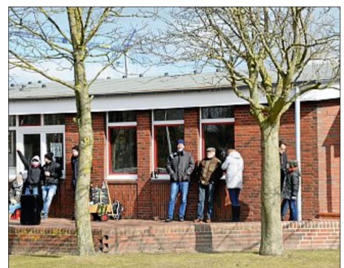
Die Zuschauer stehen normalerweise am Spielfeldrand und feuern ihr Team an. Doch windgeschützter war es am Sonnabend direkt an der Wand des Sportheims.

Die Handball-Damen II spielen an diesem Sonnabend in heimischer Halle gegen den Wilhelmshavener HV III. Anpfiff ist um 13.45 Uhr.