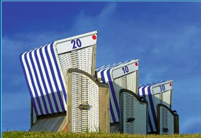
SAISON Der Aufbau der Strandkörbe beginnt