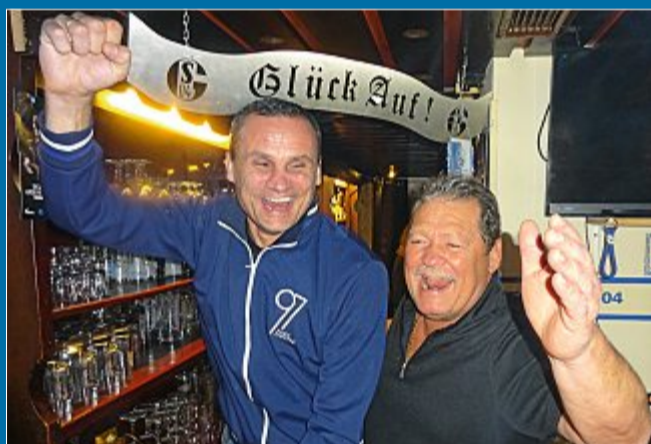
SPORT Norderneyer Auswahl spielt im Juli gegen Schalke-Elf

20.3. Dritte Blau-Weiße Nacht auf der Insel