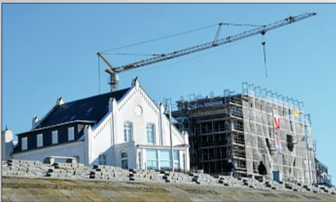
Am Weststrand steht die „Alte Teestube“, deren Fassade saniert wird.

Neben den Bauvorhaben, die in der aktuellen Saison begonnen und nicht zum Abschluss gebracht werden, kämen noch die Vorhaben hinzu, die bis zum Herbst eine Genehmigung erhalten haben und dann auch tatsächlich gebaut werden sollen. Wie viele das sein werden, sei noch nicht abzusehen. Da die Baugenehmigung immer drei Jahre Gültigkeit habe, sei es eine Entscheidung der Bauherren, wann sie tatsächlich beginnen.