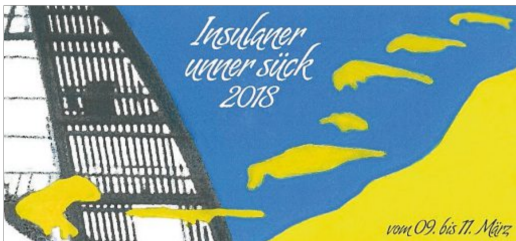
Auf der Homepage von „Insulaner unner sück“ ist das Logo des Ausrichters Juist eingestellt.

Mit dabei sind von Norderney der Förderverein Norderneyer Schulen, die „Zehn im Watt“, die „Döntje Singers“, „Plan B“ und die „SeaStars“. Die Gruppen bereiten sich seit Wochen auf ihren Kurzauftritt vor. Der Förderverein bringt Sketche und Tänze mit nach Juist. Die Tiefblechgruppe „Zehn im Watt“ hat vier Stücke einstudiert. Die „Döntje Singers“ wollen etwas aus ihrem neuen Programm präsentieren. Die jüngsten Norderneyer Teilnehmer sind die Musiker von „Plan B“. Und die „SeaStars“ singen dreistimmig Swing im Stil der Andrews Sisters.