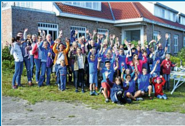
VERSAMMLUNG Rückblick und Ausblick beim Seglerverein

7.3. Große Nachfrage bei den Jugendseglern