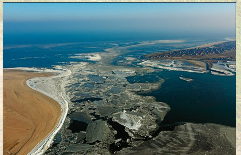
Fast könnte man meinen, man schaffe es vom Inselosten über die Eisschollen bis nach Baltrum.