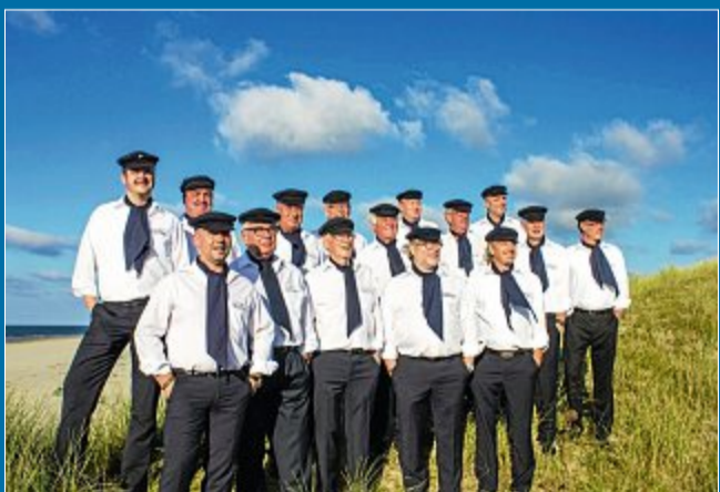
MUSIK Die „Döntje Singers“ bereiten sich auf Juist vor

8.3. Seit fast 34 Jahren eine feste Institution