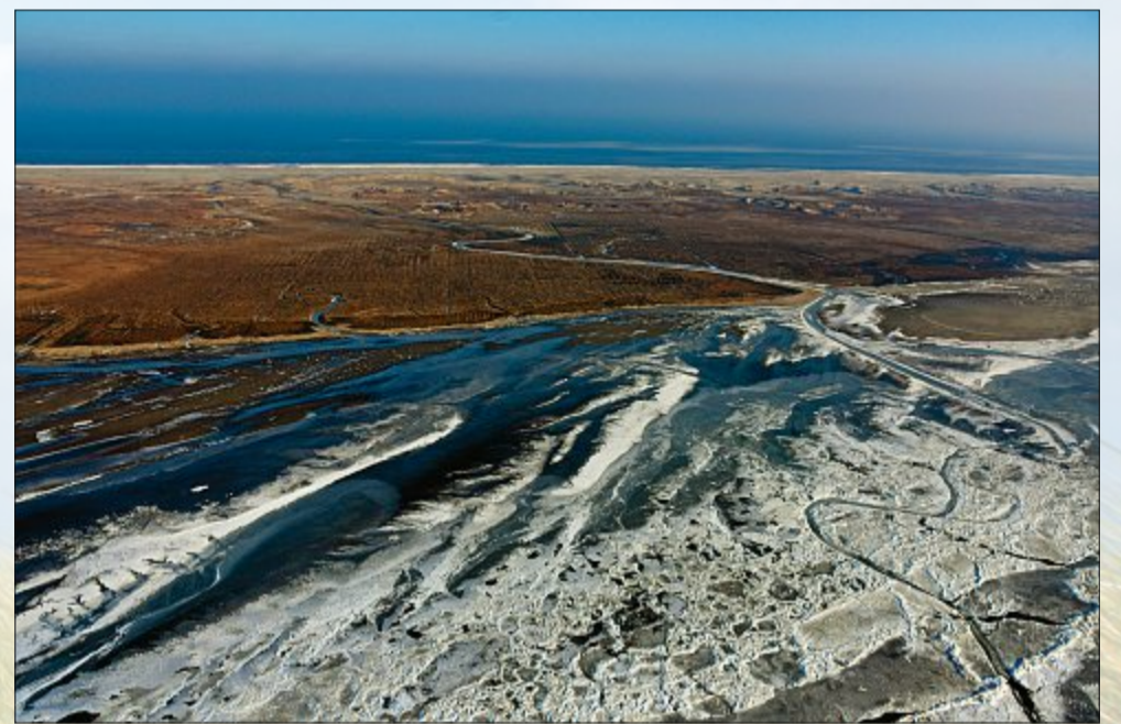
Auch ohne Eis sind die Priele ein herrlich anzuschauendes Naturspektakel. Doch zwischen all dem Eis im Watt wirken die Spuren, die sich das Wasser bahnt, gleich noch beeindruckender.