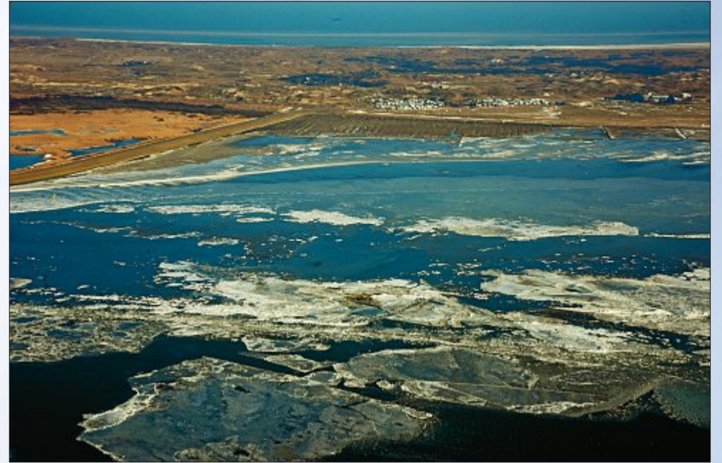
Eisige Kälte hatte die Ostfriesischen Inseln in den vergangenen Wochen fest im Griff. SKN-Fotograf Martin Stromann nutzte die Zeit für einen Rundflug. Auch über Norderney sind tolle Bilder entstanden.