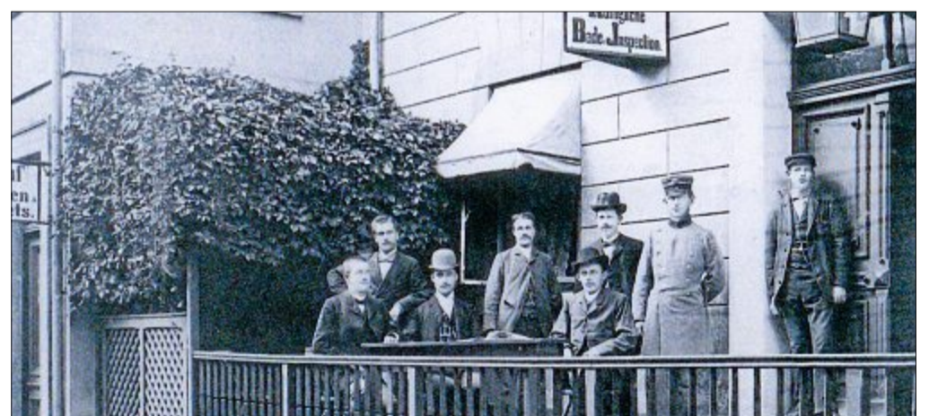
Die „Königliche Bade-Inspektion“ im Jahr 1912. Die Hauptverantwortlichen waren Beamte, die vom preußischen Staat nach Norderney versetzt wurden und hier ihren Dienst ausübten. Die Rangordnung war der damaligen Zeit angepasst, und die Beamten genossen auf der Insel großes Ansehen. Die Inspektion war im Sommer größter Arbeitgeber mit bis zu 160 Aushilfskräften. Das Bürohaus mit Wohnungen für Bedienstete befand sich im „Alten Badehaus“ zwischen dem westlichen Kurhaus und dem Maschinenhaus. Ein Teil des Gebäudes wurde noch bis 1960 genutzt.