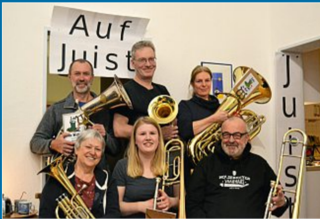
MUSIK Die „Zehn im Watt“ fahren zu „Insulaner unner sück“

6.3. Mit einer Überraschung für die Juister