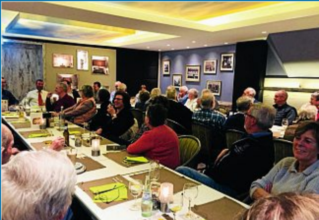
PARTEI Mitgliederversammlung des SPD-Ortsvereins