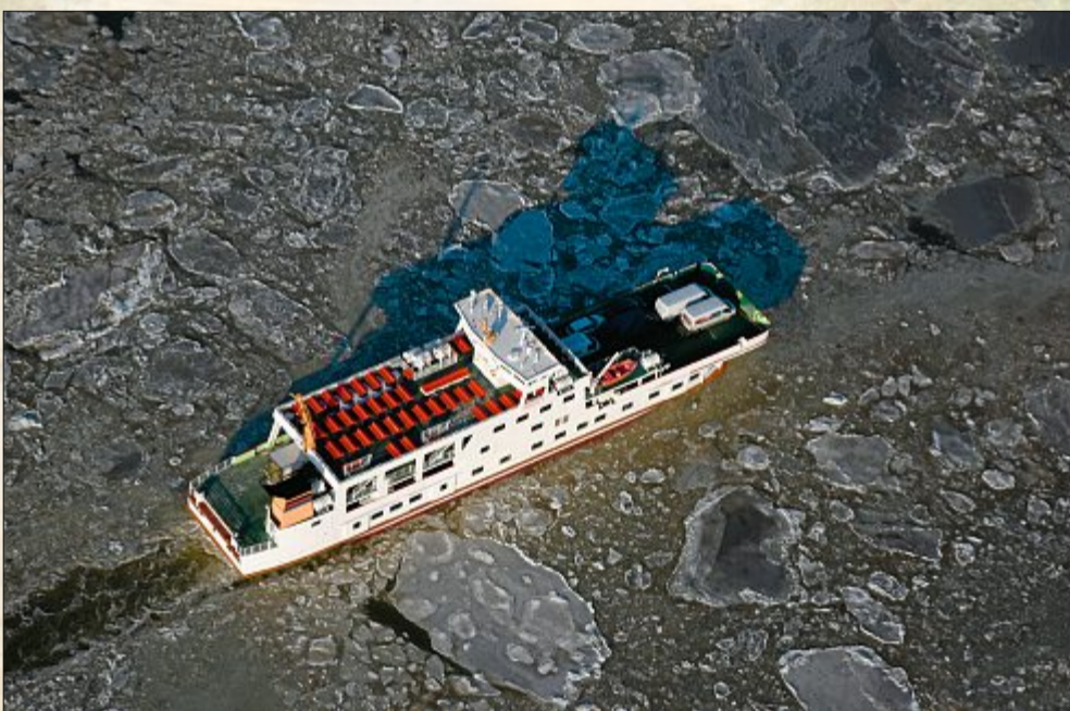
Die Schiffe der Frisia hatten in den vergangenen Wochen bei den Überfahrten schwer zu kämpfen.