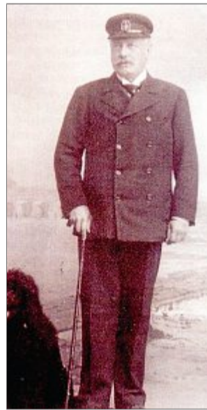
Bernhard von Bülow, von 1900 bis 1909 Reichskanzler, war mehrmals zur Erholung auf Norderney. Sein Wohnsitz war die Villa „Fresena“, heute „Belvedere“. Auf dem Bild sieht man ihn auf der Strandpromenade am Westbad. Ein Attentäter, der 1908 den Reichskanzler ermorden wollte, erschoss sich selbst. Seine Leiche wurde mit einem auf ein Stück Packpapier gekritzelt Geständnis am Strand gefunden.

Für die religiösen Bedürfnisse der Katholiken ist hier in ausreichendem Maße ges-