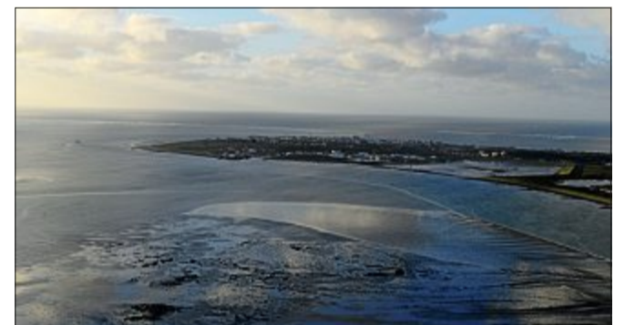
Das Watt vor Norderney ist unter anderem aufgrund des Planktons so nahrhaft für viele Lebewesen.