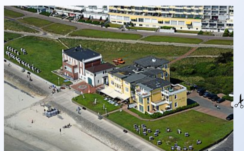
Auflösung: Bestellnummer: 904

Die richtige Lösung der vergangenen Woche lautet: Rettungsbootschuppen am Westbadestrand. Die Gewinnerin ist Johanna Rass von Norderney. Herzlichen Glückwunsch! Dieses Foto und weitere Luftbilder können Sie unter ☎ (0 49 32) 99 19 68-0 bestellen. In unserer Geschäftsstelle, Wilhelmstraße 2 auf Norderney, nehmen unsere Mitarbeiter Ihre Bestellung auch gern persönlich entgegen. Ein Fotoposter im Format 13 x 18 cm ist für 5,80 €, im Format 20 x 30 cm für 14,80 €, im Format 30 x 45 cm für 25,80 € und im Format 40 x 60 cm für 32,80 € zu haben. Auch größere Formate bis zu Sondergrößen auf Leinwand sind möglich.