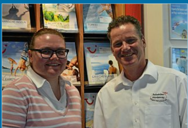
URLAUB 14 Tage Schulferien locken viele Familien ins Ausland