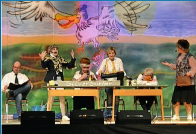
FEIER Beim Winterfest des Förderkreises gab es viele Neuerungen

22.1. Senioren-Mafia und nackte Tatsachen