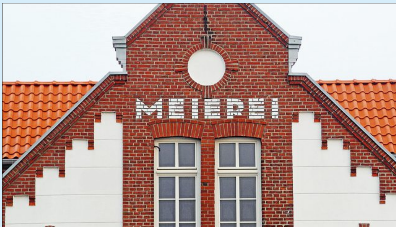
Lange stand das Gebäude leer, nun wird die Meierei wiedereröffnet. Dafür wird hier ein Koch gesucht.

AURICH - CLOPPENBURG - EMDEN - KASSEL - NORDEN - NORDERNEY