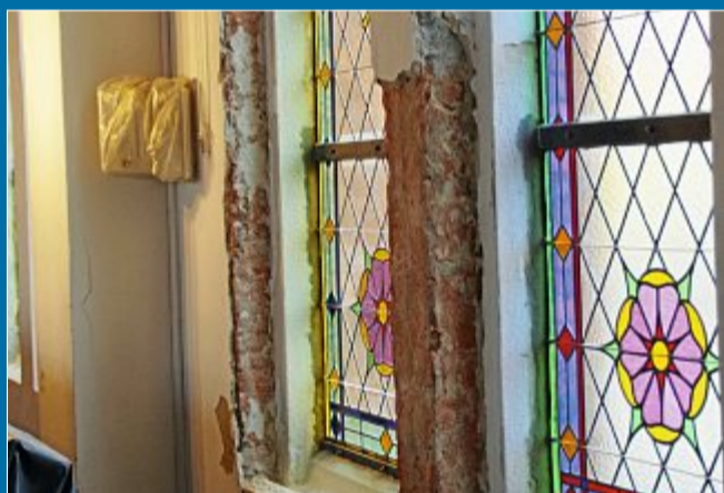
BAU Wegen des Baustaubes wird die Orgel verpackt