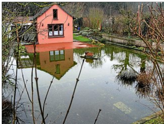
Das Wasser steht in den Kleingärten bis zu den Häusern. Die Winterpflanzen wie Grünkohl leiden unter der Nässe.

Bei der Norderneyer Kläranlage macht sich das viele Wasser ebenfalls bemerkbar, wie Abwassermeister Fridolin Mai sagt: „Es hat beträchtliche Auswirkungen.“ Durch den hohen Grundwasserstand müssten zusätzliche Becken eingesetzt werden. Außerdem ergäben sich hohe Pumpenlaufzeiten.