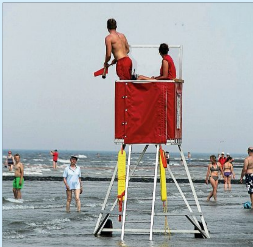
Die Staatsbad Norderney GmbH sucht auch für die kommende Saison wieder Fachkräfte. Rettungsschwimmer werden als Saisonkräfte eingestellt.

Die Mitarbeitenden der Caritas sind vielfältig: Sie gehören unterschiedlichen Konfessionen und Religionen an, sind ledig, verheiratet, geschieden oder leben mit ihren gleichgeschlechtlichen Partnern zusammen; sie sind jünger oder älter. Alle verbindet die gleiche Haltung des Herzens, die auf das Evangelium zurückgeführt wird: Jeder Mensch ist einzigartig.