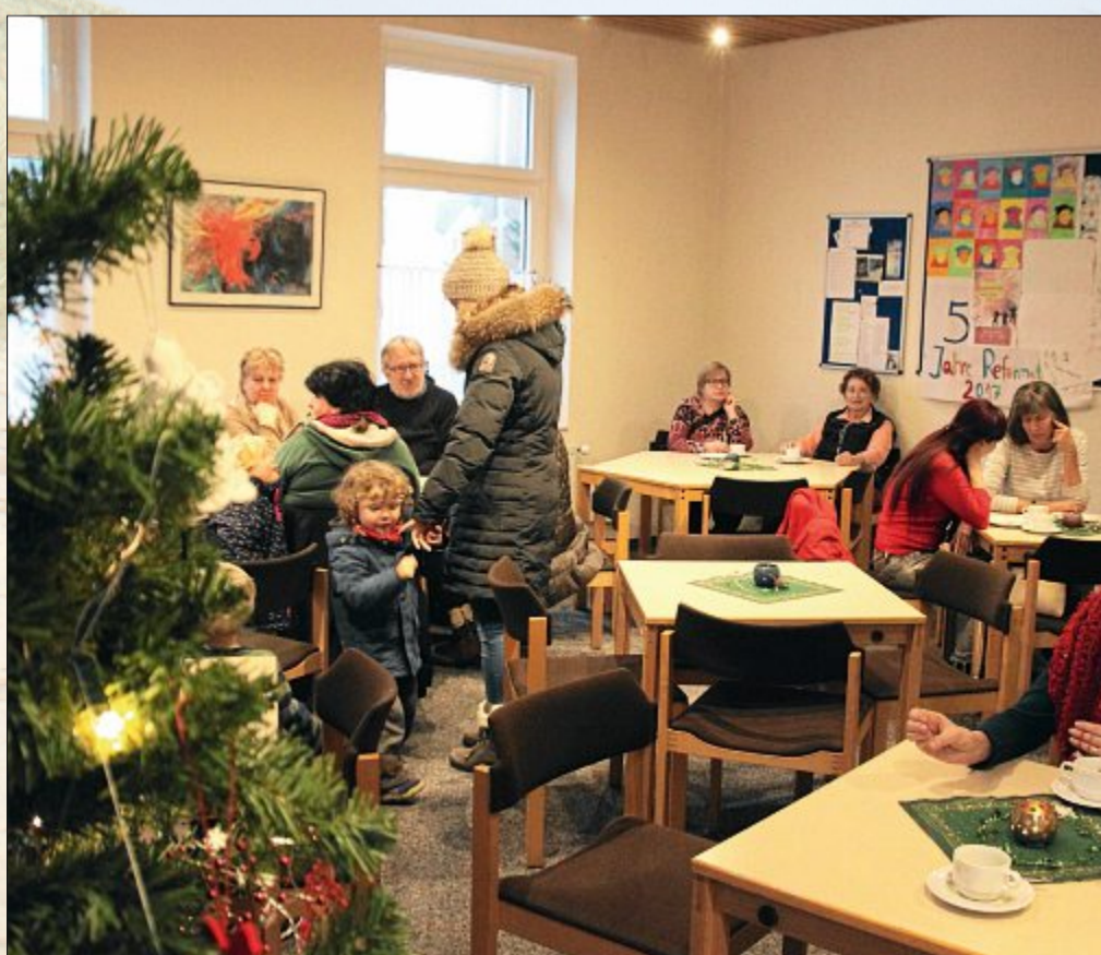
Bei Kaffee und Kuchen ließen es sich die Besucher des Kreativbasars im Martin-Luther-Haus nach dem Stöbern an den Ständen gut gehen.