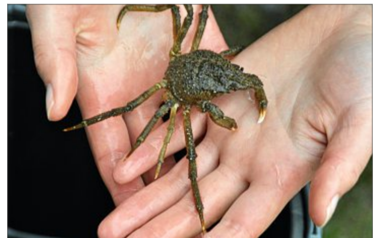
Trotz der langen Beine und des Namens ist die Seespinne ein Krebs.

Wusstet ihr, dass ein Meeresbiologe, also je-