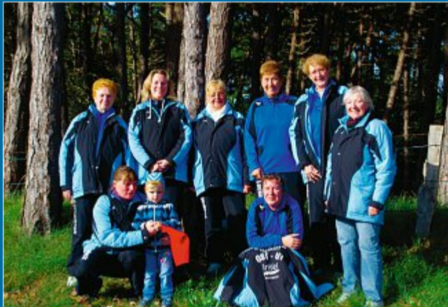
SPORT Serie über Boßelteams beginnt mit den Frauen von „Ost Ut“

4.12. Kraft ist ebenso wichtig wie Genauigkeit