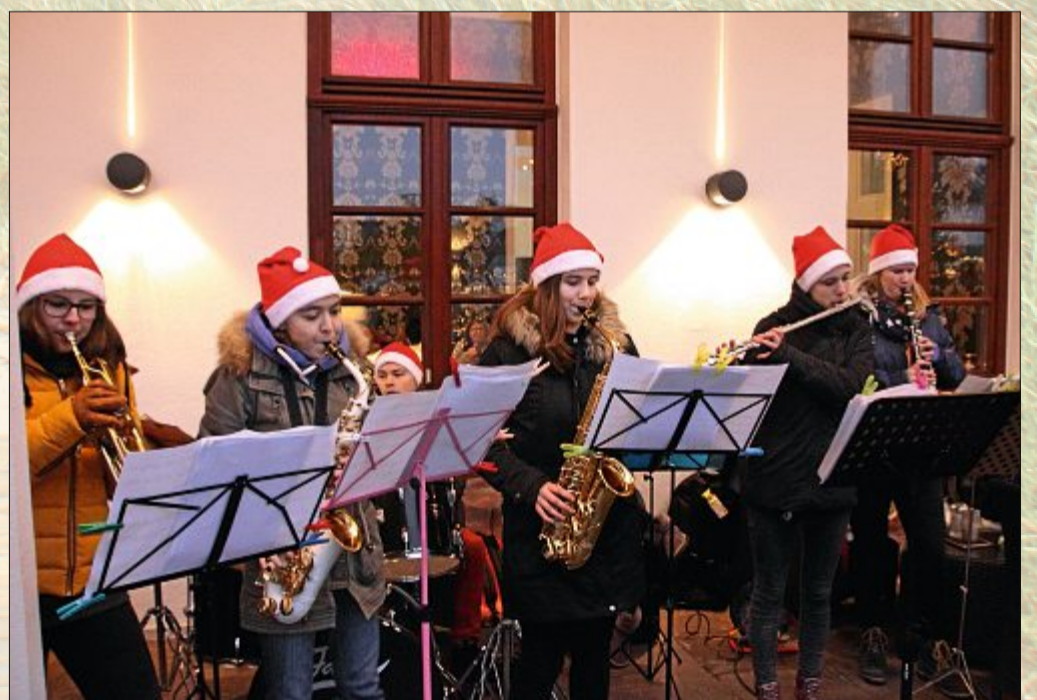
Für adventliche Stimmung sorgte in diesem Jahr auch wieder der Rotary Club vor dem Conversationshaus mit Glühwein und Gulaschsuppe. Die Band „Plan B“ unterhielt die Gäste mit Musik.