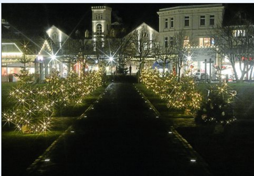
Beleuchtete Tannenbäume säumen den Weg vor dem Conversationshaus. Den Baumschmuck haben Kindergartenkinder selbst gebastelt und eigens an den Tannen befestigt.