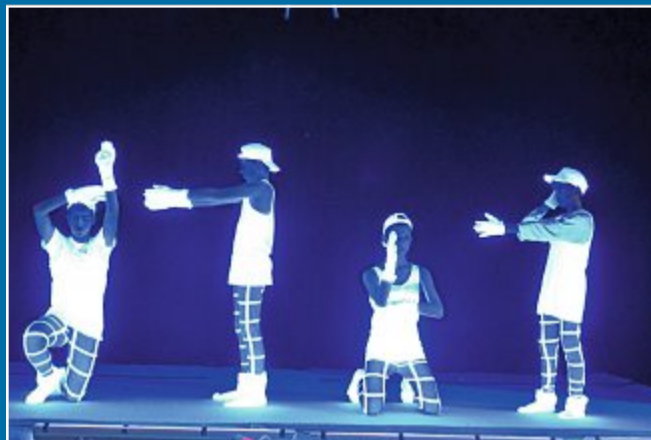
PROJEKT Schwarzlichtshow in der Aula der KGS

6.12. Schüler bringen Licht in dunkle Jahreszeit