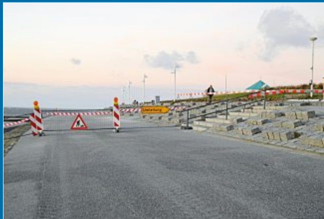
SANIERUNG Hohlräume müssen ausgefüllt werden

5.12. Deckwerk der Promenade wird repariert