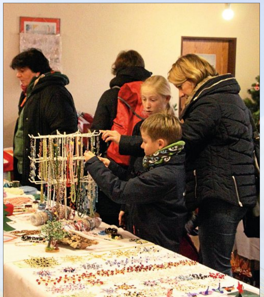
Groß und Klein sind der Einladung des Handarbeitsteams und des Weltladens in das Martin-Luther-Haus gefolgt, um den Kreativbasar zu besuchen. Die Besucher stöberten an den Ständen nach Dingen, die ihnen gefallen oder möglichen kleinen Weihnachtsgeschenken.