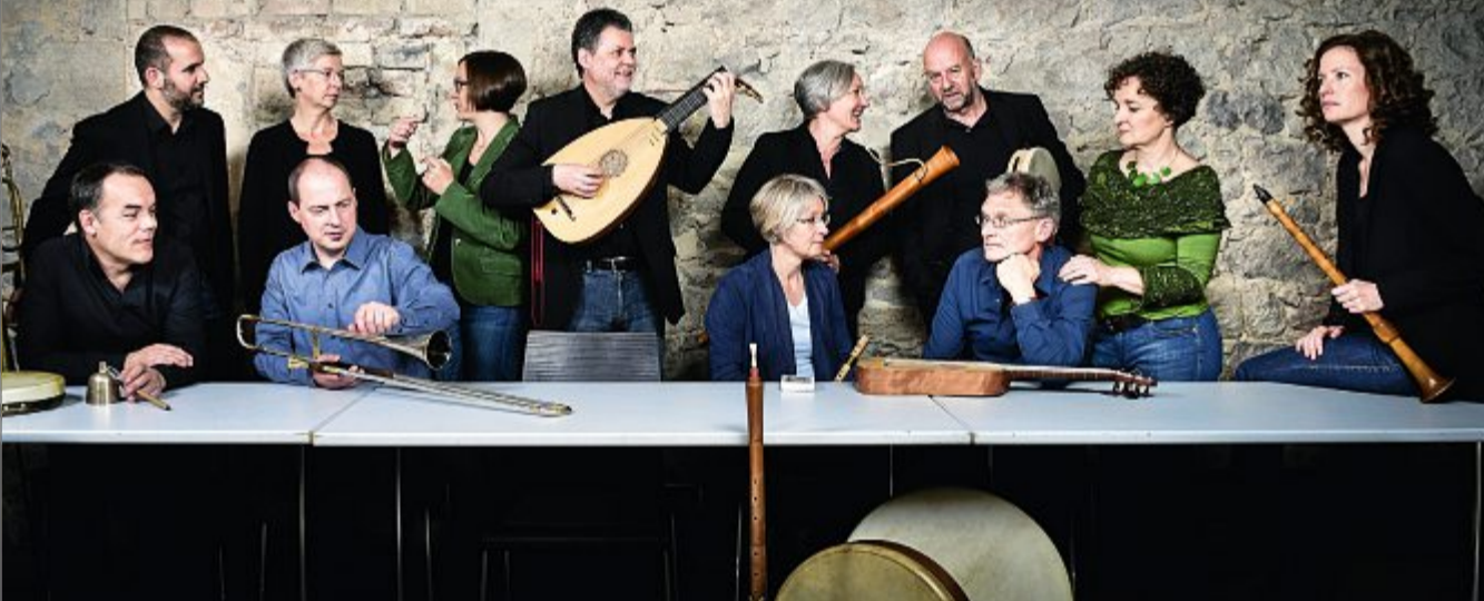
Konzert: So klingt Geschichte. Die Kantorei Norderney tritt zum Reformationsjubiläum gemeinsam mit Capella de la Torre am Sonntag, 10. Dezember, um 19.30 Uhr in der Inselkirche auf. Der Eintritt ist frei. Capella de la Torre hat sich bereits europaweit einen Namen für historische Aufführungspraxis gemacht.