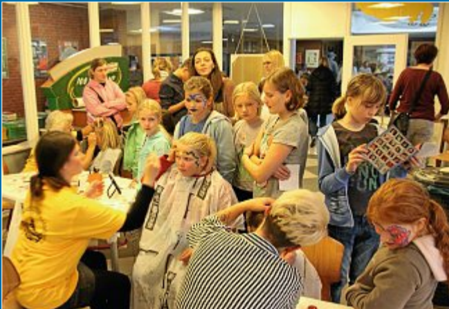
FEIER Drittes Herbstfest des Förderkreises Norderneyer Schulen

6.11. Mittelalterliches Treiben in der Schule