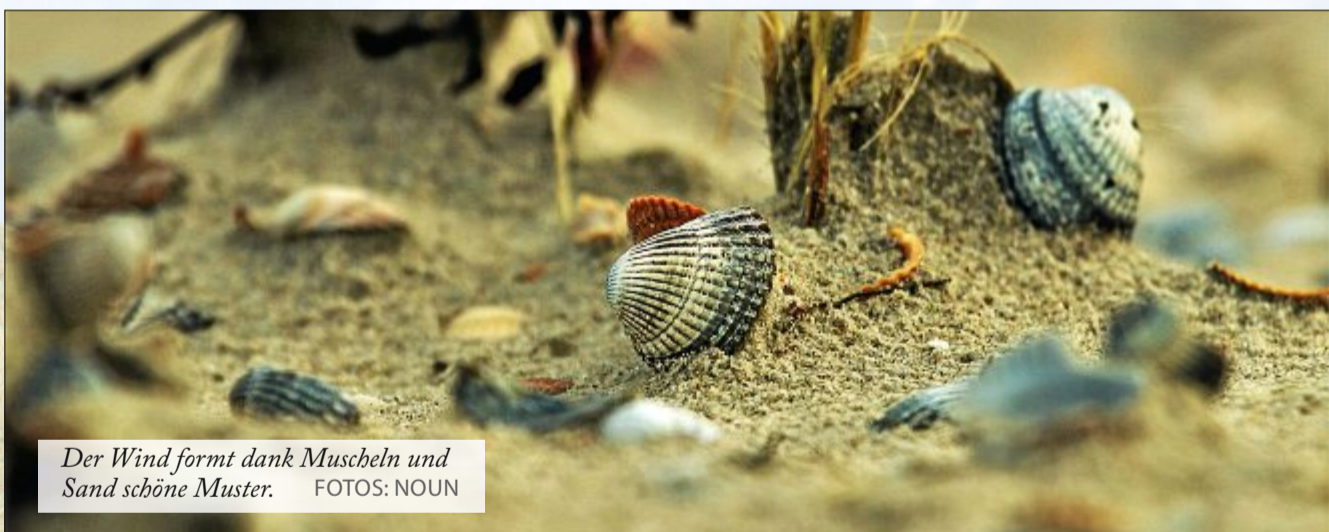
Der Wind formt dank Muscheln und Sand schöne Muster.