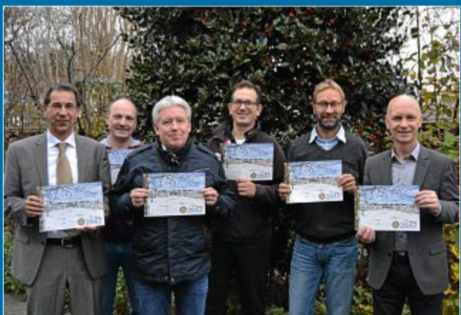
AKTION Der Verkauf hat begonnen