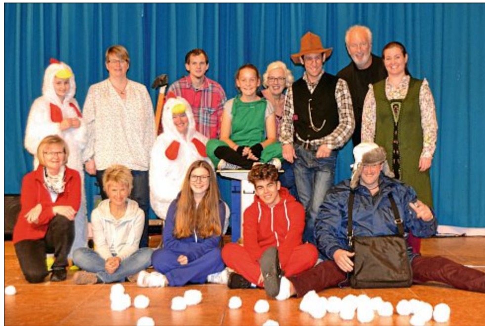
Noch sind Kostüme, Requisiten und Bühnenbild nicht vollzählig, das Ensemble des Laientheaters probt aber dennoch schon fleißig für die Aufführungen Ende November.

Von der Handlung wollen die Laienschauspieler aber noch nicht viel verraten. Nur, dass der alte Pettersson seinem Findus vom Weihnachtsmann erzählt hat, der daraufhin nur noch einen Wunsch hat: Der Weihnachtsmann soll auch zu ihm kommen. Klar, dass Pettersson alles dransetzt, um seinen Kater nicht zu enttäuschen. Was genau er plant und wie am Ende doch wieder alles anders kommt als gedacht, das kann man am letzten Novemberwochenende im Kurtheater