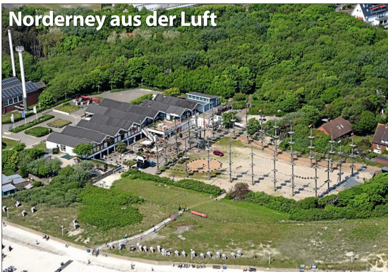
Die Bestellnummer lautet: Norderney Kurier 845