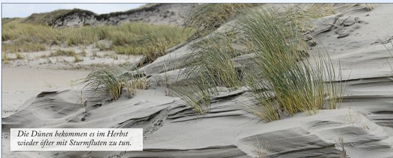
Die Dünen bekommen es im Herbst wieder öfter mit Sturmfluten zu tun.