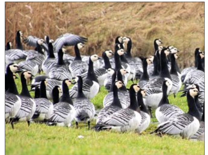
Weißwangengänsen sind standorttreu und kehren daher immer zu ihren angestammten Nistplätzen zurück.

fallen. Sie landen meistens im Wasser und werden dort von ihren Eltern versorgt. Damit sind sie vor Raubtieren, unter anderem dem Polarfuchs, geschützt.