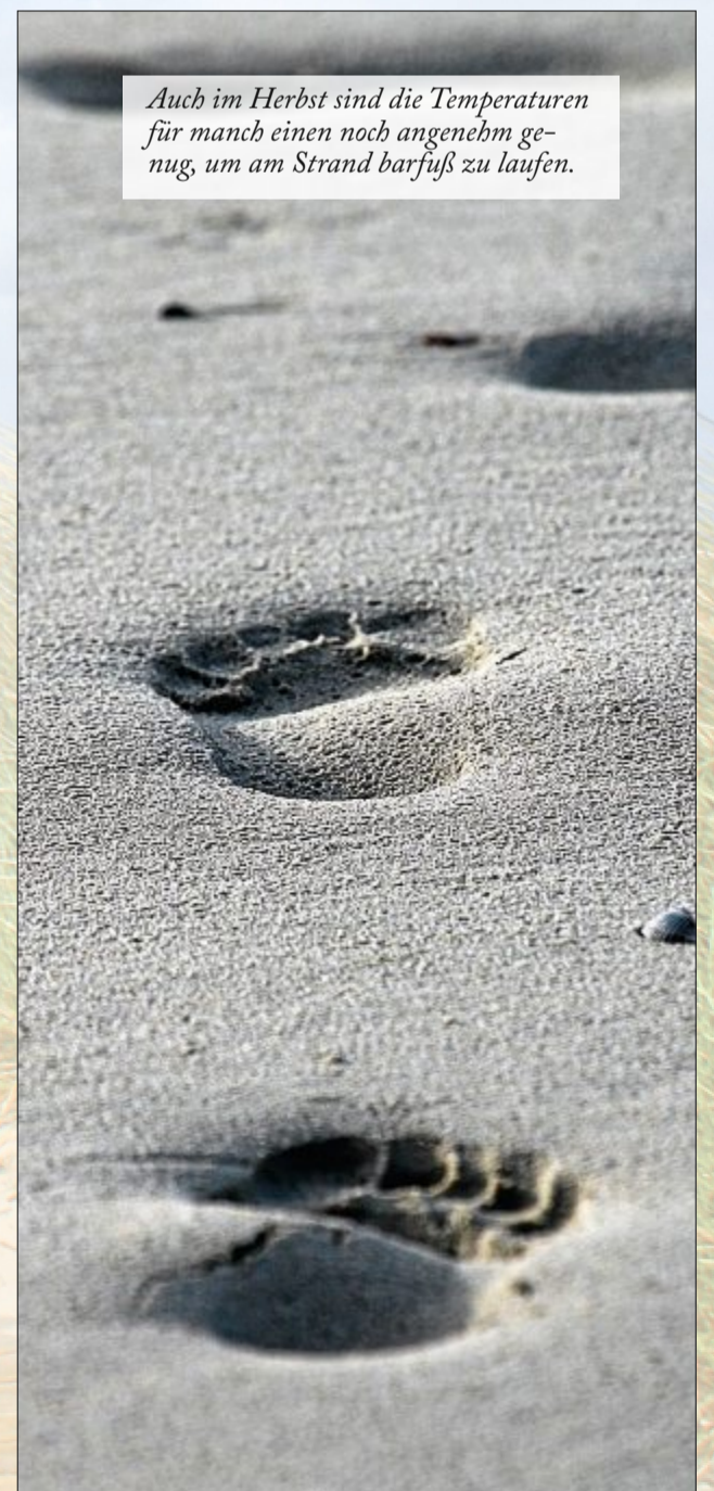
Auch im Herbst sind die Temperaturen für manch einen noch angenehm genug, um am Strand barfuß zu laufen.