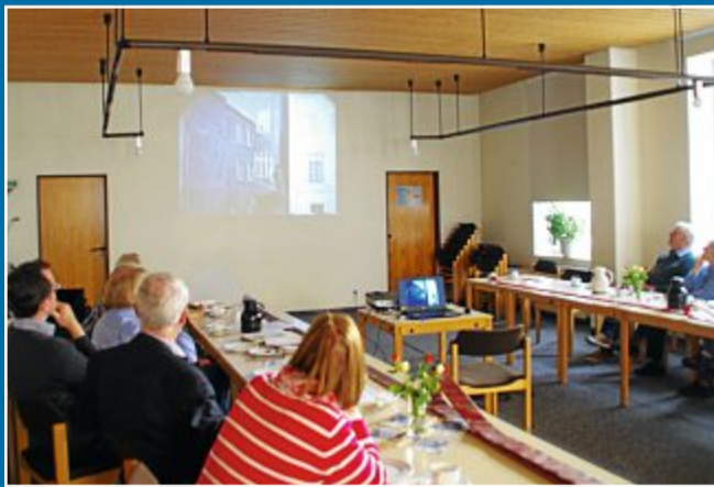
GESCHICHTE Erzählcafé im Martin-Luther-Haus

8.11. Auch der Kurplatz stand unter Wasser