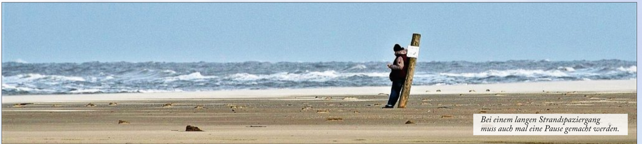
Bei einem langen Strandspaziergang muss auch mal eine Pause gemacht werden.