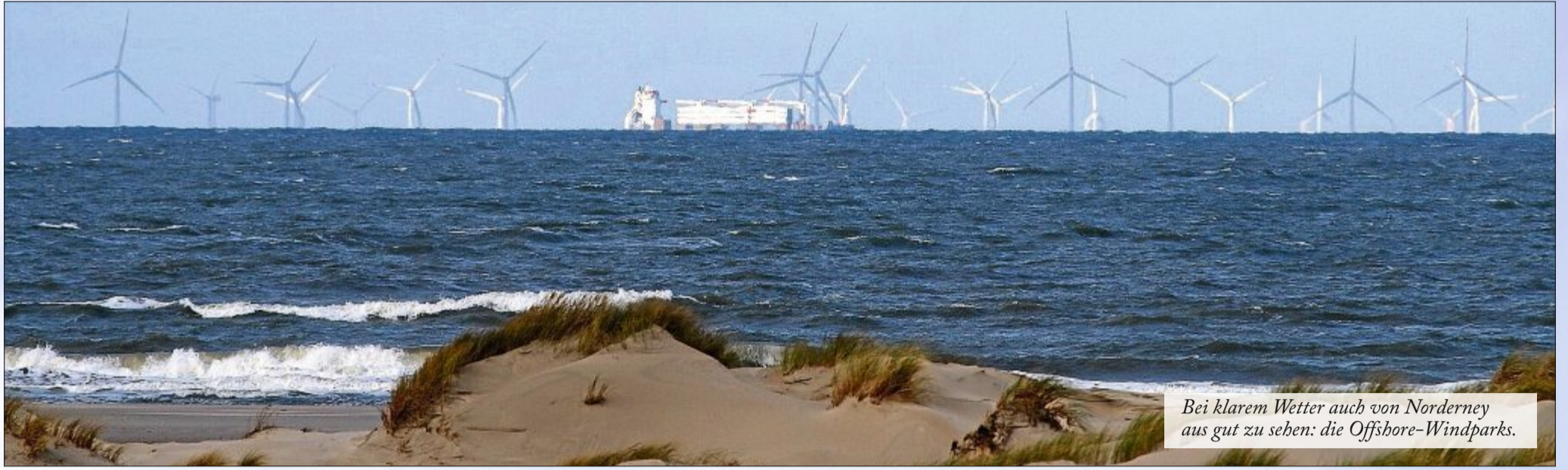
Bei klarem Wetter auch von Norderney aus gut zu sehen: die Offshore-Windparks.