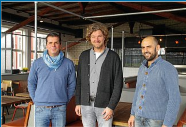
MEIEREI Restaurant, Teestube und Kontor sollen nach und nach eröffnen

7.11. Witzige Details und industrieller Charme