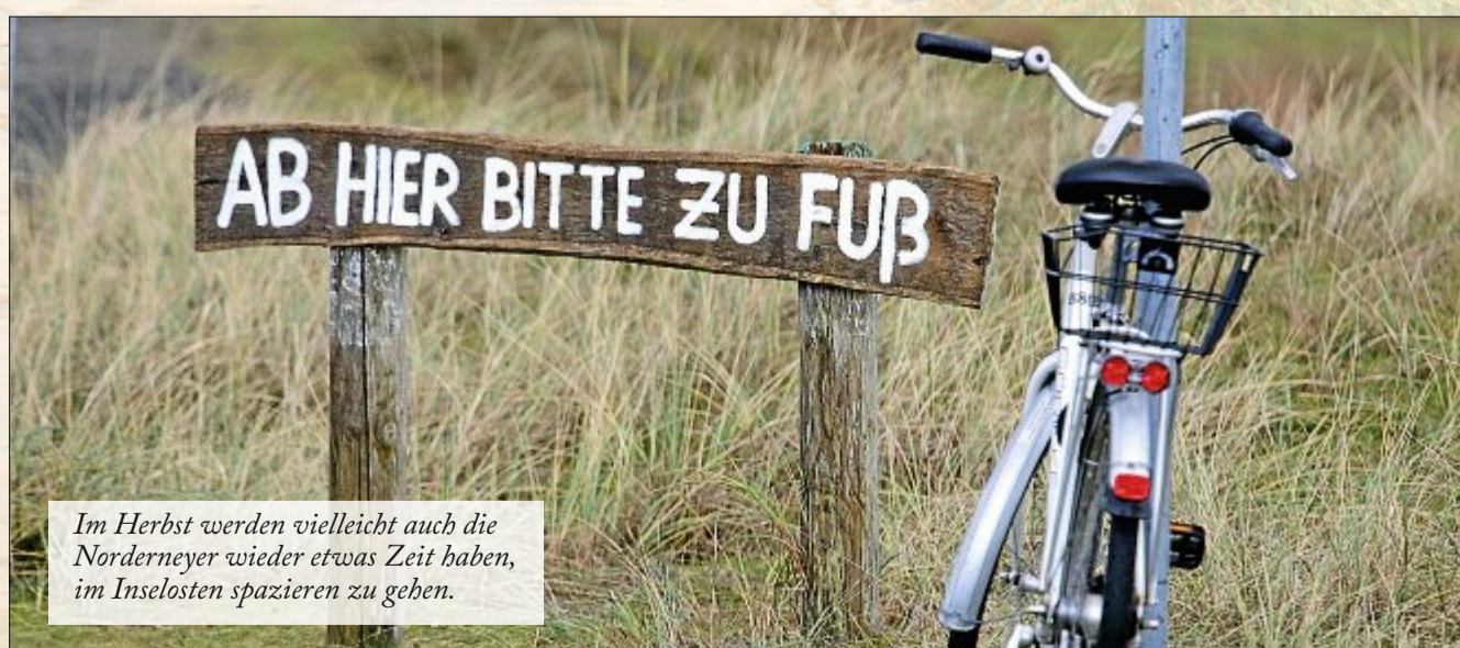
Im Herbst werden vielleicht auch die Norderneyer wieder etwas Zeit haben, im Inselosten spazieren zu gehen.