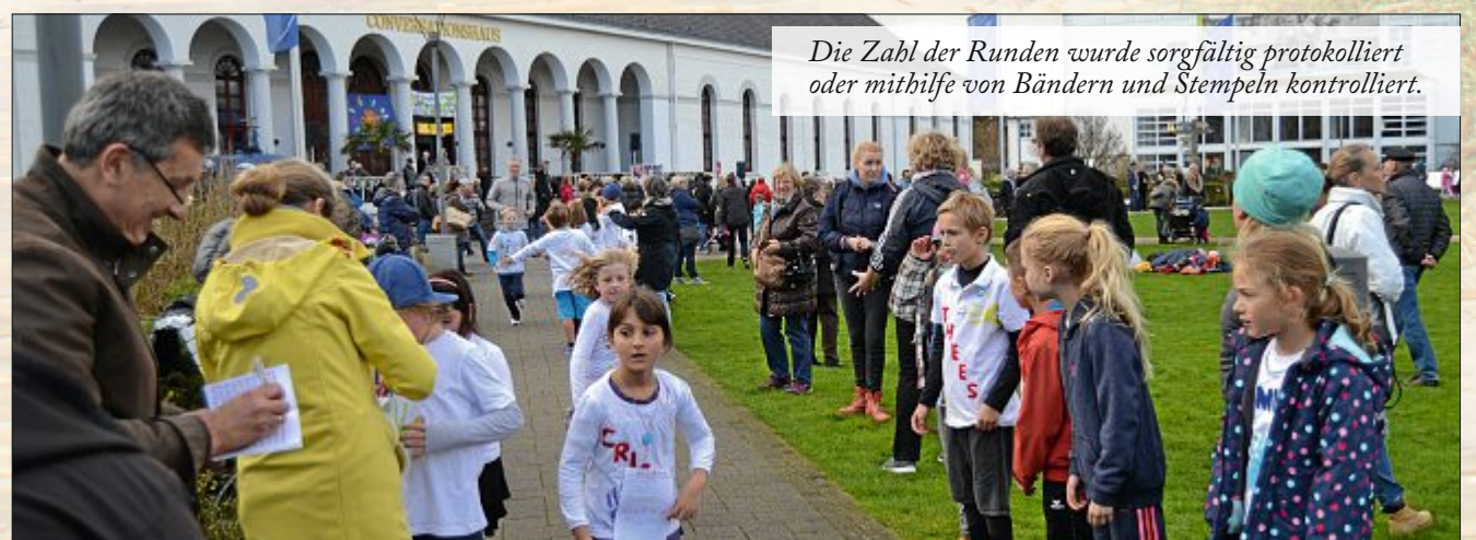
Die Zahl der Runden wurde sorgfältig protokolliert oder mithilfe von Bändern und Stempeln kontrolliert.