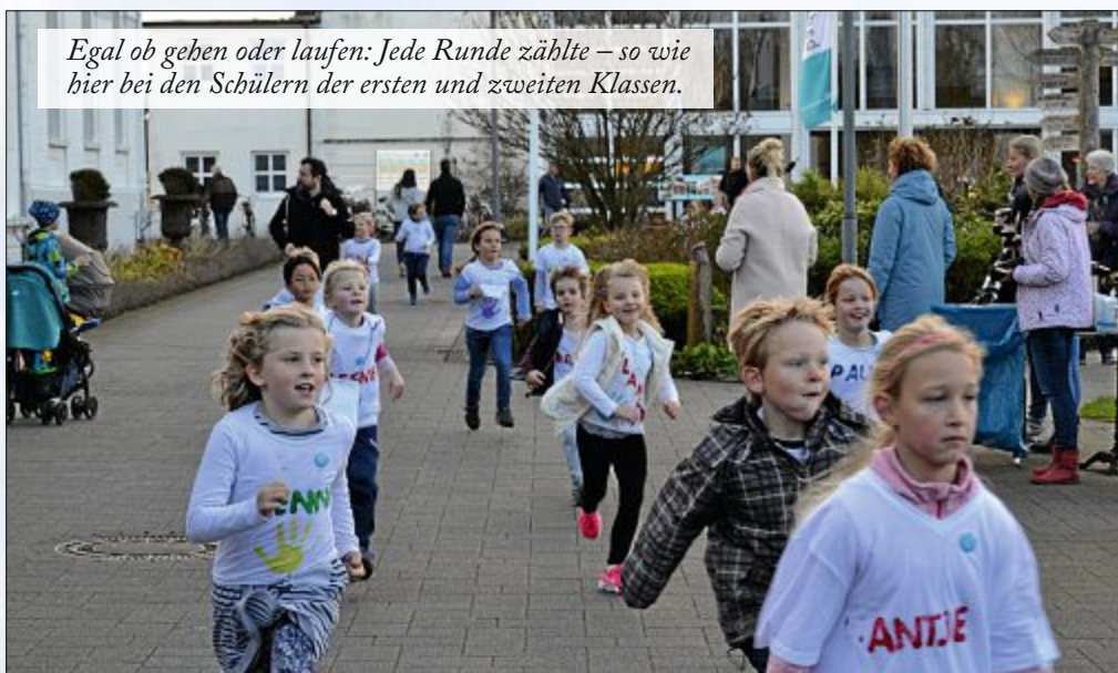
Egal ob gehen oder laufen: Jede Runde zählte – so wie hier bei den Schülern der ersten und zweiten Klassen.