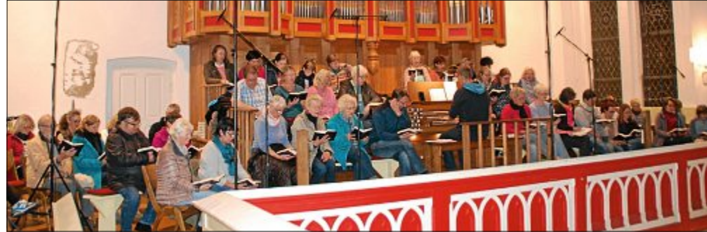
Zwei Stunden konzentriertes Arbeiten: Für die Aufnahme der acht Choräle mussten die Sänger jede Strophe mindestens zweimal singen, bis der Tontechniker zufrieden war.

Die Kirchengemeinde hatte die Idee, diese halbe Stunde auch für den Hausgebrauch zugänglich zu machen. Etwa 60 Einwohner und Gäste folgten der Einladung zum einstimmigen