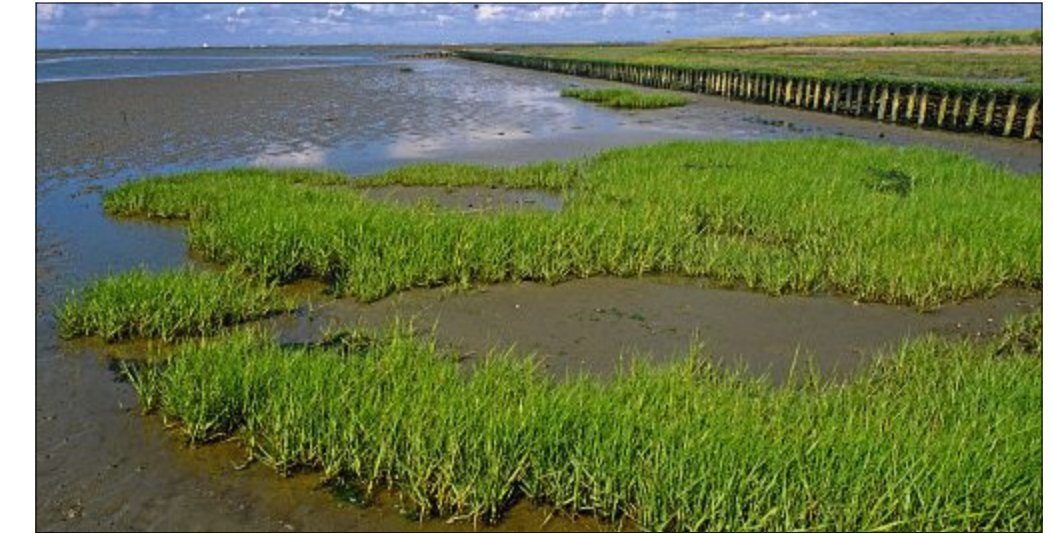
Eigentlich ist Seegras gar kein Gras, es sieht aber fast so aus.

Die Seegraswiesen bieten einen großen Lebensraum für viele verschiedene Tiere. Etliche Fischschwärme nutzen sie als Laichplatz und als Schutz vor Feinden. Wenn gerade Ebbe ist, fressen Ringel-