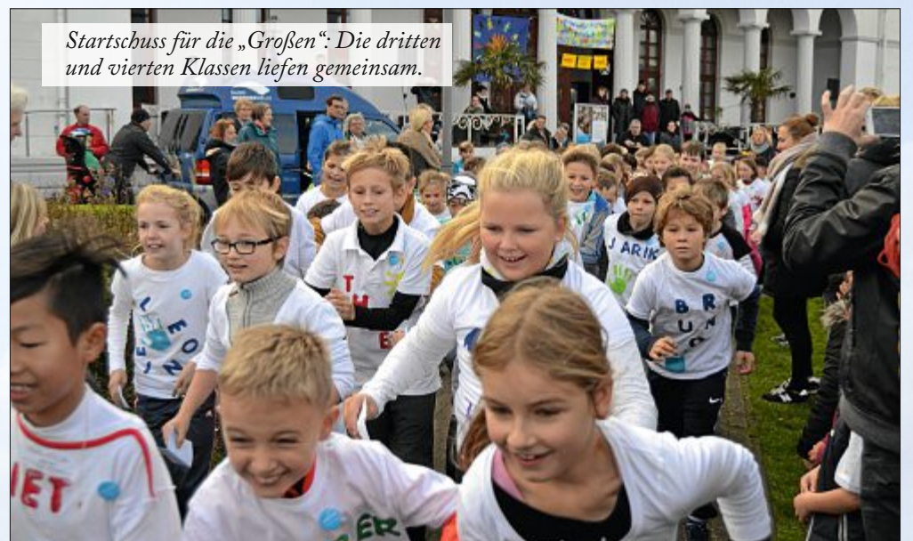
Startschuss für die „Großen“: Die dritten und vierten Klassen liefen gemeinsam.