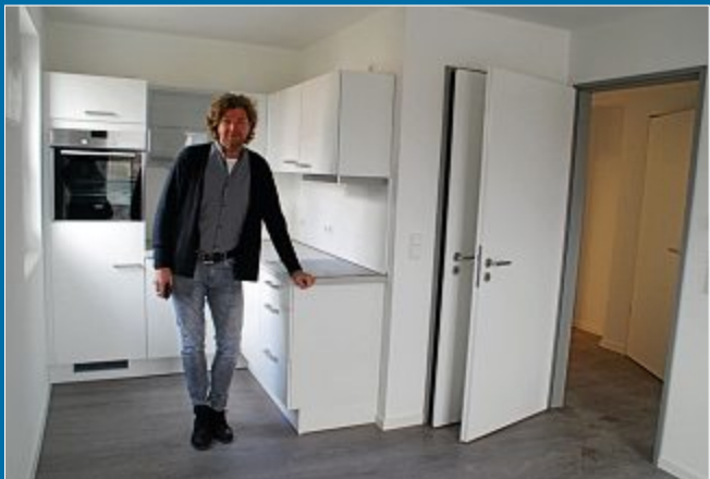
BAU Das Personalwohnhaus am Wasserturm ist fast fertiggestellt

30.10. Vernünftig wohnen und sich wohlfühlen