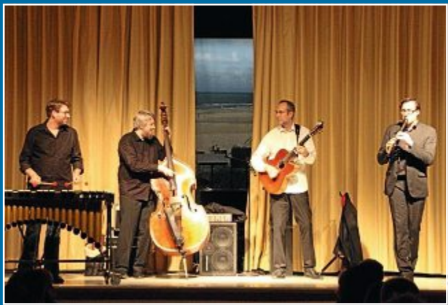
KONZERT Trio „Wildes Holz“ lässt die Instrumente tanzen