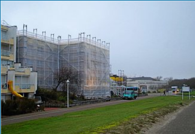
BAU Die Fassade des „Hus up Düm“ der Awo wird saniert

28.10. „Um das schöne Straßenbild zu ergänzen“