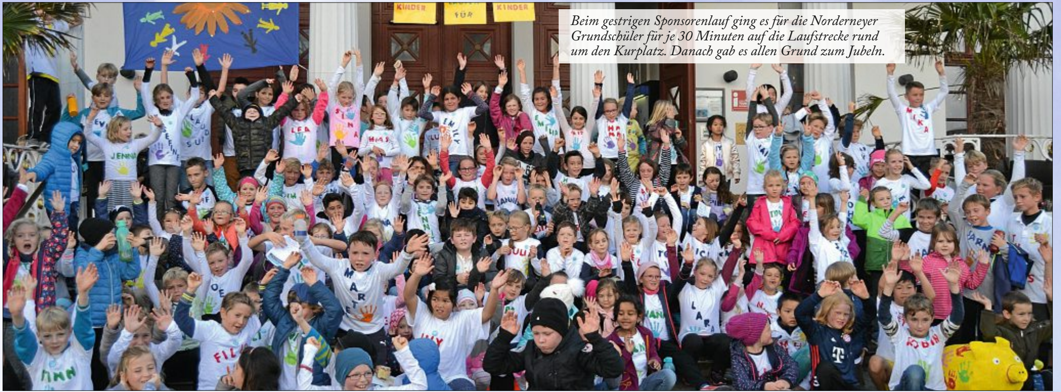
Beim gestrigen Sponsorenlauf ging es für die Norderneyer Grundschüler für je 30 Minuten auf die Laufstrecke rund um den Kurplatz. Danach gab es allen Grund zum Jubeln.