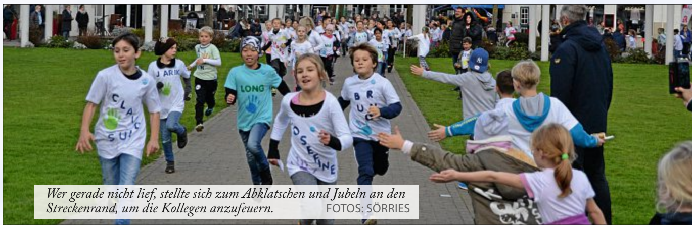
Wer gerade nicht lief, stellte sich zum Abklatschen und Jubeln an den Streckenrand, um die Kollegen anzufeuern.