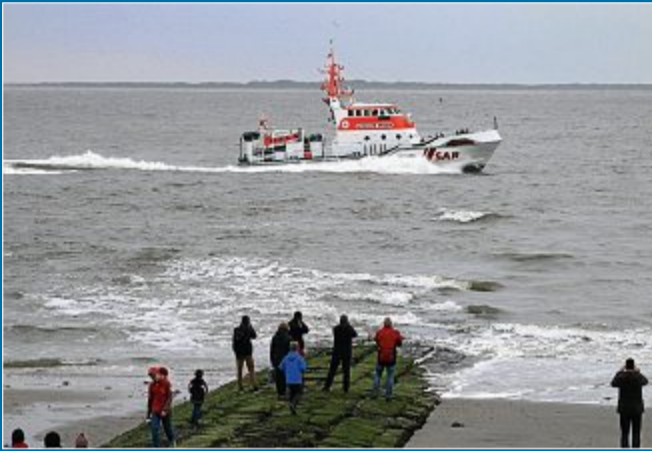
RETTUNG Crews von Seenotrettern und Behördenschiffen retten Segler

16.10. Einsatz vor Baltrum für die „Bernhard Gruben“