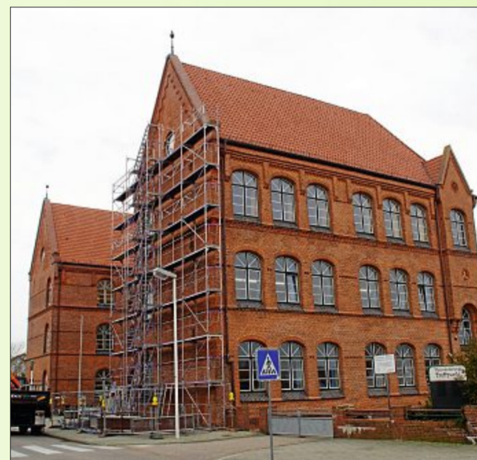
An der Grundschule Norderney ist derzeit eine Nordwand eingestüst, damit der Giebel gesichert werden kann.