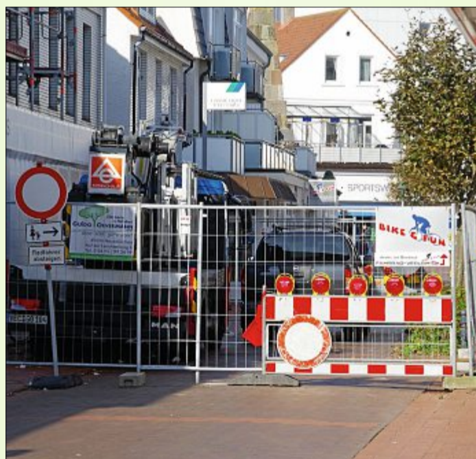
Im Herrenpfad werden Bauarbeiten durchgeführt, und die Straße ist noch bis zum 14. Mai 2018 voll gesperrt.