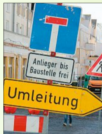
Einige Straßen sind teilweise gesperrt. ARCHIVBILD

der Georgstraße 5. Die Stadt rechnet außerdem mit folgenden neuen Baumaßnahmen: Die Wohnungsgenossenschaft baut ein Mehrfamilienhaus auf den Grundstücken An der Mühle 7a und 7b. Zudem