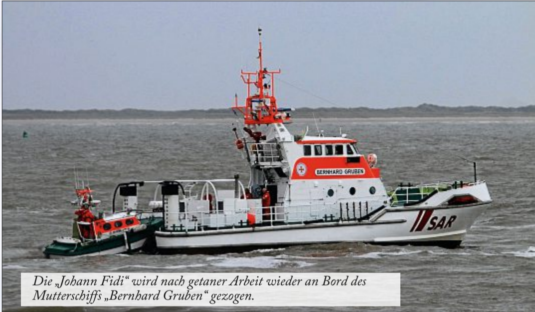
Die „Johann Fidi“ wird nach getaner Arbeit wieder an Bord des Mutterschiffs „Bernhard Gruben“ gezogen.