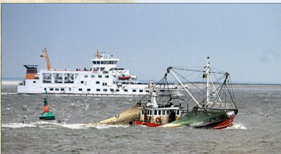
Von Möwen umflogen wird der Krabbenkutter aus Greetsiel, während die „Frisia I“ die Passagiere aufs Festland bringt.