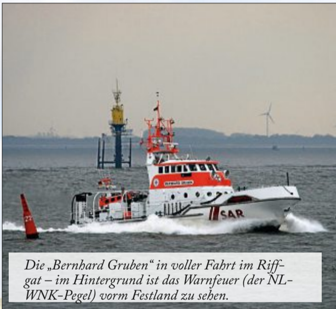
Die „Bernhard Gruben“ in voller Fahrt im Riffgat – im Hintergrund ist das Warnfeuer (der NL-WNK-Pegel) vorm Festland zu sehen.