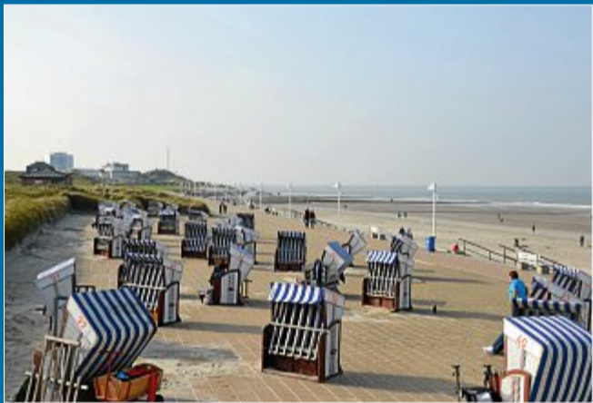
PFLEGE Preise für Schlaf- und Strandkörbe werden erhöht

17.10. Strandkörbe werden abtransportiert