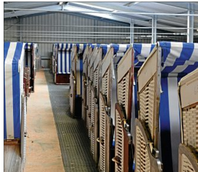
Die Strandkörbe werden bis zum Frühjahr nächsten Jahres in der Halle im Gewerbegebiet eingelagert und gegebenenfalls repariert.

zehn Euro pro Tag erhoben. Auch die Übernachtung im Korb wird teurer: Pro Nacht kostet es im kommenden Jahr 79 Euro, wer den Schlafkorb einen Tag von 11 Uhr bis am nächsten Morgen um 10 Uhr nutzen möchte, zahlt 95 Euro. Die Bettenkörbe für zwei Personen werden vom 13. April bis 9. September 2018 zur Vermietung bereitstehen. Die Herbstferien der Nordrhein-Westfalen in diesem Jahr enden erst am 4. November. Einige Körbe stehen für die Herbstgäste noch bis zum 26. Oktober auf der Promenade und auf den Wiesen bereit.