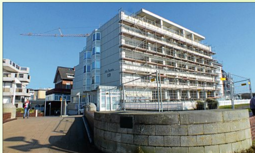
Die Alte Teestube an der Viktoriastraße wird äußerlich verändert. Die Fassade wird erneuert und soll für ein einheitliches und helles Erscheinungsbild sorgen.

Diverse Bauvorhaben wurden bereits in der letzten Saison begonnen, lagen während des Sommers still und werden jetzt fortgeführt. Dazu gehören zum Beispiel Bauten in der Winterstraße 19, im Herrenpfad 20, in der Jann-Berghaus-Straße 11 und beim Marienheim in