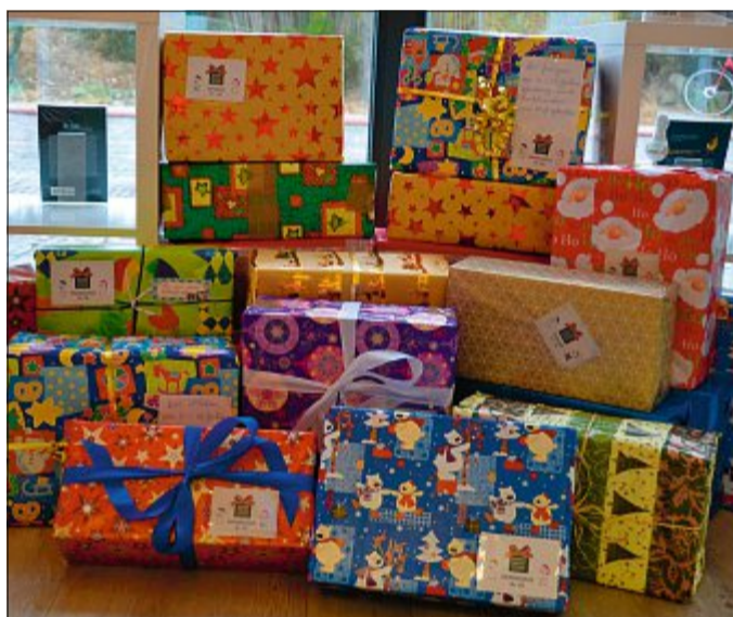
Viele liebevoll verpackte und mit tollen Gaben gefüllte Pakete werden auch in diesem Jahr verschickt. ARCHIVFOTO

Die Päckchen sollten klar gekennzeichnet werden. Hierbei gibt es drei Kategorien: Kindergartenkinder (drei bis sechs Jahre), Grundschulkinder (sechs bis zehn Jahre) und Teenager (elf bis 15 Jahre); jeweils für Jungen oder Mädchen oder aber neutral, damit die Helfer vor Ort variieren können. Aus Erfahrung weiß Bodenstab, dass in der Regel eher die jüngeren Kinder bedacht werden. Sie selbst packt daher immer vier neutrale Geschenke für Jugendliche.