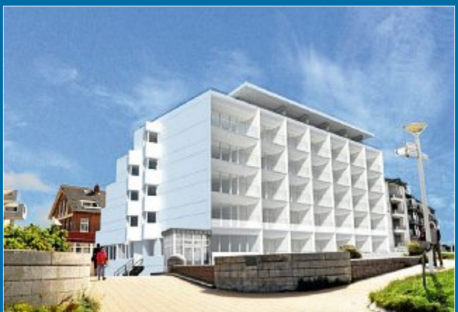
BAUEN Das 1972 errichtete Gebäude wird von außen umfassend saniert