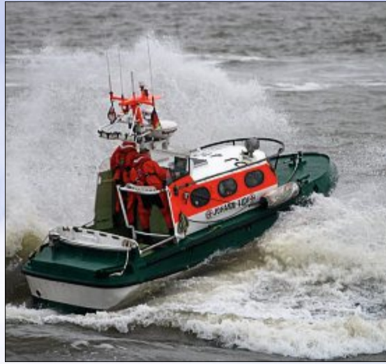
Zum vorletzten Mal konnten die Ehrenamtlichen am Sonnabend das Können des Kreuzers „Bernhard Gruben“ und des Tochterboots „Johann Fidi“ (Fotos oben) bei einem Werbetag der Deutschen Gesellschaft zur Rettung Schiffbrüchiger vorführen. Der Kreuzer (unten) wird Ende des Jahres durch die kleinere „Eugen“ ersetzt.