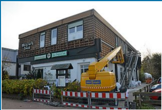
BAUEN Am 17. September verließen die letzten Gäste die Wohnungen

18.10. Haus Bergisch Land wird abgerissen