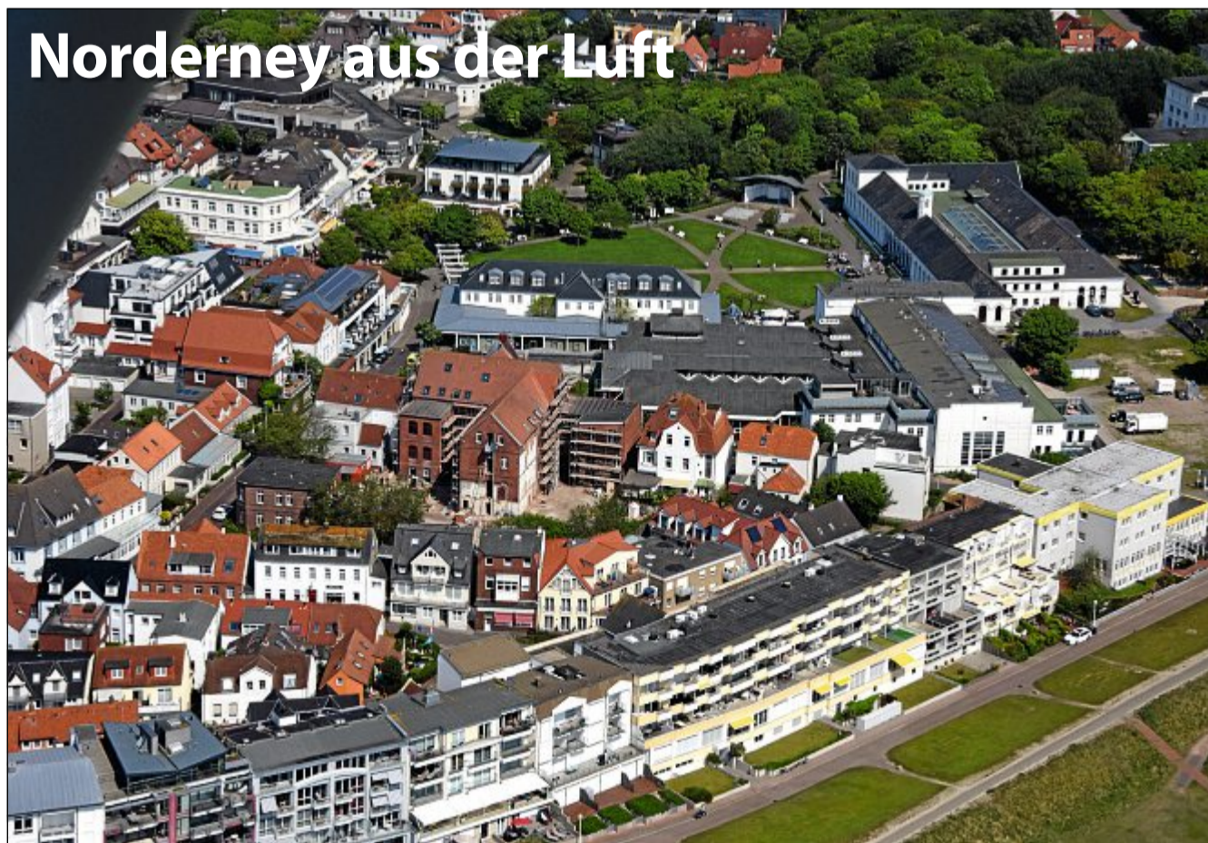
Die Bestellnummer lautet: Norderney Kurier 842