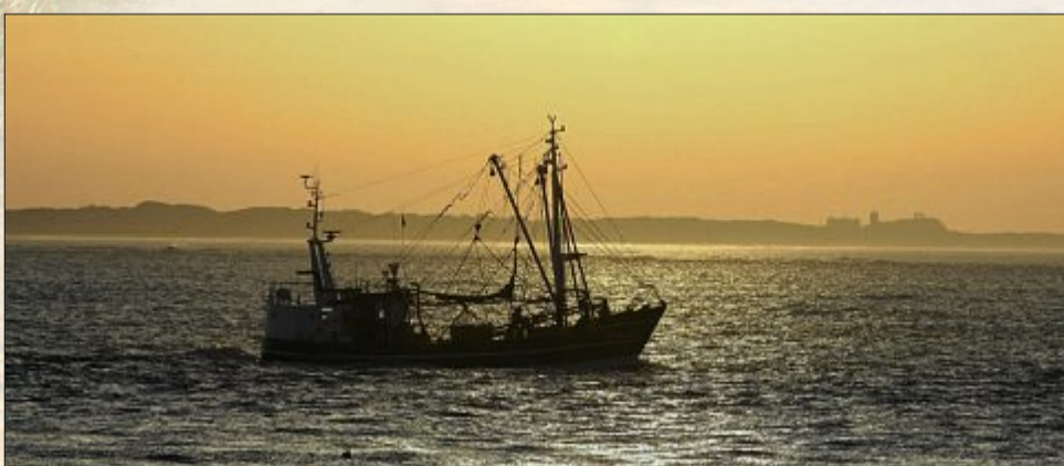
Als hätten sie sich für den Fotografen auf den Weg gemacht: Die Schiffe fahren am Sonntag vor malerischem Himmel und der Insel Juist in den Sonnenuntergang hinein.