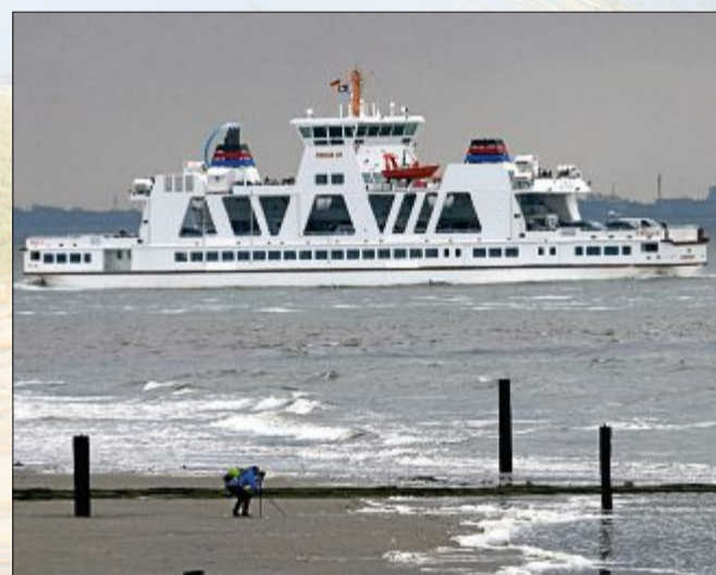
Die „Frisia III“ im Fahrwasser vor dem Weststrand auf dem Weg nach Norddeich.