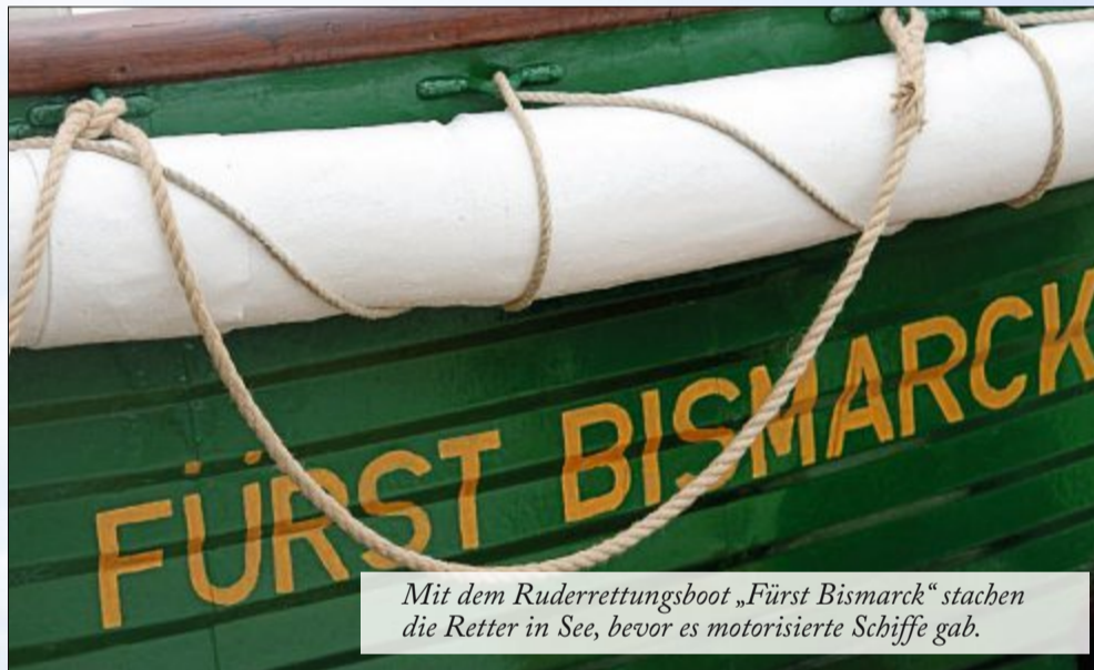
Mit dem Ruderrettungsboot „Fürst Bismarck“ stachen die Retter in See, bevor es motorisierte Schiffe gab.