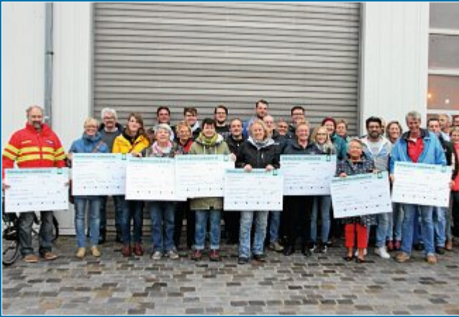
SPENDE Reinerlös des Musikfestes für Kinder- und Jugendarbeit

9.10. 5500 Euro für gemeinnützige Gruppen