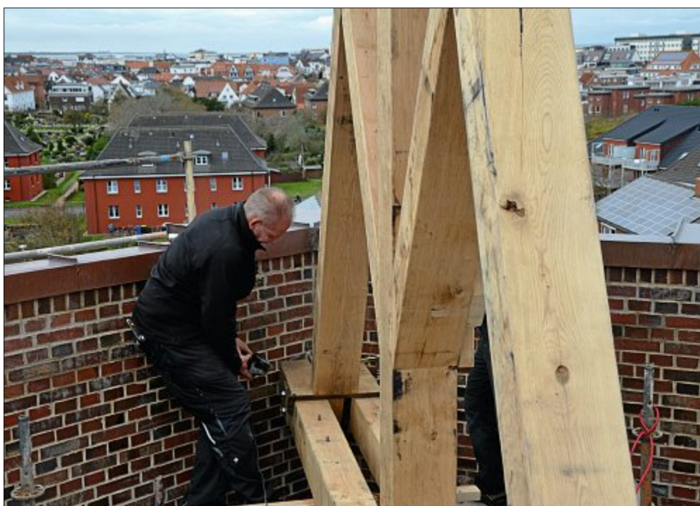
Mit dem Kranwagen wird das Toppzeichen aus Inneneichenholz auf das Kap gehievt. Oben angekommen wird eingepasst, an ein paar Stellen mit der Kreissäge bearbeitet, fixiert und verschraubt – damit es für die nächsten paar Jahrhunderte hält.