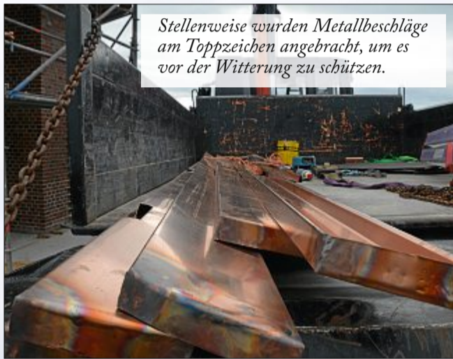
Stellenweise wurden Metallbeschläge am Toppzeichen angebracht, um es vor der Witterung zu schützen.