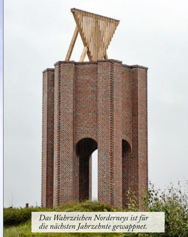
Das Wahrzeichen Norderneys ist für die nächsten Jahrzehnte gewappnet.