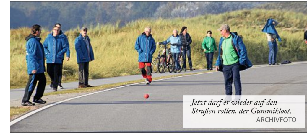
Jetzt darf er wieder auf den Straßen rollen, der Gummikloot.