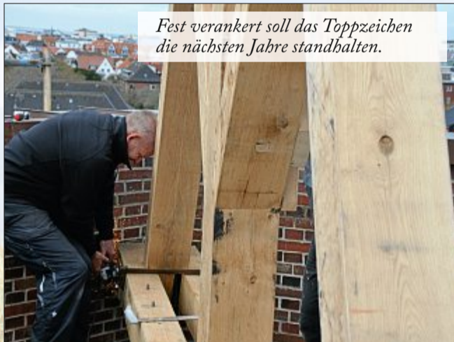
Fest verankert soll das Toppzeichen die nächsten Jahre standhalten.