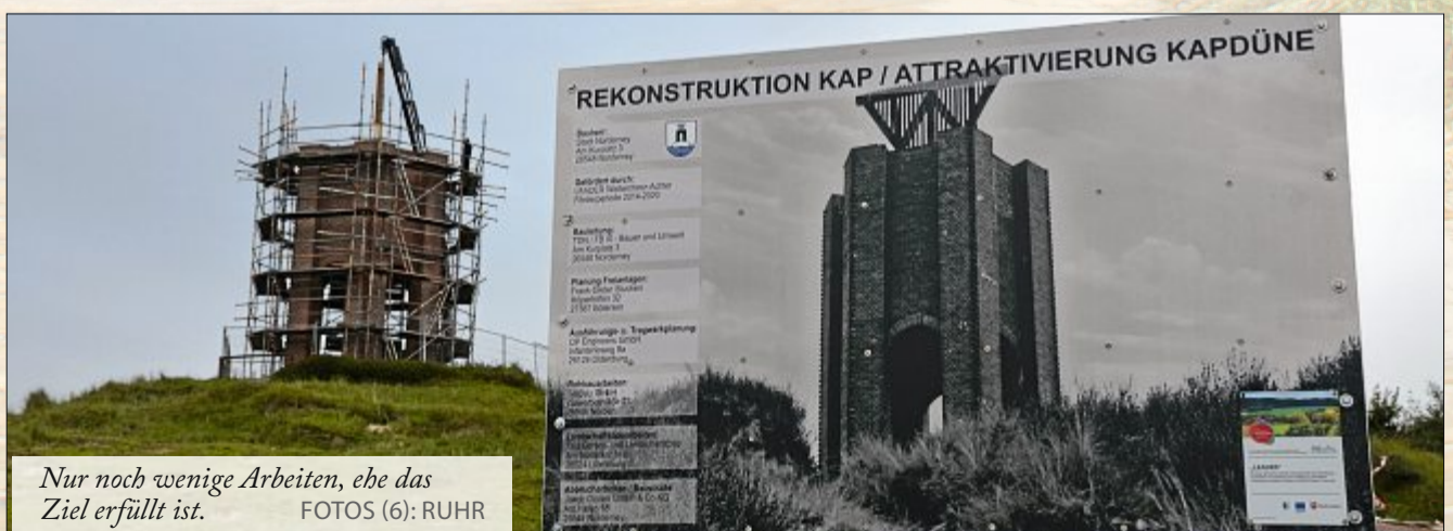
Nur noch wenige Arbeiten, ehe das Ziel erfüllt ist.