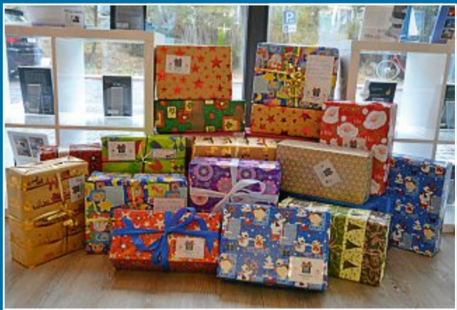
AKTION Geschenke für bedürftige Kinder werden gesammelt

11.10. Nicht nur an die eigene Familie denken