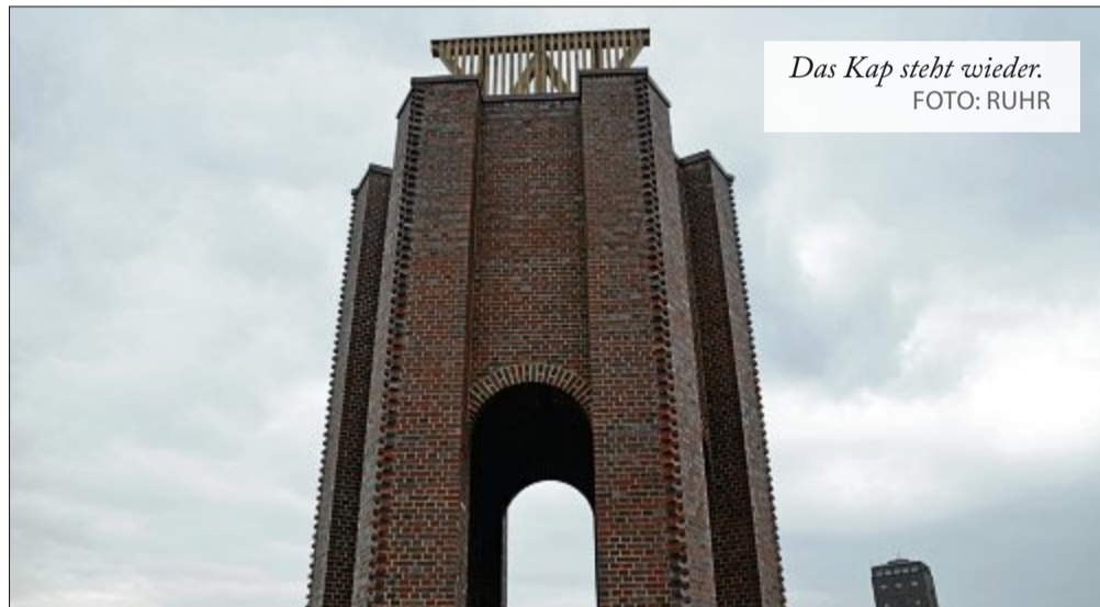
Das Kap steht wieder.

auf welcher Insel es steht. Die Holzkonstruktion von