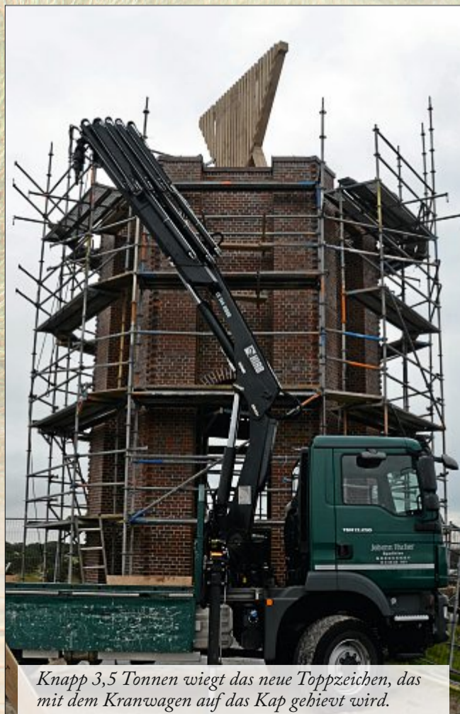
Knapp 3,5 Tonnen wiegt das neue Toppzeichen, das mit dem Kranwagen auf das Kap gebievt wird.