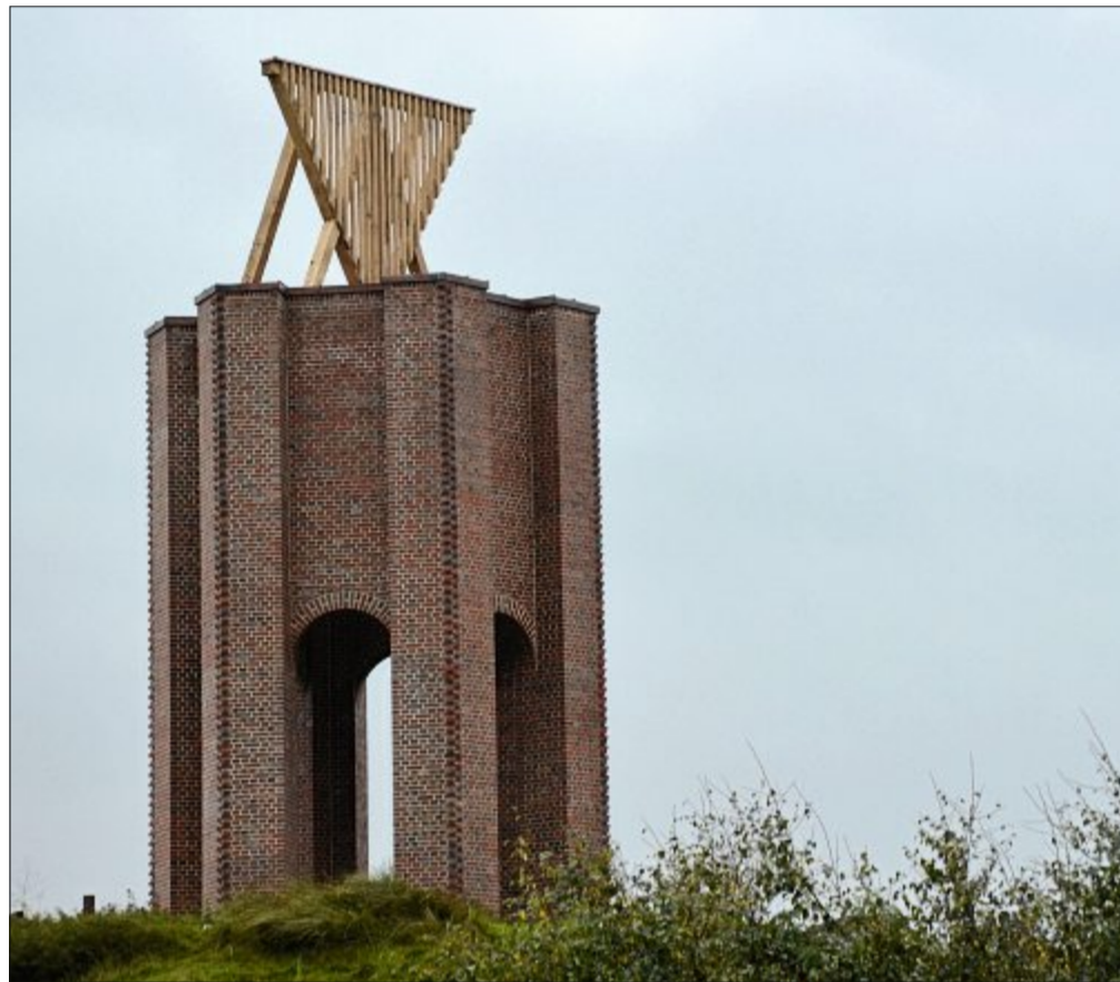
Da steht es wieder und strahlt fast in altem Glanz. Zwar hat das Kap nun seinen Denkmalstatus verloren, es ist aber noch immer eines der Norderneyer Wahrzeichen.