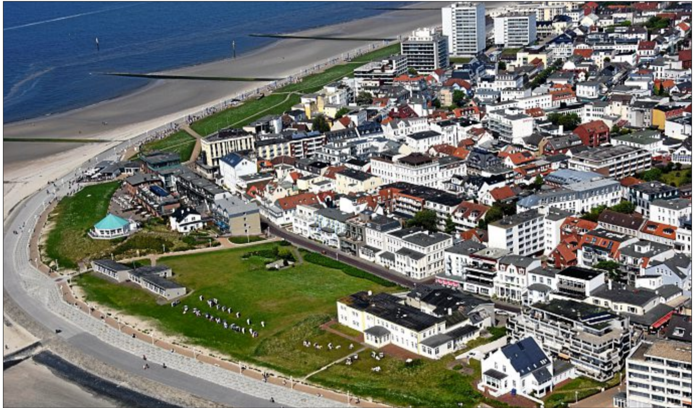
Der Westkopf der Insel Norderney auf einem Luftbild aus dem Mai dieses Jahres.