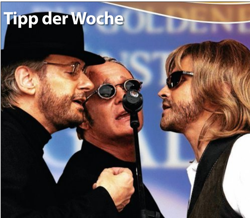
Konzert: Jive Talkin – The Portrait of the Bee Gees treten am Dienstag, 17. Oktober, um 20 Uhr im Kurtheater auf. Die Gruppe singt die Mega-Hits so original, dass man glaubt, die Bee Gees stünden leibhaftig auf der Bühne. Der Eintritt beträgt 18 bis 24 Euro.