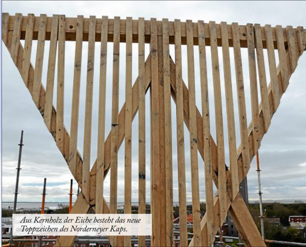
Aus Kernholz der Eiche besteht das neue Toppzeichen des Norderneyer Kaps.