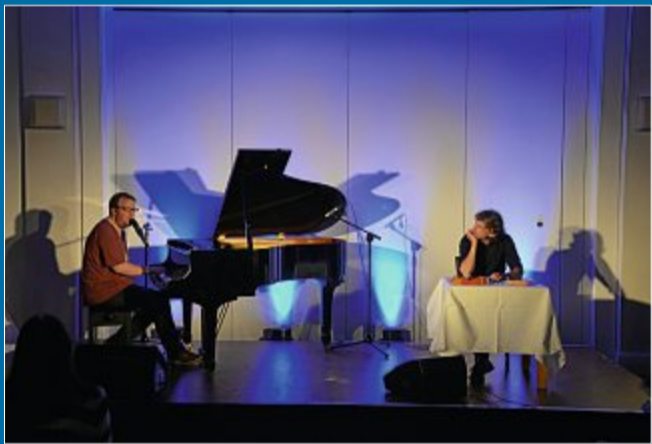
COMEDY Liebesgeschichten in a-Moll

10.10. Musik-Kabarett begeistert Zuschauer