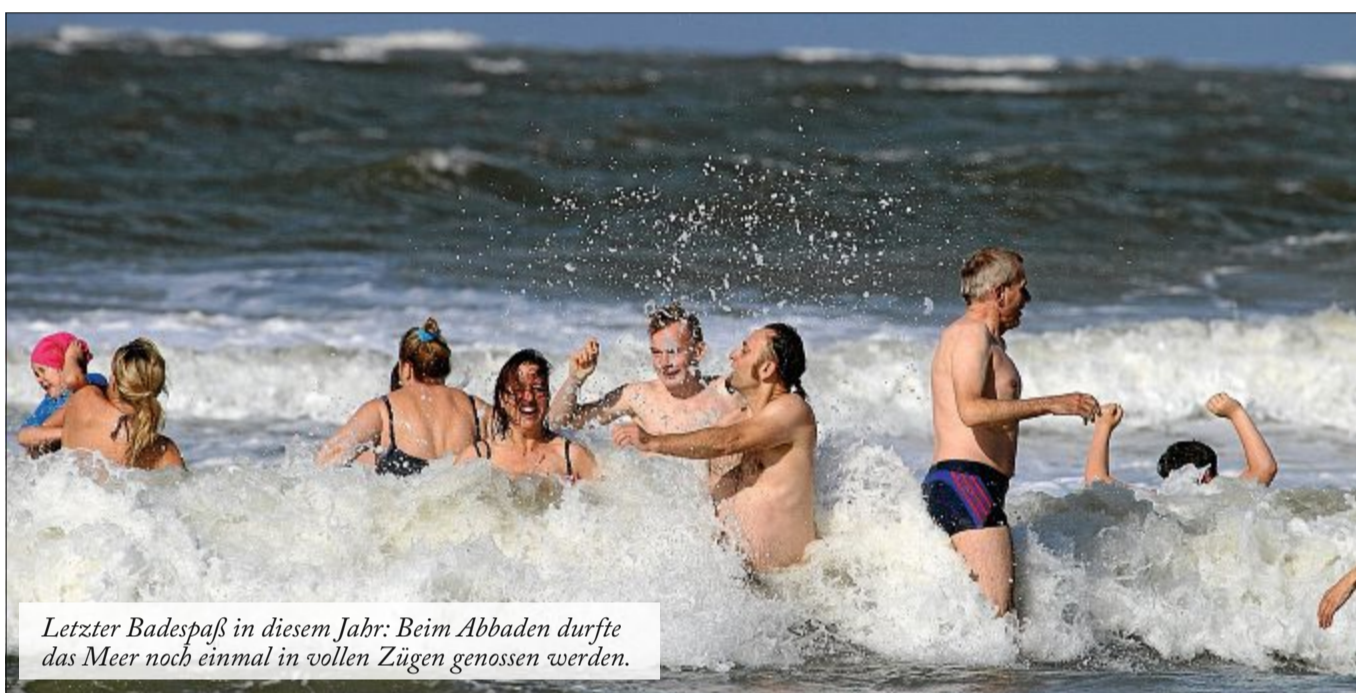
Letzter Badespaß in diesem Jahr: Beim Abbaden durfte das Meer noch einmal in vollen Zügen genossen werden.

Von schnell mal „reingeflitzt“ und gleich wieder raus bis hin zu ausgiebigem Baden war an diesem Tag alles vertreten. Auch die Herangehensweise an