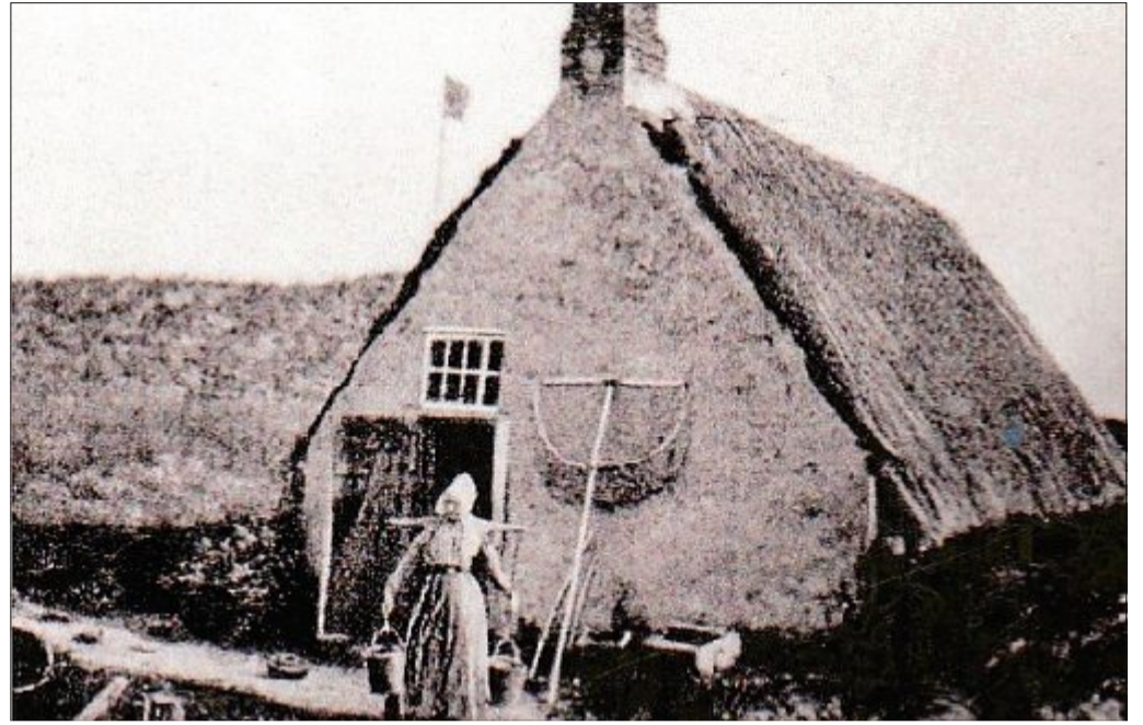
Nach der großen Dollart-Flut um 1430 siedelten sich die ersten Fischer mit ihren Frauen, die alle bäuerliche Kenntnisse besaßen, auf der Insel an. Ihr Kleinvieh brachten sie mit. Das Foto aus dem Heimatverein Baltrum zeigt ein Haus, wie es zu Beginn auf den Inseln stand. Als die ersten Siedler merkten, dass man hier leben kann, kamen Handwerker vom Festland und bauten feste Häuser für die Fischer, die ihren Fisch auf dem Festland verkauften. Das nötige Baumaterial brachten die Fischer auf der Rückfahrt vom Festland mit auf die Insel. Für die Dachkonstruktionen wurde auch Strandholz verwendet.

Trotz aller Schwarzseherei kann man auch positive Entwicklungen sehen. Kürzlich hat eine junge Norderneyer Familie ein Haus von einer Norderneyer Erbengemeinschaft erworben. Aus Dankbarkeit haben sie ihrem Haus jetzt den plattdeutschen Namen: „Huus an't Schkanz“ gegeben. Die Norderneyer Inselnatur war noch nie so grün, wie in heutiger Zeit. Einen großen Teil