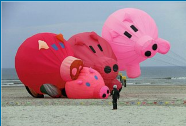
VERANSTALTUNG Drachenfest am Strand von Haus Detmold