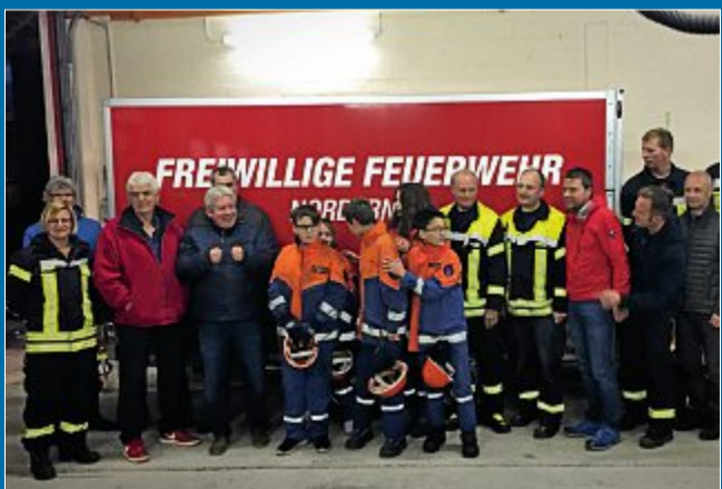
SPENDE Der Anschaffungswert liegt bei 5795 Euro

5.10. Rotary Club übergibt neuen Anhänger