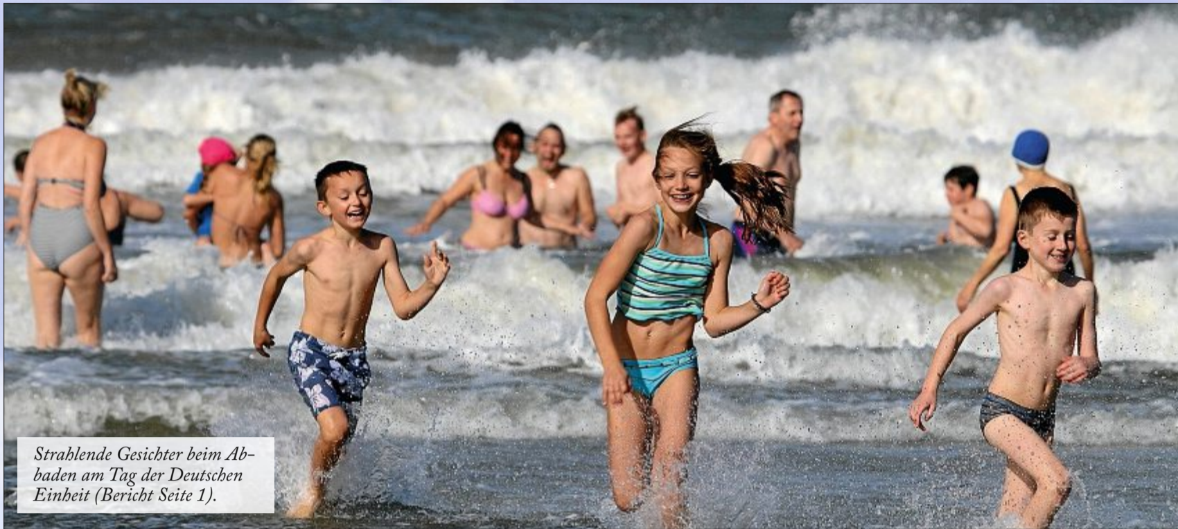
Strahlende Gesichter beim Abbaden am Tag der Deutschen Einheit (Bericht Seite 1).