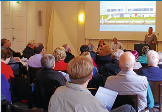
WIRTSCHAFT 80 Gäste bei Veranstaltung des dänischen Unternehmens

30.9. Dong Energy informiert Öffentlichkeit