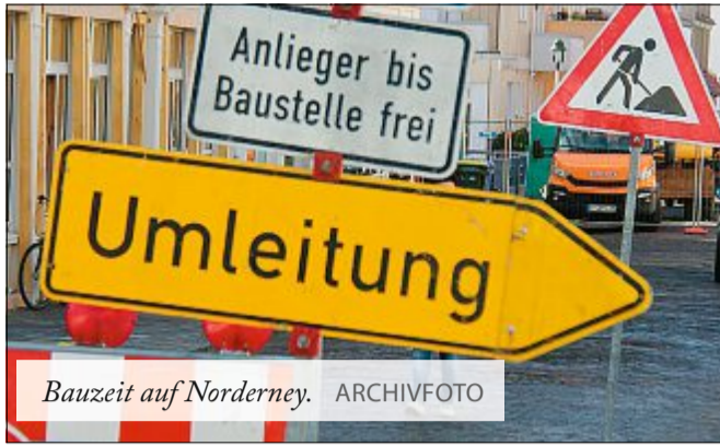
Bauzeit auf Norderney.

Bis zum 22. Dezember wird der Damenpfad zwischen Strandstraße und Kirchstraße halbseitig gesperrt. Eine Vollsperrung der Gartenstraße zwischen Mühlenstraße und An der Schanze erfordern die Bauarbeiten noch bis morgen.