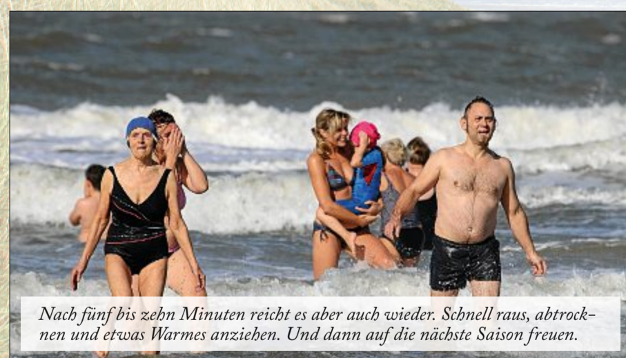
Nach fünf bis zehn Minuten reicht es aber auch wieder. Schnell raus, abtrocknen und etwas Warmes anziehen. Und dann auf die nächste Saison freuen.