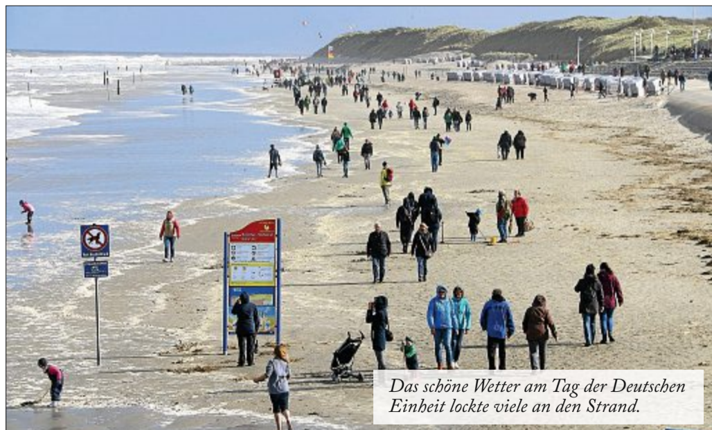
Das schöne Wetter am Tag der Deutschen Einheit lockte viele an den Strand.

Wie beim letzten Treffen bereits angekündigt, entfällt aus organisatorischen Gründen morgen das Erzählcafé der evangelisch-lutherischen Kirchengemeinde. Das nächste Treffen findet regulär am Sonnabend, 4. November, von 15 bis 17 Uhr statt. Passend zur stürmischen Jahreszeit soll es dann um das Thema „Sturmfluten“ gehen.