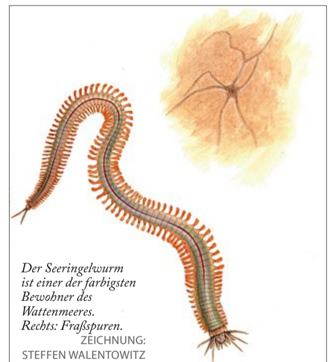
Der Seeringelwurm ist einer der farbigsten Bewohner des Wattenmeeres. Rechts: Fraßspuren. ZEICHNUNG: STEFFEN WALENTOWITZ