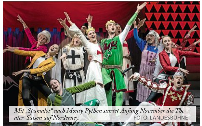
Mit „Spamalot“ nach Monty Python startet Anfang November die Theater-Saison auf Norderney.

„Yvonne, Prinzessin von Burgund“ führt die Landesbühne am Freitag, 23. März, auf. Das Stück des polnischen Dichters Witold Gombrowicz spielt auf amüsante Weise mit der Angst vor dem Fremden und Un-erwarteten.