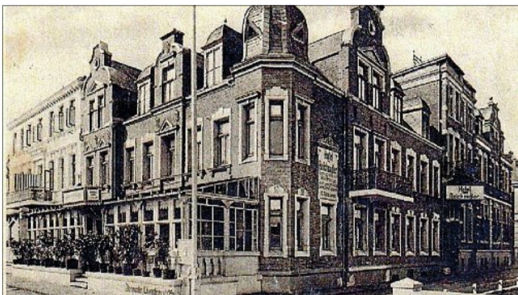
Das Bild zeigt das „Hotel zum Reichsadler“ in der Luisenstraße 12 nach dem Ersten Weltkrieg. In den Jahren der Inflation konnten die Hoteliers solcher Häuser aus Mangel an Gästen die laufenden Kosten und Abgaben nicht mehr erwirtschaften, zumal sie sehr personintensiv waren. Manche wurden zwangsversteigert. Die Norderneyer Gemeinde erwarb dieses Hotel und wandelte die Zimmer in Wohnungen um. 1927 waren im Adressbuch 19 Familien aufgeführt. Heute sind dort Eigentumswohnungen untergebracht.