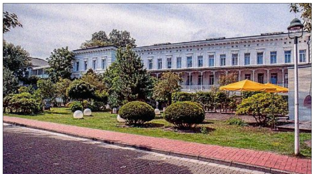
Ein großes Erholungsheim wird zu einer Nordseeklinik und schließlich zum Thalassohotel: Das „Hotel Bellevue“ an der damaligen Adresse Marienstraße 1 gehörte dem Gastwirt Christian Kluin. 1927 wurde es ein Erholungsheim, später betrieb die Familie Michels das Gebäude als Nordseeklinik. Heute betreibt Michels dort das Thalasso-Hotel. Das Bild zeigt den neu angelegten Kurpark an der Weststrandstraße. Dieses Haus gehört mit seiner 140-jährigen Geschichte zu den ältesten Hotels auf Norderney.