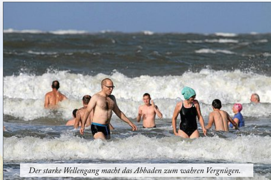
Der starke Wellengang macht das Abbaden zum wahren Vergnügen.