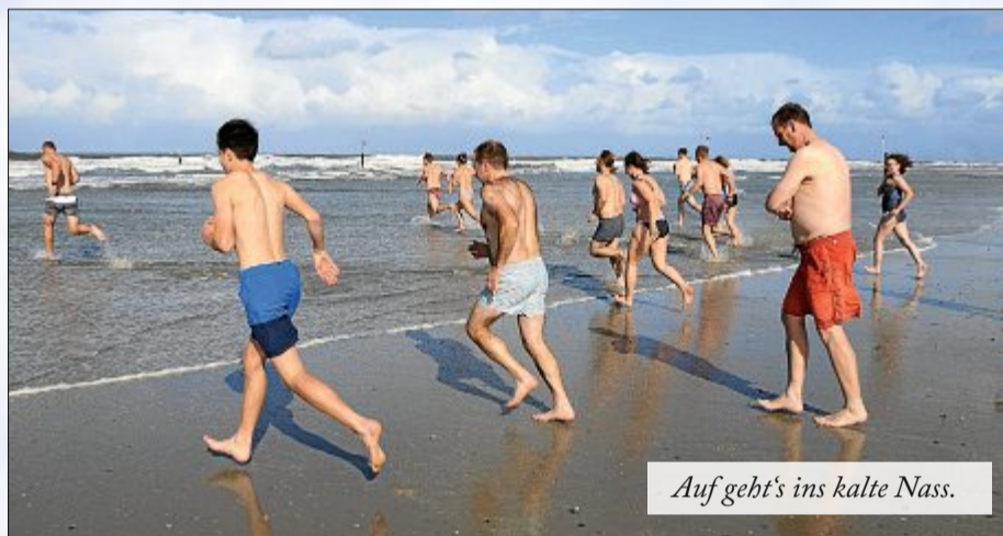
Auf geht's ins kalte Nass.