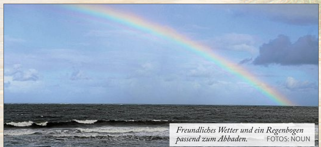
Freundliches Wetter und ein Regenbogen passend zum Abbaden.