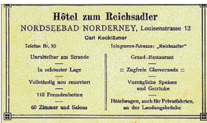
Mit 60 Zimmern und Salons und einer besten Lage unmittelbar am Strande warb das Hotel zum Reichsadler Anfang des 19. Jahrhunderts.