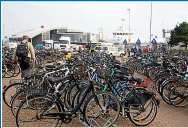
BAU Pläne für Fahrrad-Abstellplätze noch nicht konkret