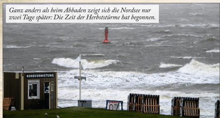
Ganz anders als beim Abbaden zeigt sich die Nordsee nur zwei Tage später: Die Zeit der Herbststürme hat begonnen.