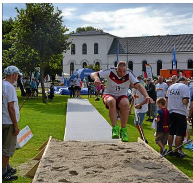
Letztes Jahr auf dem Kurplatz beim Inselduell.

Von 10 bis 13 Uhr können dann alle Einheimischen und Urlauber gemeinsam Punkte für „ihre“ Insel sammeln. Jede regelkonform abgelegte Sportabzeichen-Disziplin am Sportstrand auf Langeoog und auf dem Kurplatz auf Norderney zählt – egal ob im Weitsprung, Seilspringen, beim Medizinball-Werfen oder im Sprint. Live-Schalten zwischen den beiden Inseln informieren regelmäßig über die aktuellen Punktstände, die man auch über www.sportabzeichen.de abrufen kann. Im Wettkampf um