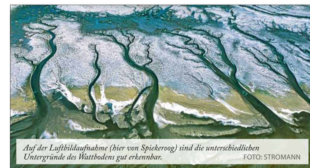
Auf der Luftbildaufnahme (hier von Spiekeroog) sind die unterschiedlichen Untergründe des Wattbodens gut erkennbar.

Schlickwatt findet sich an geschützten Stellen, zum Beispiel im Windschatten von Inseln oder an Stellen, wo die Strömungsgeschwindigkeit sehr gering ist, und hat eine glatte, glänzende Oberfläche. Das liegt am hohen Wasseranteil im Boden, der bei über 50 Prozent liegt! Dadurch gibt der Boden schneller