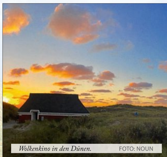
Wolkenkino in den Dünen.