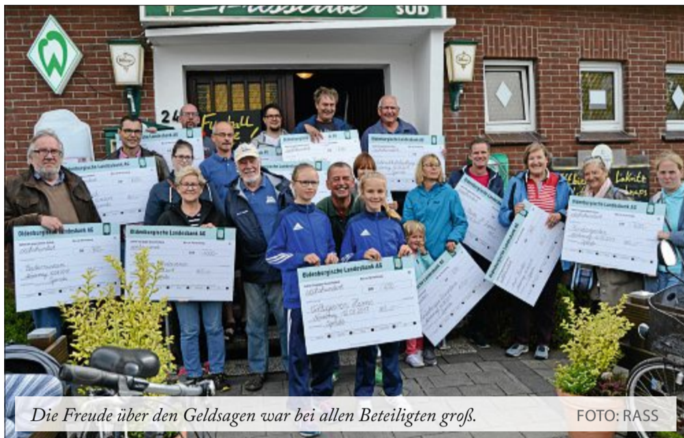
Die Freude über den Geldsagen war bei allen Beteiligten groß.

Vertreter von 14 Vereinen und Organisationen kamen zusammen, um ihre symbolischen Schecks entgegenzunehmen. Das Geld wurde folgendermaßen aufgeteilt: Das Kinderhospiz Löwenherz in Syke (600 Euro), die TuS-B-Jugend (300 Euro), Nabu-Ortsverein Norderney (400 Euro), die Mal- und Kreativschule (500 Euro),