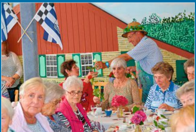
INSELLEBEN Teenachmittag der Awo besteht seit 40 Jahren

17.8. Für die Damen eine Rose zum Jubiläum