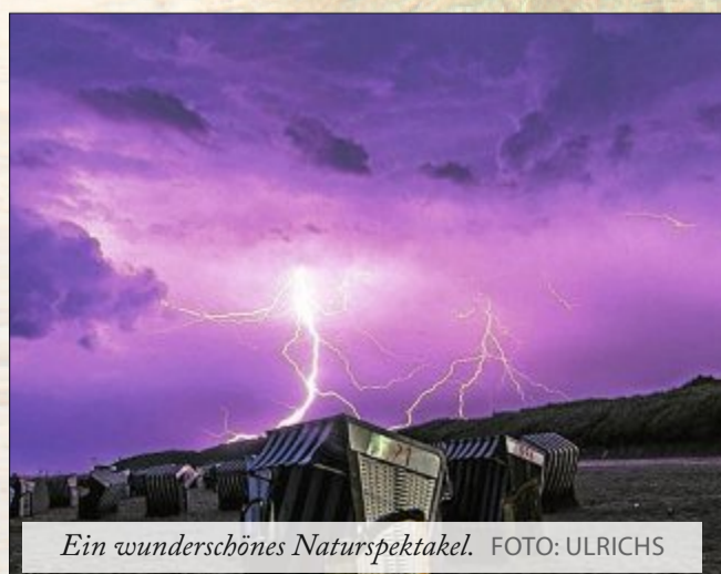
Ein wunderschönes Naturspektakel.