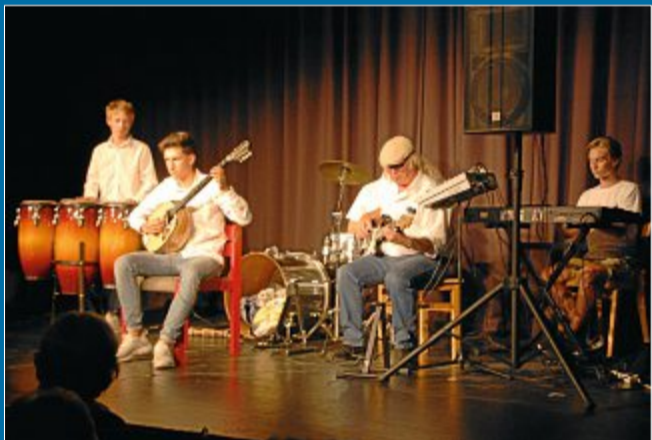
UNTERHALTUNG „Alexis Sorbas“ sorgt für hohe Besucherzahlen