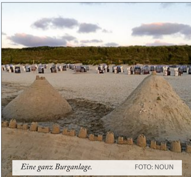
Eine ganz Burganlage.