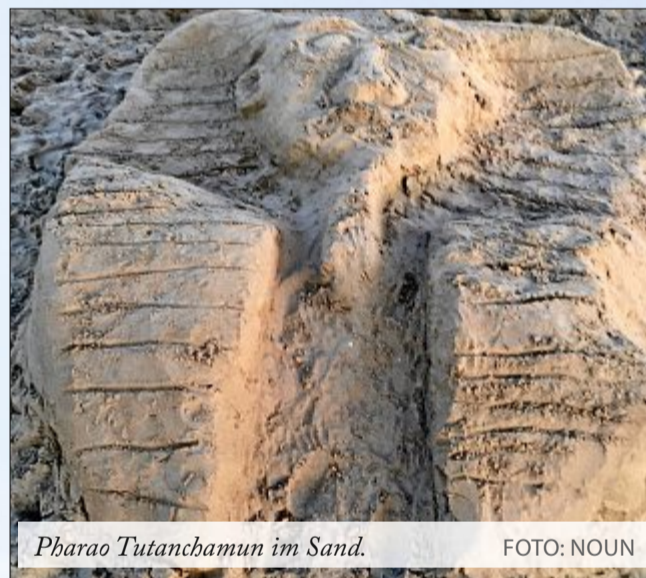
Pharao Tutanchamun im Sand.