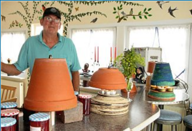
HOBBY Auf dem Tuunfjer Markt gibt es viel zu sehen

14.8. Kleine Mini-Heizungen und vieles mehr