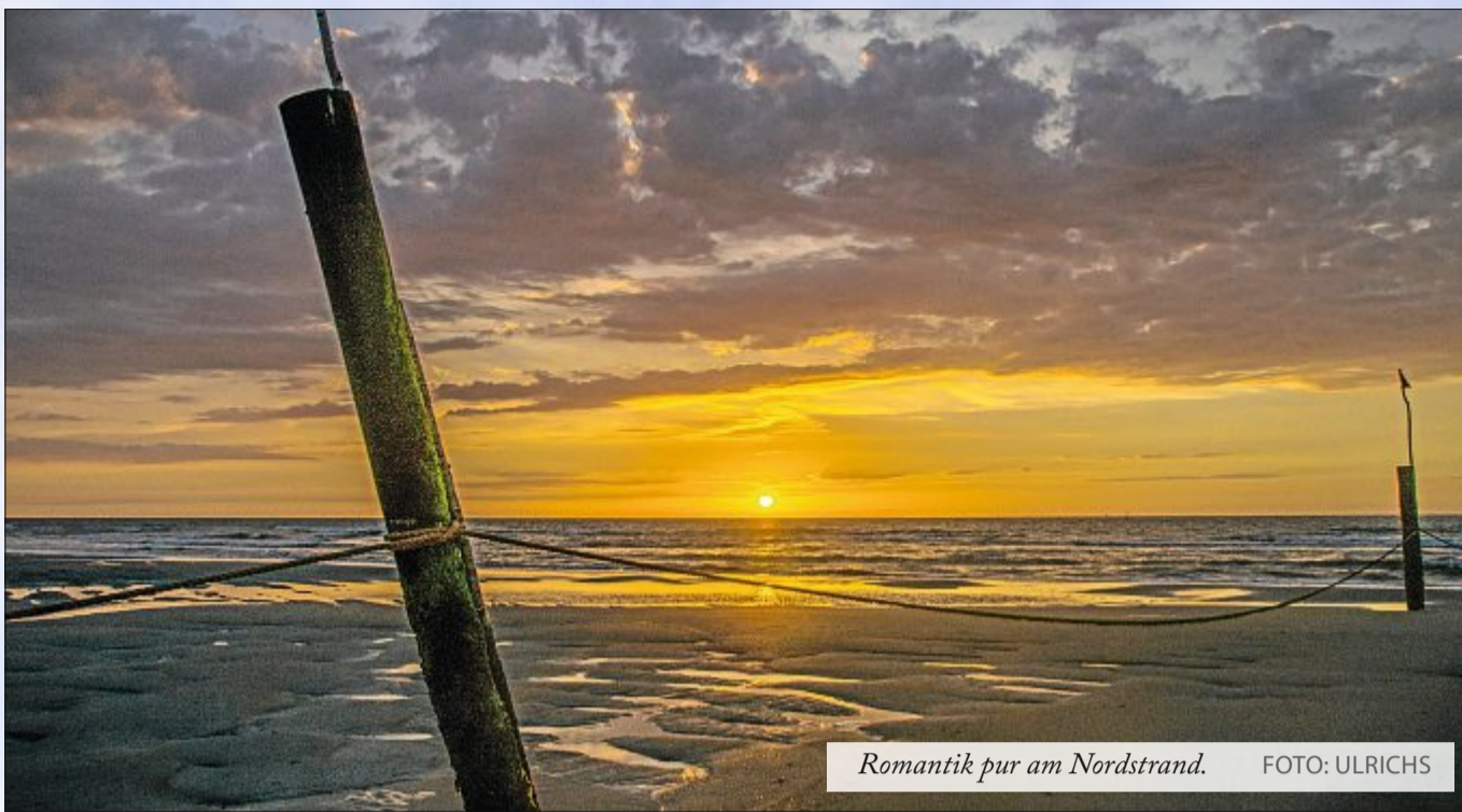
Romantik pur am Nordstrand.