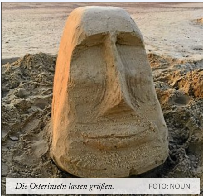
Die Osterinseln lassen grüßen.