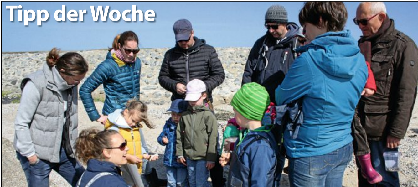
Umwelt: Das Team des Unesco-Weltnaturerbezentrum WattWelten bietet am Dienstag, 22. August, um 10 Uhr in „Strandstrolche“ die Möglichkeit für Kinder ab drei Jahren und ihre erwachsene Begleitung, am Strand am Zuckerpfad den tierischen Geheimnissen von Strand und Meer auf die Schliche zu kommen. ARCHIVFOTO