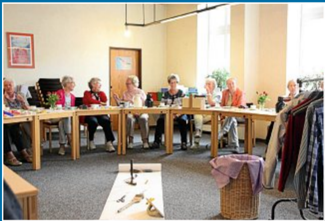
HISTORIE Das Erzählcafé weckt Erinnerungen