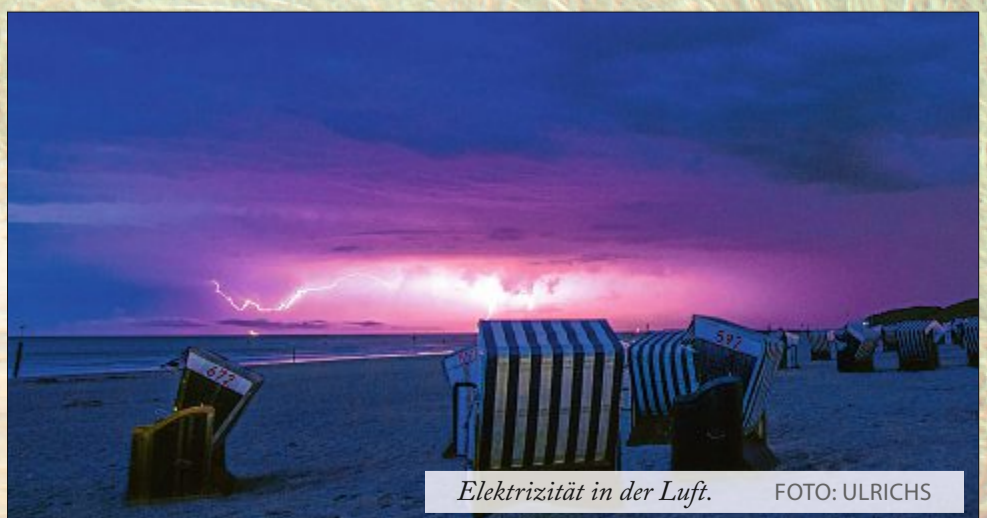
Elektrizität in der Luft.