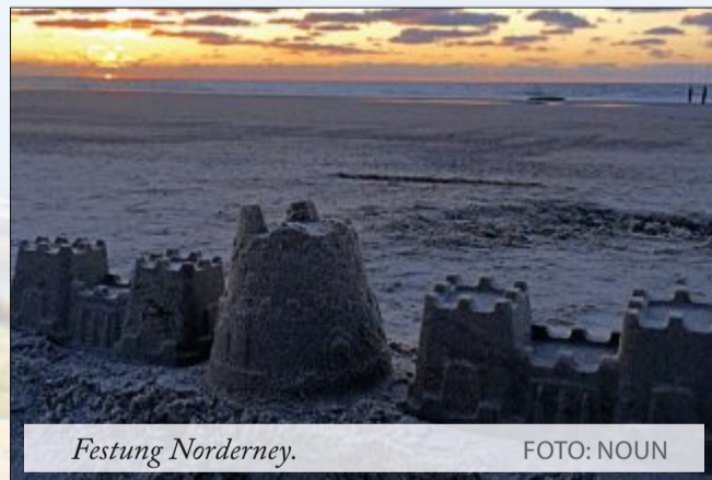
Festung Norderney.